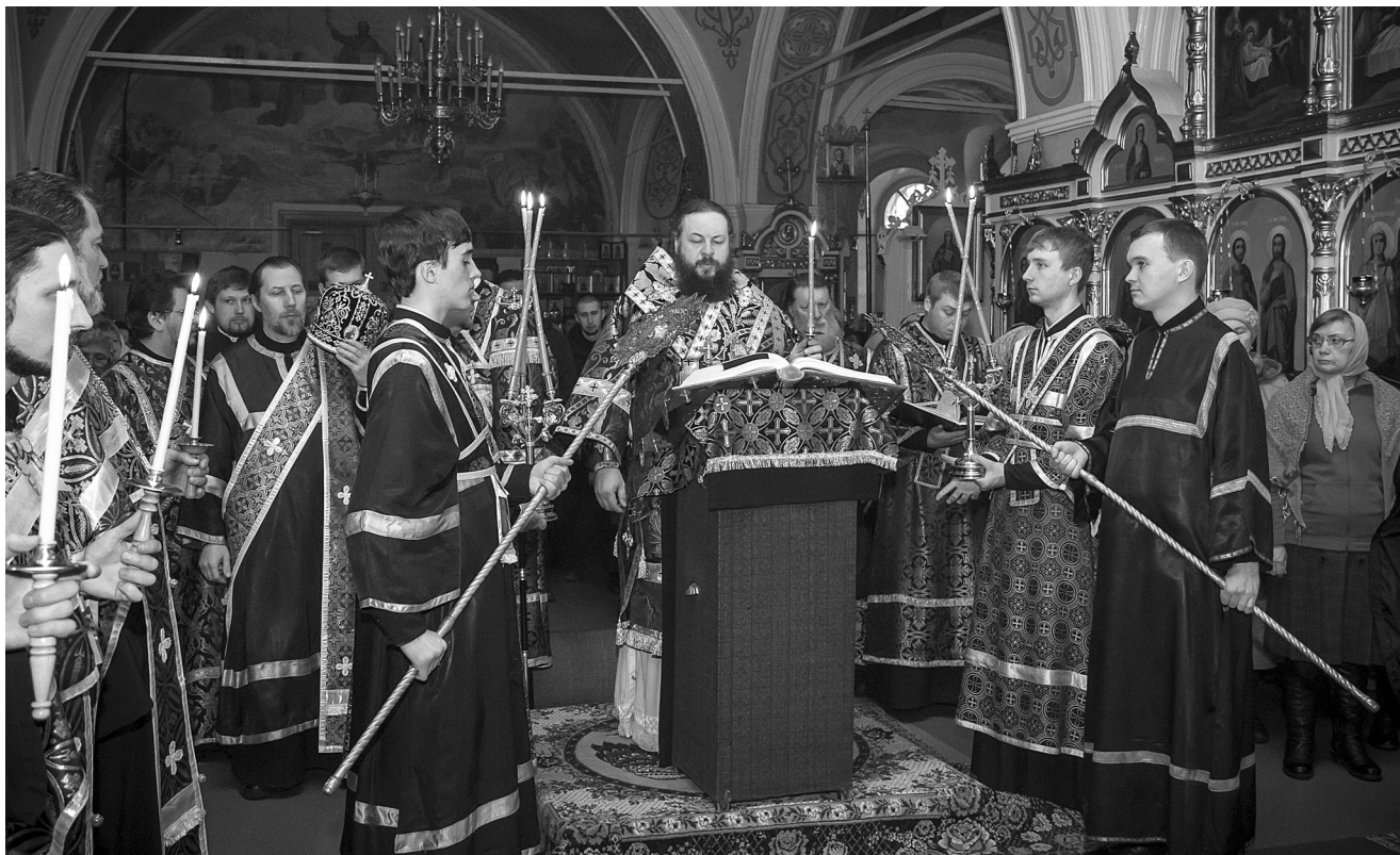
На фото: 16 марта митрополит Серафим совершил пассию в церкви Митрофана Воронежского г. Пензы.