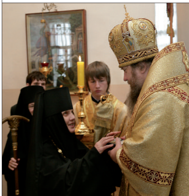
Епископ Пензенский и Кузнецкий Вениамин за Божественной литургией в Троице-Скановом монастыре. 5 марта 2011 года