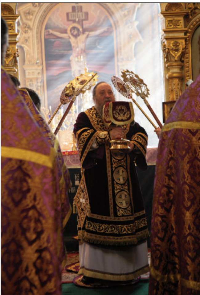
Божественная литургия в Успенском кафедральном соборе Пензы. 27 марта 2011 года

могут быть различные кружки по интересам, действующие в течение учебного года, – театральные, музыкальные, художественные, спортивные, а также совместный отдых в каникулярное время: походы, паломничество, короткие сборы и многодневные детские и молодёжные лагеря».