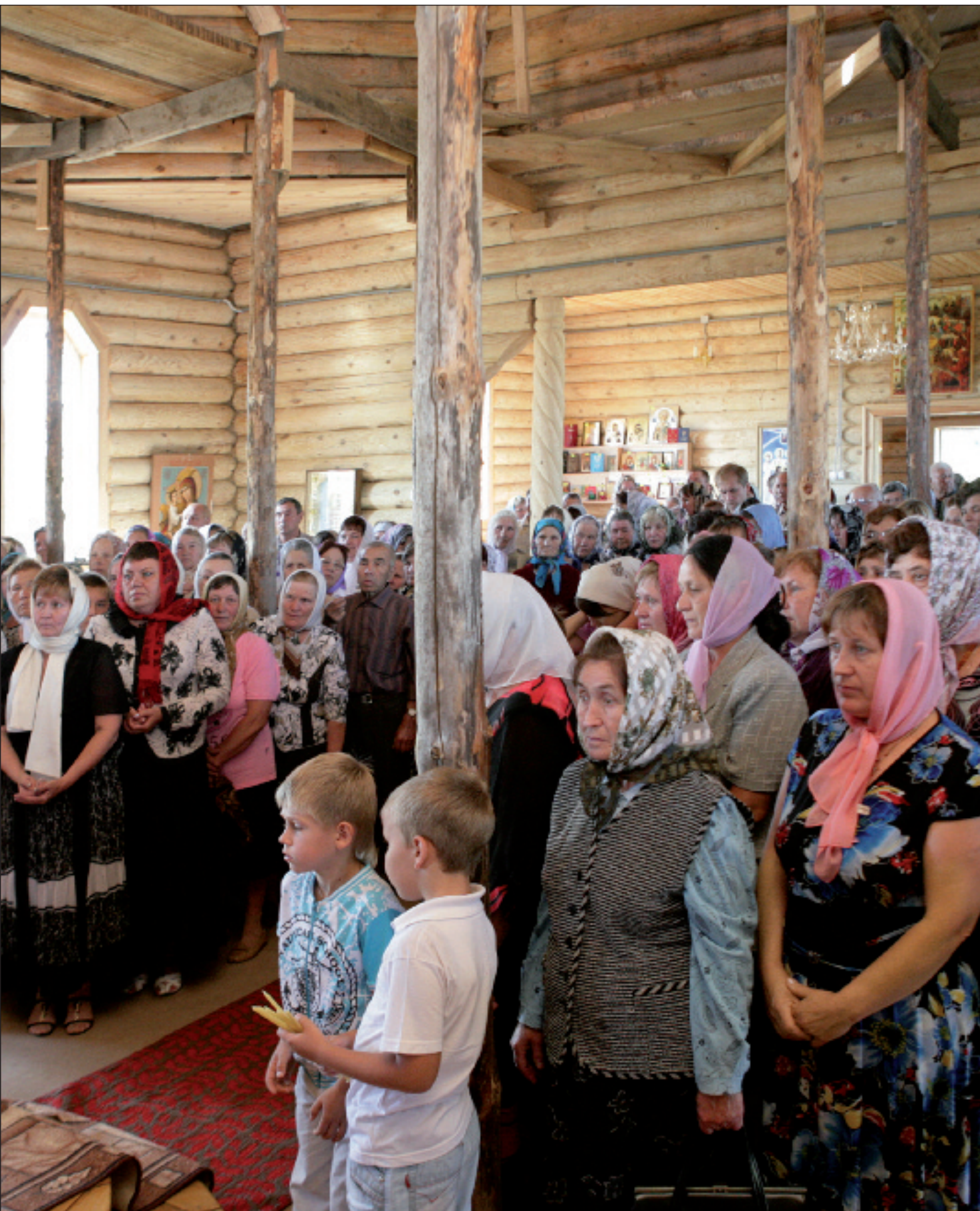
За Божественной литургией в новой освящённой церкви. 9 августа 2011 года