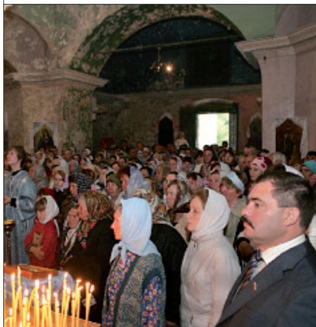
Троицкая церковь с. Ершово Белинского района Прихожане Троицкого храма за богослужением Чтимый образ Богородицы «Достойно есть»