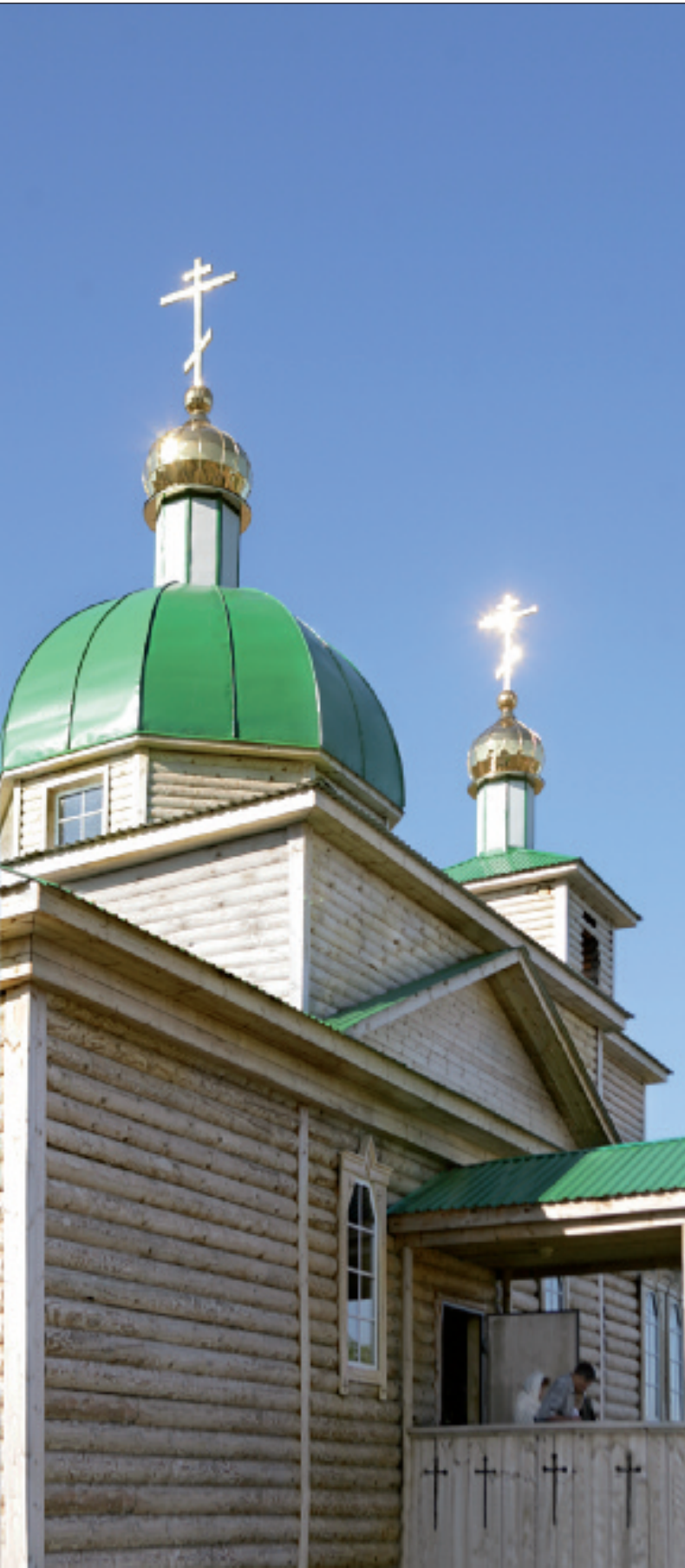
Церковь Архистратига Божия Михаила. Вид с северо-востока