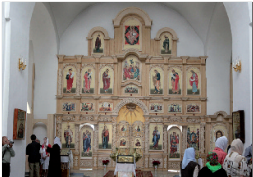
С. 10: Успенский собор. Город Нижний Ломов. 18 июня 2011 года Интерьер Успенского собора