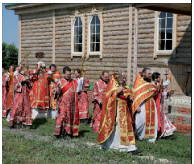
Освящение престола и крестный ход вокруг Михайло-Архангельской церкви