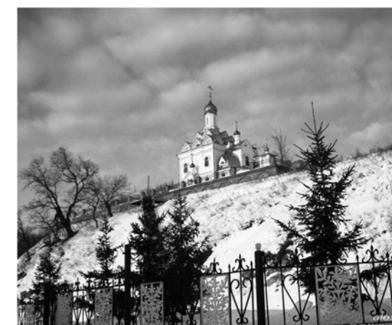
Богородице-Табынский монастырь, Красноусольский-курорт, Башкортостан

27 февраля. Липецкая область. Задонск: Рождество-Богородицкий монастырь, к мощам свт. Тихона Задонского.