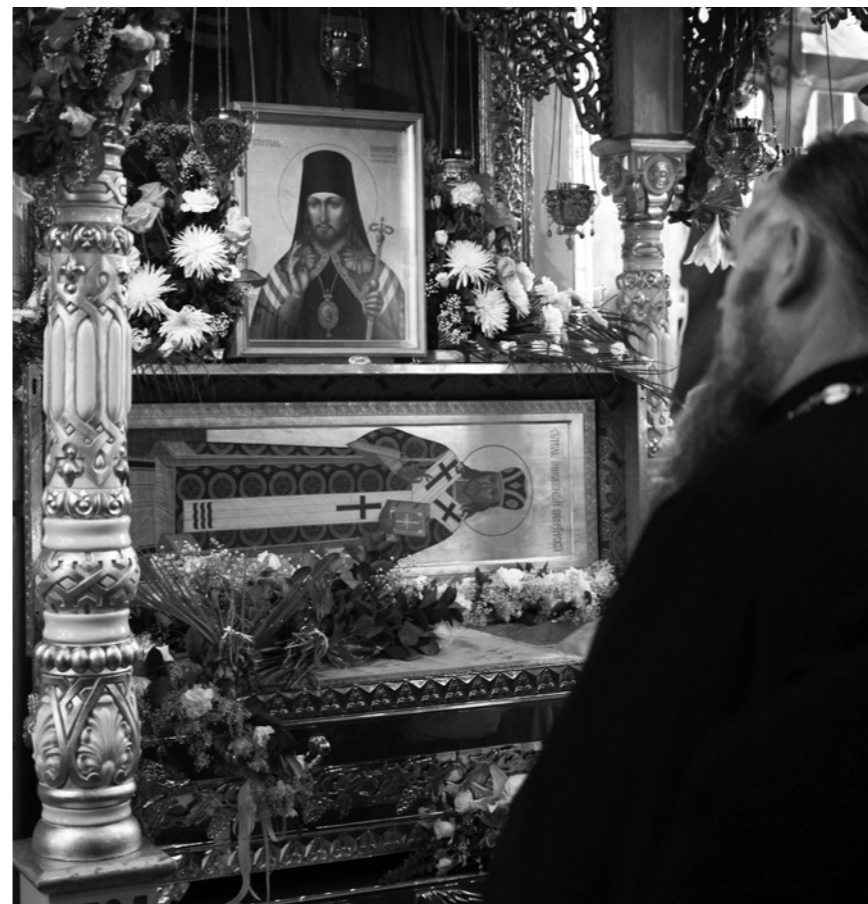
Рака с мощами святителя Иннокентия Пензенского

Вообще, мощи – понятие более широкое, чем просто телесные останки, это может быть и одежда, и личные вещи святого – всё, что так или иначе соприкасалось с угодником Божиим во время его земной жизни.