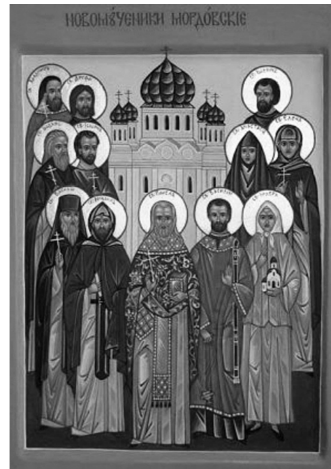
Св. Василий в соборе Новомучеников Мордовских