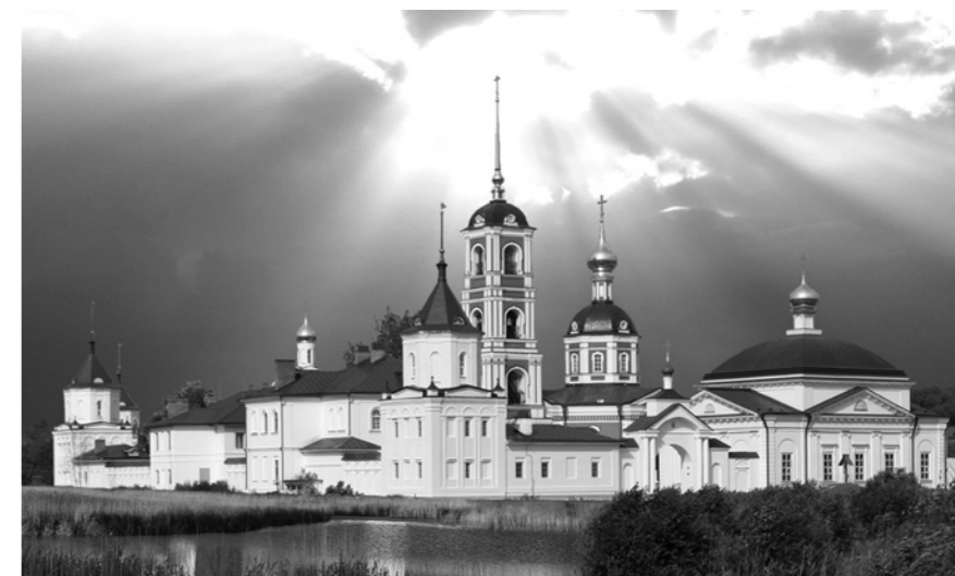
Троице-Сергиев Варницкий монастырь.

26 августа. Ярославская область. Годеново: Иоанно-Златоустовский храм, к Живоворящему Кресту Господню. Переславль-Залесский: Никитский