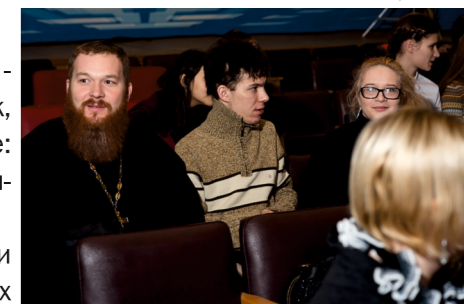
▲ Перенимаем опыт.

Встреча продолжалась в течение двух часов, но время пролетело незаметно; участники и слушатели четвертых Рождественских чтений покинули стены ГТРК «Пенза» с надеждой, что в следующем году встретятся вновь и продолжат обсуждение насущных проблем и событий церковной жизни, а также активное взаимодействие представителей Русской Православной Церкви и СМИ.