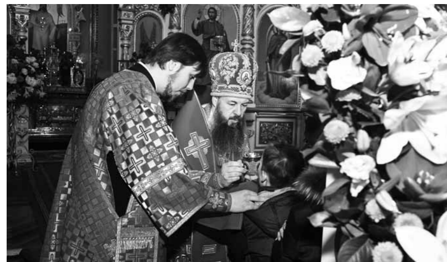
Причастие Святых Христовых Таин