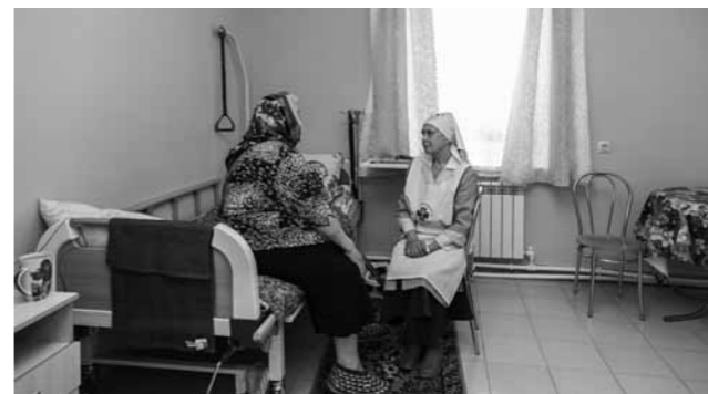
Сестры милосердия помогают и в богадельне при Троицком женском монастыре

Детский приют «Серафим», находящийся на территории Успенского кафедрального собора, также постоянно находится в поле зрения социального отдела епархии. Здесь временно содержатся дети и подростки, семьи которых оказались в кризисной ситуации. Юные обитатели приюта с пользой проводят время, общаются со сверстниками, играют, учатся, пробуют участвовать в хозяйственных делах – убирают посуду, протирают столы, вы-