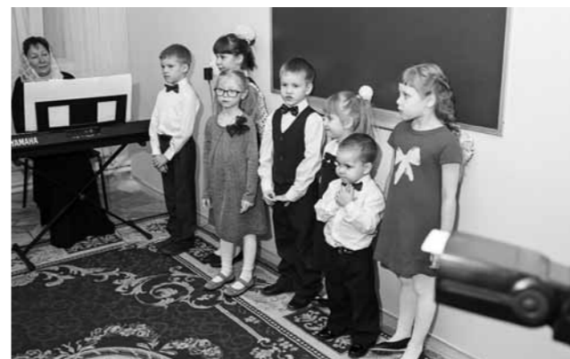
Музыкальные занятия в детском приюте «Серафим»

– Я пытаюсь дать этим людям надежду в завтрашнем дне, чтобы они не опустили руки до конца, пытаюсь донести до них, что Господь любит каждого из нас, какими бы мы ни были, что Он примет нас, если мы покаемся. Важно, чтобы у человека в душе поселилось доверие к Богу, чтобы он не потерялся в дальнейшем по жизни.