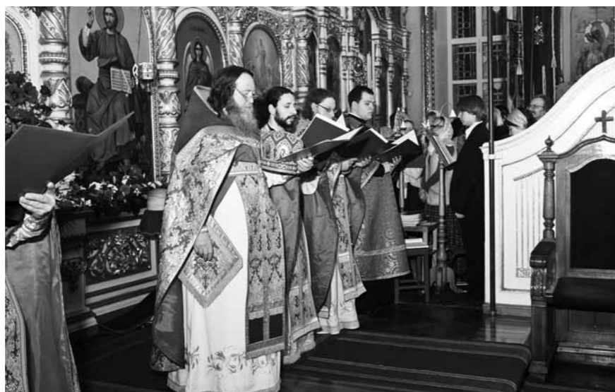
Чтение Евангелия на разных языках

Одна из его особенностей – чтение пролога Евангелия от Иоанна на разных языках. Священнослужители по очереди произносили «В начале было Слово...» на греческом, латыни, украинском, иврите, английском, испанском, татарском,