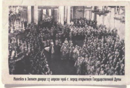
Николай в Зимнем дворце 27 апреля 1906 г. перед открытием Государственной Думы

ОСУЩЕСТВИЛ РЕФОРМУ ГОСУДАРСТВЕННО-ПОЛИТИЧЕСКОГО СТРОЯ РОССИИ, ЗАЛОЖИЛ ОСНОВЫ ПРАВОВОГО ГОСУДАРСТВА, ВВЕЛ ГОСУДАРСТВЕННУЮ ДУМУ В СИСТЕМУ ЦЕНТРАЛЬНЫХ ГОСУДАРСТВЕННЫХ УЧРЕЖДЕНИЙ. В ГОДЫ ЕГО ПРАВЛЕНИЯ ГОСУДАРСТВЕННЫЙ СОВЕТ ИЗ ЗАКОНОСОВЕЩАТЕЛЬНОГО СТАЛ ЗАКОНОДАТЕЛЬНЫМ, БЫЛА ОСУЩЕСТВЛЕНА РЕФОРМА СЕНАТА, МИНИСТЕРСТВА ЮСТИЦИИ, СОЗДАНА ПЕРЕДОВАЯ ДЛЯ СВОЕГО ВРЕМЕНИ СУДЕБНАЯ СИСТЕМА. ФАБРИЧНОЕ ЗАКОНОДАТЕЛЬСТВО РОССИЙСКОЙ ИМПЕРИИ ПРИЗНАВАЛОСЬ ЛУЧШИМ В МИРЕ.