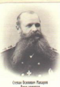
Степан Осипович Макаров Вице-адмирал Океанограф и полярный исследователь