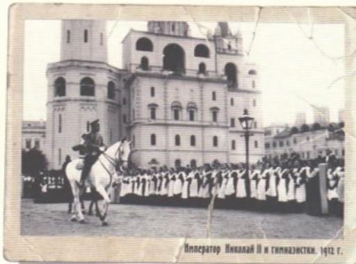
Император Николай II и гимназистки. 1912 г.

ОСУЩЕСТВИЛ МАСШТАБНУЮ И ВЫДАЮЩУЮСЯ РЕФОРМУ НАРОДНОГО ОБРАЗОВАНИЯ. ГОСУДАРЬ ТАК ФОРМУЛИРОВАЛ СУТЬ СВОИХ ТРЕБОВАНИЙ К ПРАВИТЕЛЬСТВУ: «ЧТОБЫ В ШКОЛЕ С ОБРАЗОВАНИЕМ ЮНОШЕСТВА СОЕДИНИЛОСЬ ВОСПИТАНИЕ ЕГО В ДУХЕ ВЕРЫ, ПРЕДАННОСТИ ПРЕСТОЛУ И ОТЕЧЕСТВУ И УВАЖЕНИЯ К СЕМЬЕ, А ТАКЖЕ ЗАБОТА О ТОМ, ЧТОБЫ С УМСТВЕННЫМ И ФИЗИЧЕСКИМ РАЗВИТИЕМ МОЛОДЕЖИ ПРИУЧАТЬ ЕЕ С РАНЫХ ЛЕТ К ПОРЯДКУ И ДИСЦИПЛИНЕ».