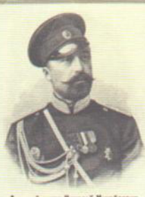
Великий князь Николай Павлович Председатель РГО

Своим рождением обязан Императору Николаю II, который в 1897 году принял решение о строительстве первого в мире ледокола арктического класса «Ермак» (1899). Позже были построены ледоколы «Байкал» (1899), «Ангара» (1900), «Таймир» и «Вайгач» (1909), «Святогор» (1916). Почти все они прослужили в СССР до 1960-х годов. «Святогор» («Красин») – до 1989 г.