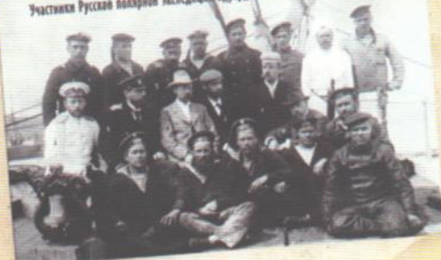
Участники Русской полярной экспедиции Зауродой Толля 1900 года на ледяной «Заре»

первое сквозное плавание из Владивостока в Архангельск.