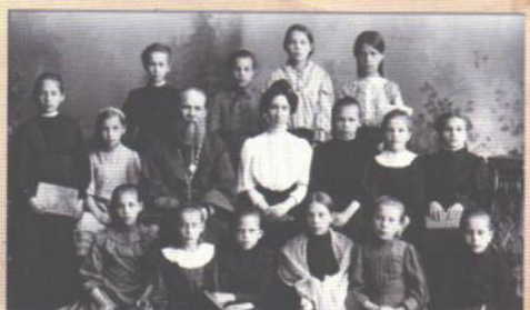
2-е Красносельские женские начальные училище. 1911 г.

В годы правления Николая II в России было открыто 33 учительских института, 122 учительские семинарии, 147 педагогических курсов, готовивших 20 000 будущих педагогов для народных школ.