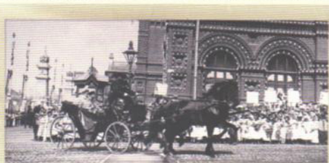
Ученики школ и гимназий приветствуют Императора Николая II и Императрицу Александру Федоровну. 1896 г.

ЖЕНСКОЕ ОБРАЗОВАНИЕ в 1914 году 873 ГИМНАЗИИ 92 ПРОГИМНАЗИИ 31 ИНСТИТУТ БЛАГОРОДНЫХ ДЕВЩ 51 ЕПАРХИАЛЬНОЕ УЧИЛИЩЕ 49 ВУЗОВ