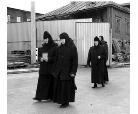
Насельницы Троицкого монастыря проходят «свою» Канавку

Вдоль тропы, где ступали Ее святые стопы, вырыли Канавку. Преподобный Серафим говорил, что Канавка эта до небес высока и всегда будет стеной и защитой от антихриста: «Кто Канавку эту с молитвой пройдет да полтараста «Богородиц» прочтет, тому всё тут: и Афон, и Иерусалим, и Киев».