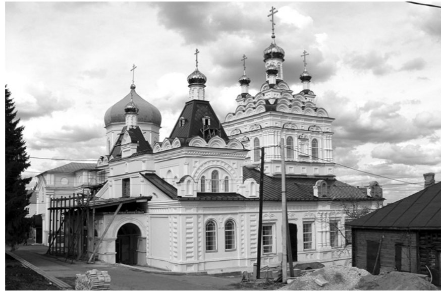
В восстановленном храме Святой Троицы скоро начнутся богослужения

Ниже здания бывшей церкви — на территории бывшей монастырской усадьбы — было не лучше: разбитая, переполненная помойка, туалет, мостки через какое-то гряз-