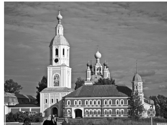
Рождество-Богородичный Санаксарский мужской монастырь