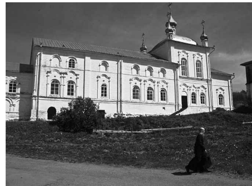
Пензенская область. Вадинск. Керенский Тихвинский монастырь

20 августа. Пензенская область. Сердобск: Михаило-Архангельский кафедральный собор. Сердоб-