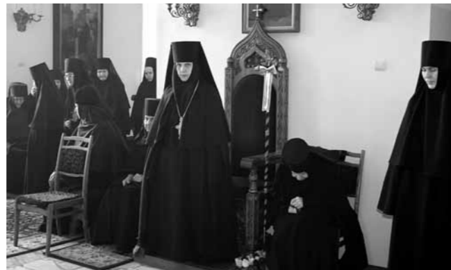
Игумения с насельницами Троице-Сканова монастыря

Насельницы рассказали, что живут, в основном, своими трудами. Несут послушания в трапезной, в профорне, в швейной, в ризнице, на скотном дворе. Уже тогда в монастыре было большое хозяйство: послушни-