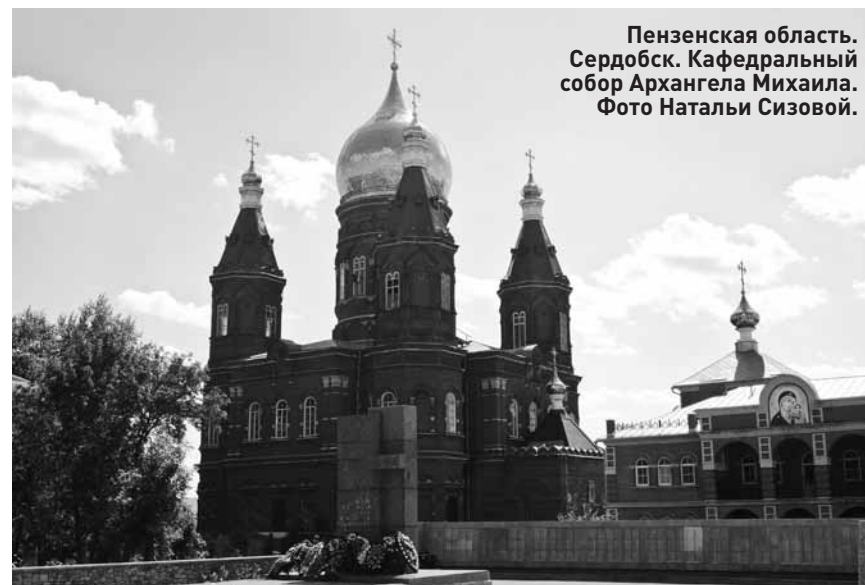
Пензенская область. Сердобск. Кафедральный собор Архангела Михаила.