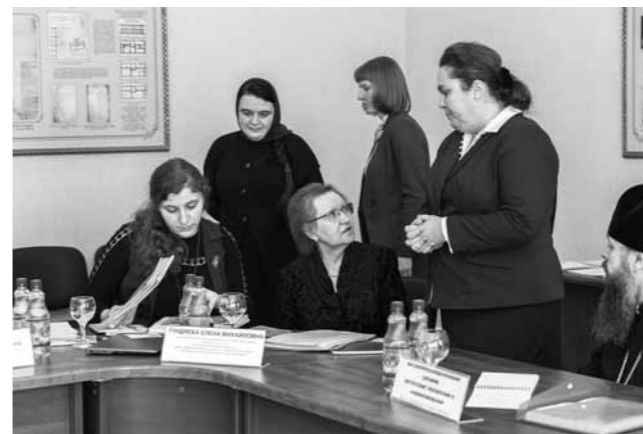
Рабочий момент совещания

подготовки служителей Русской Православной Церкви, специальность «Регент церковного хора, преподаватель», разработанный Учебным комитетом Русской Православной Церкви на основе опыта регентского отделения Санкт-Петербургской духовной академии. С 2017 года апробация стандарта началась на базе Пензенской, Екатеринбургской, Кузбасской и Самарской духовных семинарий. Состоявшийся в пензенской ду-