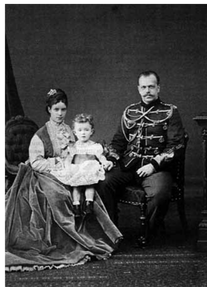
С отцом императором Александром III и матерью императрицей Марией Федоровной

В книге «Страницы моей жизни» А.А. Вырубова писала: «...Люди, предубежденные против него, и те при первом взгляде Государя чувствовали присутствие Царя и бывали сразу им очарованы. Я помню прием в Ливадии земских деятелей Таврической губернии, когда два типа до прихо-