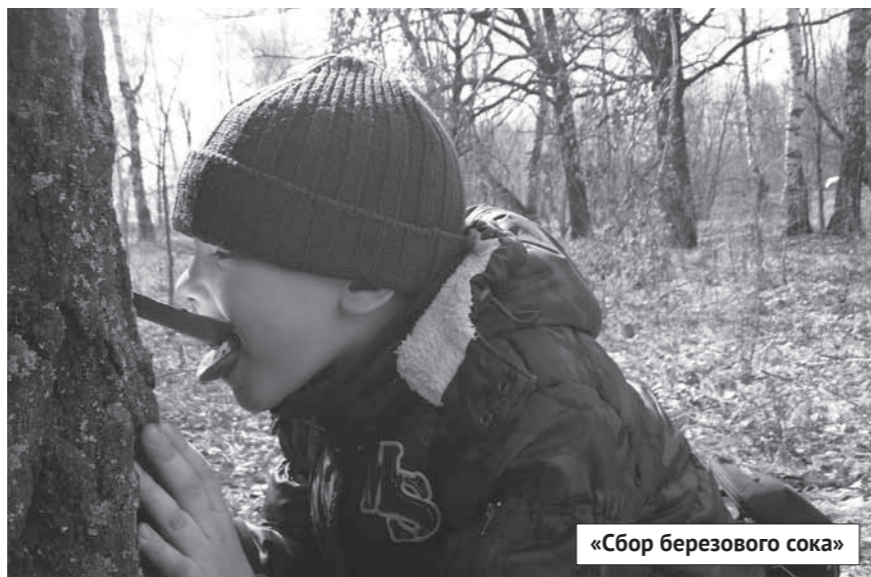
«Сбор березового сока»