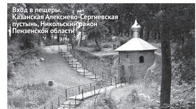
Вход в пещеры. Казанская Алексиево-Сергиевская пустынь, Никольский район Пензенской области

Адрес: г. Пенза, Советская площадь, 1 Тел.: 8-927-375-3165, 8-927-375-6061, 25-31-65, 25-60-61