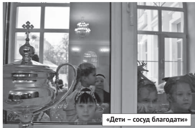
«Дети – сосуд благодати»

Лариса ТУЗАЕВА