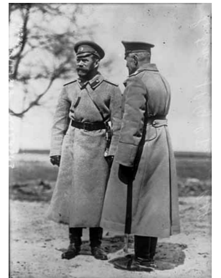
С генералом Брусиловым