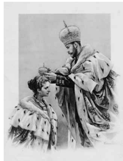
Коронация императрицы Александры Федоровны, супруги Николая