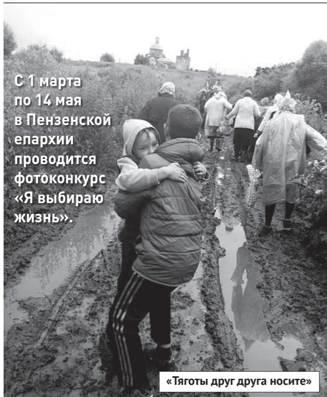
С 1 марта по 14 мая в Пензенской епархии проводится фотоконкурс «Я выбираю жизнь».