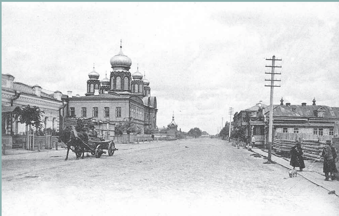
Вид на Богоявленскую церковь; справа от нее видна часовня в память пребывания в Пензе наследника цесаревича Николая Александровича. Фото 1910-х гг.

Печатается по публикации: Пензенский временник любителей старины. 2000. Вып. 9.