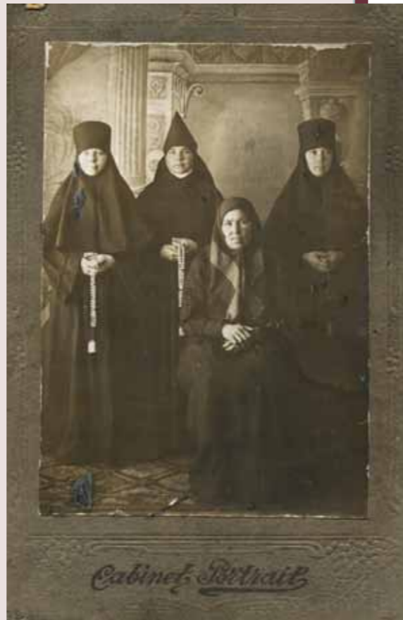
Монахини Керенского женского монастыря

Вследствие изложенного и пользуясь правом, предоставленным ст. 17 означенного декрета, Совет монастыря покорнейше просит Всероссийский Центральный Исполнительный Комитет во имя человеческой справедливости отменить постановление Керенского Уисполкома и вернуть монастырю вышеозначенное отобранное имущество и двух лошадей, и дать нам беззащитным людям возможность жить под кровом нашего монастыря и личным трудом добывать себе пропитание, ибо мы все дети трудового народа. В Рос[сийской] Соц[иалистической] Фед[еративной] Респ[ублике] существует свобода совести, и каждый гражданин ее может верить и молиться так, как он желает, и гонению за это не подвергается,