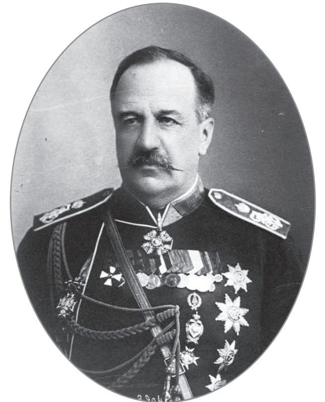
Граф Илларион Воронцов-Дашков

В заключение представленных здесь материалов о пребывании наследника цесаревича в Пензенский губ. в 1891 г. не лишним будет привести полный текст всеподданнейшего рапорта пензенского губернатора, тем более что документ этот интересен, бесспорно,