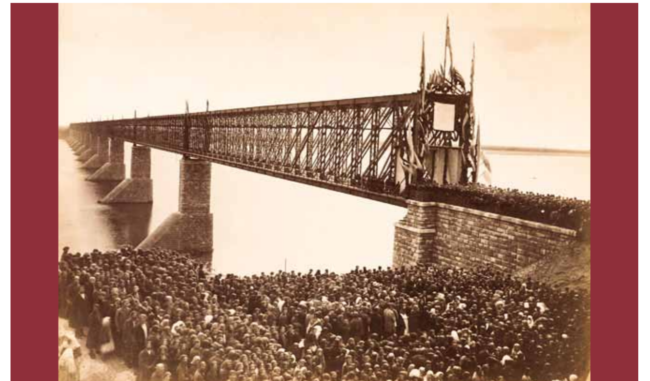
Сызранский Александровский мост

«По своей длине (до 1,5 верст) он занимает первое место на европейском континенте и шестое в мире. <...>. Проект этого сооружения принадлежит проф. Белелюбскому <...>. Металлические части поставлены из железа бельгийских заводов и отчасти Брянского. Вся каменная кладка в опорах моста, за исключением облицовки ледорезов и подферменных камней, которые сделаны из Выборгского гранита, выведены из местного жигулевского известняка. Постройка