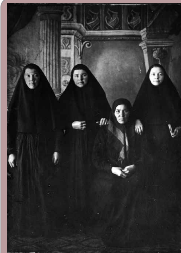
Монахини Керенского женского монастыря

Далее тов. Шуваев указывает, что в монастыре найдено [нрзб] «спрятанной мануфактуры». Да мануфактура эта не [нрзб] и была спрятана в обыкновенный сундук, который [нрзб] 200 арш[ин] разной мануфактуры, принадлежащей 500 сестрам. Из этого видно, что на каждую из нас приходилось далеко не много.