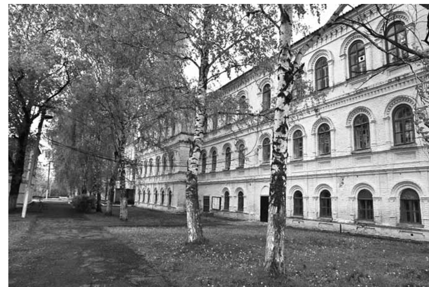
Бывший Казанский монастырь (сегодня Мокшанский многопрофильный колледж для инвалидов)