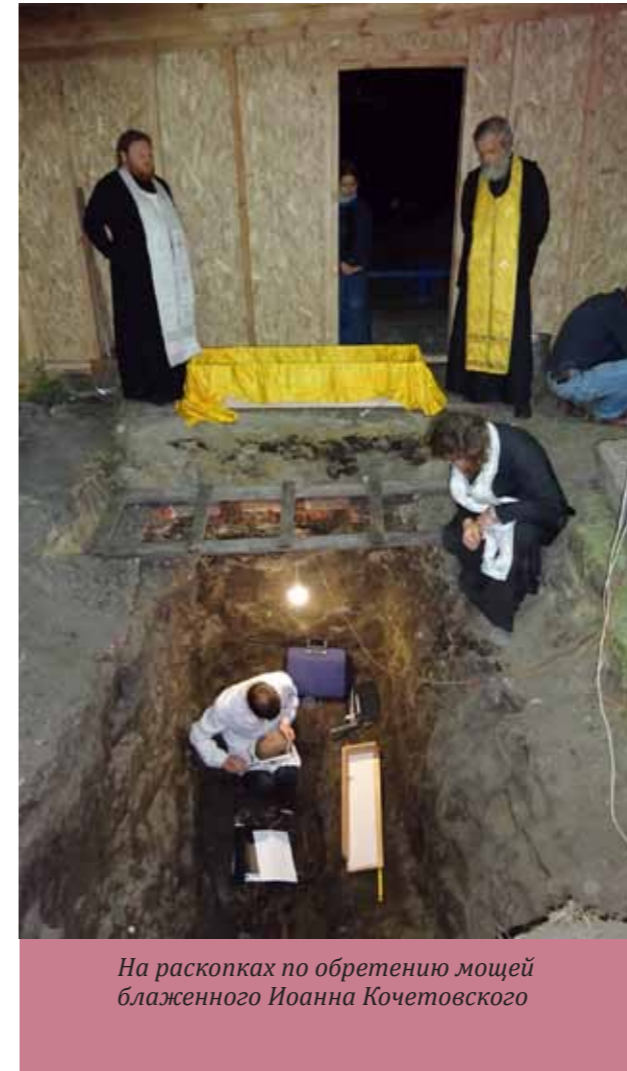
На раскопках по обретению мощей блаженного Иоанна Кочетовского

Но вместе с тем, действительно, возникла проблема – прославили много святых, о которых народ Божий, члены Церкви, практически ничего не знают. И почитания, даже когда человека прославили в лике святых, практически нет. И, наверное, Господь дал остановку этому. Это явно совершенно произошло по попущению Божию – то, что у нас в России изменилось законодательство и сейчас очень трудно получить доступ к архивно-следственным делам, которые нужно изучить, чтобы прославить кого-то в лике святых. Как бы естественным образом произошла такая остановка этого массового процесса – увы, по внешним причинам, но, наверное, эта остановка была необходима Церкви, потому что нам надо было осознать значение подвига новомучеников и, может быть, помолвившись, осознав это, искать и какие-то другие пути осознания святости новомучеников, а не только на основании изучения архивно-следственных дел.