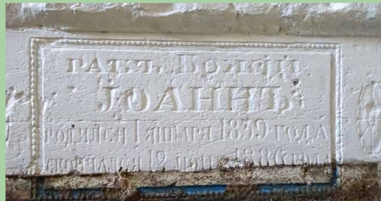
Надгробный камень блаженного. Фрагмент