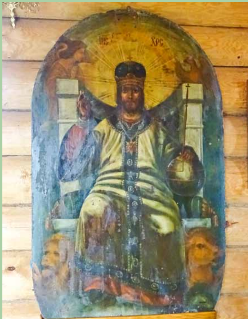
Икона Господа Вседержителя из старой кочетовской церкви