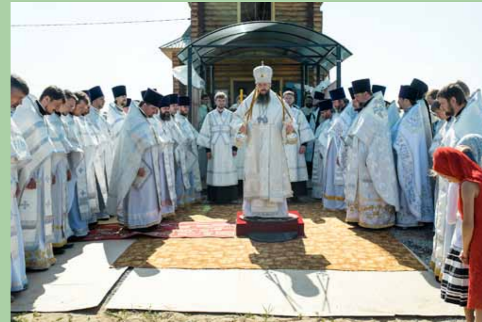
Литургия в Кочетовке в день памяти Иоанна Кочетовского. 25 июня 2018 года