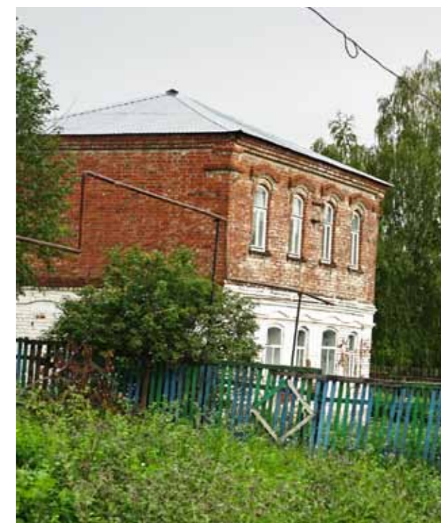
Купеческий дом в Кочетовке. Рубеж XIX-XX веков

Кроме родного села Кочетовки, блаженный посещал соседнее село Головинщину, где в базарные дни ходил по домам для сбора подая-