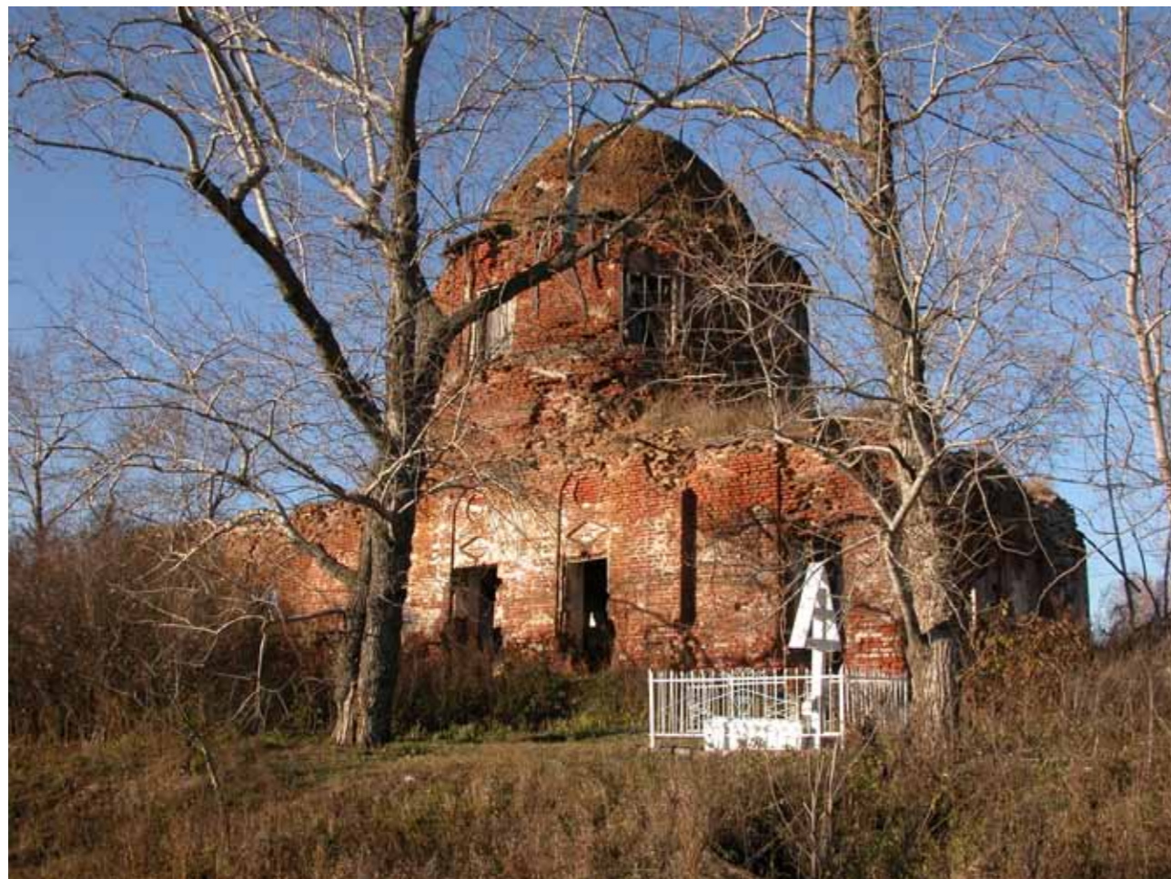
Могилы Иоанна Кочетовского у полуразрушенного Михайло-Архангельского храма в Кочетовке