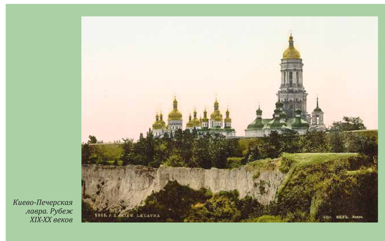
Киево-Печерская лавра. Рубеж XIX-XX веков