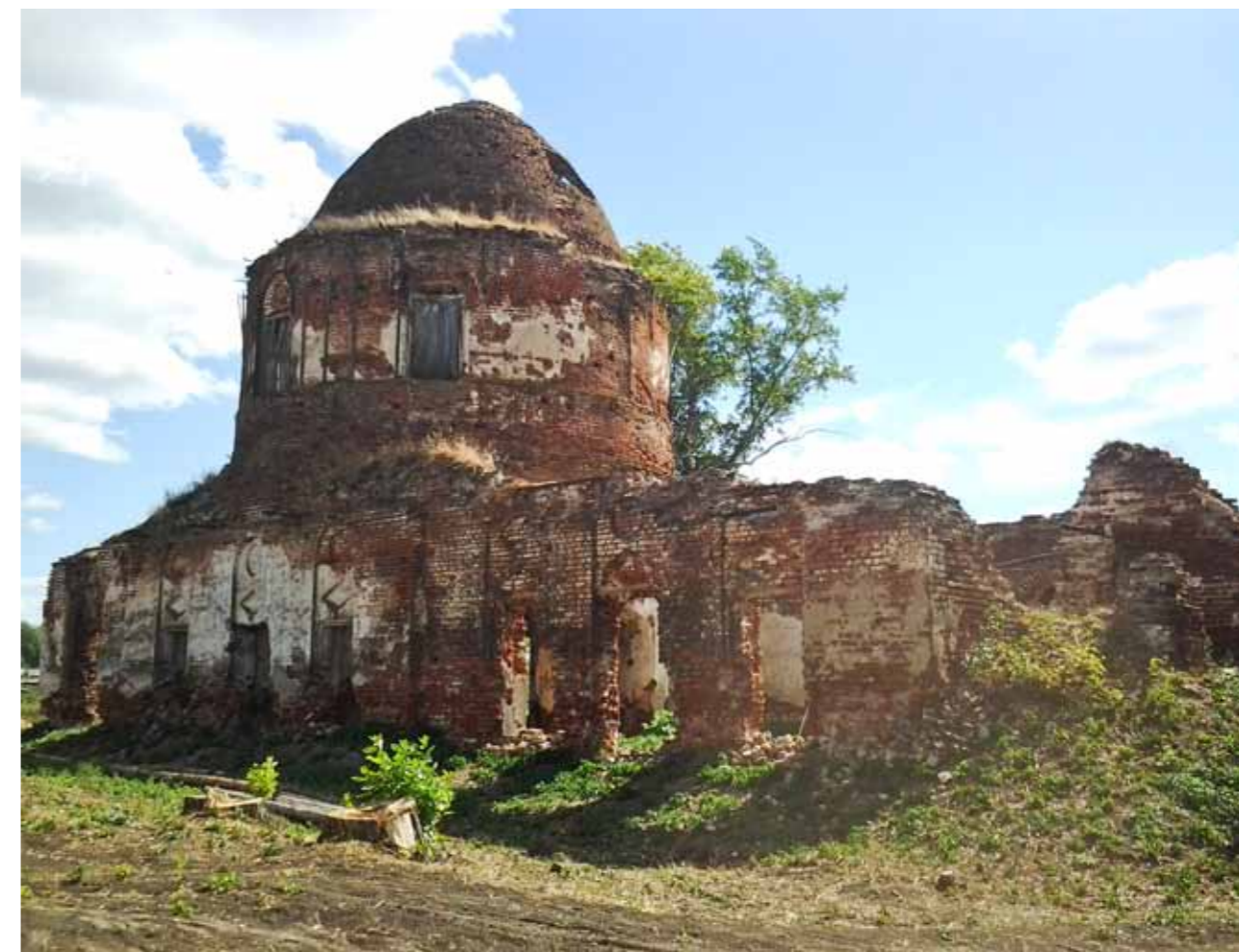
Руины Михайло-Архангельского храма в Кочетовке, построенного в 1807 году

От одного из монахов лавры Иоанн получил благословение на предстоящий подвиг юрод-