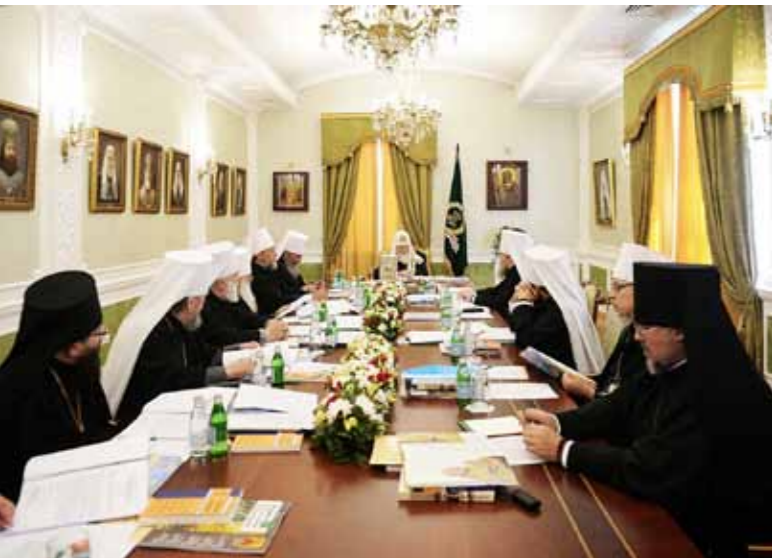
Заседание Священного Синода Русской Православной Церкви, на котором было принято решение о прославлении блаженного Иоанна Кочетовского. Екатеринбург, 14 июля 2018 года

14 июля 2018 года Священный Синод Русской Православной Церкви, заседание которого прошло в Екатеринбурге под председательством Святейшего Патриарха Московского и всея Руси Кирилла, постановил: