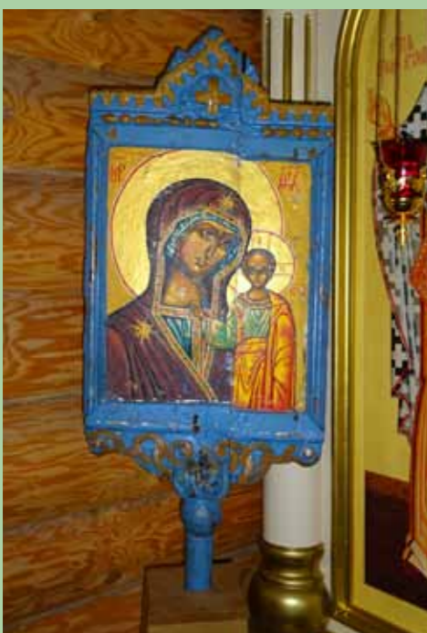
Выносные Казанская икона Божией Матери и Распятие, с которыми до революции в Кочетовке ходили с крестными ходами