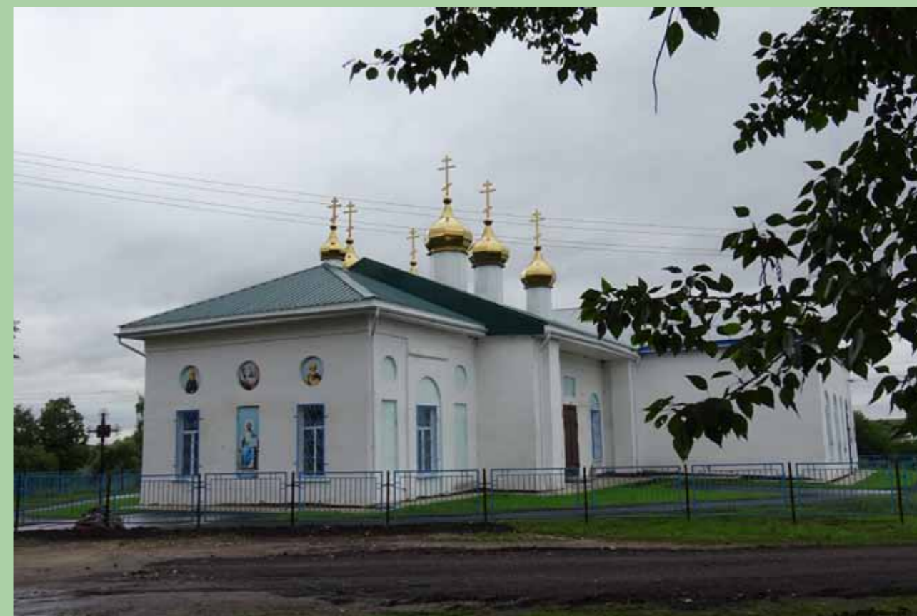
Сергиевский храм в Головинщине в наши дни