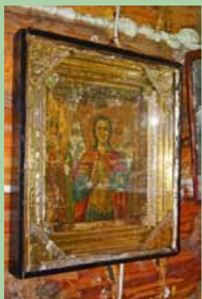
Икона Михаила Архангела, сохраненная благочестивыми кочетовцами