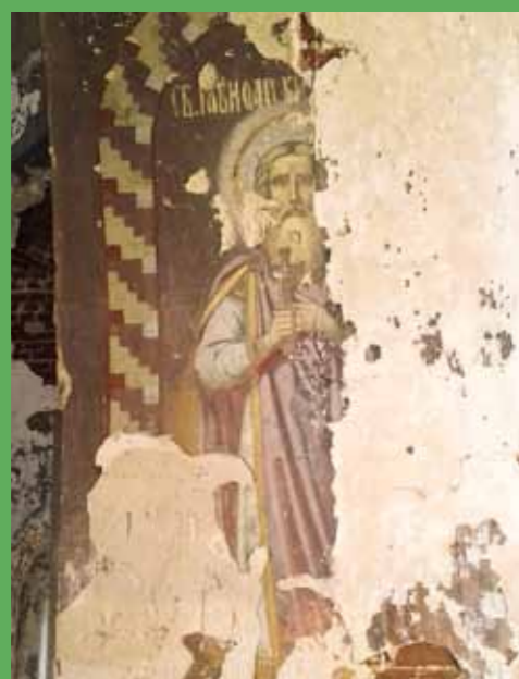
Остатки росписей в кочетовском храме: равноапостольные князья Владимир и Ольга, благоверный князь Борис

ний. И все, что ему подавали добрые люди, он раздавал другим. Так, после пожара, случившегося в Кочетовке 12 августа 1874 года, Иоанн собрал в Головинщине более 70 рублей и перед праздником Успения Пресвятой Богородицы все раздал погорельцам. На эти деньги было куплено столько обуви и одежды, что практически каждый из 109 сгоревших дворов получил помощь юродивого.