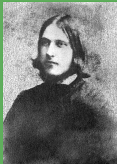
Священноисповедник Иоанн Оленевский в юности

Впоследствии на могилу была положена надгробная плита с выбитыми буквами: «Раб Божий Иоанн». Она сохранилась до наших дней. Почитание Иоанна Кочетовского как человека святой жизни никогда не пре-