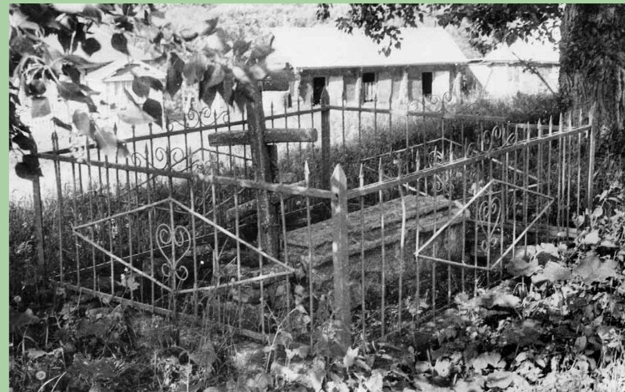
Могилы Иоанна Кочетовского. 80-е гг. XX в.