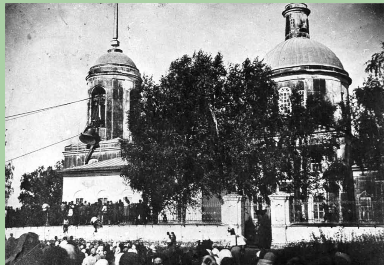
Подъем колокола на колокольню Сергиевского храма в Головинщине. 5 сентября 1927 года

При входе в святой храм Иоанн оставлял свое юродство за порогом. В благочестии блаженный был образцом для своих односельчан. Он часто ходил в храм, по праздникам и всем воскресеньям молился в алтаре, пел на клиросе – у него был прекрасный голос. Любил подавать просфоры на проскомидию. Нередко на своем иносказательном языке обличал рассеянно молящихся в храме и тем побуждал их молиться благоговейно. При пении Херувимской песни он или уходил в придельный храм, или бил себя по щекам, или падал ниц, крестообразно сложив руки под головой. Блаженный часто приобщался Святых Христовых Таин, исповедуясь на своеобразном языке, который мог понимать его духовный отец: отец