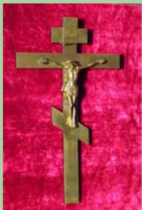
Напрестольный крест из старой кочетовской церкви