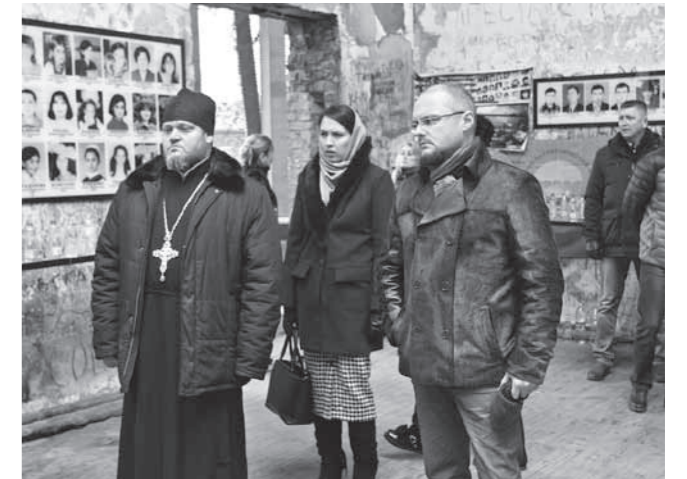
Представители пензенской делегации в бывшей школе №1 г. Беслана, ставшей теперь мемориальным комплексом

А дело как раз в безрелигиозности или поверхностном ознакомлении с религиозной доктриной. Когда человек принимает религию формально, не вникая вглубь, он становится фанатиком. То есть, зная лишь одну форму религиозности, он отрицает другие формы, не обращая внимания на ценность. А ценность может понять только человек, осознанно относящийся к своей вере, к своей религиозной доктрине. Зная ценность своей религии, он увидит ту же ценность в другой доктрине. Фанатики на это не способны.