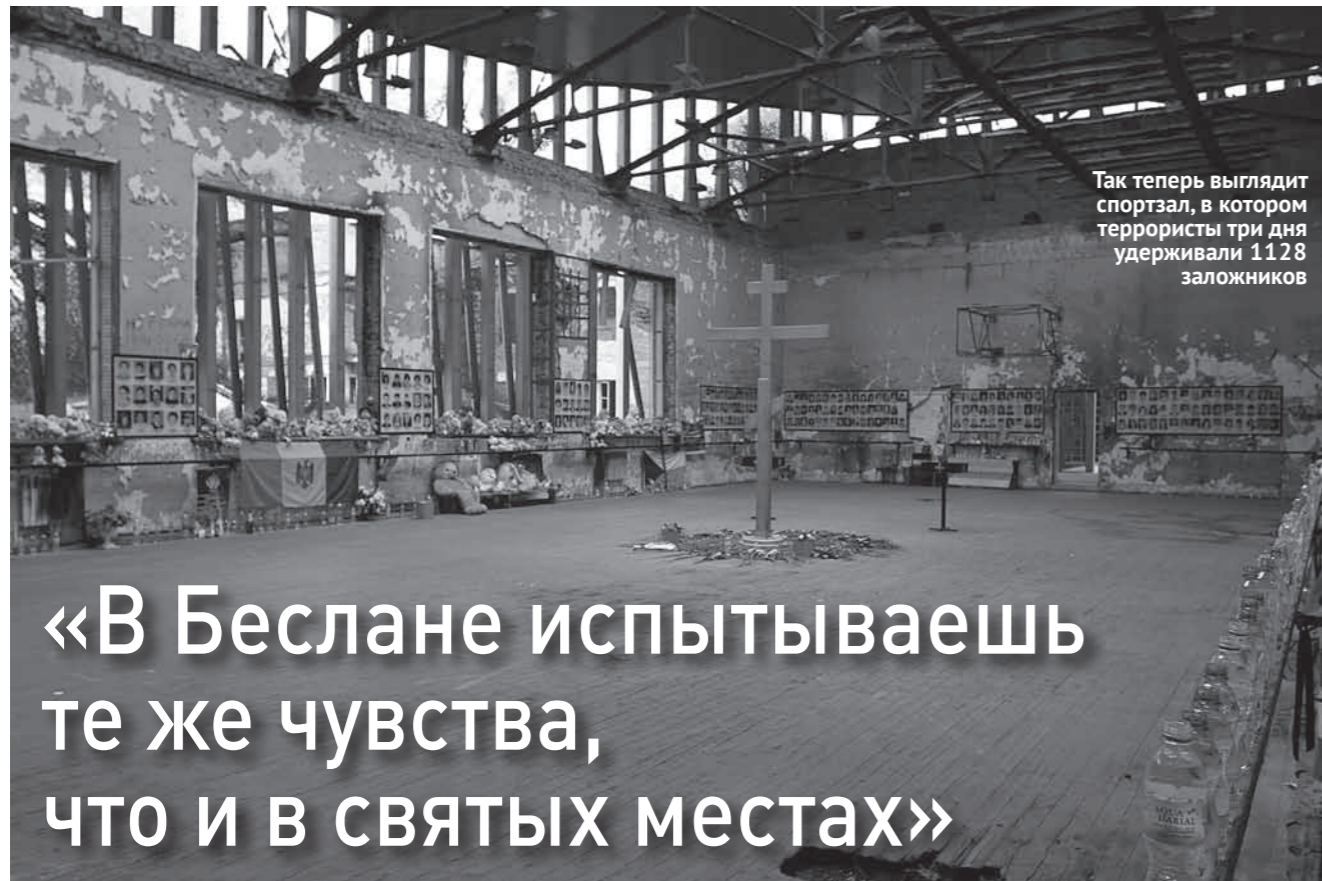
Так теперь выглядит спортзал, в котором террористы три дня удерживали 1128 заложников