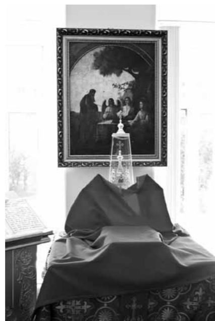
Та самая икона «Явление трех странников Аврааму у Мамврийского дуба»

Но в любом случае все сложилось благополучно. Я уверен, что это событие – выстраданное, вымоленное – важно не только для епархии, но и для всей Пензы. Новый храм станет средоточием духовной жизни в этой части города (напомним, Богоявленский храм находится рядом с Привокзальной площадью – Авт.).