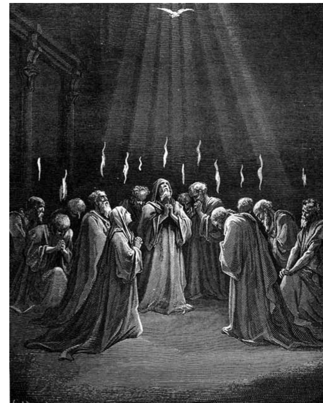
Гостав Доре «Сошествие Святого Духа»

шинство современных исследователей склоняется к тому, что Петр прибыл в Рим уже в 60-е гг. I века.) Призванный позднее других апостол Павел стал проповедовать учение о Воскресении среди язычников. Им были созданы многочисленные христианские общины на территории Малой Азии, Балканского полуострова и Италии. Апостол Филипп, так же, как и первоверховные апостолы Петр и Павел, подкрепляя проповедь чудесами, прошел Сирию, Малую Азию, Лидию, Мисию. А апостол Фома основал христианские Церкви в Палестине, Месопотамии, Парфии, Эфиопии и Индии.