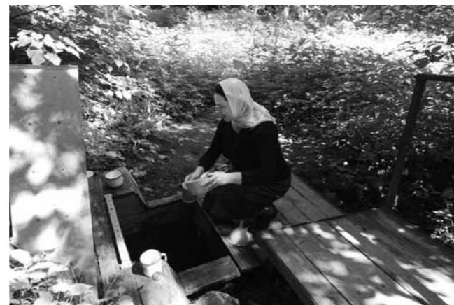
Вода в родниках и целебная, и просто вкусная

Фактически два с половиной года батюшка жил здесь отшельником. Днем, правда, сюда приезжали люди – паломники, строители, работники церковной лавки. А вот ночью все стихало – и ни единой человеческой души на несколько километров вокруг.