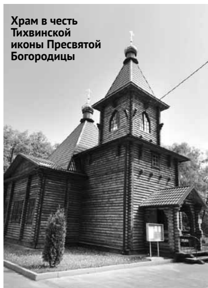
Храм в честь Тихвинской иконы Пресвятой Богородицы