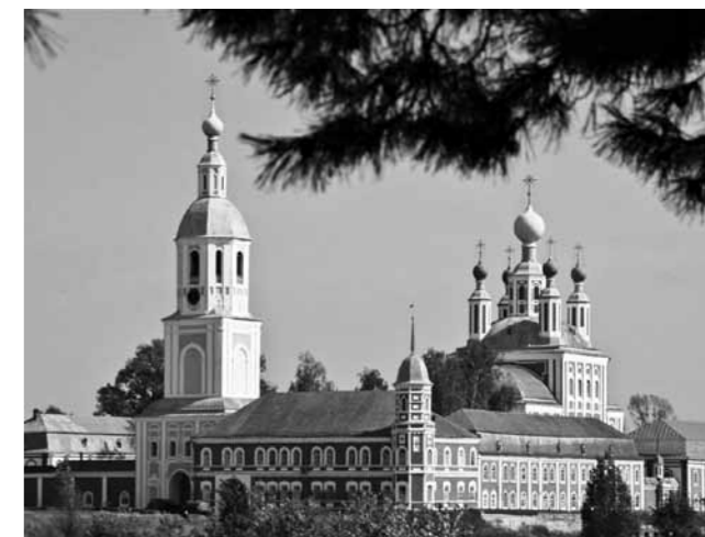
Рождество-Богородичный Санаксарский монастырь, Темников, Мордовия

19 декабря 1806 года легендарный адмирал подал императору Александру I прошение об отставке: Отойдя от служебных дел, некоторое время он жил в Санкт-Петербурге, а в 1810 году переехал в деревню Алексеевка