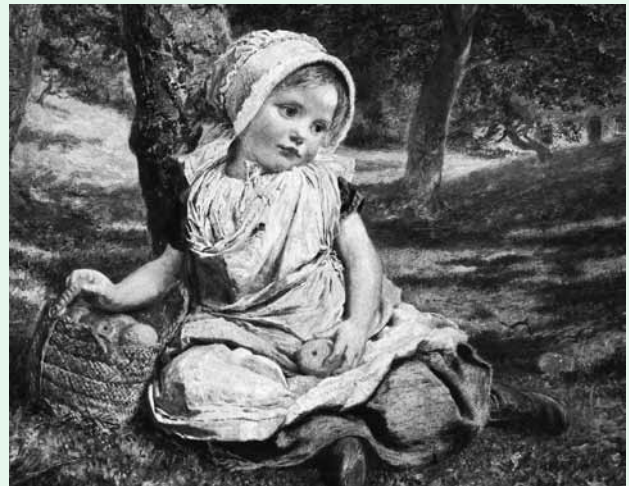
Софи Жанжамбр Андерсон «Девочка с яблоками»

В тот момент на пороге бедняцкой избы появилось дитя маленькое, только-только ходить научилось. Бедняк, на ребенка указывая, и говорит: