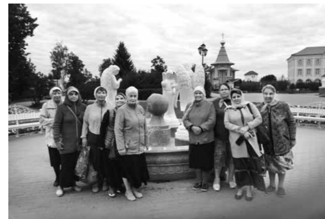
Прихожане пензенского храма в честь Владимирской иконы Божией Матери в Троицком Серафимо-Дивеевском монастыре (Нижегородская область)

Евгений БЕЛОХВОСТИКОВ, фото с сайта Пензенской епархии.