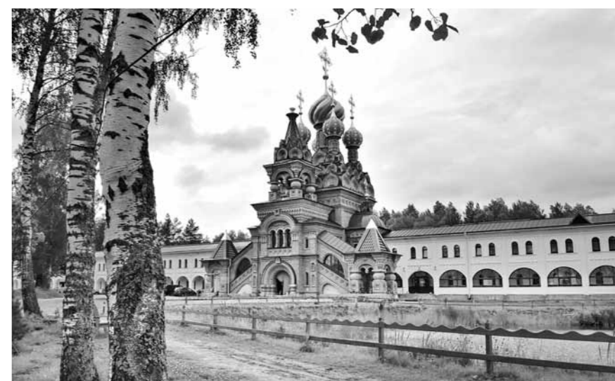
Храм свт. Спиридона Тримифунтского в Николо-Сольбинском монастыре. Сольба. Ярославская область.

18 августа. Пензенская область. Нижнеломовский район. Норовка: Казанско-Богородицкий монастырь. Святой источник. Нижний Ломов: Успенский монастырь. Вадинск: Тихвинский Керенский монастырь, к чудотворной Тихвинской иконе Божией Матери.