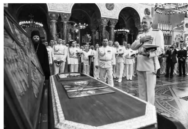
У мощей св. Феодора Ушакова, принесенных в Кронштадтский Морской Никольский собор (2017 г.)

В 1799 году за победу при Корфу император Павел I произвел Федора Ушакова в полные адмиралы.