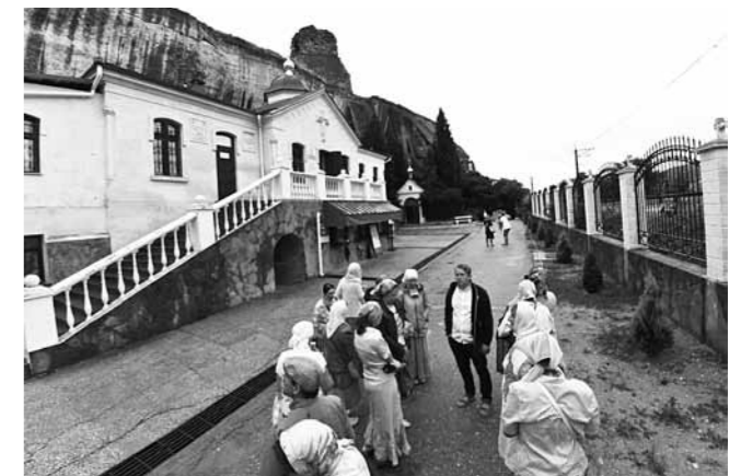
Пензенские паломники в Инкерманском Климентовском пещерном монастыре (Крым)