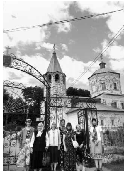
Паломничество в храм Рождества Христова. Нижнее Аблязово, Кузнецкий район Пензенской области

– Примерно 50 на 50. Спрос на паломничество по России всегда высок, и, если набирается полноценная группа, мы организуем выезд и за пределы региона.