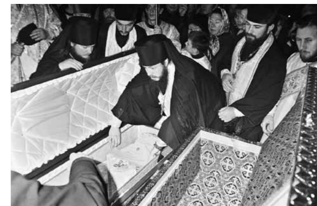
Перенос мощей святителя из гроба в раку. В центре – иеромонах Серафим (Домнин), будущий митрополит Пензенский и Нижнеомовский

зался его свидетелем. Мне кажется, все верующие пензенцы переживали тогда духовный подъем, ведь у них появился свой небесный заступник перед Господом.