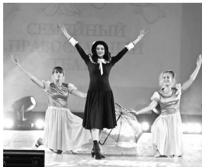
Выход Мэри Поппинс