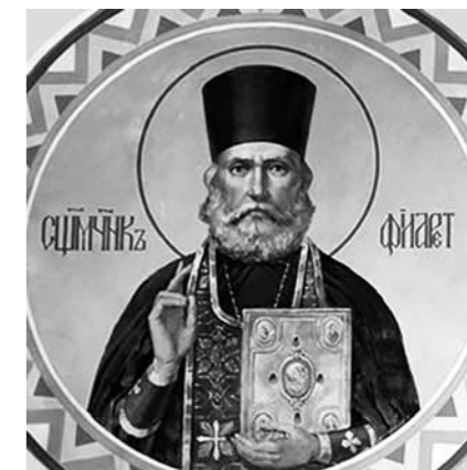
Угодник Божий священномученик Филарет

«Сегодня в среду 23-го (10 октября 1918 г. – Авт.) я переведен за решетку, это признак того, что меня готовят к расстрелу. Но меня одно успокаивает, что я не виноват ни в одном предъявленном мне обвинении. Усердно прошу всех молиться обо мне. Сообщите матери при случае о моей смерти... Прошу Ваших молитв. Бог наказывает меня за мои грехи. Иду спокойно. Молитесь и не забывай-