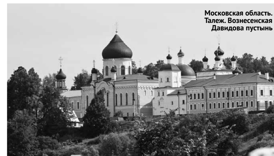
Московская область. Талез. Вознесенская Давидова пустынь

19 – 20 октября. Республика Мордовия. Темников: Рождество-Богородичный Санаксарский монастырь: к мощам св. прп. Феодора, прав.