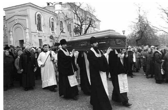
Крестный ход с мощами святителя Иннокентия Пензенского 22 октября 2000 года