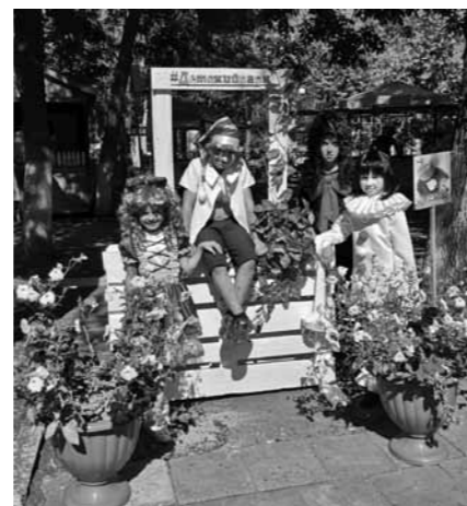
Артисты театра в образах героев сказки «Буратино» на фестивале «Экопарк»

С творчеством юных артистов семейного православного театра города Пензы я познакомилась нынешним летом на фестивале уличного и камерного искусства «Мечты Ассоль». Они блеснули уже во время праздничного шествия по городу Спутник, когда ступали во главе процессии: от их ярких, красочных костюмов невозможно было оторвать глаз. «Ой, вон лиса Алиса!... А это Красная Шапочка... Смотрите, Мэри Поппинс!» – восхищенно восклицали прохожие. А какое замечательное шоу театр устроил на церемонии открытия фестиваля! Феерическое представление с участием любимейших сказочных героев смотрелось на одном дыхании: прекрасная режиссура, грамотно подобранное музыкальное сопровождение, великолепные хореография и, собственно, актерская игра. По сути, в тот июньский день семейный православный театр на фестивале «Мечты Ассоль» сам стал открытием для жителей города. На днях я побывала на репетиции творческого коллектива, который готовил новую программу к открытию очередного театрального сезона.