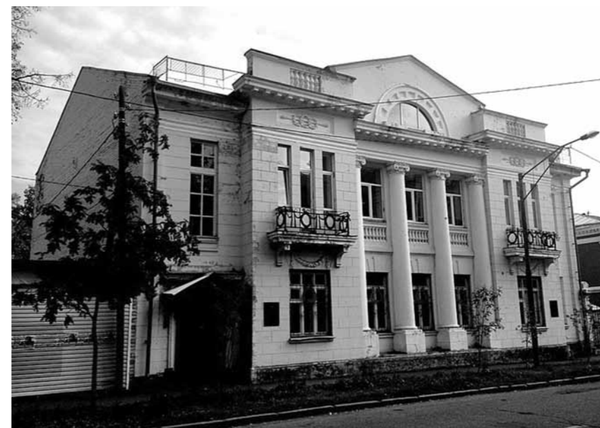
Тот самый дом Набокова в Казани, где священномученик провел свои последние дни