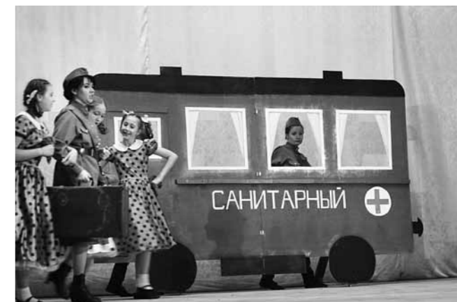
Отрывок из спектакля «Огонь войны души не сжег»

– Мне нравится театр, больше всего я люблю танец и пантомиму.