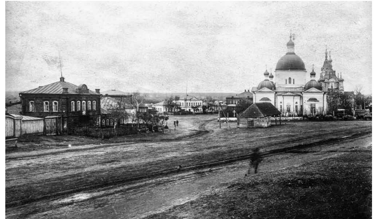
Поим. Начало XX в.