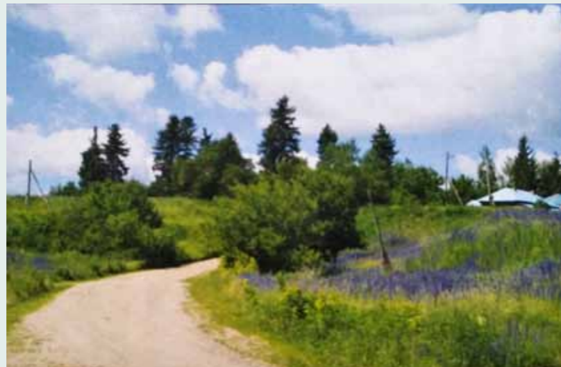
Место храма в Сентяпино. Фото А.И. Дворжанского 2012 г.