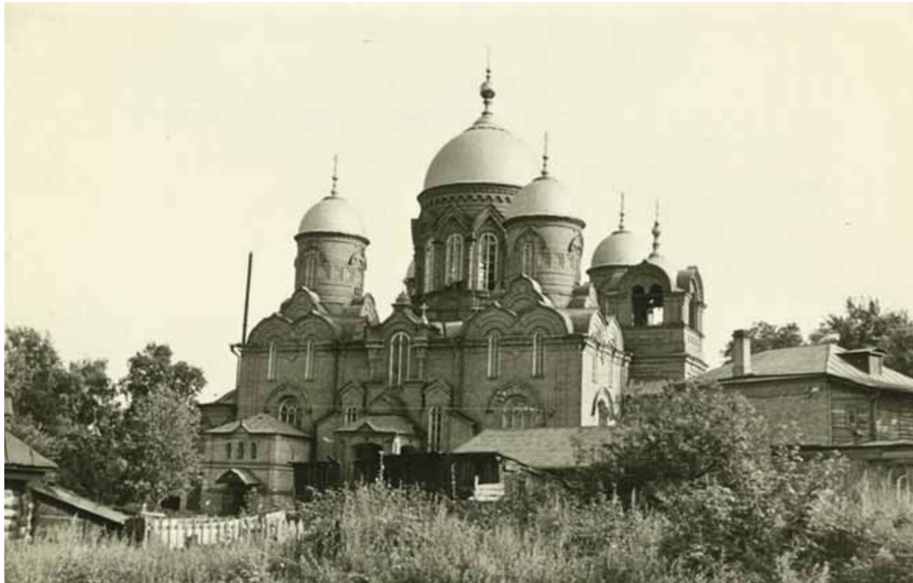
Успенский кафедральный собор в Пензе. 80-е гг.