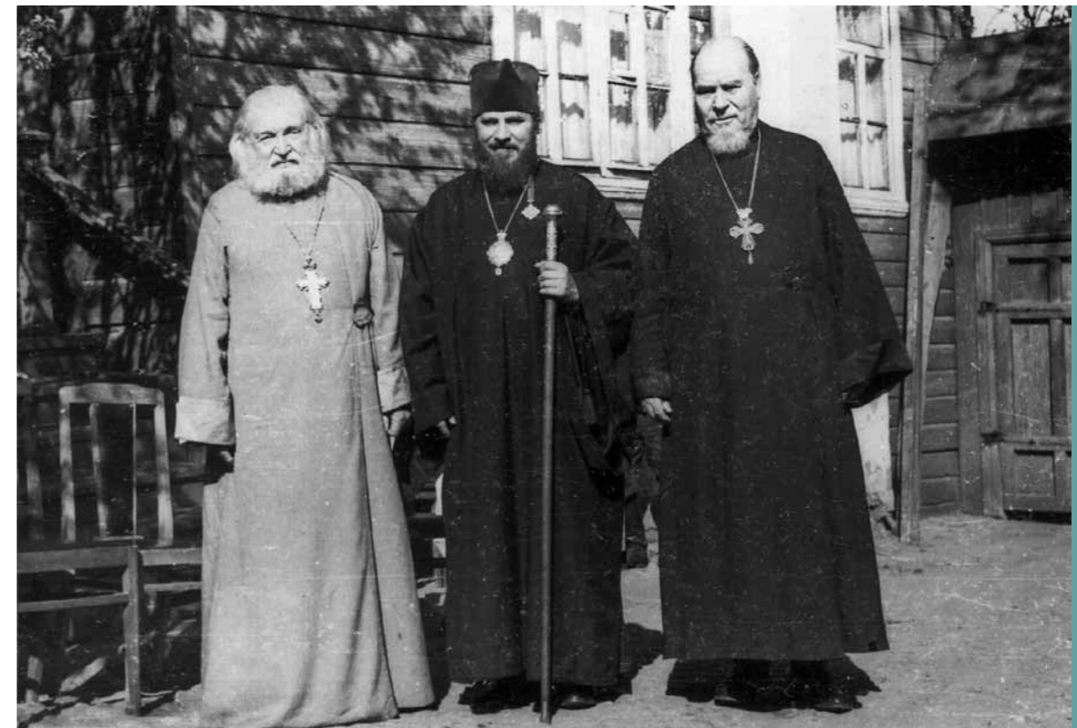
Епископ Мелхиседек (в центре) в гостях у протоиерея Михаила Лебедева (слева). Середина 70-х гг.