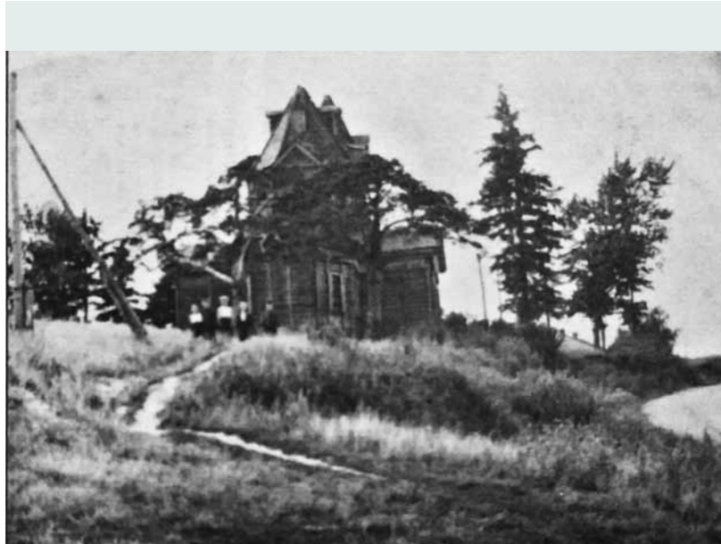
Богоявленский храм в Сентяпино, снесенный в 1973 г. Здесь будущий владыка Мелитон служил в 1924–1928 гг.