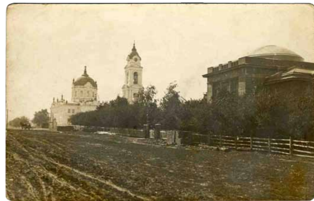
Чембар. Вид на Покровский собор и народный дом. 1910-е гг.