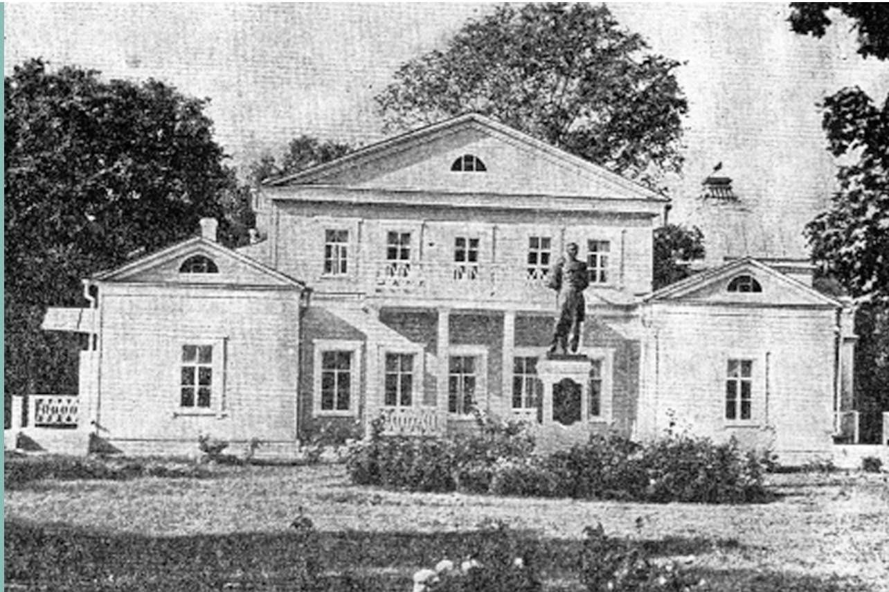
Музей-усадьба «Тарханы». 70-е гг.

щена в музей. Рядом часовня-склеп. Спустились вниз и постояли около гроба поэта. Он положен в прямоугольный цинковый ящик.