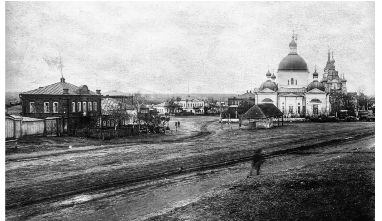
Поим. Начало XX в.