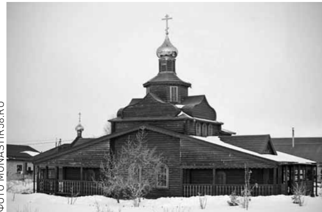
Нижнеломовский Казанско-Богородицкий монастырь

4 января – прав. Александра Чагринского (Юнгера; 1900), уроженца с. Аблязово Кузнецкого района. 6 января – Навечерие Рождества Христова (Рождественский сочельник). 7 января – Рождество Христово. 9 января – сщмч. Тихона (Никанорова), архиепископа Воронежского (1920), управлявшего Пензенской епархией в 1902–1907 гг. 10 января – сщмч. Арефы Насонова (1938), пресвитера, в 1916–1931 гг. служившего в с. Андреевка Каменского района, Кевдо-Вершина и Ершово Белинского района. 11 января – прмч. Агриппины Киселевой (1942), уроженки с. Урлейка Пензенского района. 14 января – Обрезание Господне. Свт. Василия Великого. 18 января – Навечерие Богоявления (Крещенский сочельник). 19 января – Святое Богоявление. Крещение Господне. 19 января – день памяти старца Феодора Воейковского (Винокурова; 1949), подвижника благочестия, погребенного на Мироносицком кладбище Пензы.