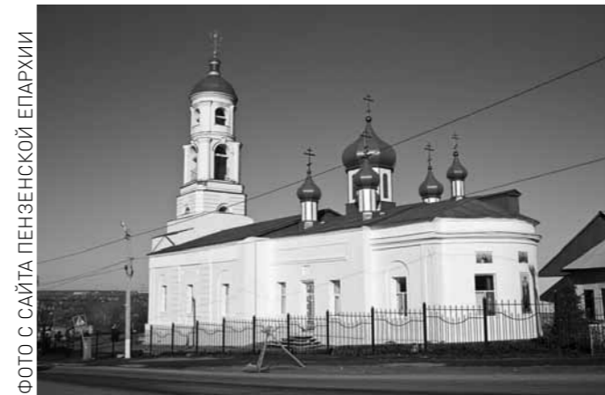
Церковь св. вмч. Димитрия Солнукского в Каменке

7 июля – Рождество Иоанна Предтечи. 8 июля – блгвв. князей Петра и Февронии Муромских. 9 июля – Тихвинской иконы Божией Матери. 11 июля – сщмч. Григория (Самарина; 1940), уроженца с. Салмановки Вадинского района. 12 июля – первоверховных апп. Петра и Павла. 21 июля – явление иконы Пресвятой Богородицы во граде Казани. 24 июля – равноап. вел. княгини Ольги. 28 июля – равноап. вел. князя Владимира.