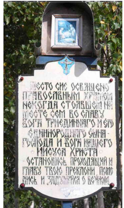
Место, где ранее была церковь села Дмитриевка.

признательность епархиального начальства за усердие в постройке и благоуукрашении церкви в селе Дмитриевка.