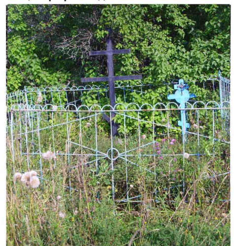
Могила священнослужителей близ места, где находилась дмитриевская кладбищенская церковь.