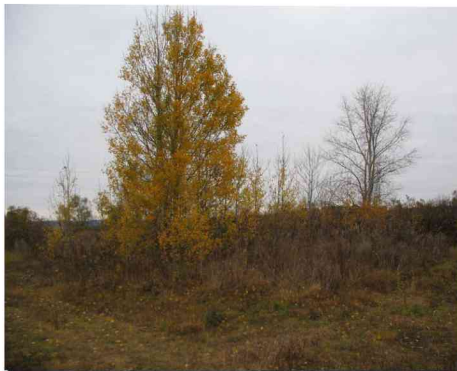
Место, где стояла церковь.

Русский Труев, в отличие от татарских сел Большое и Малое Труево Кузнецкого района, основан на «Тураевом городище», было заселено казаками, защищавшими подступы к г. Сызрани. Первое упоминание о населенном пункте относится к 1673 году: в «Торуевское Городище» Симбирского уезда явился дворцовый крестьянин села Дедилова Денис Федорович Рогожников и прослужил здесь казаком 24 года. После перевода казаков в города Азов и Петровск земля досталась князьям Борису Алексеевичу Голицыну и Василию Федоровичу Нарышкину. До 1928 входило в состав Кузнецкого уезда Саратовской губернии. Имелся Богоявленский храм - деревянный на каменном фундаменте, однопрестольный. Построен он был прихожанами с. Богоявленского и д. Марьевки в 1903 г. вместо прежней, сооруженной в 1789 г.