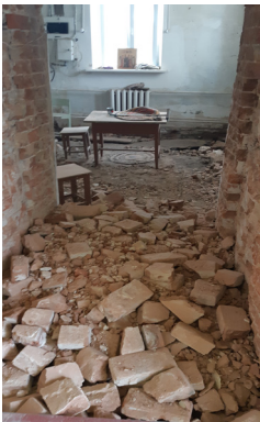
В начале ремонта...