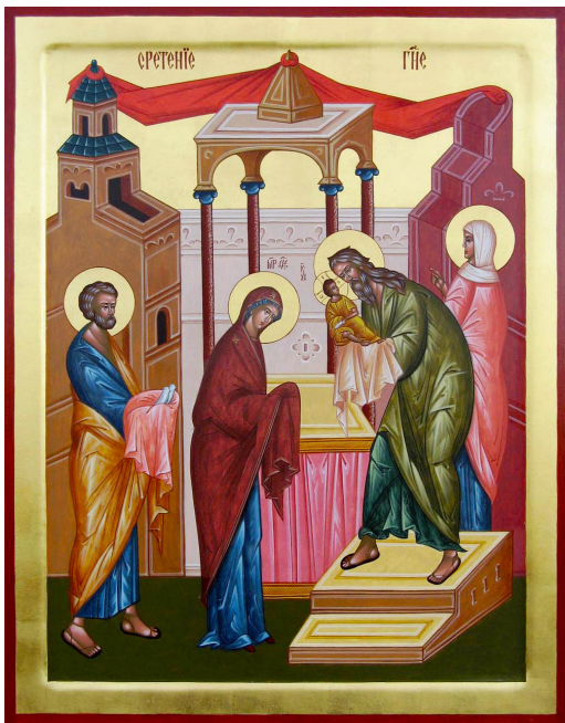
Икона «Сретение Господне»

В переводе с церковнославянского «сретение» – «встреча». Это один из самых почитаемых праздников в христианском мире, потому что именно в этот день соединились Ветхий и Новый Заветы. Произошло это благодаря долгожданной встрече человека – святого Симеона – с Богомладенцем Иисусом Христом. В Русской Православной Церкви в праздник Сретения Господня отмечается также День православной молодежи.