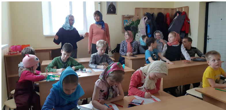
...И первый урок в новом классе

С января 2020 года воспитанники воскресной школы при Михайло-Архангельском храме р. п. Мокшан стали заниматься в новом помещении.