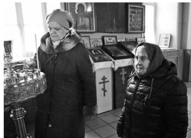
В Никольском храме после литургии

Сначала ей, 19-летней, было очень страшно. Она боялась артобстрела и бомбежки до крика, до визга. Но больше – того, что один из снарядов угодит в огромное корыто, в котором только что замесили тесто, и тяжелую работу придется выполнять заново. Обстрел – не обстрел, мороз – не мороз, а испечь 200 буханок хлеба на отделение – боевую задачу – надо выполнить. Потом привыкла и, услышав звуки орудий, уже не бежала, куда глаза глядят, а падала на землю рядом с полевой кухней.