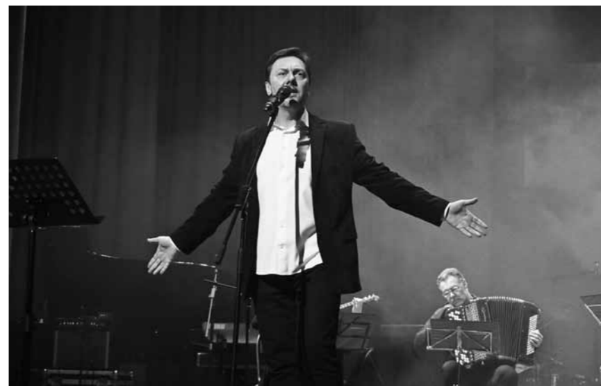
Выступление в Пензенской областной филармонии

– В вашем творческом багаже – работа в областной филармонии, в ан-