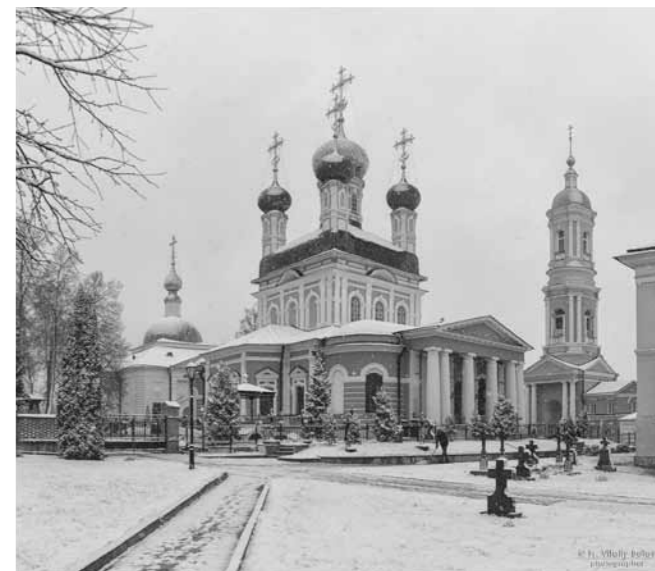
Оптина пустынь. Козельск, Калужская область