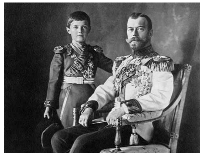
Государь и цесаревич

В своих воспоминаниях воспитатель и наставник царских детей Пьер Жильяр отмечает, что император для детей был и отцом, и государем, и товарищем. Был добрым отцом, с открытым сердцем, которое отзывалось на радость и на беды детей. В нечастые совместные семейные вечера