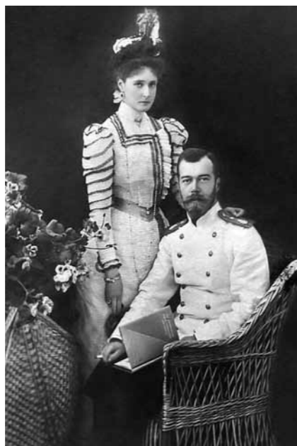
Государь и государыня

Царь и царица старались беречь это чувство – любовь, и, кроме