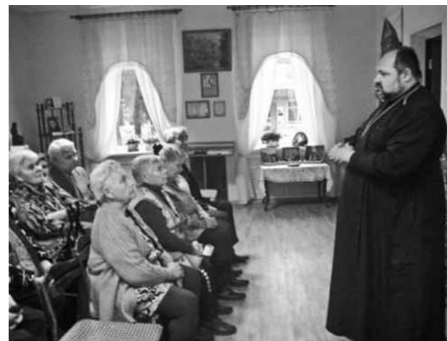
Беседа со старшим поколением

Объясняешь, например, что такое Евангелие, о чем оно рассказывает. Поначалу для людей это нечто непонятное и далекое. Начинаешь на пальцах объяснять, как детям, приводить какие-то примеры из жизни. Вдруг, смотришь, у слушателей глаза загораются, они начинают задавать вопросы, выражать свою точку зрения.