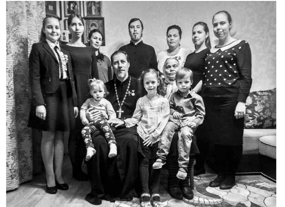
Большая и дружная семья