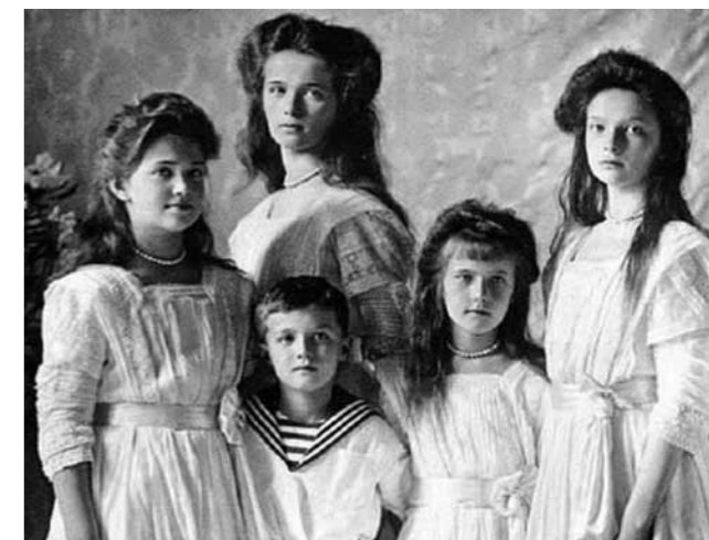
Великие княжны и наследник

А было ли такое в семье императора? Было. Потому что это были реальные дети, со своими взглядами и чувствами. Но мать пыталась владеть ситуацией. В одном из писем старшей дочери Императрица пишет: «Не ссорьтесь друг с другом, это в самом деле просто безобразно. Всегда будьте любящими и добрыми».