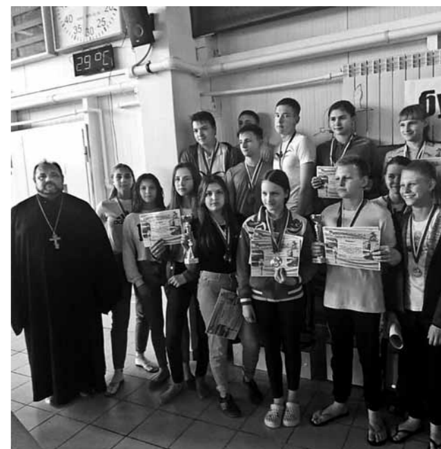
С победителями и призерами открытого первенства по плаванию на кубок Георгия Победоносца

Моя задача здесь – психологически поддержать человека, утешить его. Иногда просто выслушать. Ведь это большая проблема нашего общества, когда человека не слышат.