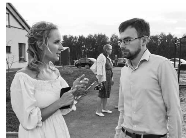
С Марией Львовой-Беловой в арт-поместье «Новые берега»