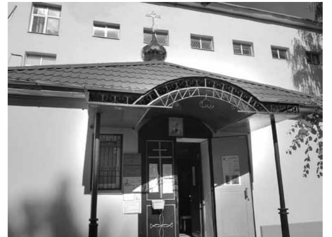
Храм мученицы Татианы при ПГУАС