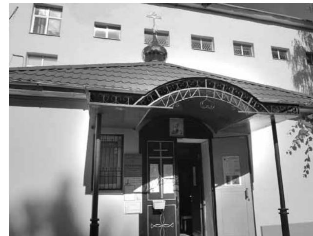
Храм мученицы Татианы при ПГУАС