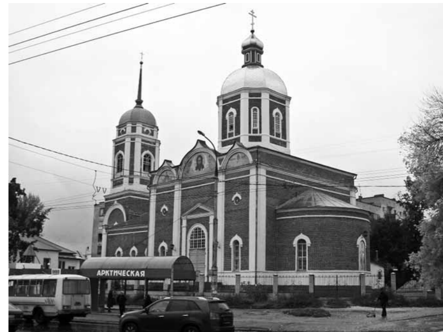
Христо-Рождественский храм г. Липецка

Приговор был приведен в исполнение 2 ноября 1937 года в 24 часа. Место погребения священномученика неизвестно.