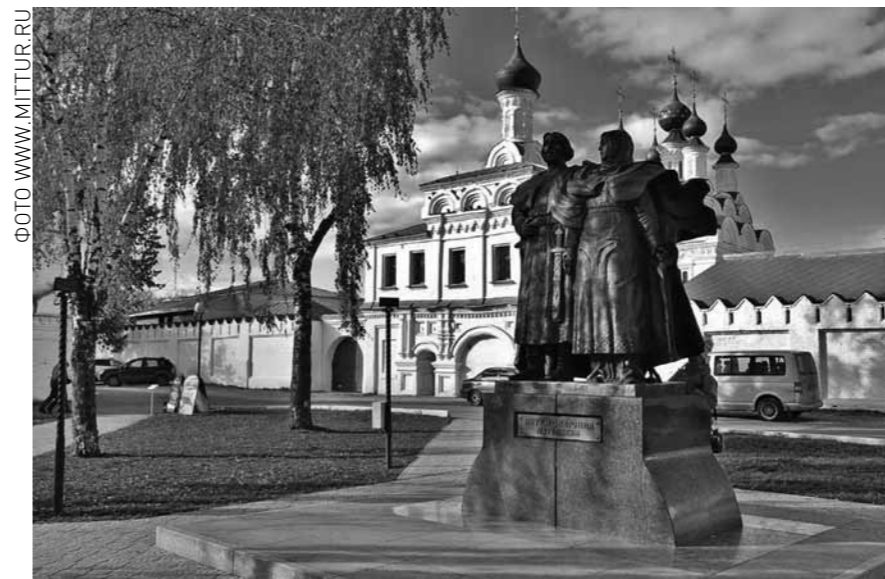
Троицкий монастырь и памятник блгвв. князьям Петру и Февронии. Город Муром. Владимирская область.

Алина КАЛИНИНА, фото twitter.com/MuseumVok