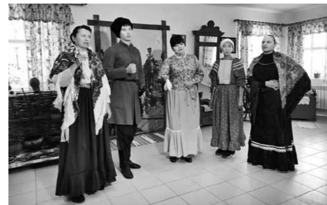
Ансамбль «Казачья слобода».

На его базе работают несколько различных объединений: библиотека, воскресная школа, молодежное общество, студия-мастерская «Марья-искусница», социальная служба. В центре проводятся библейско-богословские беседы «Разговор у печки», бесплатные занятия по психоло-