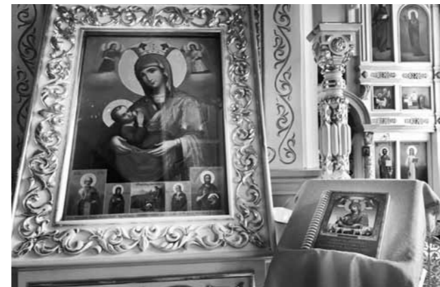
Чудотворный образ Пресвятой Богородицы «Млекопитательница»

– В ходе реставрационных работ нам удалось обнаружить икону Божией Матери «Млекопитательница», написанную в Ильинском скиту на Афоне, – рассказывает настоятель собора. – Она была освящена от чудотвор-