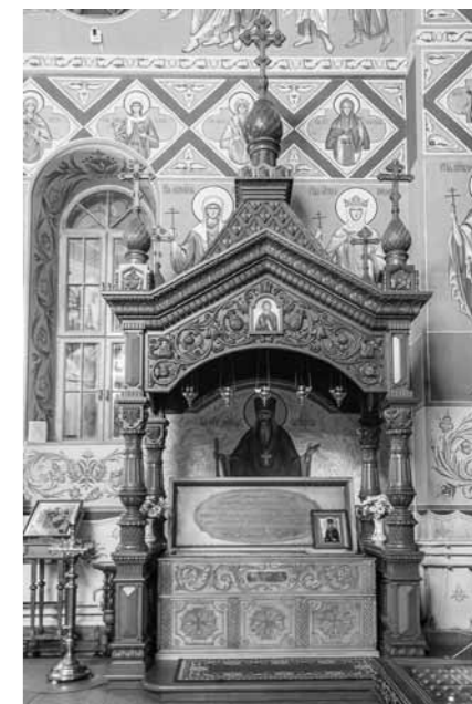
Рака с мощами праведного Александра Чагринского в Иверском монастыре г. Самара

на земле почившего пастыря теплилась неугасимая лампада.