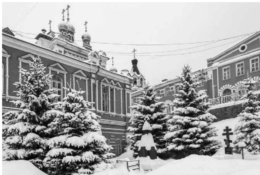
Иверский женский монастырь (Самара)