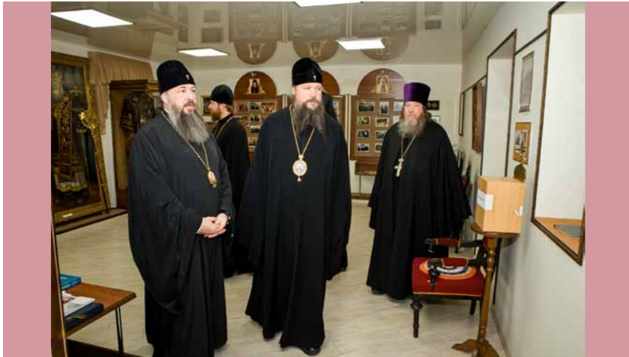
Митрополит Дионисий в музее архиепископа Серафима (Тихонова). 7 сентября 2020 г.

кой епархией. Насколько это обременительная нагрузка, и насколько тяжело уделять должное внимание двум епархиям сразу?