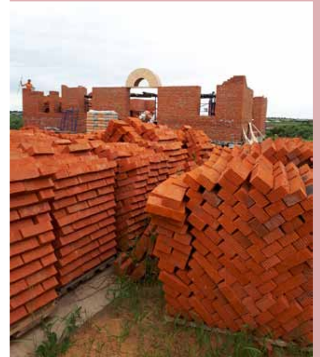
Строящийся храм Михаила Архангела в селе Кочетовка Каменского района

– Прежде всего, продолжается строительство храма Архангела Михаила в селе Кочетовка – там, где у нас новопрославленный святой, блаженный Иоанн Кочетовский. В марте