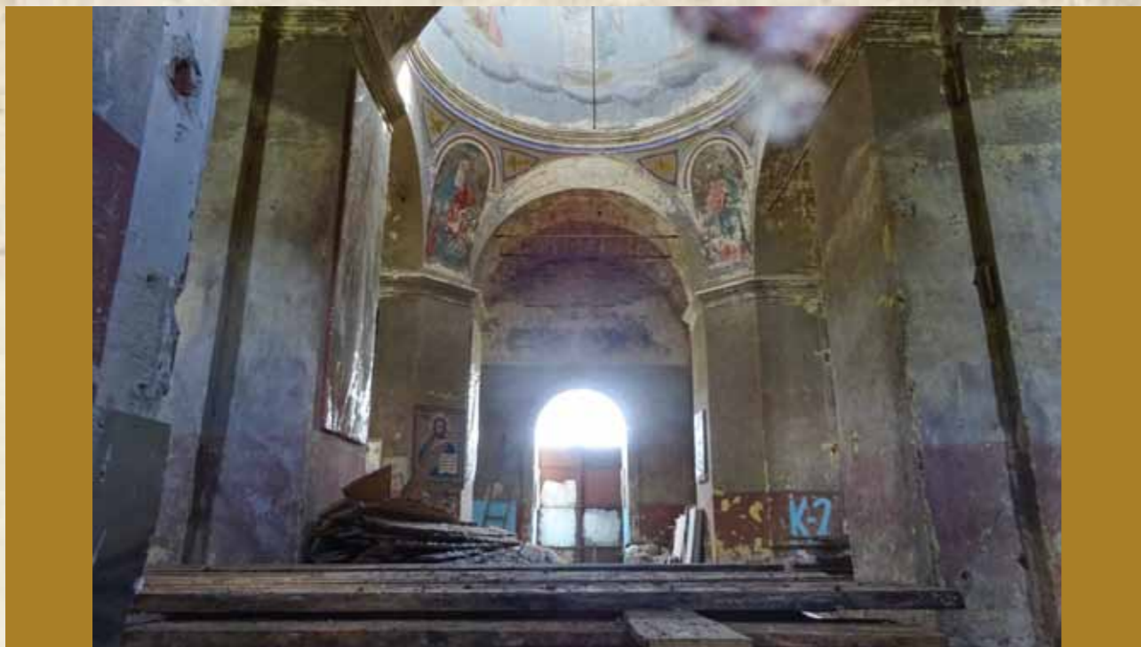
Интерьер Успенской церкви. 2019 г.