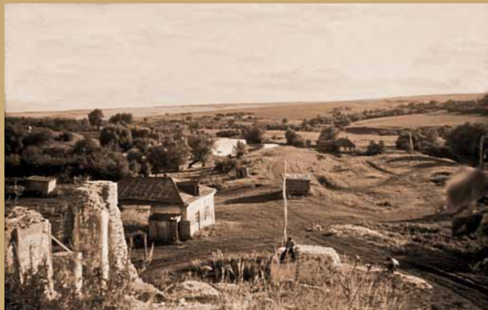
Виды села Верхняя Вязера (Казеевка). 60-е гг. XX в.