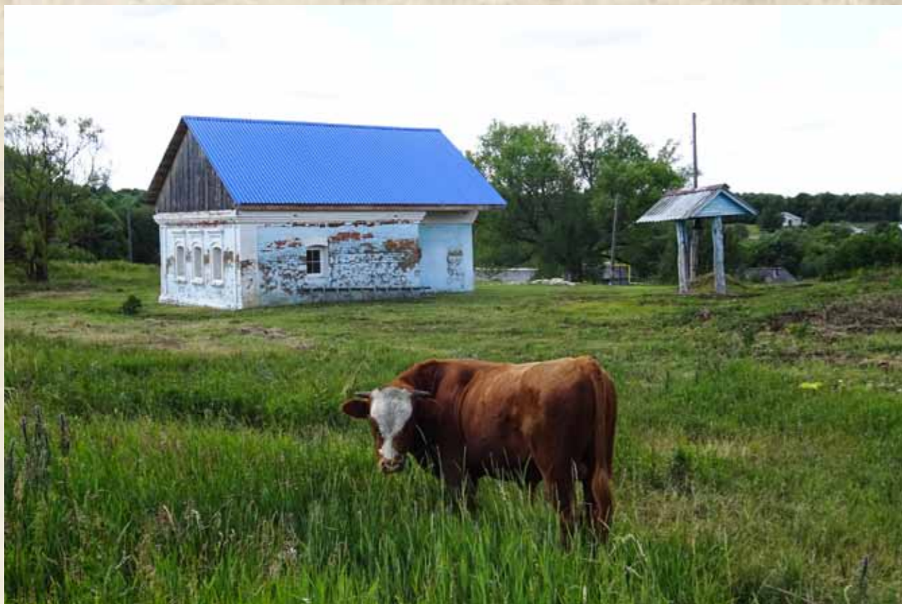
Сторожка при Успенской церкви. 2019 г.

псаломщиками более 6-8 лет, если только они по испытанию окажутся достаточно подготовленными к учительству и диаконству». 33