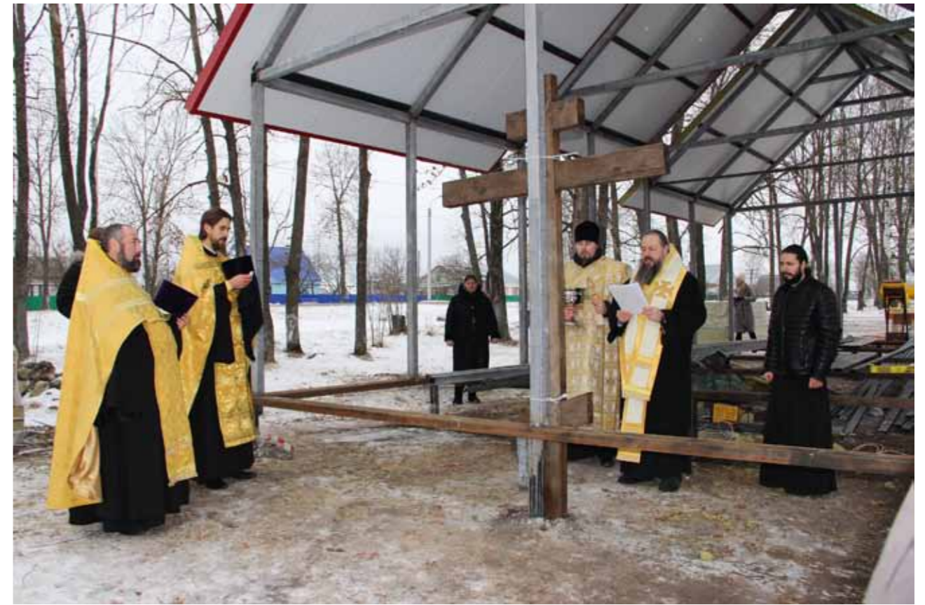
Закладка храма Архистратига Михаила в Степановке Бессоновского района

но для меня это отрадно потому, что эти технологии дают возможность в короткие сроки и, конечно, с небольшими затратами возвести в селе церковь. У нас же и в древности был ряд так называемых «обыденных» храмов, которые строились за очень короткие сроки, «об один день», и имели типовую архитектуру. Может быть, для небольших сел, таких, как Степановка, здешний храм Архангела Михаила и будет примером того, как можно довольно-таки незатратно и быстро возвести храм на 70-80 человек, что для такого села вполне достаточно.