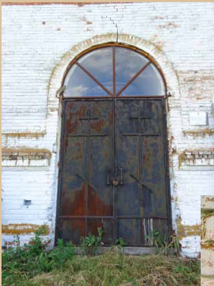
Южные двери Успенской церкви. 2019 г.