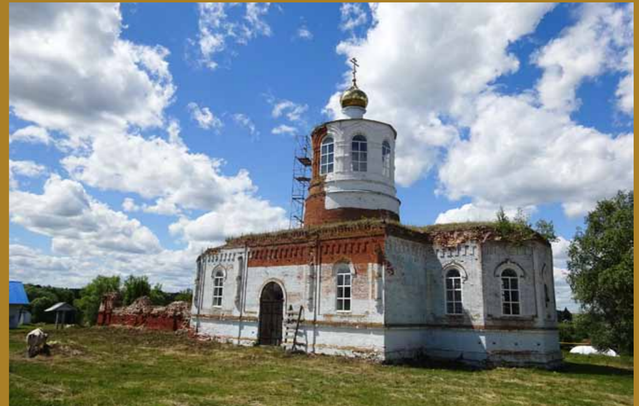
Успенская церковь в Верхней Вязере (Казеевке). 2019 г.