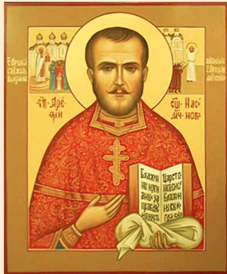
Священномученик Арефа Насонов (1888-1938)