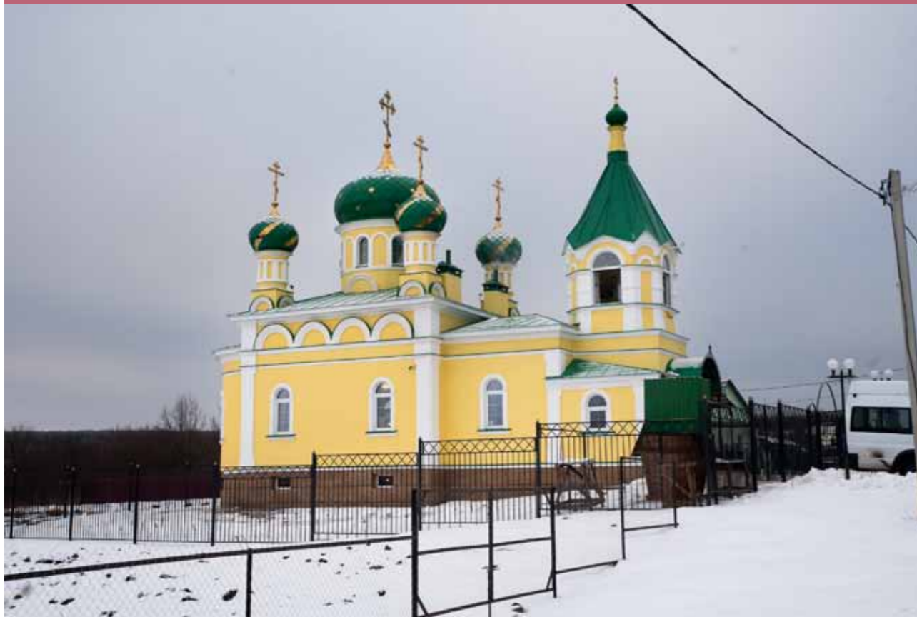
Храм во имя Святой Троицы с. Камайка