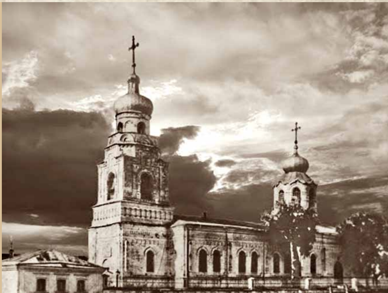
Успенская церковь в Верхней Вязере. Фото середины XX в.