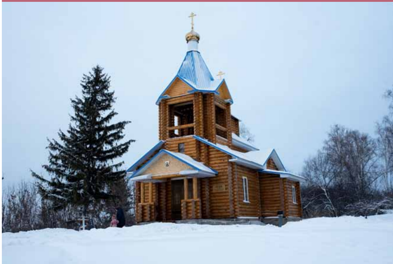
Храм во имя Иерусалимской иконы Божией Матери с. Наумкино