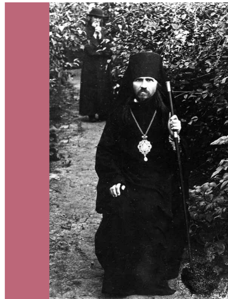
Сщмч. Фаддей (Успенский) в ссылке в Кузнецке

Вот она, святость. Это не былинные герои, которые с дубиной выходят против Змея Горыныча. Святость – она довольно обыденна. Вот он пил чай, чашка чайная стоит в серванте. Но в момент, когда им был предложен выбор – предать или не предать, рассказать о своих духовных чадах или не рассказать, дать согласие быть осведомителем или не дать, отречься от веры или не отречься – наши новомученики говорят: нет, мы это делать не будем. И вот эта совершенно тихая, обыденная жизнь внезапно оказывается путем в Небесное Царство.