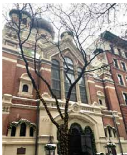
Свято-Николаевский собор Нью-Йорка