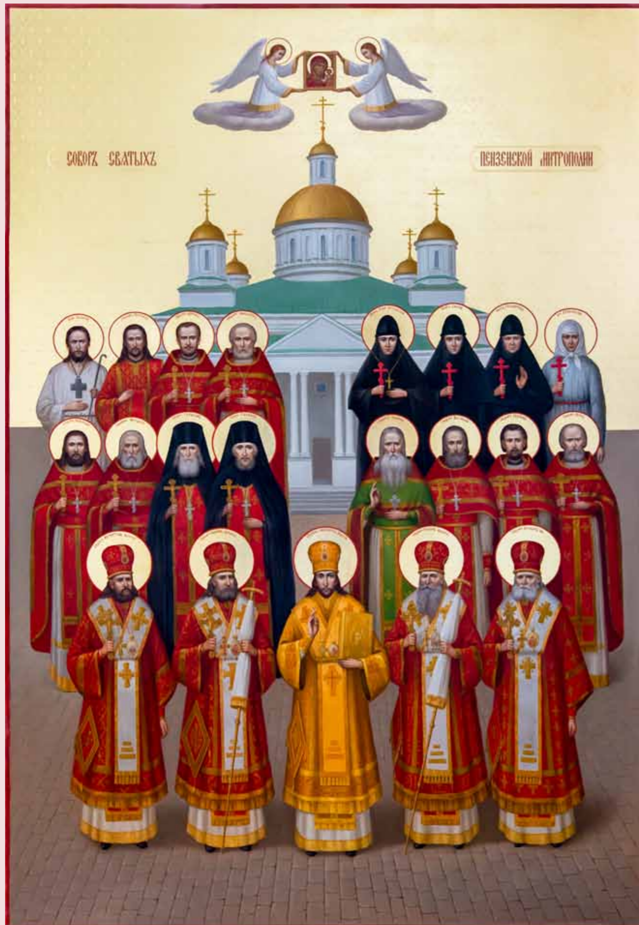
Собор святых Пензенской митрополии. Икона работы С.В. Шалаева. 2021 г.