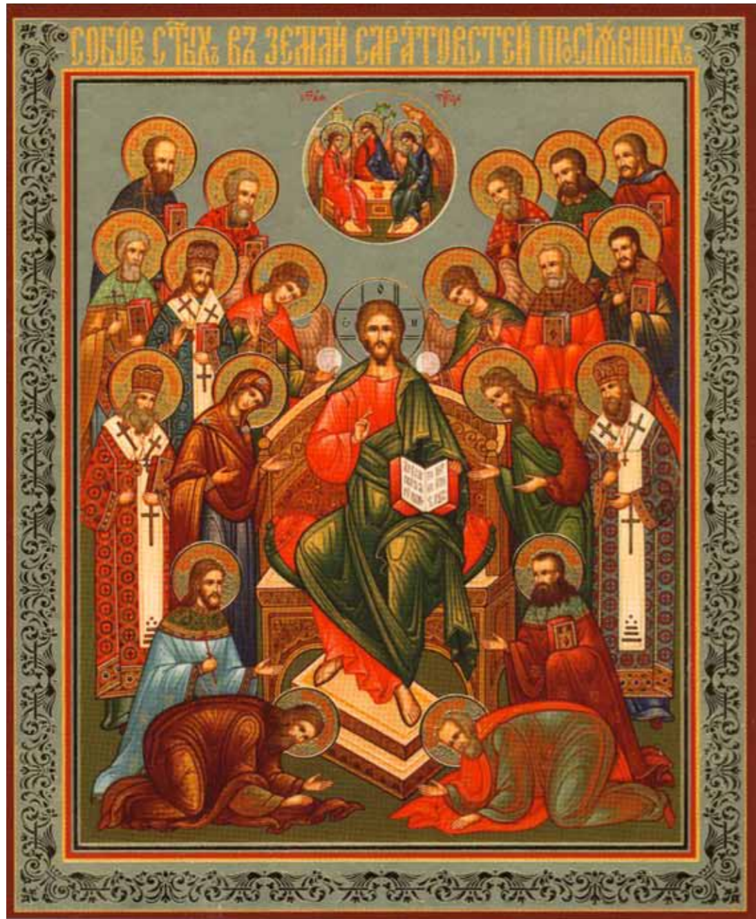
Собор Саратовских святых. Икона

чайно скорбели, что в тот раз нам вычеркнули святителя Иннокентия, объяснив это тем, что раз он Пензенский и Саратовский, а не Саратовский и Пензенский – мол, когда Пенза будет устанавливать Собор Пензенских святых, туда его и включат).