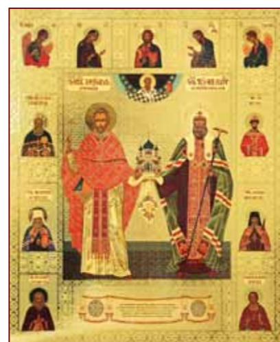
Икона Собора Американских святых

дедушка отец Димитрий. Такое счастье, что теперь в тех местах возродилась духовная жизнь, что теперь там монастырь и цветущий сад!