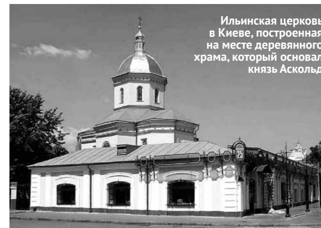
Ильинская церковь в Киеве, построенная на месте деревянного храма, который основал князь Аскольд

Но и теперь князь колеблется. Когда к Владимиру обратились за военной помощью византийские императоры Василий II и Константин VIII, он обещал поддержку, но при условии, что отдадут ему в жены свою сестру Анну. Безвыходность положения вынудила императоров смириться. Они дали согласие на брак, если русский князь примет крещение и женится на ней по христианскому обряду. Так и случилось. Хотя по некоторым данным, Владимир уже был крещен.