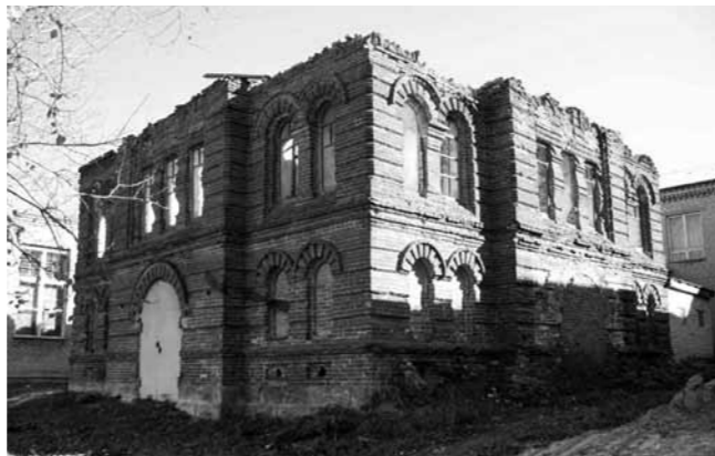
Руины церкви блгв. князя Александра Невского в Мокшане

Форум будет долгосрочным, его мероприятия рассчитаны на год. В разное время они пройдут в Спасском кафедральном соборе, на базе строительного реставрационного центра «Спас». Форум призван не только объединить молодежный потенциал, но и стать уникальной экспериментальной площадкой по сотрудничеству государства и Церкви в сфере образования и воспитания детей и молодежи, а также внести ве-