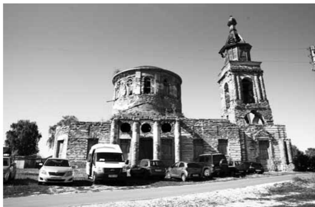
В таком состоянии находится храм Владимирской иконы Божией Матери села Лебедевка

– Нашей задачей было сплотить вокруг этой идеи неравнодушных людей, добровольцев, которые помогли бы, например, в подготовке объекта к реставрации,