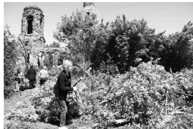
Волонтеры расчищают территорию Успенского храма в селе Калинино

Экспедиция была организована в рамках архитектурной мастерской «Каменная летопись», также являющейся площадкой форума. Здесь студенты учатся искать сведения для исторических справок, восстанавливать факты и персоналии, имеющие отношение к конкретным памятникам культовой архитектуры, расчищать территории руинированных храмов, обмерять здания, оценивать их аварийность и возможность восстановления, анализировать архитектурные стили и так далее.