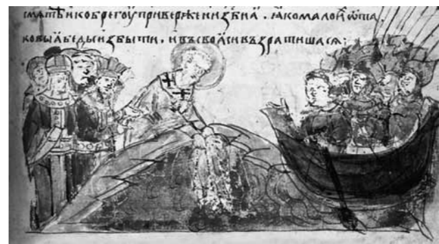
Поход Аскольда на Константинополь. «Повесть временных лет»

Главной мотивацией для крещения Руси стало окружение соседних государств, ушедших от язычества. По версии, названной в «Повести временных лет», выбор веры князем Владимиром происходил так: в Киев приходили послы от мусульман, от римо-католиков и иу-