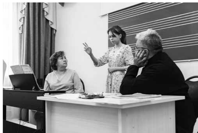
Вступительный экзамен на регентском отделении

– Почему же? В прошлом году мы подписали соглашение с Ассоциацией арабо-русских вузов, в рамках которого начали дистанционно готовить студентов из Ливана к обучению в Пензенской духовной семинарии. Они прошли курс русского языка. Изначально группа была большой, но в силу определенных обстоятельств (свою роль сыграла и пандемия COVID-19) до финала дошли