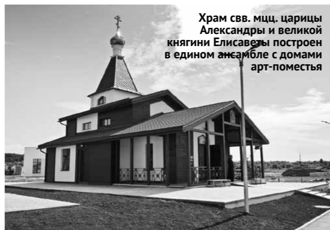
Храм свв. мцц. царицы Александры и великой княгини Елисаветы построен в едином ансамбле с домами арт-поместья

му что средняя школа в другом селе, а школьный автобус не приспособлен под нужды инвалидов-колясочников.