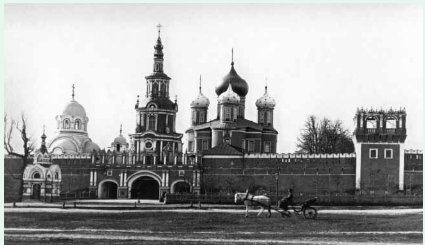
Донской монастырь в Москве. Начало XX в.