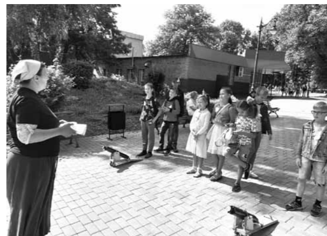
Во время игры