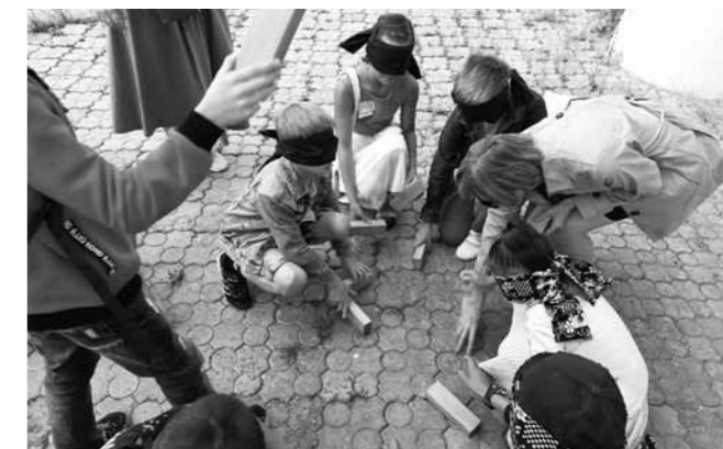
Крепость строили на ощупь

Первая серия квестов прошла в июне этого года, их участниками стали, преимущественно, школьники. Собрать команды организаторам помогли члены молодежного парламента Законодательного собрания Пензенской области. Вторая состоялась в августе при под-