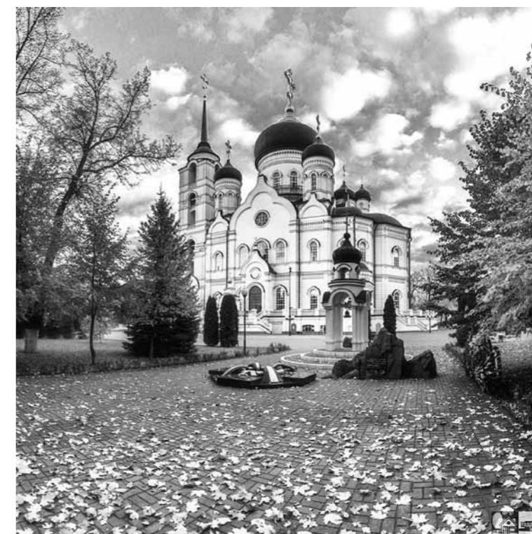
Благовещенский кафедральный собор. Воронеж.

31 октября. Пензенская область. Вадинск: Тихвинский Керенский монастырь, к чудотворной Тихвинской иконе Божией Матери.