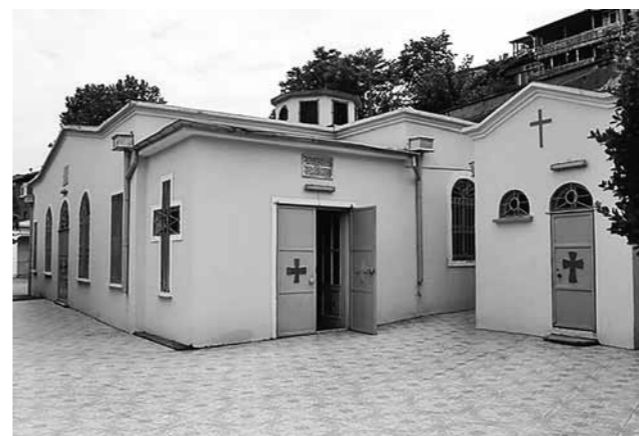
Храм во имя Влаернской иконы Божией Матери, современное здание. Стамбул. Турция

Мы причащаемся Святых Таин. Что же это значит? Это значит, что чудом святого приобщения жизнь Христова, человеческая природа Христова делается нашей жизнью и нашей природой, и что хотя бы