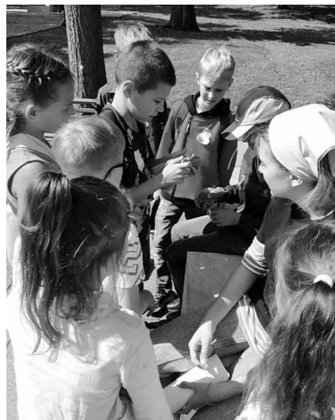
Квесты помогают детям развивать коммуникативность