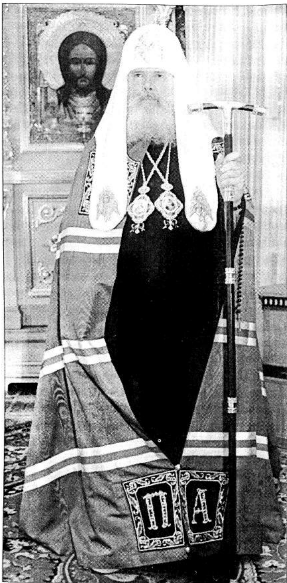
С 1 по 3 октября 1999 года Пензенскую епархию в связи с юбилейными торжествами, посвященными 200-летию ее образования, посетил Святейший Патриарх Московский и всея Руси Алексий II