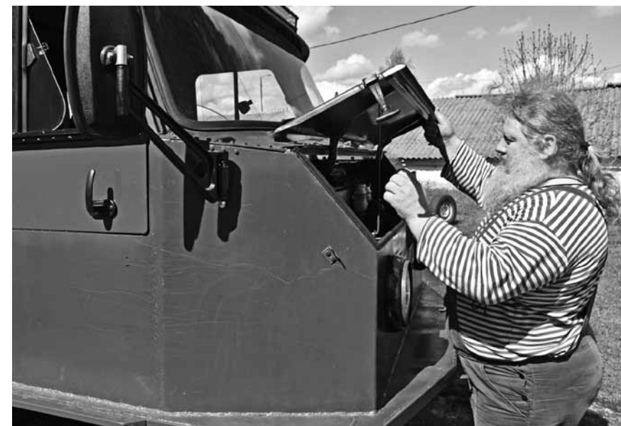
Вездеход батюшка собрал сам

Немало средств уходит и на внутреннее убранство. Недавно нижегородские мастера отре-