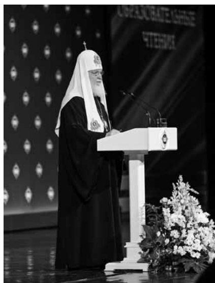
Выступление Патриарха Кирилла на XXX Международных образовательных Рождественских чтениях

22 – 25 МАЯ В МОСКВЕ ПРОШЛИ XXX МЕЖДУНАРОДНЫЕ ОБРАЗОВАТЕЛЬНЫЕ ЧТЕНИЯ «К 350-ЛЕТИЮ СО ДНЯ РОЖДЕНИЯ ПЕТРА I: СЕКУЛЯРНЫЙ МИР И РЕЛИГИОЗНОСТЬ»