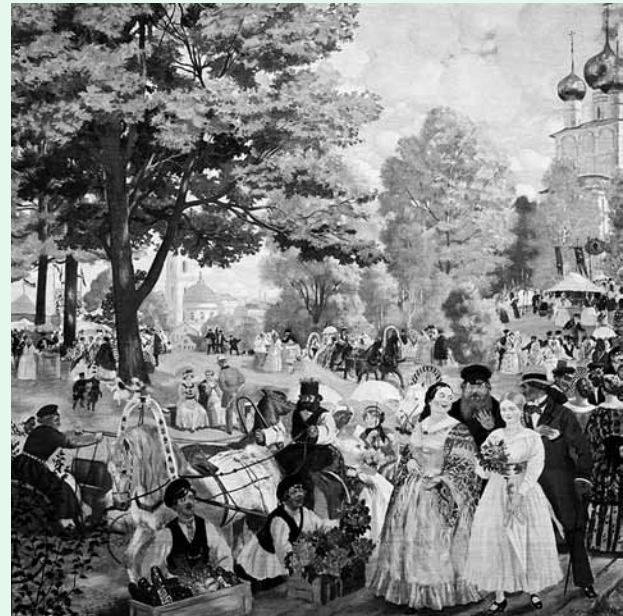
Борис Кустодиев «Троицын день», 1920 г.

На середину двора выбежала Лида, подставила дождю серебряную ложечку и брызгала милое лицо свое первыми грозowymi дождинками.