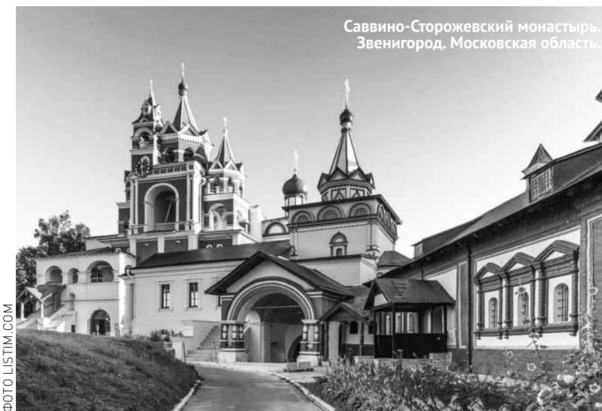
Саввино-Сторожевский монастырь. Звенигород. Московская область.

Адрес: г. Пенза, Соборная площадь, 1. Телефоны: 8-927-375-3165, 8-927-375-6061, 25-31-65, 25-60-61