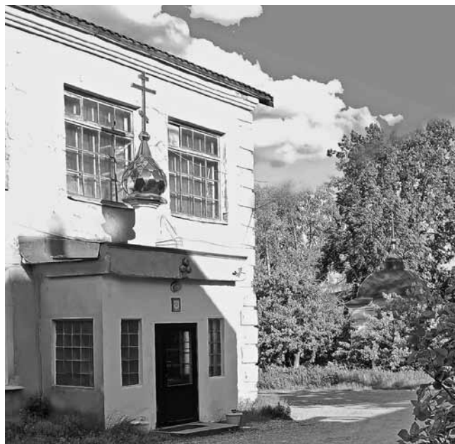
Вознесенский молитвенный дом

Как ни старались богоборческие власти стереть в сердцах людей память о святыне, у них не получилось это сделать. Старожилы до сих пор рассказывают о том, что