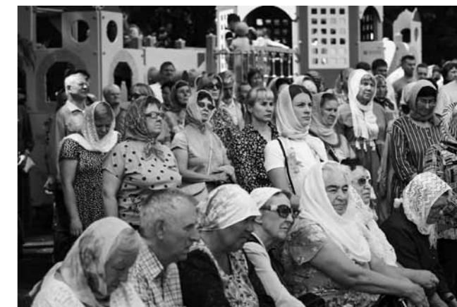
Те, кому было трудно переносить на ногах долгое богослужение, смотрели его прямую трансляцию на Соборной площади

Пенза встречала Патриарха Кирилла торжественным колокольным звоном. Первыми его приветствовали митрополит Пензенский и Нижнеломовский Серафим, губернатор Олег Мельниченко, полпред президента в Приволжском федеральном округе Игорь Комаров. У входа в собор ждали с хлебом-солью по старинному русскому обычаю юные пензенцы – воспитанники архиерейского хора и ученики православной гимназии святителя Иннокентия. К слову, богато украшенный каравай весом в три килограмма к такому торжественному случаю испекли студенты колледжа пищевой промышленности и коммерции.