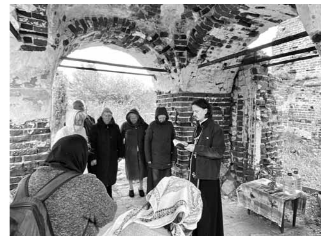
Молебен преподобному Мефодию на руинах Казанского храма в селе Суково Московской области (место последнего служения святого) служит в день его памяти 9 сентября

По материалам сайта rokrov-monastir.ru , фото из свободных источников