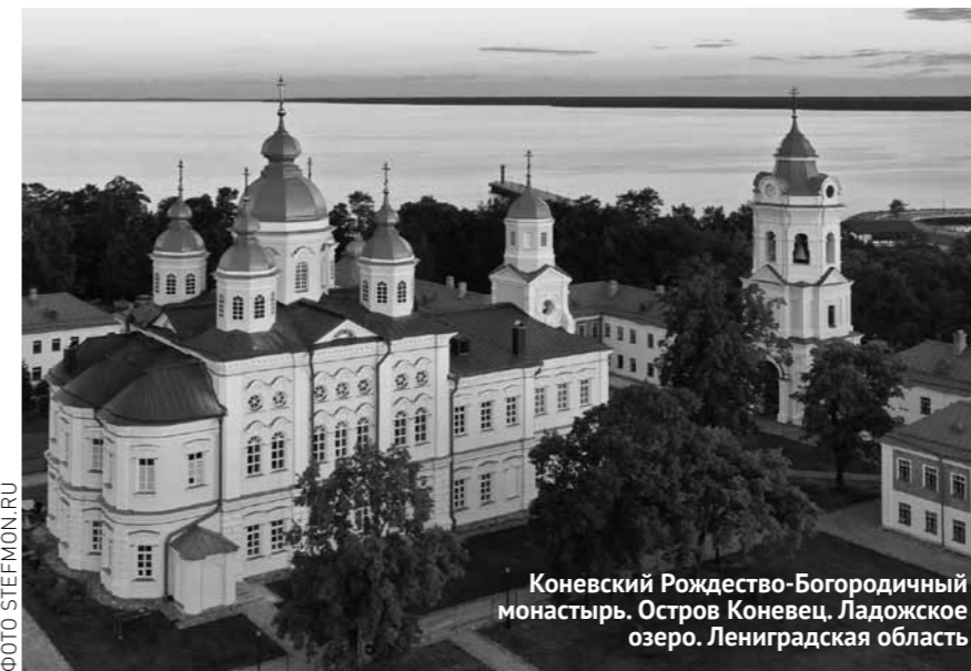
Коневский Рождество-Богородичный монастырь. Остров Коневец. Ладожское озеро. Ленинградская область

Адрес: г. Пенза, Соборная площадь, 1. Телефоны: 8-927-375-3165, 8-927-375-6061, 25-31-65, 25-60-61