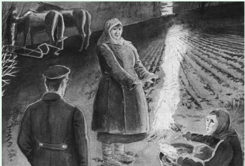
«Студент». Рисунок Дианы Лапшиной

Студент... подумал, что если Василиса заплакала, а ее дочь смутилась, то, очевидно, то, о чем он только что рассказывал, что происходило девятнадцать веков назад, имеет отношение к настоящему – к обеим женщинам и, вероятно, к этой пустынной деревне, к нему самому, ко всем людям. Если старуха заплакала, то не потому, что