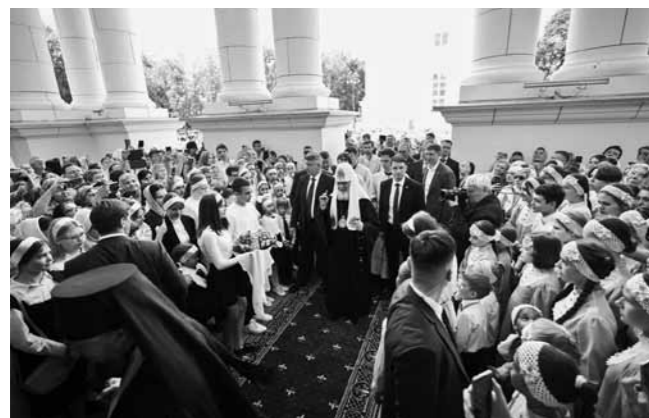
Встреча Патриарха Кирилла в Первохраме

Одним из важнейших событий, предшествующих визиту Патриарха Кирилла, стало перенесение чудотворной Казанской-Пензенской иконы Пресвятой Богородицы из храма Митрофана Воронежского в Спасский кафедральный собор. Надо сказать, у многих пензенцев это вызвало недоумение, ведь образ находился в Митрофановской церкви, казалось бы, с незапамятных времен.