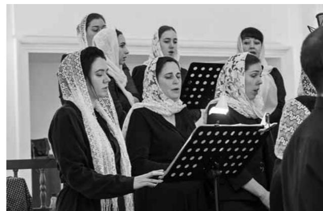
Хор Спасского кафедрального собора: петь за Патриаршей литургией – не только большая честь, но и огромная ответственность