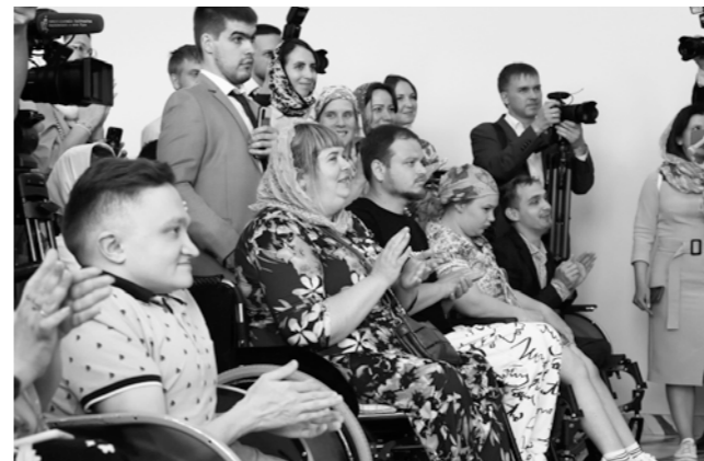
Участники проектов сопровождаемого проживания, обучения и трудоустройства молодых людей с инвалидностью «Квартал Луи» встретились с Предстоятелем

ительство Пензенской области, и наши районные администрации – выражают огромную благодарность за высокую оценку нашего совместного труда.