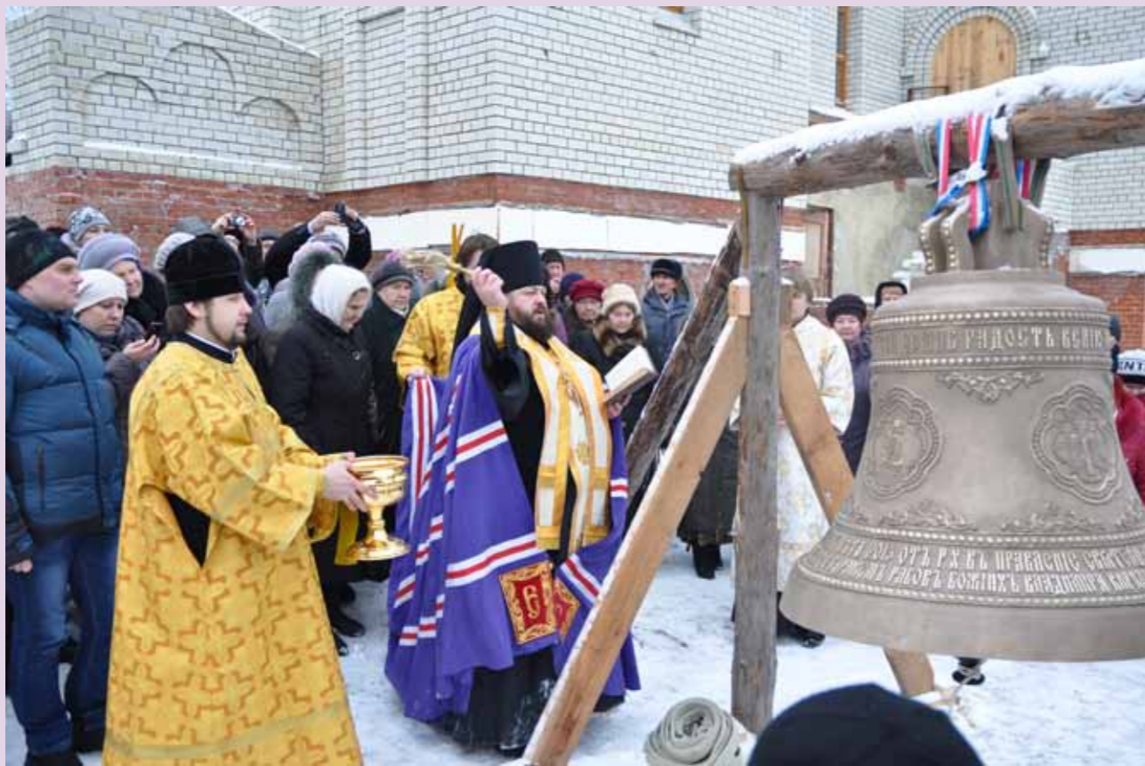
Освящение колокола для Николо-Покровского храма Кузнецка. 22 декабря 2013 г.