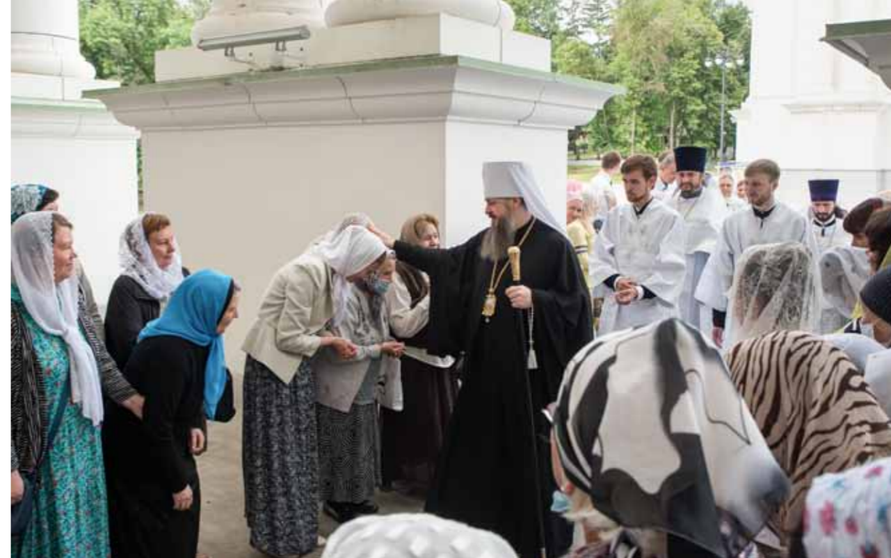
Перед литургией в день первого празднования Собора святых Пензенской митрополии. 12 июня 2021 г.