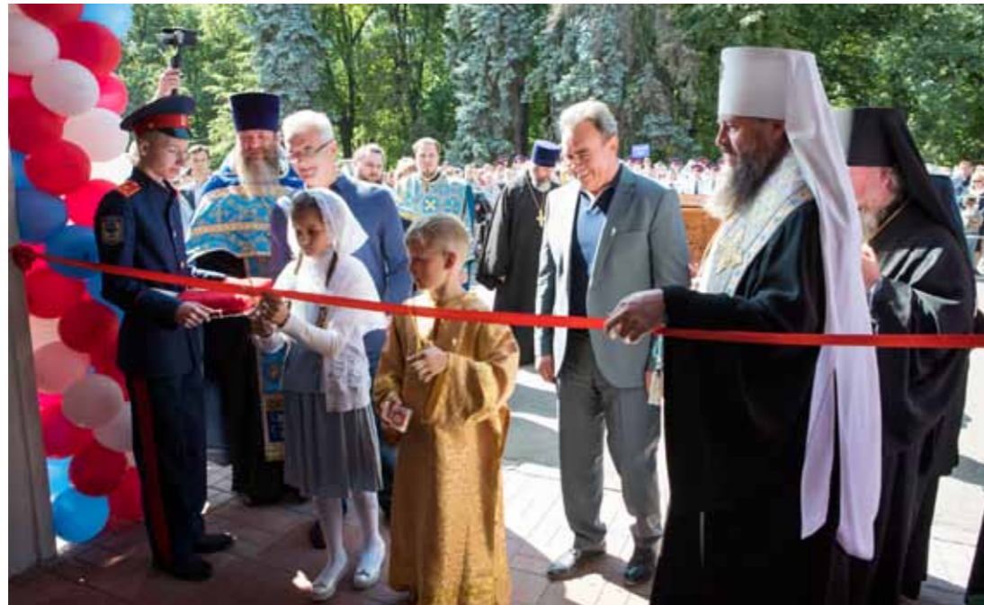
Открытие епархиального духовно-просветительского центра имени святителя Иннокентия Пензенского. 31 августа 2019 г.

Тут можно говорить и о воспитании родителями – возможно, где-то была перегнута палка, когда его насильно каждое воскресенье, как на трудовую повинность, тянули в храм, заставляли причащаться. Может быть, это наши же воскресные школы, которые не смогли найти какого-то подхода, а занимались теми же са-