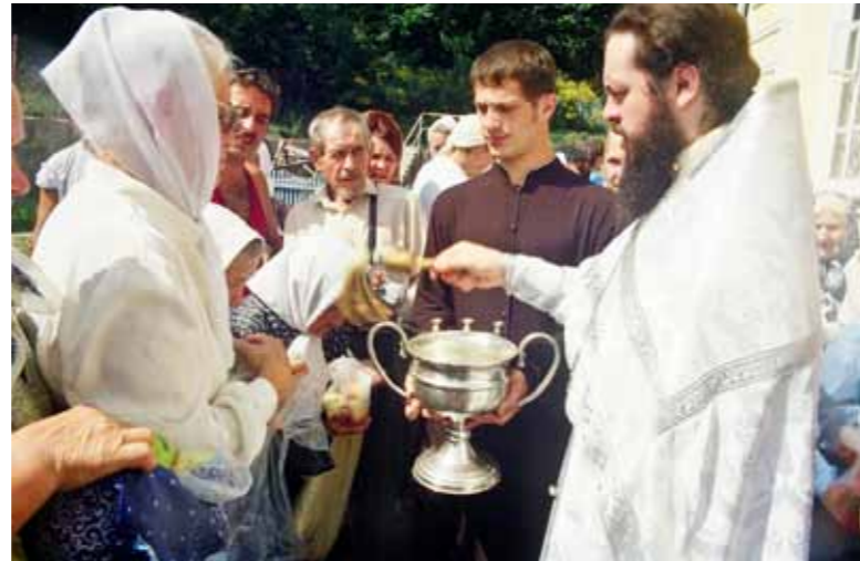
Преображение Господне. Освящение плодов в Покровском архиерейском соборе. 19 августа 2001 г.

Конечно, какого-либо сожаления или понимания того, что это было сделано быстро и не совсем осознанно, у меня нет. Но сейчас, пятнадцать лет спустя, у меня появилось осознание того, что каноны Церкви для вступающих на стезю пастырского или диаконского служения все же составлены неслучайно. Потому что внешний кругозор и внутренние составляющие для того, чтобы преподавать когда-либо какие-либо пастырские советы, у человека формируются ближе к тридцатилетнему возрасту. И теперь, взглядываясь в свою прошедшую пастырскую жизнь, я с ответственностью могу сказать, что сейчас уже не принимал бы таких скоропалительных решений в священнической практике, как в двадцать или двадцать с небольшим лет.