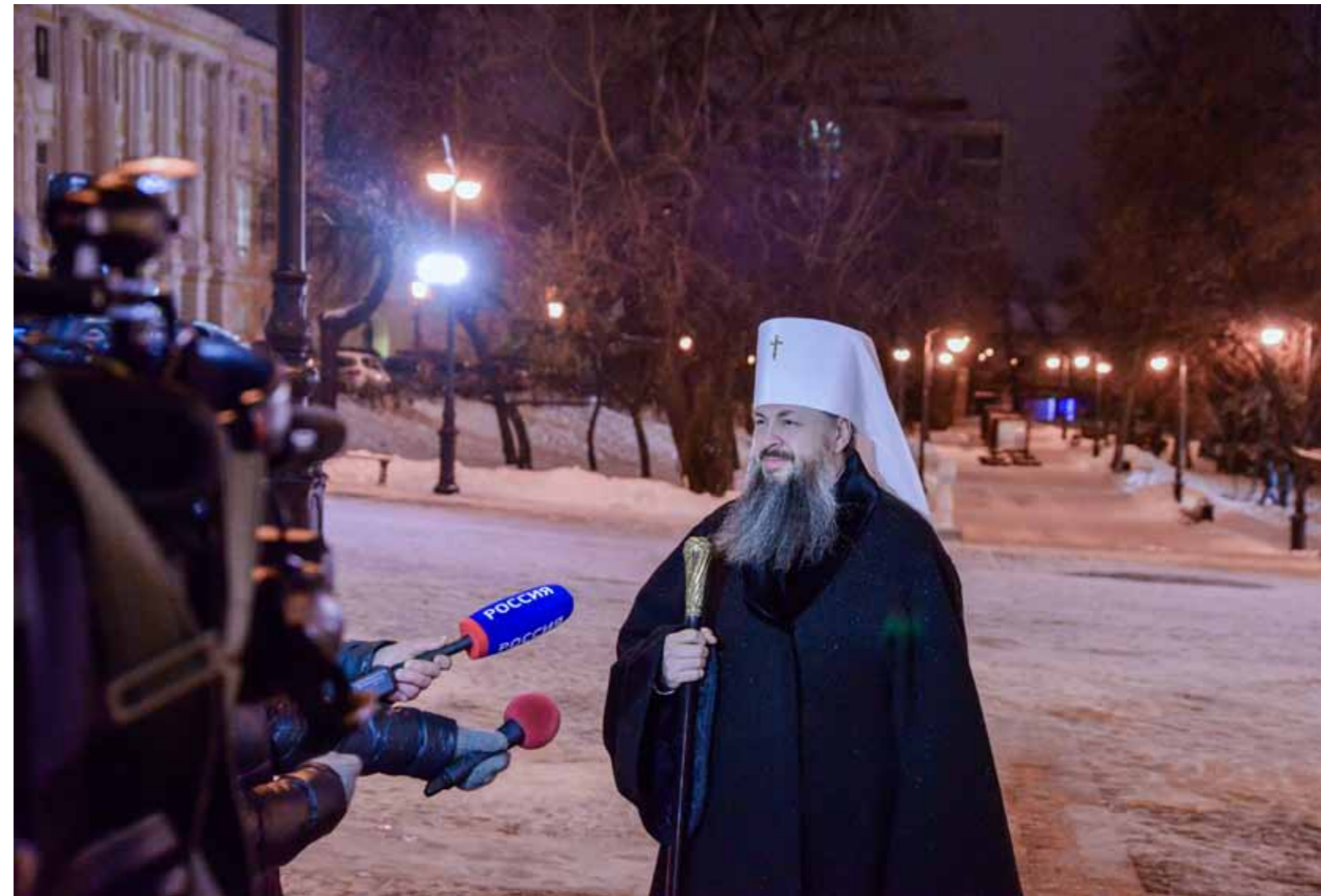
Перед ночной литургией на Рождество. 6 января 2021 г.

креннее отношение к ним, а также честность и правдивость в отношении той проповеди, которую священник произносит. Поэтому первая наша задача – это создание полноценных приходов, которые жили бы своей полнокровной жизнью, а полноценный приход, если говорить вкратце, – это семья, которая объединена единой верой, члены которой готовы откликнуться на просьбы друг друга, понять, услышать и быть действительно некоей ячейкой, которая будет составлять целую Церковь. У нас, к сожалению, таких приходов сейчас очень мало. В основном человек пришел в праздник или в воскресенье, помолился в храме – и благополучно из него ушел.