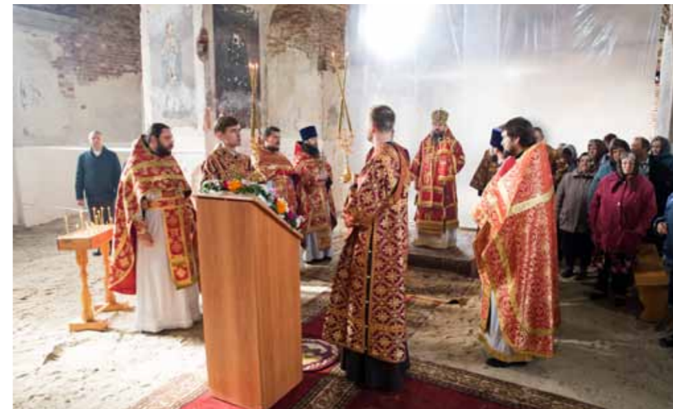
Литургия в Троицком храме с. Максимовка Каменского района, на родине преподобномученика Пахомия Скановского, в день его памяти. 20 сентября 2019 г.

уничтожены монастыри, церкви, очень древние и новые, которые были шедеврами архитектуры и культуры, уничтожены красивые поместья, тоже очень значимые для русской истории, которые хранили в себе русский дух и традицию. И кланяться за это прежним правителям я считаю ошибкой.