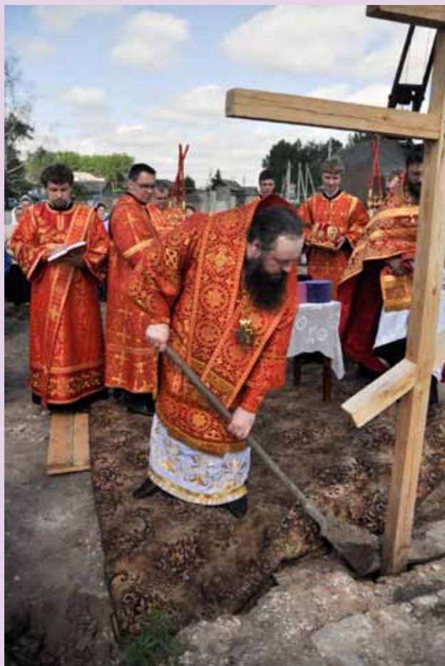
Закладка храма в с. Тешнярь Сосновоборского района. 29 мая 2013 г.