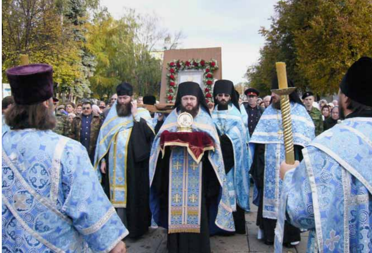
Крестный ход с частицей мощей священномученика Иоанна Рижского. 14 октября 2006 г.

За исключением татаро-монгольского нашествия, на Руси не было как такового мученичества, да и татаро-монгольское иго, которое было довольно веротерпимым, не принесло таких плодов массовых мученических кончин. А то, что случилось в начале двадцатого столетия в Русской Церкви – феномен Церкви вообще, как таковой, потому что он не сравним с числом мучеников за двести лет развития христианства после Христа. То есть, начиная с 70 года от разрушения Иерусалима, когда многие христиане-евреи разошлись по всему миру, потому что государство было разрушено, с проповеди апостольской, которая тоже началась непосредственно после смерти Христа (примерно с 34 года) – и вплоть до эдикта, который издал равноапостольный Константин в начале IV века – такого количества мучеников не было.