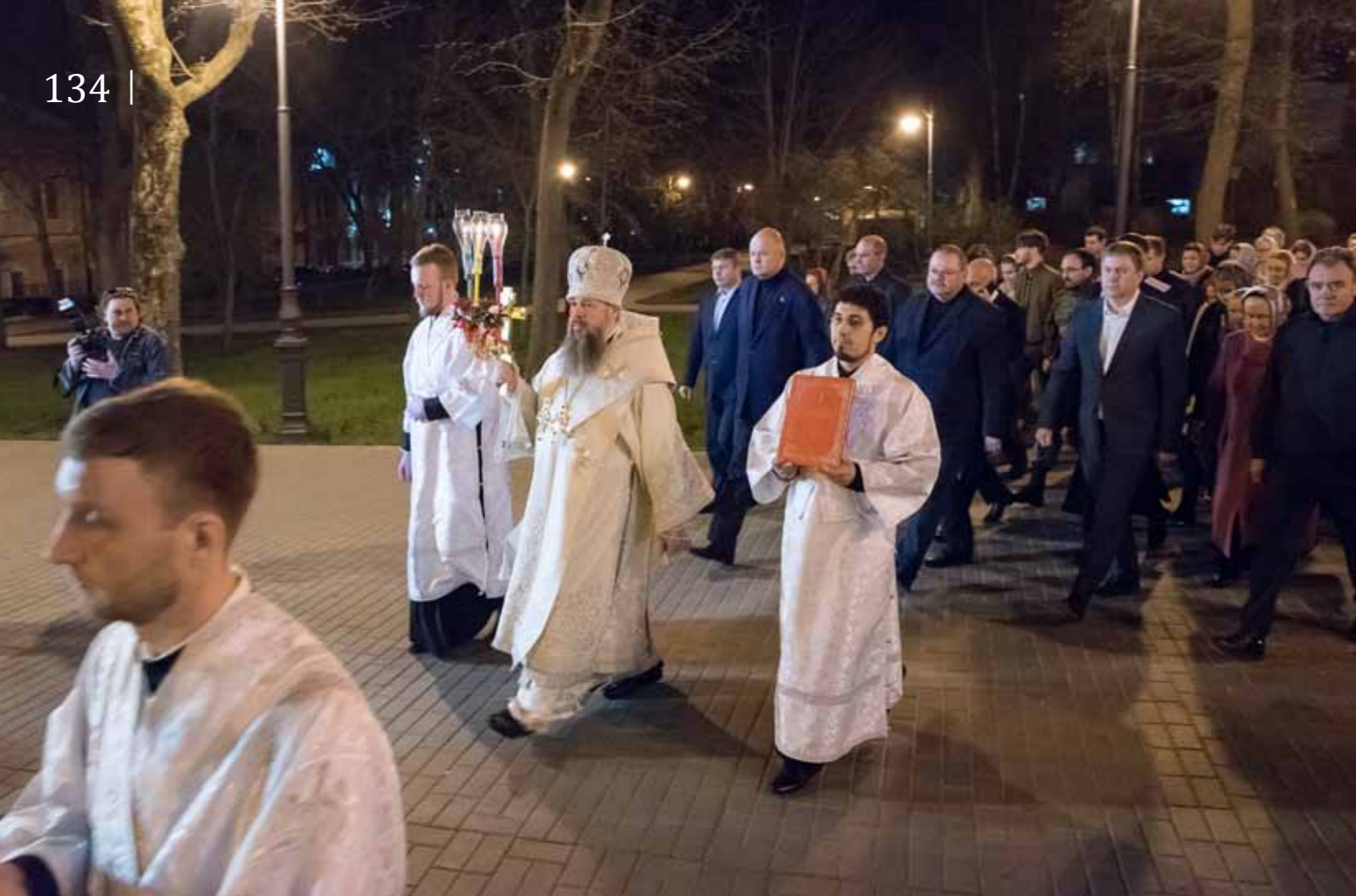
Крестный ход на Пасху. Спасский кафедральный собор. 24 апреля 2022 г.

Христовой всегда находилась в его сердце. И, невзирая на то, какие дни богослужбного года он переживал вместе со всей Церковью, в том числе и распятие Христа, и Его погребение, радость Воскресения всегда ободряла, укрепляла его в жизни. Самым главным плодом Воскресения Христова и является вот эта радость и любовь, которые должны согревать каждого человека в его жизни и наполнять эту жизнь совершенно новым смыслом.