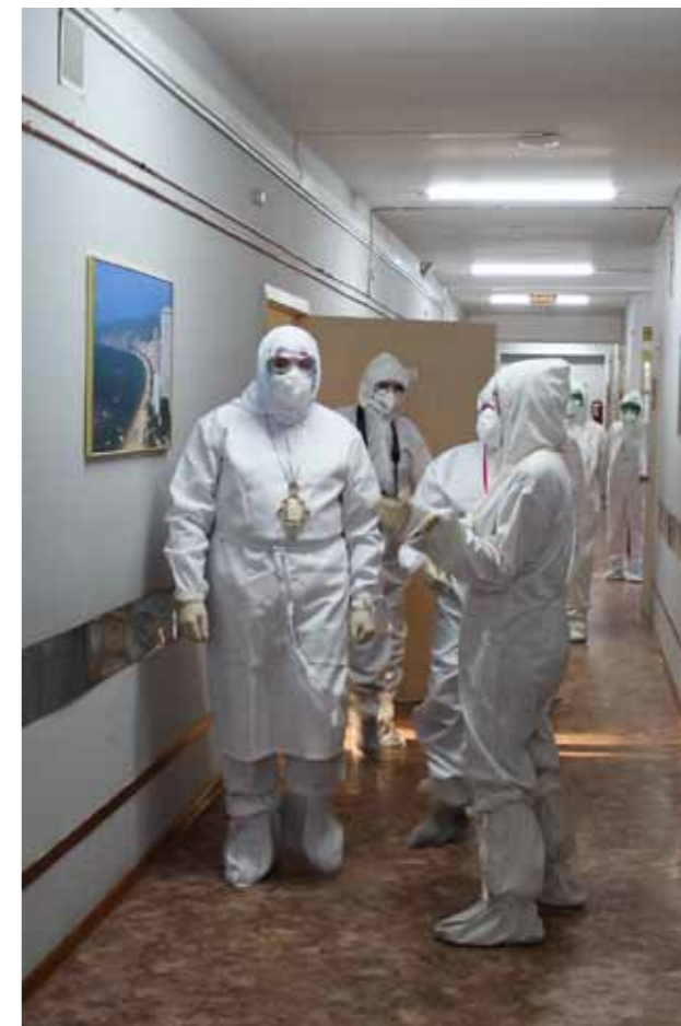
В «красной зоне» областной больницы. 19 января 2021 г.