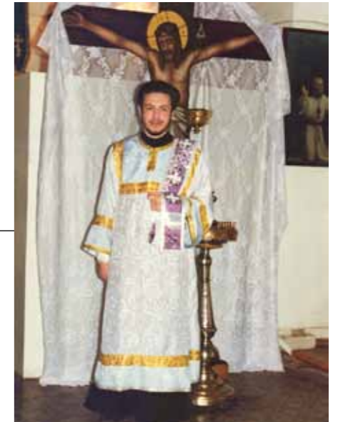
После диаконского сорокоуста. Каменка, начало сентября 1997 г.