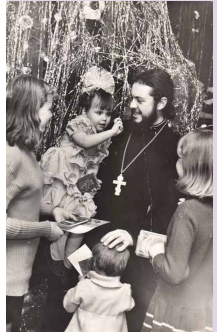
На рождественской елке в детском доме. 14 января 1999 г.

– Когда моему крестному сыну было года три, он по телевизору увидел случайно отрывок сериала «Мастер и Маргарита», как раз сцену Распятия Иешуа. И заинтересовался у меня, что происходит. Мне казалось: я так все красиво рассказываю, что Иисус Христос – Сын Божий, Он сошел на землю и погиб за людей. А ребенок дослушал и сказал мне: «А человек-паук всех спас и не погиб». Как детям объяснять религиозные истины доходчиво?