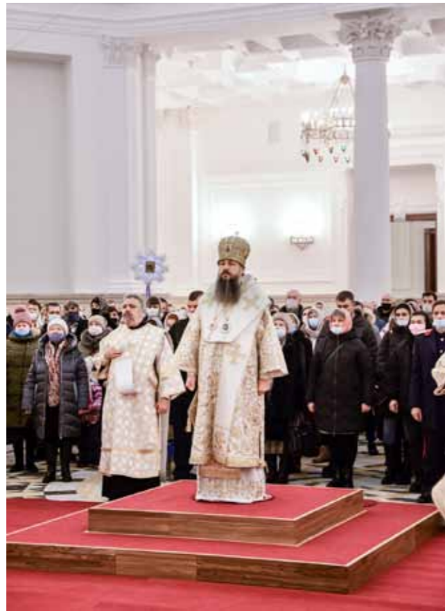
Первая литургия в восстановленном Спасском кафедральном соборе. Рождество Христово. 7 января 2021 г.

му. Если мы обратим взор на прошедшие 25–30 лет, то вместо двух храмов, которые находились в городе Пензе, сейчас уже построено 35 храмов, причём я не учитываю те церкви, которые у нас созданы при различных учреждениях. За эти 25 лет было сделано колоссально много, и это всё было в довольно-таки неблагоприятное время, и трудами тех людей, от которых порой не приходилось ждать, что они станут восстанавливать хра-