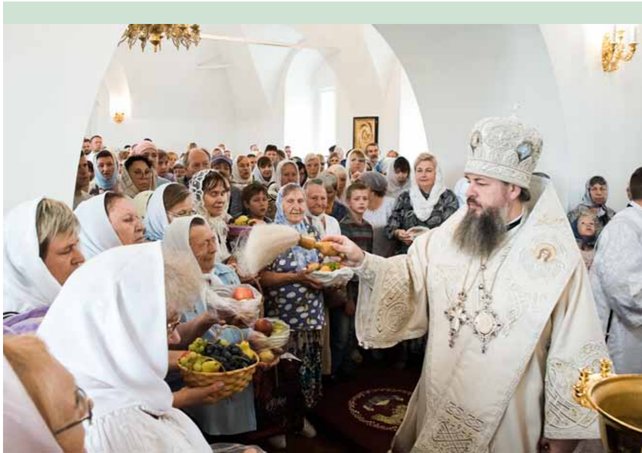
Преображение Господне. Освящение плодов. Спасо-Преображенский монастырь. 19 августа 2022 г.

и на какие-либо лишения. Для нас очень важно открыть свое сердце ко Христу тогда, когда мы это поймем и осознаем. И не только прием умом, но и докажем своими поступками. Потому что можно согласиться, что есть такая заповедь или есть такое предписание Церкви, да, оно совершенно справедливо, логично, – но самому так не поступать. Но Господь ждет от нас дел. Апостол Иаков говорит: « Вера без дел мертва » (Иак. 2:17). И если мы не будем свою веру подкреплять делами, то мы станем теми западными учеными, которые очень много знают о Христе, но совершенно не живут Его жизнью.