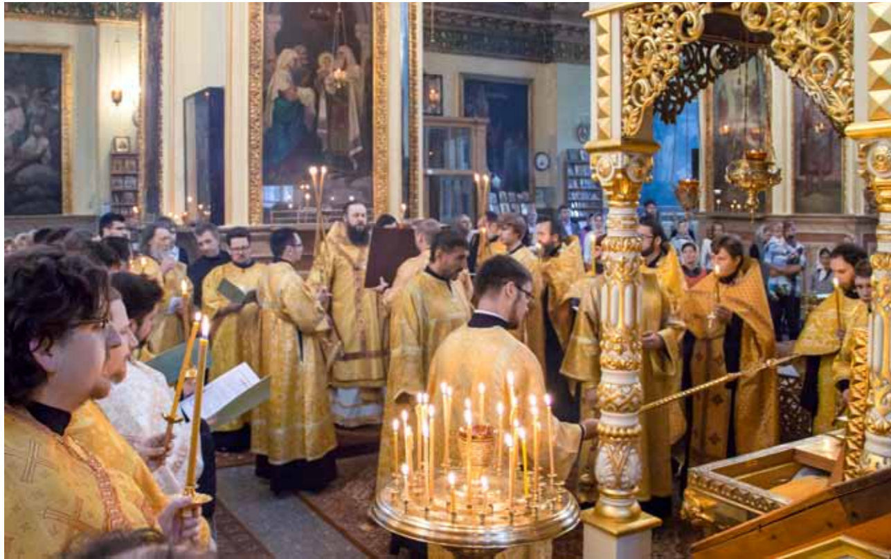
Возрождение традиции чтения акафиста святителю Иннокентию по средам. 18 июня 2014 г.