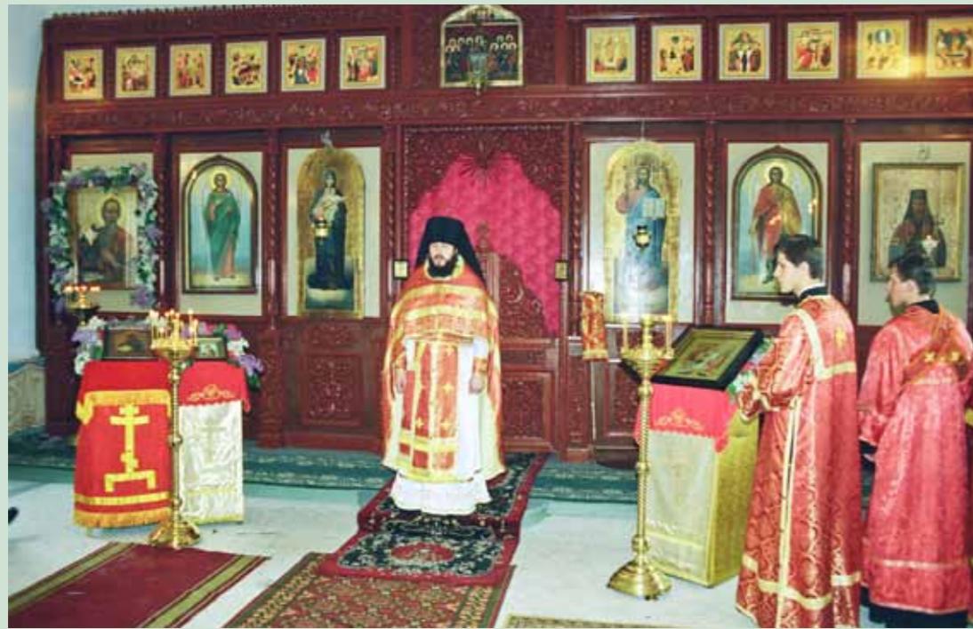
Освящение храма свт. Иннокентия Иркутского в здании духовного училища на проезде Водопьянова. 21 мая 2002 г.