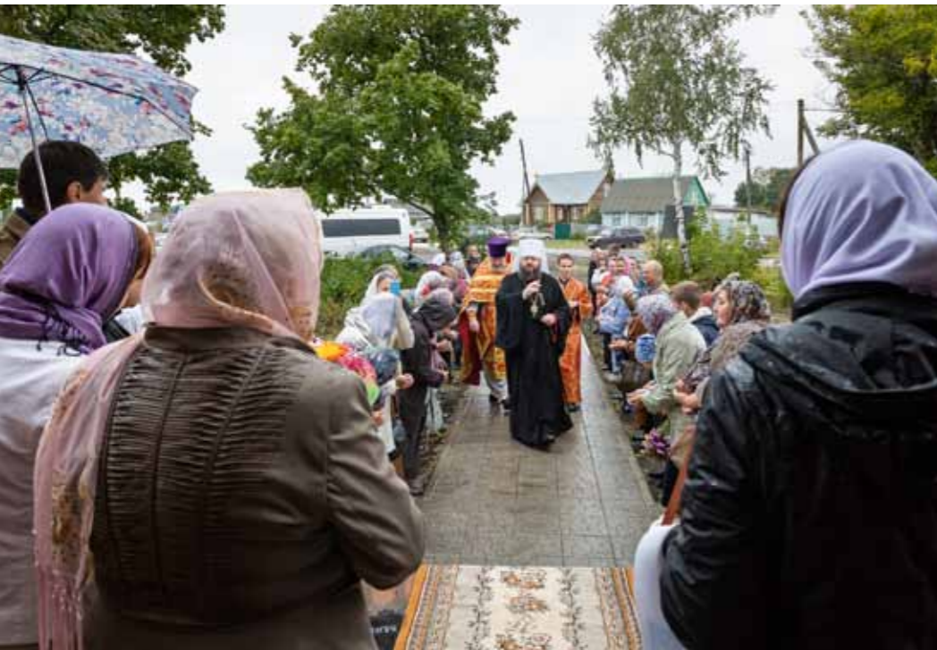
Оленевка. Перед освящением храма в честь св. Иоанна Оленевского. 11 сентября 2016 г.

– Слава Богу. Я считаю, что, конечно, десятилетие христианского воспитания во многих семьях и работа самого церковного общества привела к тому, что мы видим создающиеся приходы, которые живут нормальной приходской жизнью. Много меняется. Правда, не так скоро, как бы нам всем хотелось и желалось.