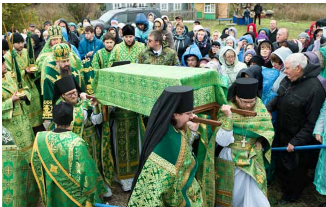
Прославление блаженного Иоанна Кочетовского. 6 октября 2018 г.

Я думаю, что это событие является центральным в 2018 году для нашей Пензенской митрополии, потому что оно открыло многим людям путь к этому святому, а через этого святого, безусловно, – и к Самому Христу. Поэтому те сотни паломников, которые теперь приезжают в Кочетовку, чтобы поклониться чест-