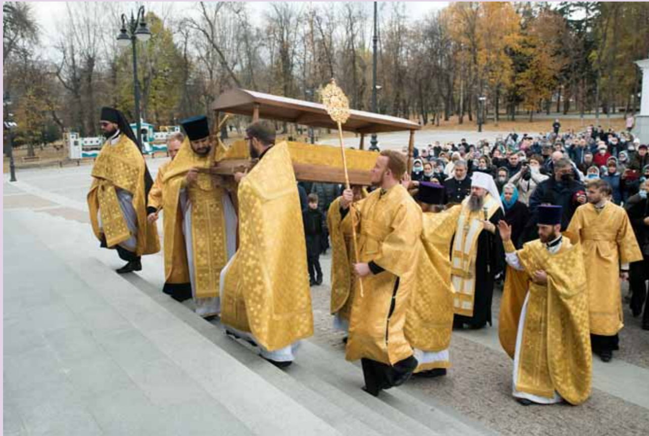
Перенесение мощей свт. Иннокентия в Спасский кафедральный собор. 17 октября 2021 г.

он тоже постарался объехать, – я понял: то, что мы стараемся делать сейчас, в данный момент, со своими возможностями – и техническими, и коммуникационными – совершенно другими, когда можно любого человека услышать и увидеть в секунду, – конечно, величина личности святителя Иннокентия в моих глазах возросла многократно – именно как такого, скажу популистским словом, трудоголика, человека, который чувствует необычайную ответственность за все, что он делает.