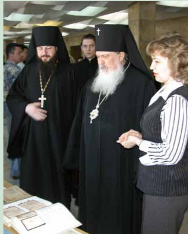
Кирилло-Мефодиевские чтения. 18 мая 2007 г.