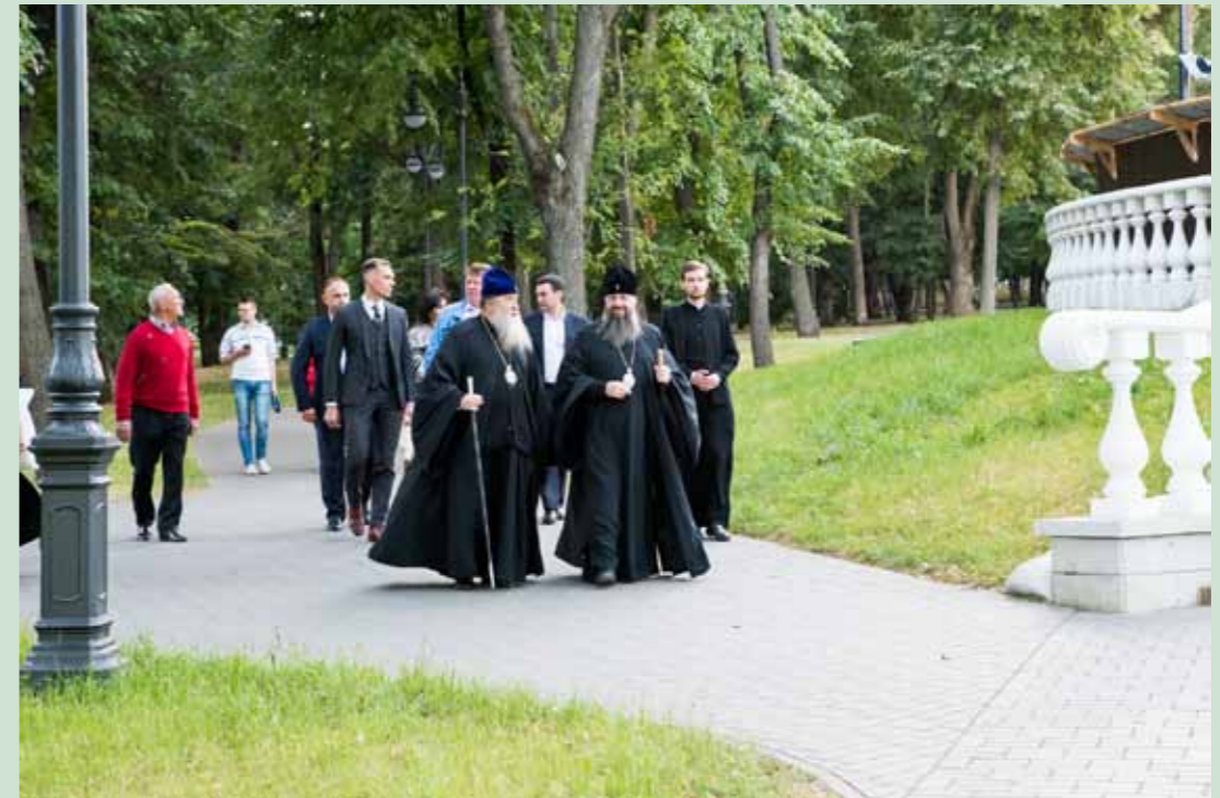
С митрополитом Оренбургским и Саракташским Вениамином у Спасского собора. 2 сентября 2020 г.

– Если мы вспомним строительство предыдущего соборного храма, который тоже строился очень долго, оно было сопряжено с более сложными обстоятельствами – Отечественной войной 1812 года, когда и наша столица была захвачена врагом и полностью разрушена, и когда пострадало очень большое количество народа в этой войне, и тем более – государство, но при всём том храм был построен. И я хотел бы привести в пример ту жизнь Церкви, на которую мы очень мало обращаем внимания. Ведь в нашем государстве Русская Православная Церковь начала восстанавливаться именно в переломные девяностые годы 20-го века, когда случилось несколько кризисов подряд в стране, когда был обвал собственной валюты, когда большинство людей оказалось за гранью прожиточного мини-