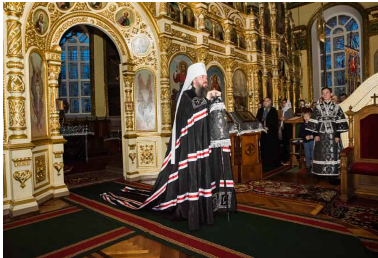
Чин прощения. Успенский кафедральный собор. 1 марта 2020 г.

Ведь на самом деле святость – это не удел избранных, не то, чтобы единицы, какие-то сверхъестественные люди становились святыми. Каждый человек по замыслу Божию предназначен к тому, чтобы быть святым. Прихожан, может быть, порой даже смущает такой возглас в конце литургии перед Причастием, когда священник поднимает Чашу с Те-