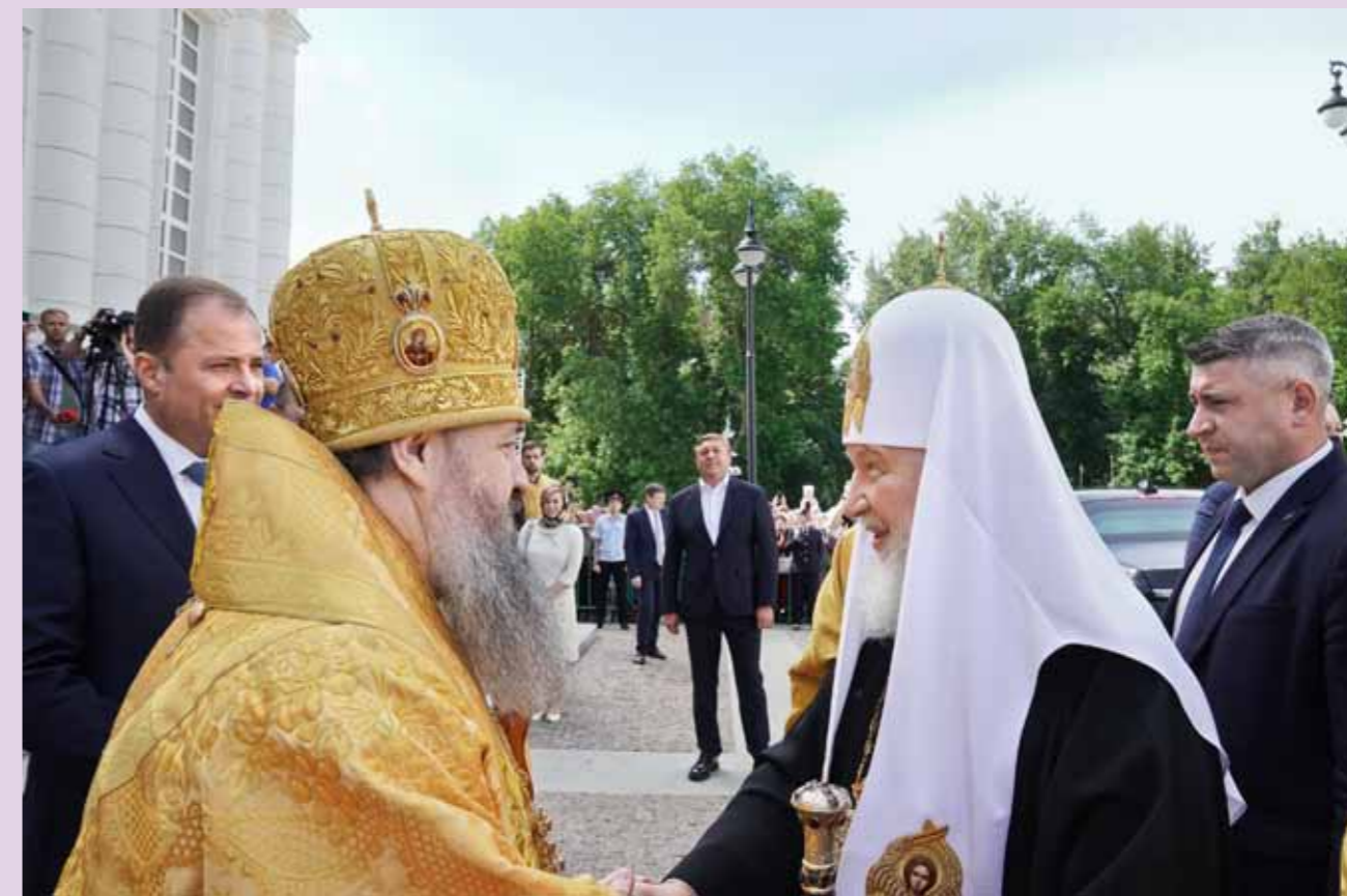
Встреча в Пензе Святейшего Патриарха Кирилла. 19 июня 2022 г.

– Я не буду в своем ответе оригинальным. Когда-то еще преподобному Серафиму Саровскому задавали подобный вопрос: «Батюшка, вы говорите, что все призваны к святости, почему сейчас не все к ней стремятся?» В нас, действительно, не хватает некоего дерзновения, не хватает воли к этому. Это, наверное, со-