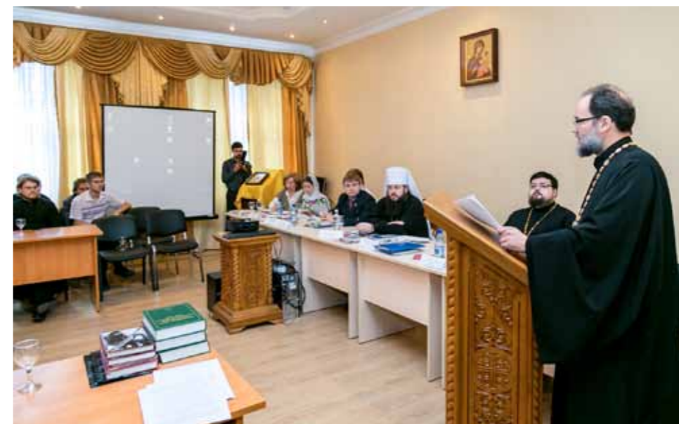
Первая конференция памяти новомучеников в духовной семинарии. 5 сентября 2014 г.

то даже смогли забыть: мы не знаем места, где они погребены, не знаем последних слов, которые они произносили перед своей смертью, и даже многие родственники не знают о существовании тех, кто был репрессирован в 30-е годы. Потому что это очень тяжело, когда у человека в семье был «враг народа» – тогда закрывался путь и в образовании, и в карьере, если человек не отказывался от этих родственников; и люди вынуждены были отказаться от своих родных, забыть их имена, и ни детям, ни внукам не рассказывать, что в их семье был