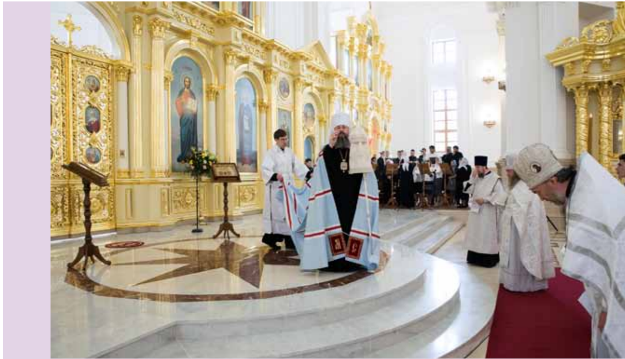
Собор святых Пензенской митрополии. Литургия в Спасском кафедральном соборе. 12 июня 2021 г.

– Я отвечу очень кратко – мы будем всё для этого делать. Я думаю, что в этом состоит мой долг как архипастыря. Почему было решено установить это празднование? Не для того, чтобы появился еще один праздник в нашем церковном календаре, а именно для того, чтобы люди узнали, кто же вообще святые, связанные с Пензенской землей.