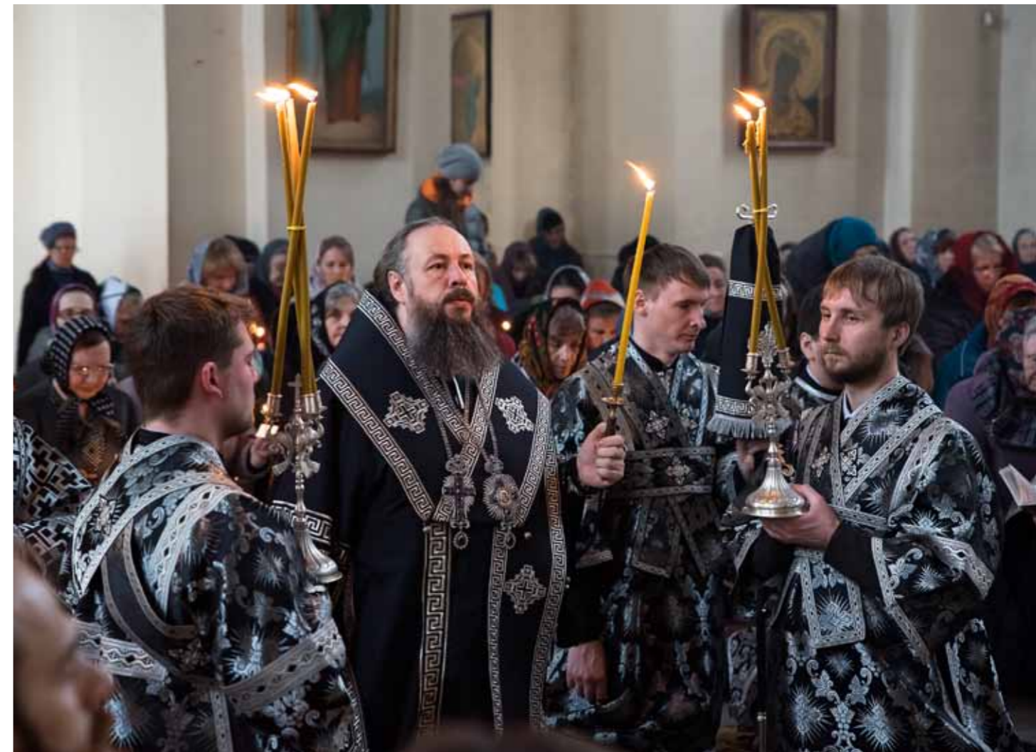
Неделя Крестопоклонная. Петропавловский храм Пензы. 31 марта 2019 г.