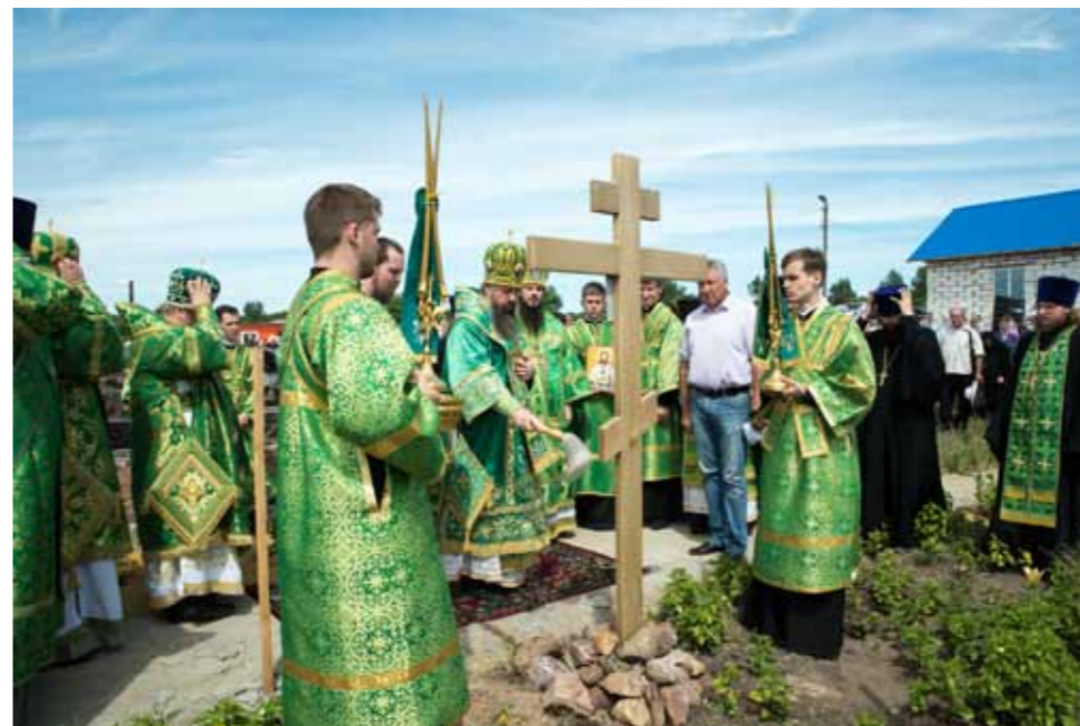
Закладка нового храма в Кочетовке. 25 июня 2019 г.

ным мощам Иоанна Кочетовского, помолиться в небольшом сельском храме, – получают особую благодатную поддержку. И сейчас уже есть масса свидетельств о том, что именно прославление этого святого подвигло многих людей к новому взгляду на подвижников благочестия, которые прославлены и не прославлены у нас в Пензенском регионе. Я хотел бы сказать, что у нас есть еще работа в этом направлении, и мы надеемся, что это – первая канонизация за два десятилетия, но не последняя.