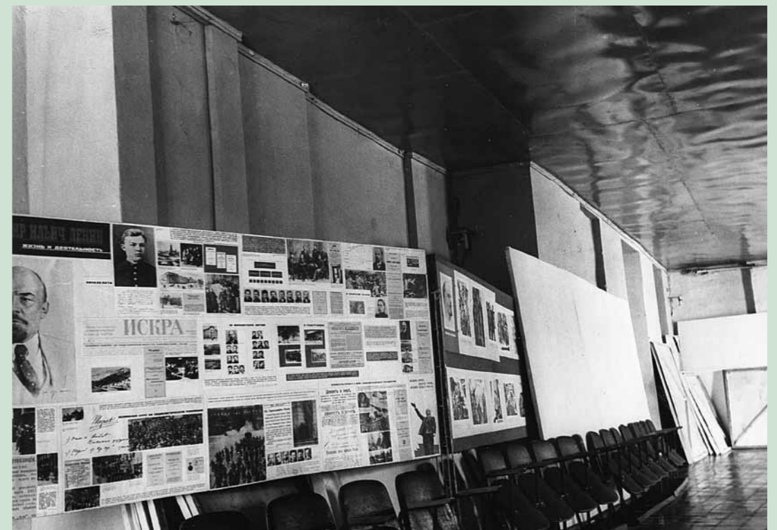
Дом культуры – бывший Димитриевский храм в Каменке. 1981 г.