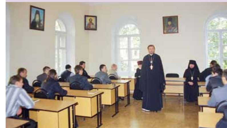
Обращение ректора духовного училища к первым воспитанникам. 1 сентября 2000 г.