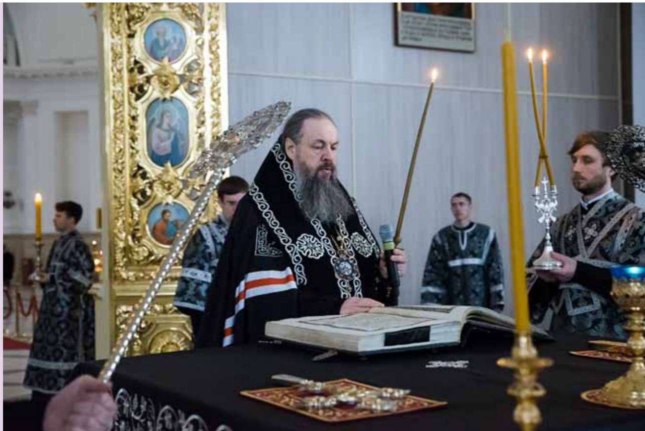
Великий Понедельник. Спасский кафедральный собор. 18 апреля 2022 г.

зу тебе. Но ведь можно понимать, что надо простить, – и при этом все равно где-то в глубине души не получается. Что делать?