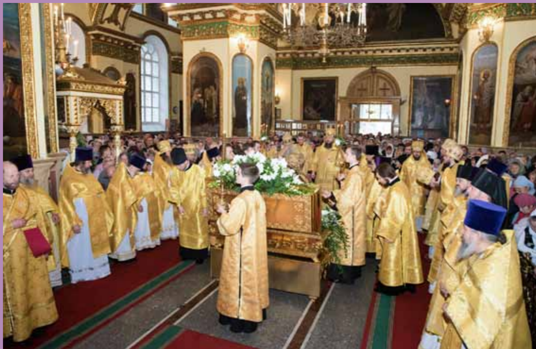
Торжества в честь 200-летия преставления свт. Иннокентия. Успенский кафедральный собор. 23 октября 2019 г.