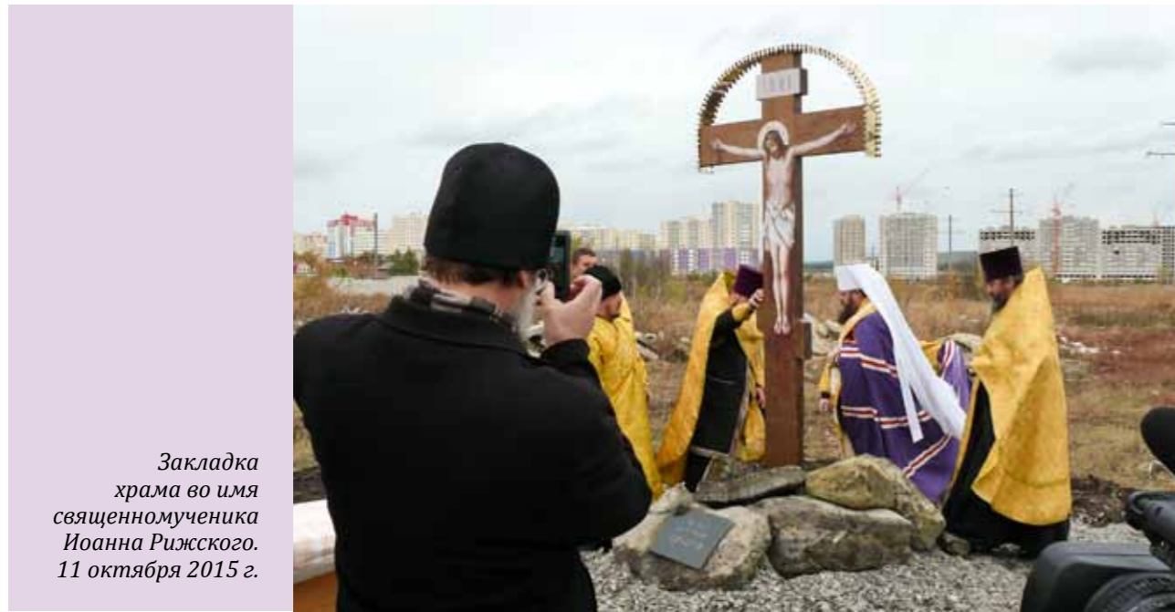
Закладка храма во имя священномученика Иоанна Рижского. 11 октября 2015 г.