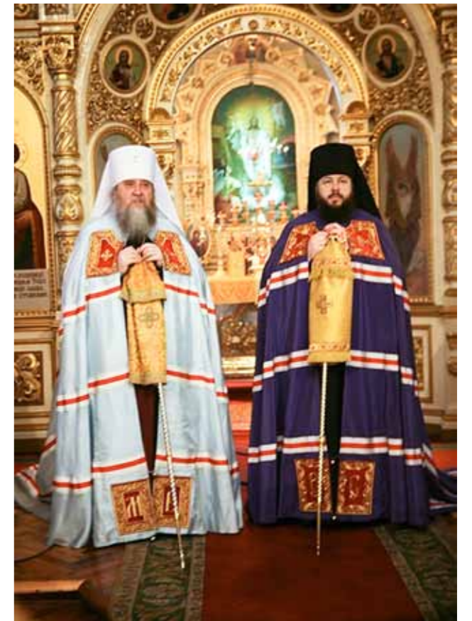
Вступление в управление Пензенской епархией. С митрополитом Вениамином после литургии в Успенском кафедральном соборе. 5 января 2014 г.

– Владыка, а как Вы будете строить отношения с людьми, которые были Вашими