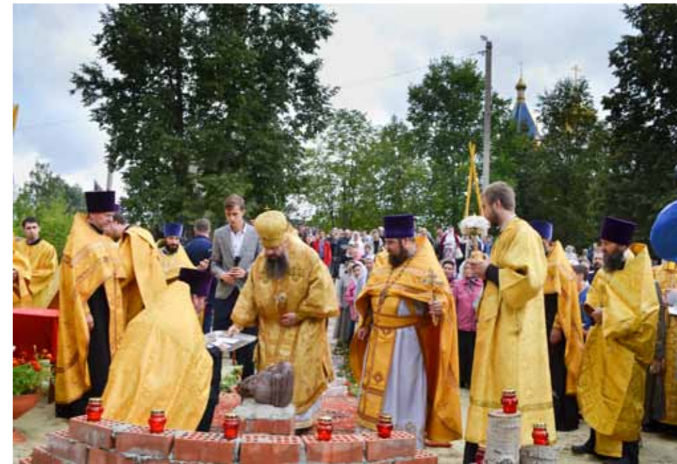
Закладка мемориала «Кузнецкая Голгофа» у Дуванного оврага в Кузнецке. 4 августа 2019 г.

– Как мне кажется, сейчас наблюдается общемировая тенденция к сглаживанию острых углов. Отсутствие определения четких рамок добродетели и греха приводит к тому, что уроки столетия для нас становятся смазанными. Сейчас из политической толерантности мы вновь начинаем говорить о том, какой неплохой был правитель Сталин, что и у него замысел был неплохой. Но на самом деле мы должны честно и откровенно говорить о том, что в этом горниле испытаний России погибли миллионы людей, сотни из них были цветом нашей нации; о том, что погибло огромное количество нашего духовного наследия, были