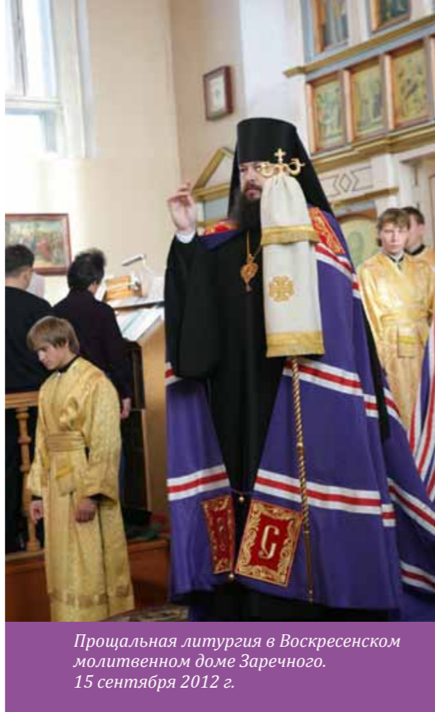
Прощальная литургия в Воскресенском молитвенном доме Заречного. 15 сентября 2012 г.

Для жителей Пензенской области не секрет, что Кузнецк – город с серьезным православным потенциалом. Приснопамятный иеромонах Феофан (Гудков), который возобновил духовную жизнь Вознесенского кафедрального собора, заложил хорошие традиции. Есть прекрасная воскресная школа, православное телевидение, работают библиотеки, ведется хоро-