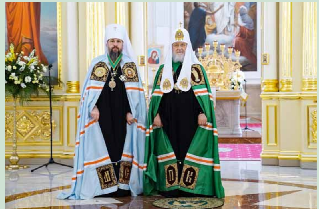
Награждение орденом прп. Сергия Радонежского II степени. Спасский кафедральный собор. 19 июня 2022 г.