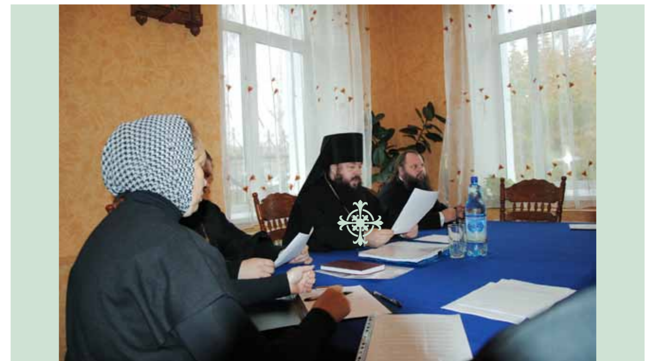
Первое епархиальное собрание. 25 октября 2012 г.

Внутренней готовности к епископству у меня не было. Хотя, когда я беседовал с Па-