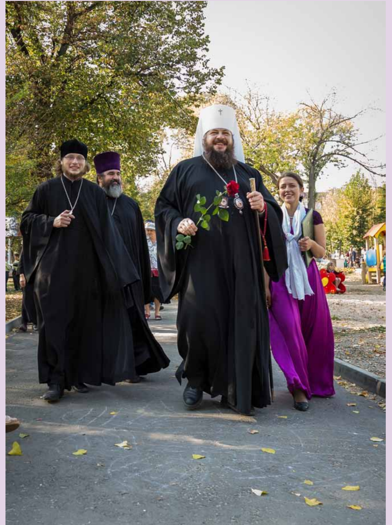
Первый фестиваль «Спасские вечера». 26 сентября 2015 г.