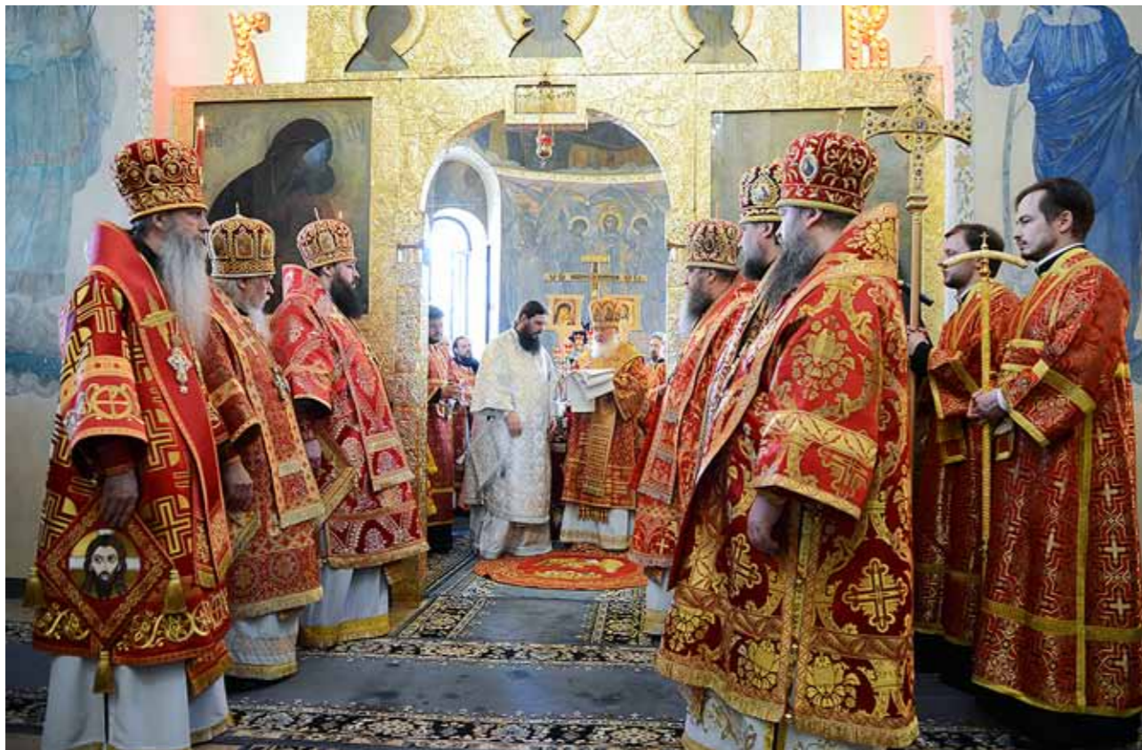
На архиерейской хиротонии епископа Кузнецкого и Никольского Нестора. Марфо-Мариинская обитель Москвы. 18 мая 2014 г.

– Архиерей должен общаться с народом или же это все-таки дело приходских священников?