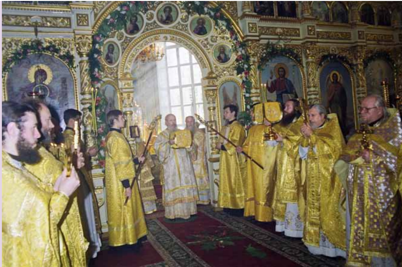
Святейший Патриарх Алексий II в Успенском кафедральном соборе. Первый слева – ключарь собора иеромонах Серафим (Домнин). 2 октября 1999 г.

рая через его назначение совершается. И когда он меня поставил ключарем собора, я видел в этом свое послушание и никогда не стремился к тому, чтобы в своей жизни что-либо изменить. У меня были попытки уйти в монастырь, я с владыкой разговаривал об этом, но он мне тогда предельно ясно и строго сказал: твое послушание такое, и ты должен его исполнять.