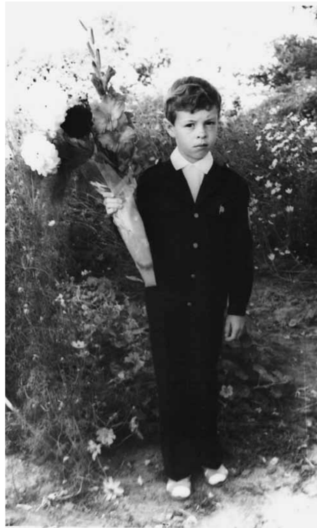
Второй класс. 1 сентября 1985 г.

организовывал совместные паломнические поездки и по-настоящему радел о том, чтобы мы потихоньку совершенствовались. И всем этим желание поступить в семинарию и стать священнослужителем подкреплялось, безусловно.