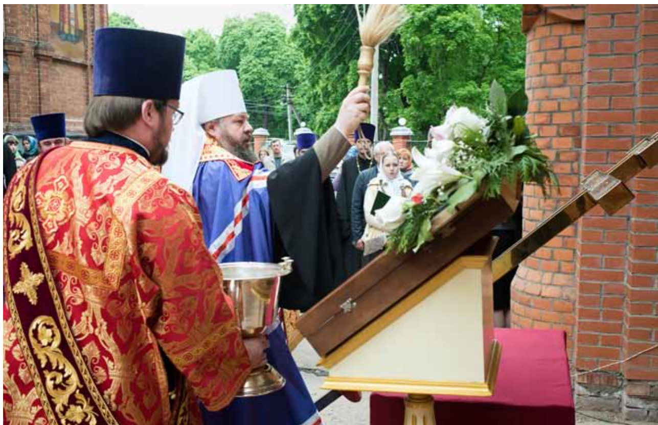
Освящение купола на храм-усыпальницу великомученика Димитрия Солунского. 21 мая 2017 г.