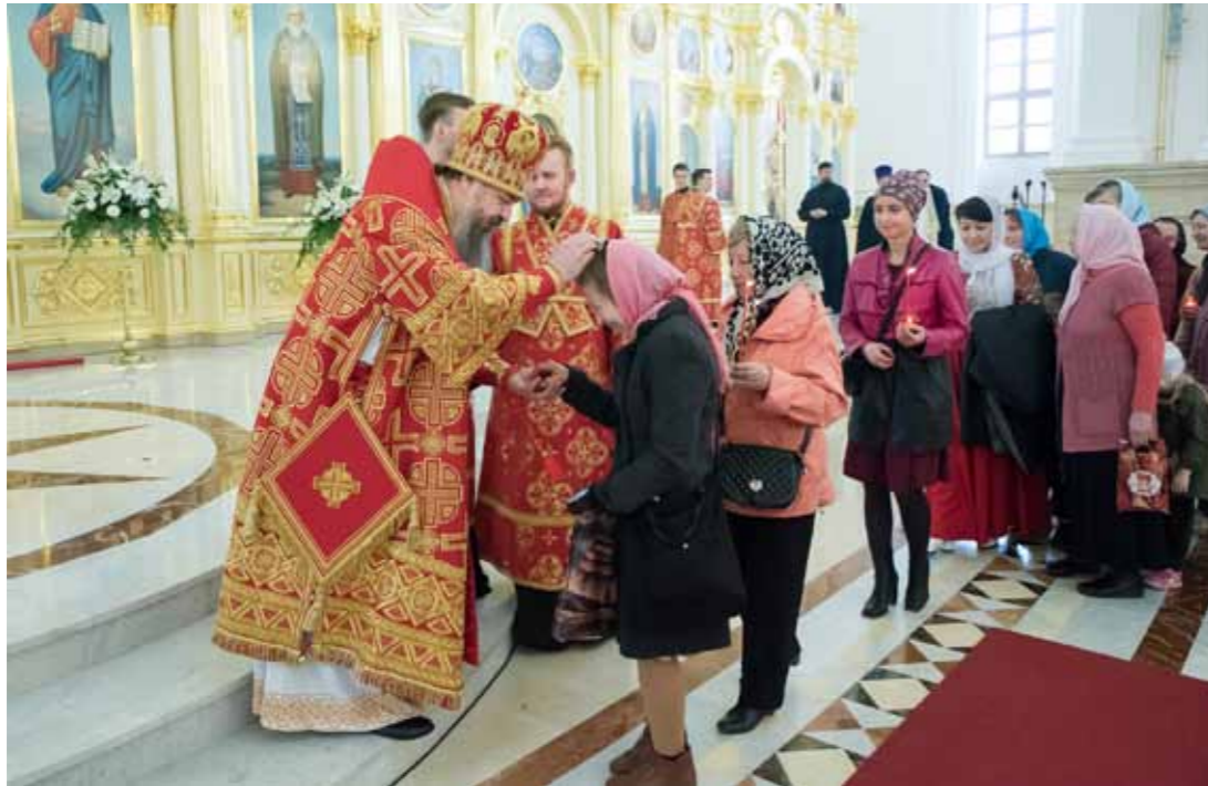
Великая пасхальная вечерня. Спасский кафедральный собор. 24 апреля 2022 г.

го того, что произошло в эти дни. Почему? Потому что это осознание дает ему возможность не бояться смерти. Он четко понимает, что смерть – это временное состояние его тела, которое не затрагивает ни его душу, ни его смертную участь.