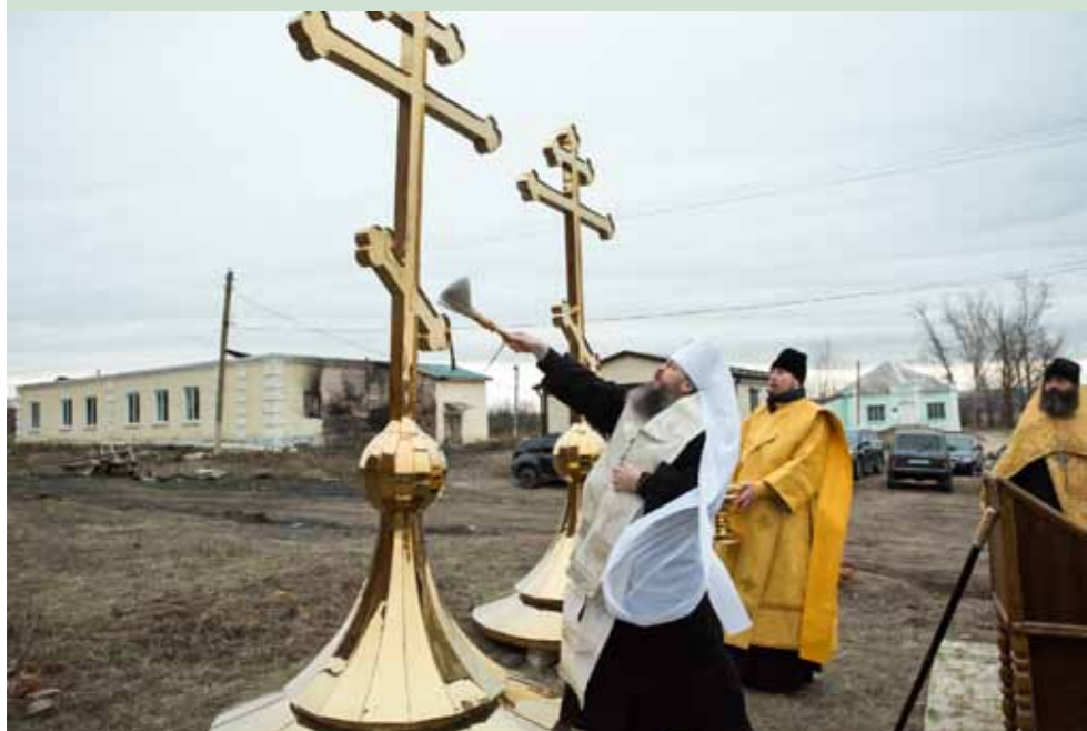
Освящение крестов и куполов Троицкого храма с. Михайловка Мокшанского района. 28 ноября 2019 г.

и читают, и слышать не только перевод этих молитвенных возгласов, но и знать догматическое учение, хорошо знать Священное Писание, катехизис. Общине надо заботиться о такого рода просвещении.