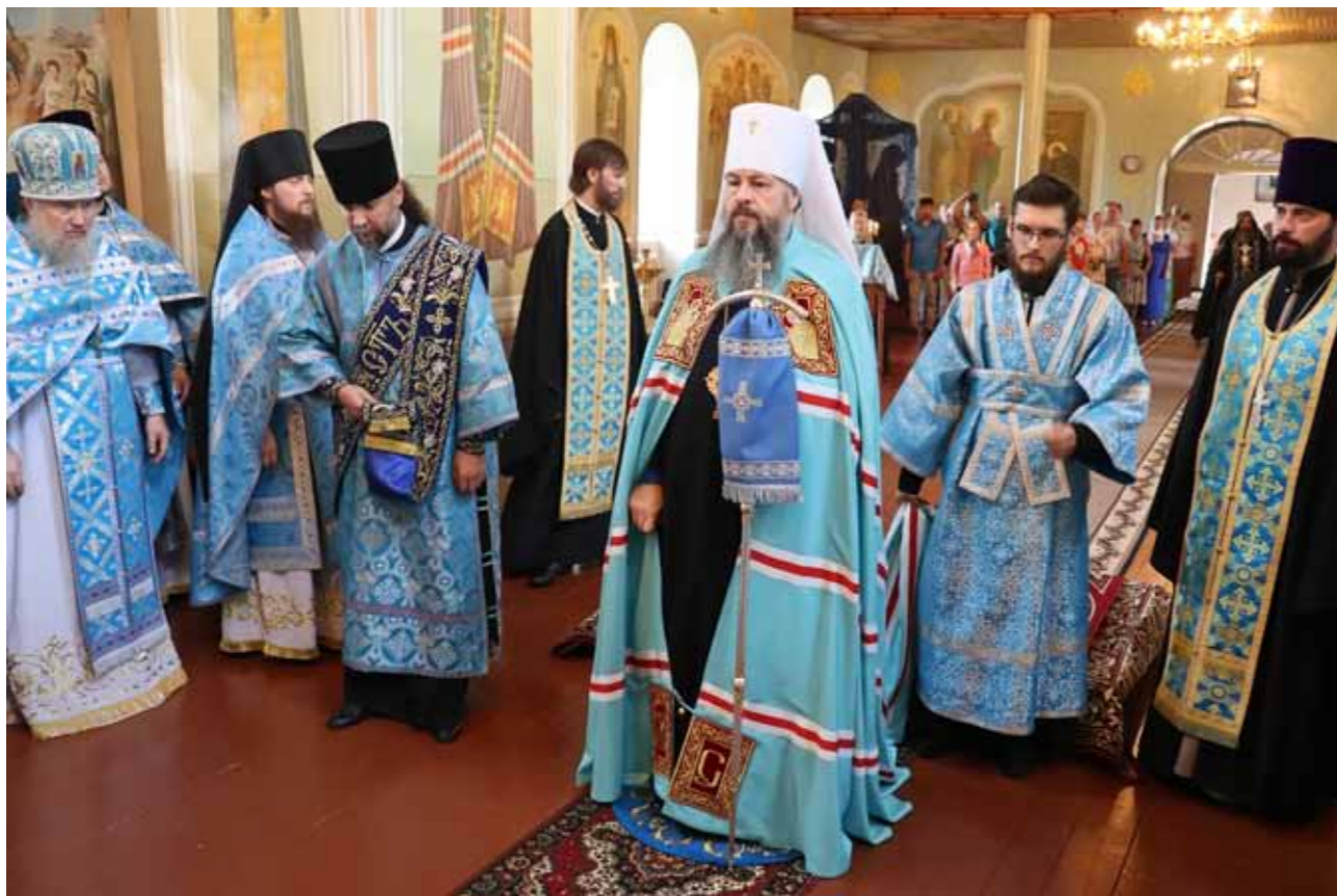
340-летие явления Тихвинской иконы во граде Керенске. Тихвинский собор Керенского Тихвинского моанстыря. 16 июля 2021 г.