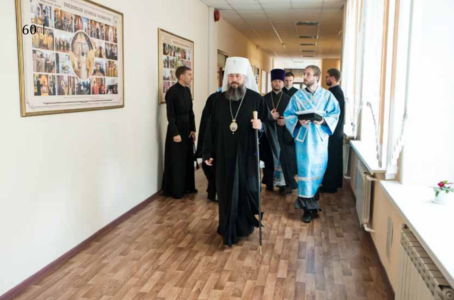
Начало учебного года в духовной семинарии. 1 сентября 2019 г.