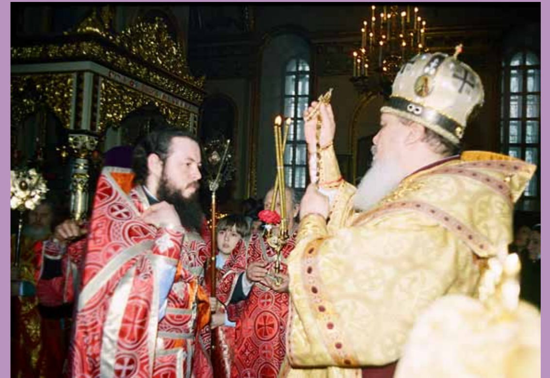
Награждение наперсным крестом золотого цвета. Собор Новомучеников и исповедников Российских, 10 февраля 2002 г.