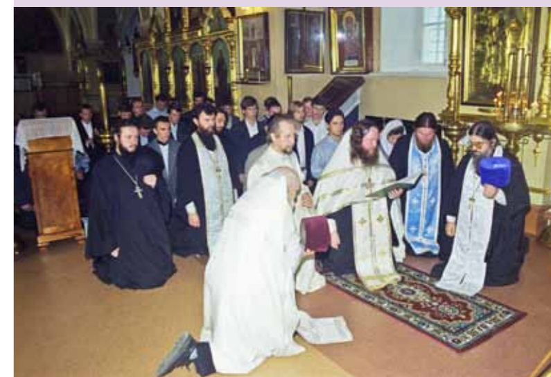
Молебен перед Казанской-Пензенской иконой Божией Матери в Митрофановском храме. 1 сентября 2000 г.