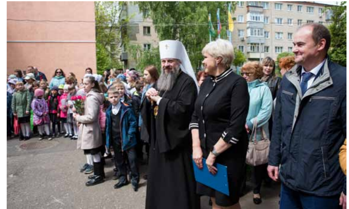
«Последний звонок» в православной гимназии. 25 мая 2022 г.

Это могут быть совместные выезды на отдых, обмен опытом. Сейчас же в обществе сложился стереотип, что многодетная семья – это