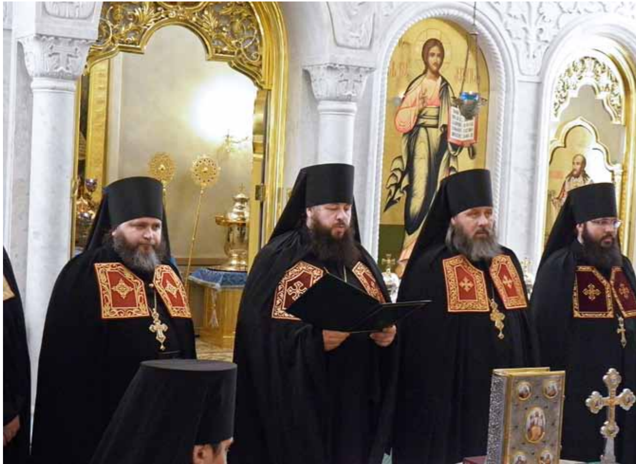
Чин наречения во епископа. 31 августа 2012 г.

– Что для Вас значит новый высокий сан, с какими чувствами приступаете к архипастырскому служению?