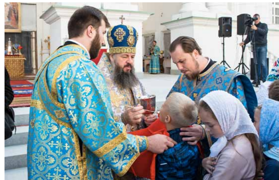
«Детская» литургия перед началом учебного года у стен Спасского кафедрального собора. 31 августа 2019 г.

– Это одно из самых сложных направлений. Не только для Церкви, но и для государства. Потому что молодежь традиционно находится в каких-то протестных настроениях и, собственно говоря, имеет желание как-то себя реализовать по-иному, не как родители. И это известная проблема отцов и детей. Поэтому иногда здесь старые методы не подходят, хотя и оставлять их мы тоже не думаем, так как и в молодежной среде совершенно по-разному относятся и к Церкви, и к вере.