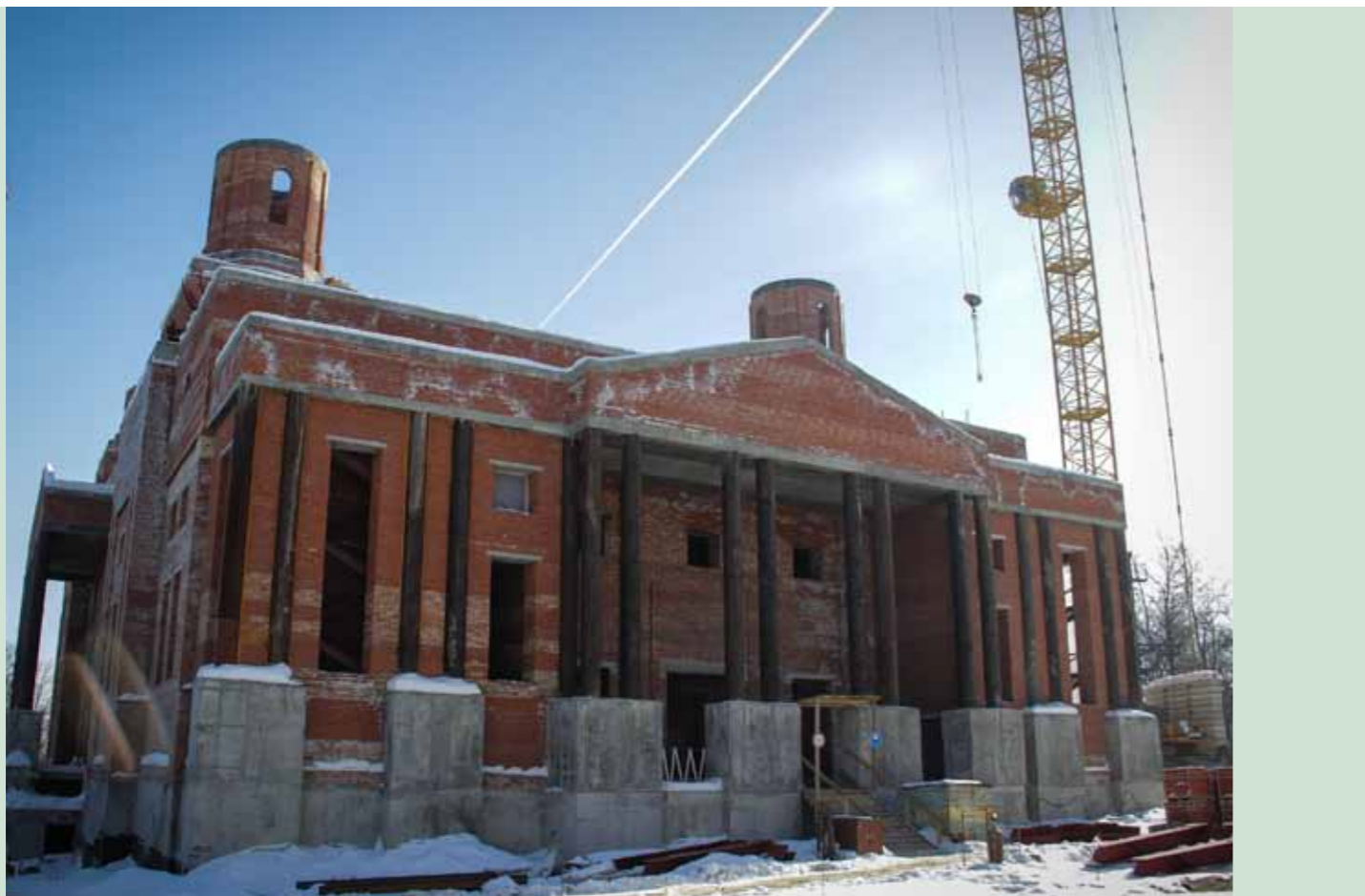
Таким был Спасский собор на момент вступления митрополита Серафима в управление Пензенской епархией. 27 февраля 2014 г.