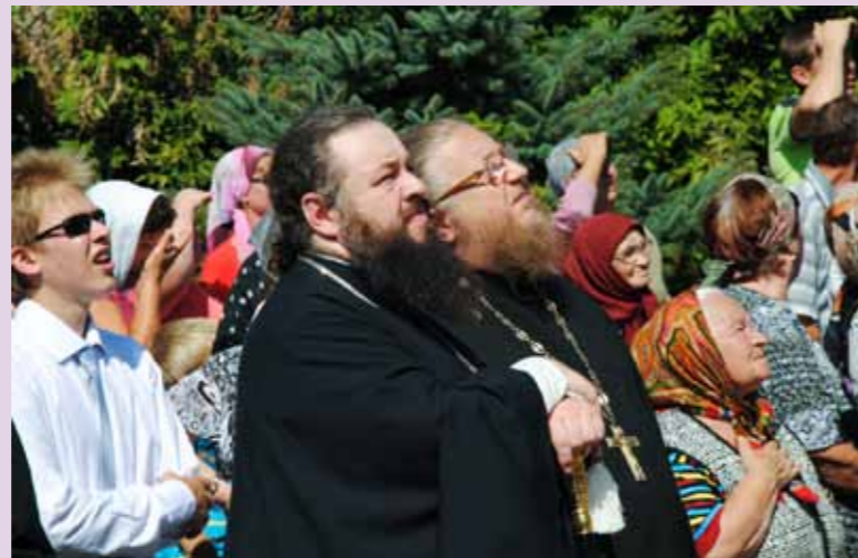
Подъем креста и купола на строящийся храм в Евлашево. 2 августа 2013 г.