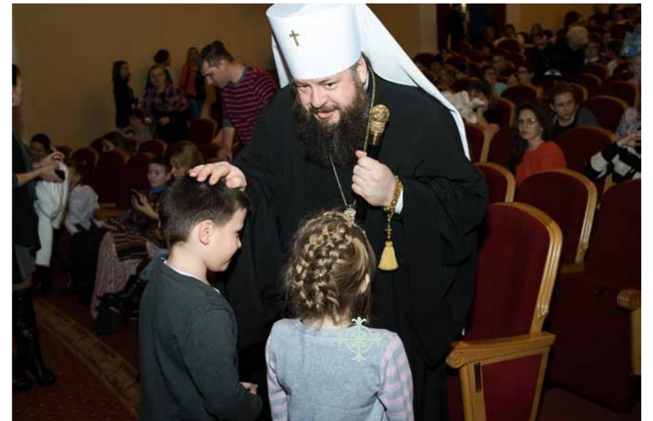
Архиерейская елка в драмтеатре. 9 января 2017 г.

Вторая, далеко идущая вперед задача – с ранних лет в детях, которые действительно имеют талант к пению, к музыке заложить навыки именно церковного пения. Они подрастут, пойдут получать дальнейшее образование в музыкальном училище или даже в регентской школе, а потом вернуться в наши храмовые хоры. Я считаю, сейчас огромная беда в том, что у нас в храмах поют профессионалы. Не хочу никого обидеть, они действительно профессионалы в музыке, но к церковному пению большинство из них имеет очень стороннее отношение. А ведь при всей внешней красоте исполнения они должны еще собой олицетворять ангельское пение. Они могут изобразить что-то очень хорошо, но только лишь изобразить. А когда это не проходит через сердце... Вот это профанирование ангельского пения, по-другому не могу сказать, для Церкви губительно. Поймите правильно мое рассуждение. Священник, хор, прихожанин – это все единая связь. Я знаю таких людей, которые по 10–20 лет поют в хоре, но вообще не знают и не понимают, о чем. Это, конечно, беда еще