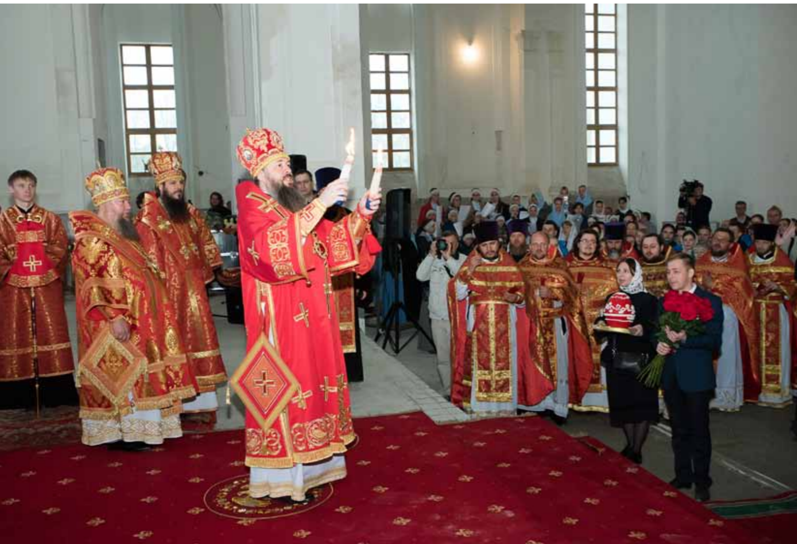
Первая великая пасхальная вечерня под сводами Спасского собора. Благодатный огонь из Иерусалима. 28 апреля 2019 г.

ний. Следуя евангельскому призыву о том, чтобы «правая рука не знала о том, что делает левая», без огласки и афиширования своей жертвы многие приносят деньги и в храмы, и в те кружки, которые установлены в торговых центрах. Я очень признателен и благодарен этим людям за то, что они своим отзывчивым сердцем не оскудевают в своей помощи. За три года, которые я фактически управляю Пензенской епархией, я могу констатировать, что из года в год люди увеличивают свои пожертвования на восстановление Спасского кафедрального собора.