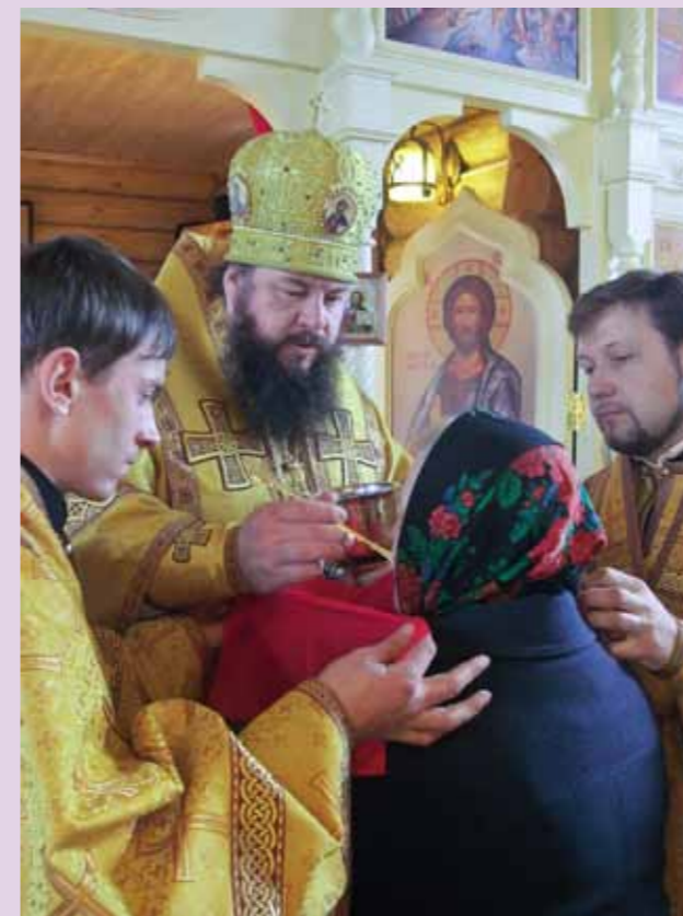
Литургия в с. Малая Садовка Сосновоборского района. 20 октября 2013 г.