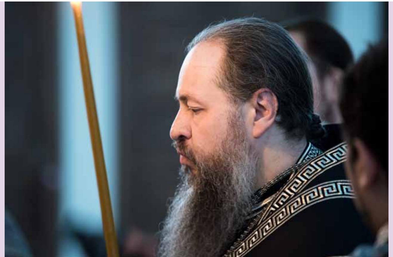
Чтение 12-ти Евангелий. Спасский кафедральный собор. 21 апреля 2022 г.

Конечно, я противник крайних мер, когда весь вест пост сводится к тому, что мы не упо-