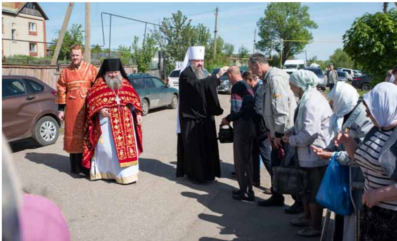
Встреча у Сергиевского храма Соловцовки. 31 мая 2022 г.