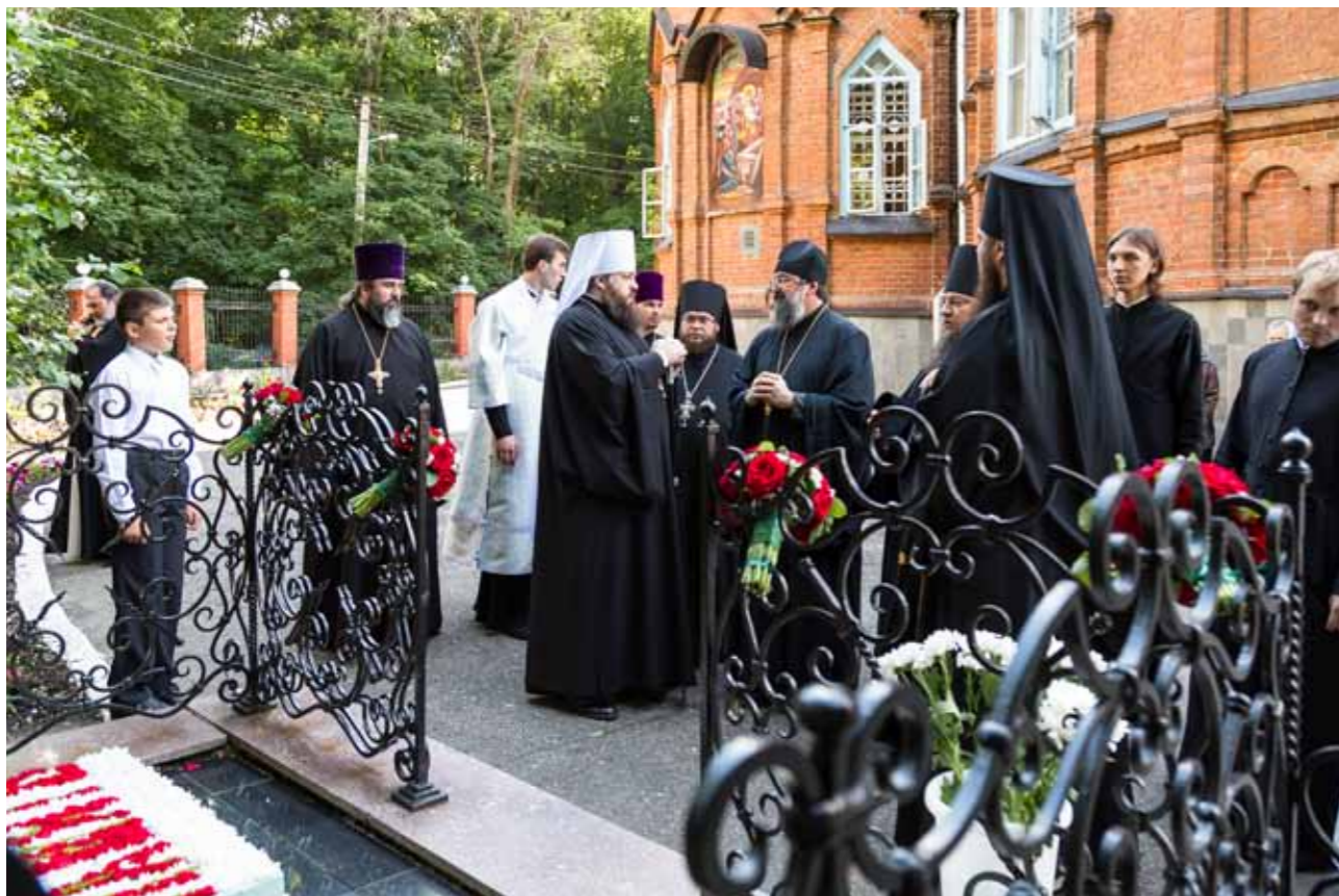
На могиле архиепископов Феодосия и Серафима с архиепископом Сурожским Елисеем (Ганабой) и другими почетными гостями епархии. 2 июля 2015 г.

кие праздники, как Татьянин день, Сретение – день православной молодежи. Я помню, как мы с ним выезжали в педагогический и политехнический вузы, и это были не просто какие-то лекции, это были ответы на вопросы, которые интересовали молодежь. Это была очень хорошая площадка для общения.