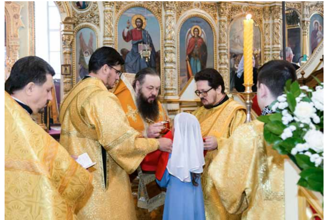
Архиерейский детский хор через несколько месяцев после создания уже принимал участие в богослужениях. Успенский кафедральный собор, 1 марта 2015 г.

– Конечно, Христос говорил не о том, что мы должны быть беззаботными или воспринимать все детским разумом. Прежде всего, речь идет о детской простоте, о той любви, которую испытывает ребенок, и которую порой не можем испытывать мы. К примеру, как дети быстро все прощают и забывают. Отвлек ребенка на что-то – и он уже не помнит никакой обиды. Ребенок все воспринимает чистым сердцем. Порой мы долго думаем, как сказать и что сказать, а у ребенка сразу – что на уме, то он и сме-