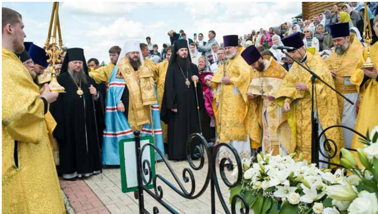
Панихида по блаженному Иоанну Кочетовскому на его могиле. 25 июня 2017 г.

В 2018 году по решению Священного Синода к лику местночтимых святых был причислен блаженный Иоанн Кочетовский (Паташев) – подвижник из села Кочетовка Каменского района. Его мощи были обретены и положены в сельской церкви.