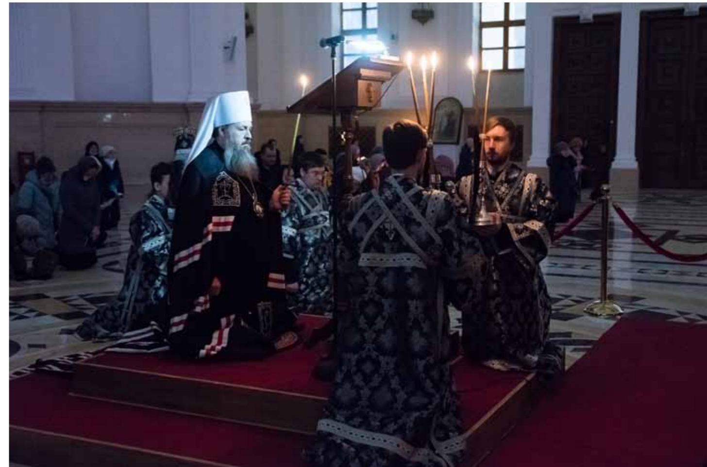
Повечерие с чтением великого покаянного канона Андрея Критского. Спасский кафедральный собор. 7 марта 2022 г.

лом и Кровью Христовыми и говорит: «Святая – святым!» Но это естественно, что святость должна принадлежать только святым, поэтому стремление каждого человека к святости естественно. И поэтому человек, который вступает на дорогу борьбы, должен всецело себя этому посвятить и достичь святости.