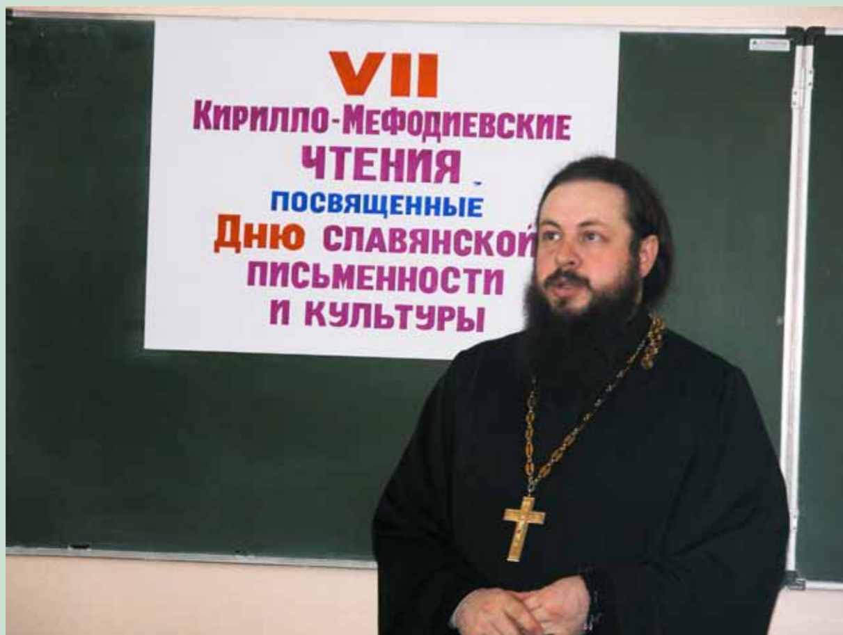
Кирилло-Мефодиевские чтения. 23 мая 2007 г.