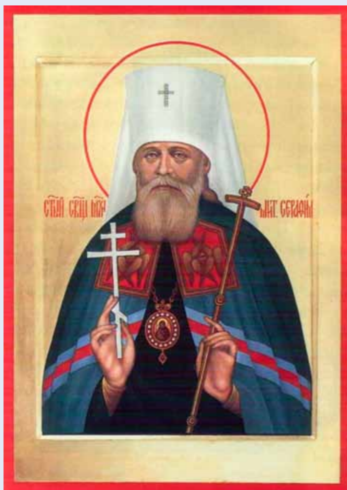
Священномученик Серафим (Чичагов; 1856–1937)