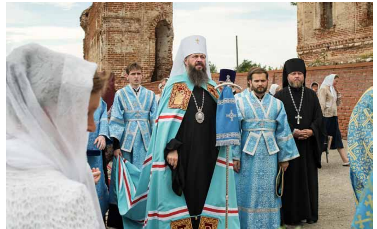
Летняя Казанская. Всенощное бдение в Нижнеломовском Богородице-Казанском монастыре. 20 июля 2018 г.

– Я отвечу на этот вопрос философски. Конечно, можем. На самом деле, мы очень часто забываем простые христианские постулаты: нам кажется, что нужно объединять силы, как-то кому-то противостоять. Но я уверен больше в том, что путь всех святых, которые укрепили и молились за Россию, – он самый верный.