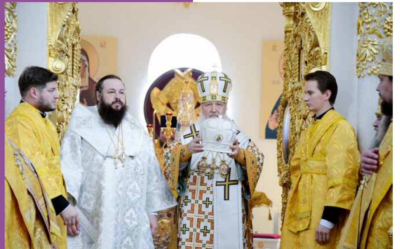
Архиерейская хиротония. 12 сентября 2012 г.

Но я надеюсь, что мы вместе с духовенством Кузнецкой епархии сможем все преодолеть. Потому что христианство – это все-таки не просто система административного управления. Это, прежде всего, ду-