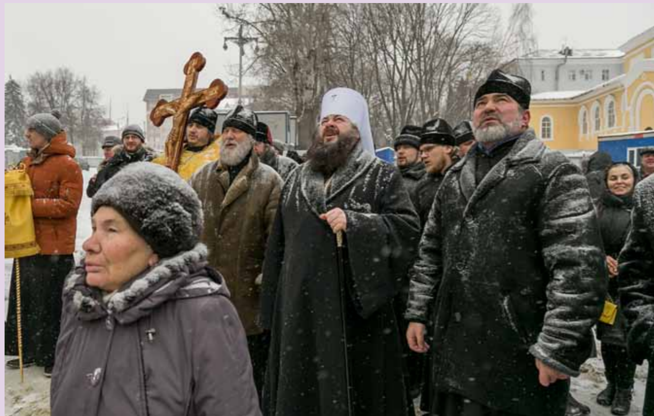
Освящение и подъем центрального купола. 28 декабря 2014 г.