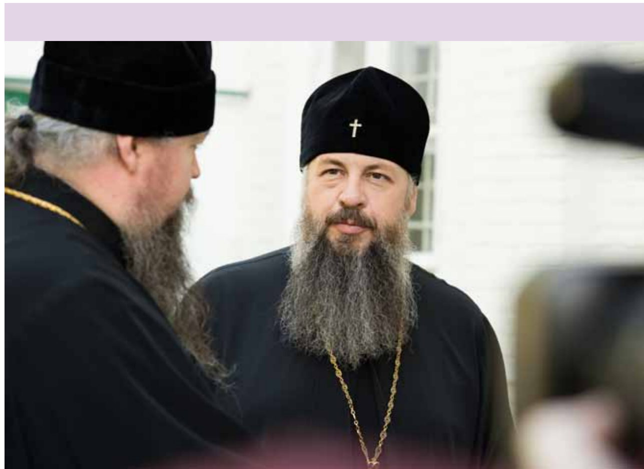
С митрополитом Воскресенским Дионисием. 7 сентября 2020 г.

– Сейчас мы всё больше убеждаемся в том, что требования народа и духовные потребности – не в том, чтобы построить храм, куда можно было бы ходить, и не в том, чтобы эти храмы были красиво украшены и священники говорили с амвона красивые проповеди. Сейчас действительно для многих людей требуется ис-