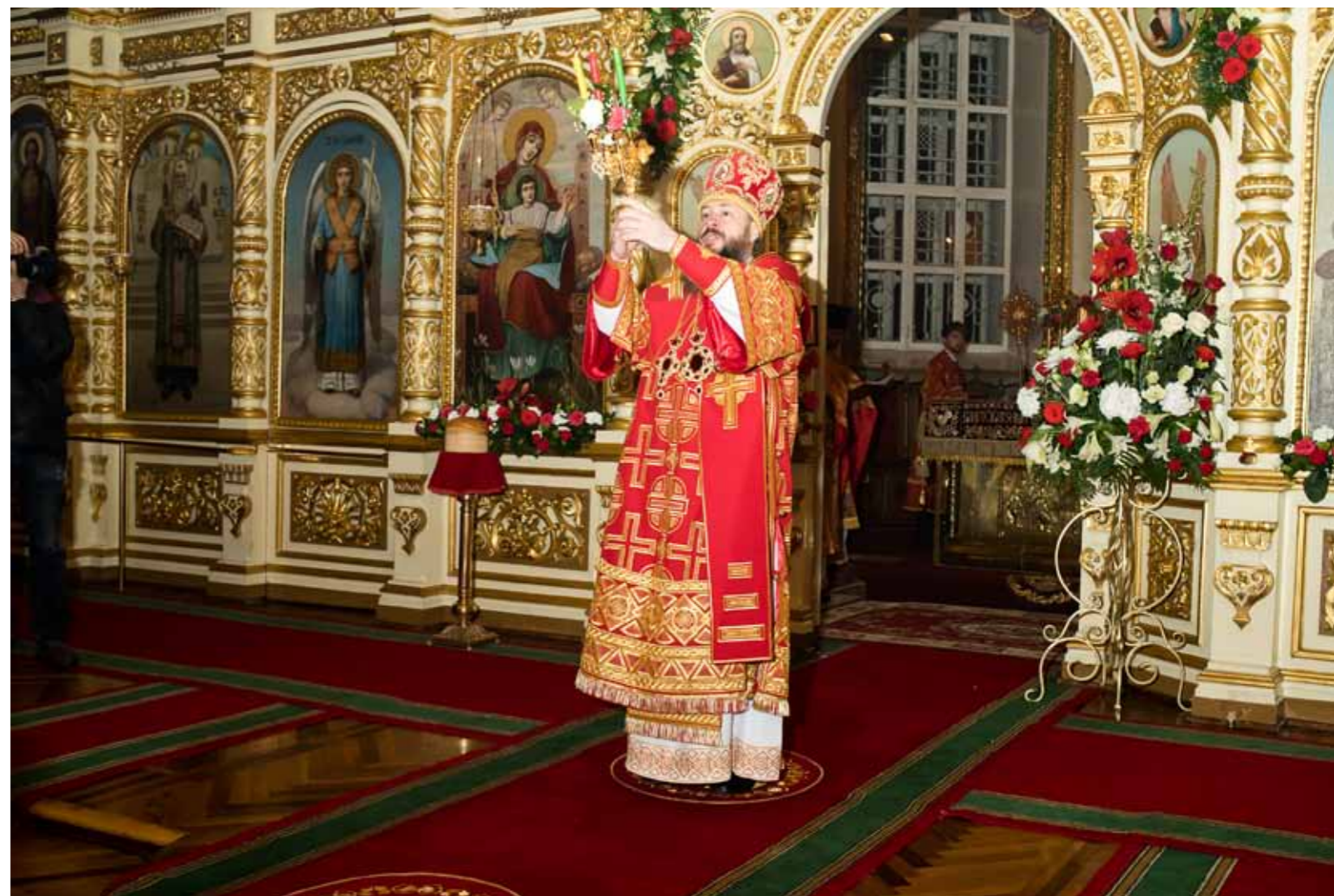
Пасха Христова. Успенский кафедральный собор. 8 апреля 2018 г.