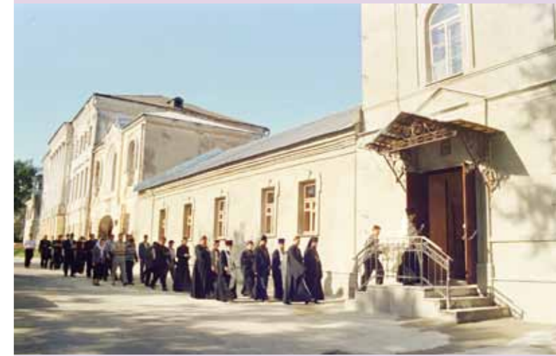
После молебна у входа в духовное училище. 1 сентября 2000 г.

– Вы упомянули многое из того, что в духовной семинарии сейчас делается, но, в конечном итоге, мне бы хотелось, чтобы она ста-