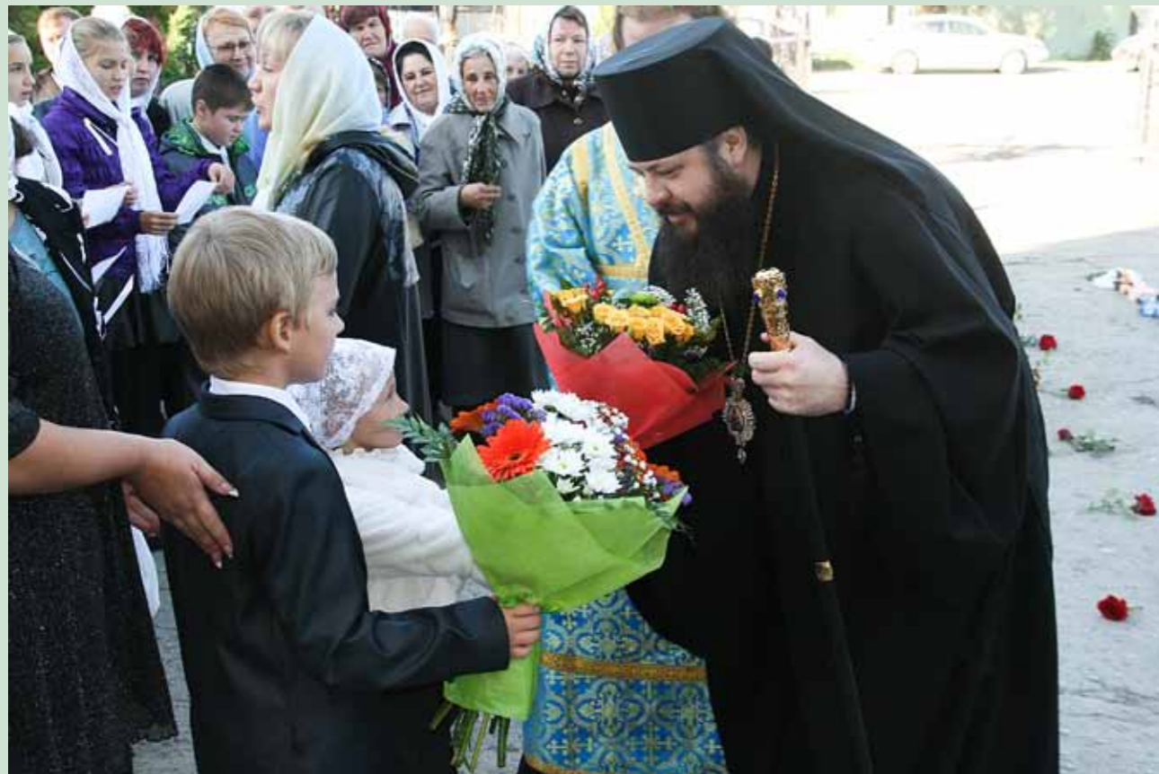
Встреча в Вознесенском кафедральном соборе Кузнецка. 21 сентября 2012 г.

шая просветительская работа, – все это замечательно. Но теперь главное – на этой базе создать хорошую общепархиальную базу.