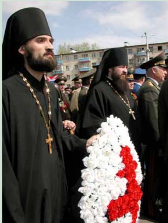
День Победы. 9 мая 2007 г.