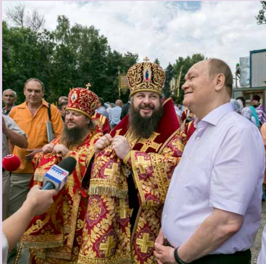
Освящение и подъем четырёх малых куполов. С епископом Сердобским и Спасским Митрофаном и губернатором Василием Бочкарёвым. 14 августа 2014 г.