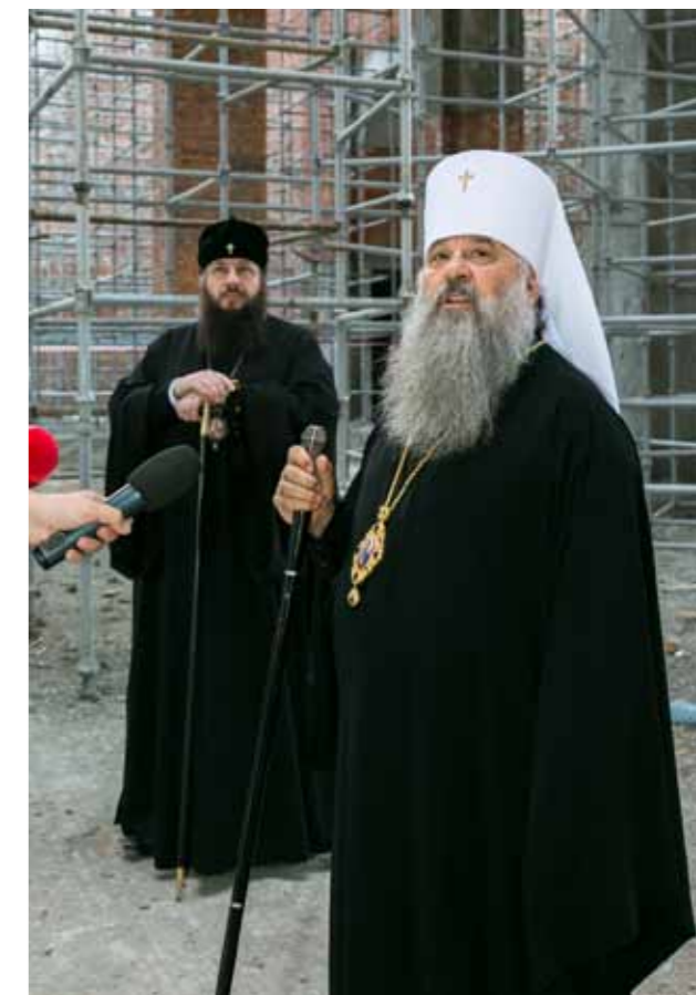
В строящемся соборе с митрополитом Санкт-Петербургским и Ладужским Варсонофием. 3 августа 2014 г.