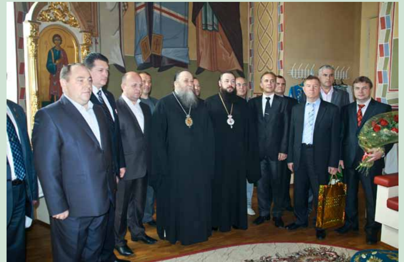
Вступление в управление Кузнецкой епархией. С почетными гостями. 21 сентября 2012 г.