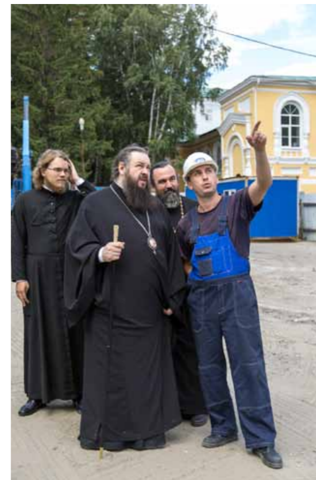
На стройке. 23 июля 2014 г.

Мы сейчас стараемся, чтобы это было всё прозрачным, и люди знали, куда идут эти деньги. А большинство людей, которых мы не знаем, – это те, кто скромно приносит свои средства и опускает их в кружку для пожертвова-