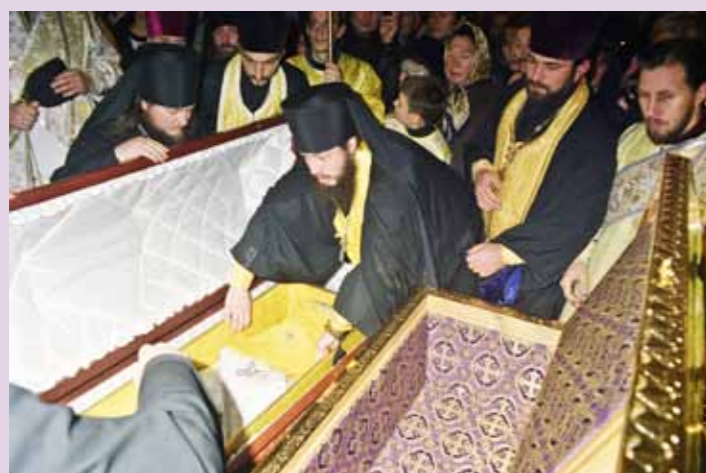
Прославление святителя Иннокентия Пензенского. 22-23 октября 2000 г.