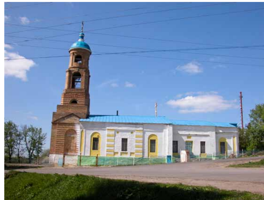
Димитриевский храм в Каменке. Колокольня восстановлена. Конец 90-х гг.

Само воцерковление началось с трудностей – трудностей моего переходного возраста. На то время мне было где-то 11–12 лет, это был период взросления, и он проходил, как это часто бывает, непросто, особенно в таком небольшом городе, как Каменка. Это и некий кризис в отношениях ребят во дворе и в школе, это и какие-то внутренние кризисы, среди которых и первая любовь, и многое другое – не всегда это всё удачно проходило. Все это для меня стало мощным толчком к тому, чтобы начать самому в себе молиться. Самому, своими словами. Потом с появлением церкви я стал её посещать время от времени.