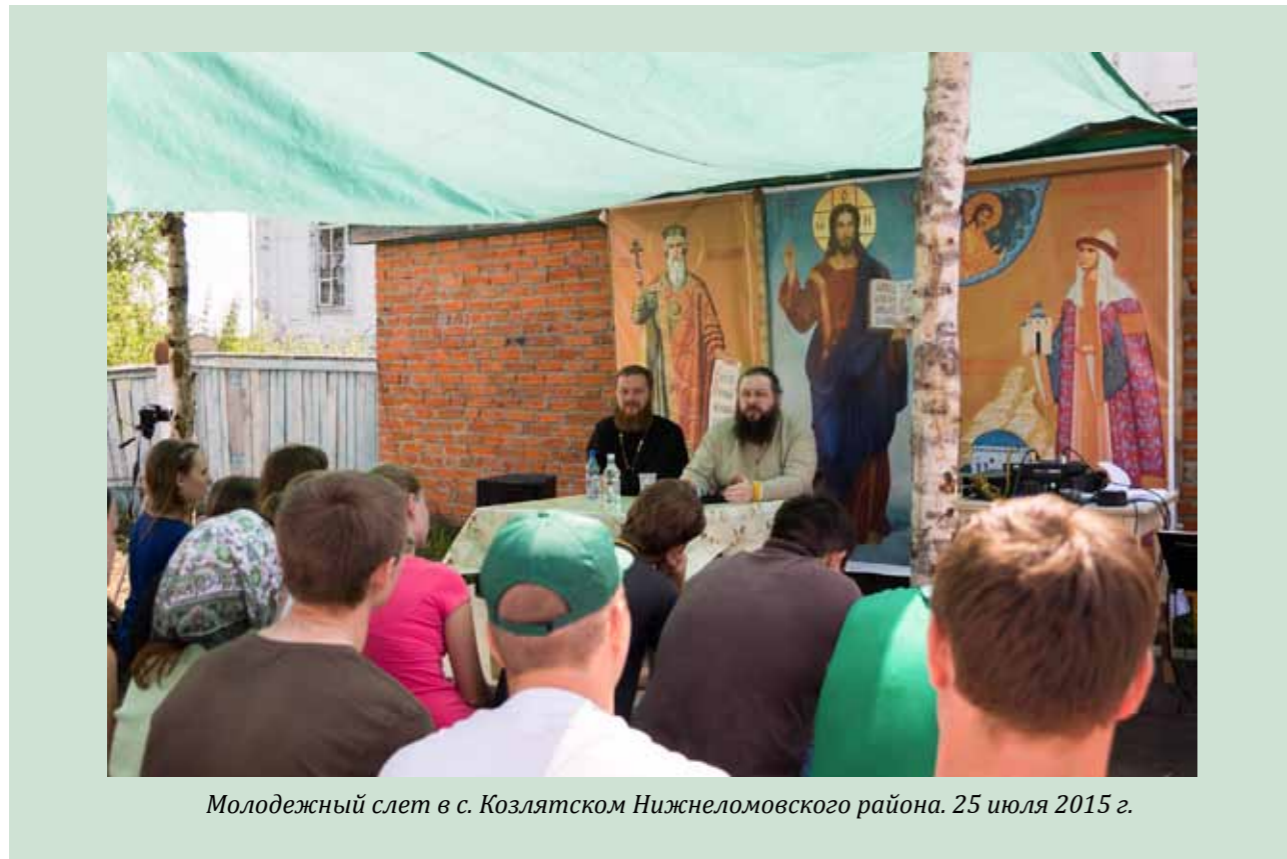
Молодежный слет в с. Козлятском Нижнеломовского района. 25 июля 2015 г.

щенное Писание. Мы должны создать дополнительное образование, как это было в советское время во дворцах пионеров. Воскресная школа для ребенка должна быть временем проведения досуга, которое еще и приносит им знания о Боге, приносит понимание православных традиций и основ православной культуры.