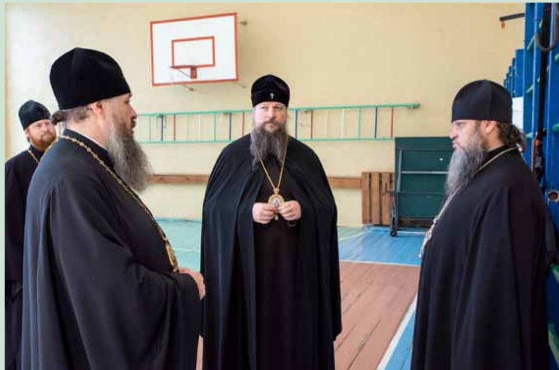
С митрополитом Воскресенским Дионисием (в центре) в спортзале семинарии. 7 сентября 2020 г.