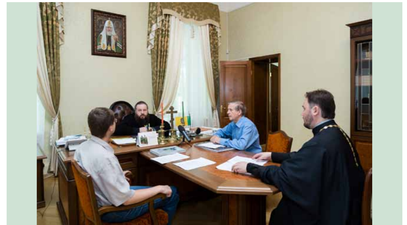
Первое заседание научно-редакционного совета по изданию полного собрания творений свт. Иннокентия Пензенского. 17 июля 2015 г.

– Я был предельно удивлен возможностям и работоспособности этого человека – кстати, благодаря Вам и изданию этих трудов, которыми Вы вплотную занимались. И мне по-человечески стало очень стыдно за то, как я работаю, потому что святитель Иннокентий, если мне не изменяет память, за этот короткий промежуток времени, с его поездкой в Саратов, с его несколькими неделями болезни, когда он был прикован к постели, успел рукоположить более двадцати ставленников, разобратся со всеми епархиальными делами, которые скопились за то время, когда здесь не было правящего архиерея, и с теми делами, которые поступили в течение этих всех месяцев в консисторию. И самое главное состоит в том, что этот человек, реально осознавая, что дни его жизни сочтены, потому что он был очень болен, – не унывал, не отчаивался, не старался делать себе каких-либо поблажек, а искренне трудился во славу Божию.