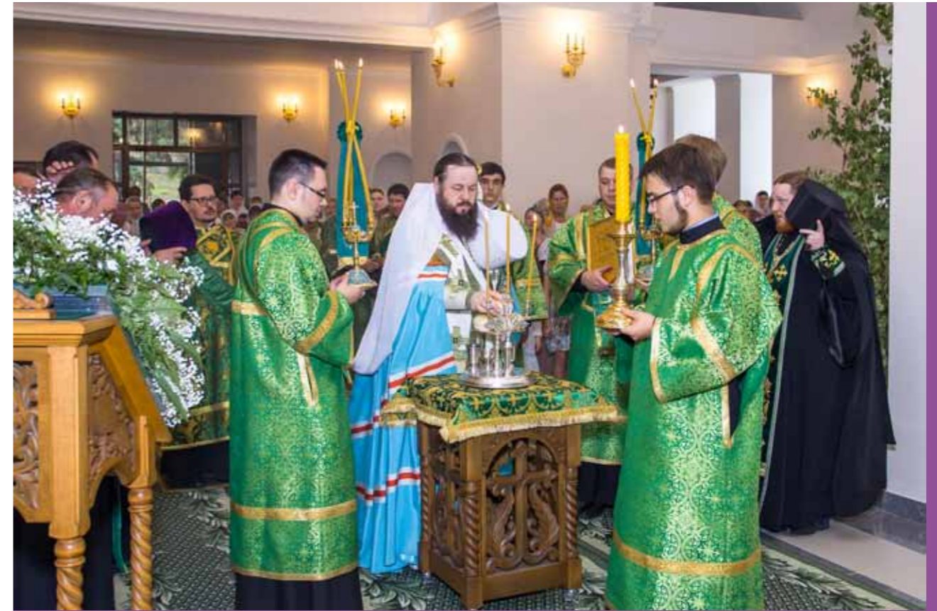
Первое всенощное бдение в восстановленном Троицком соборе Троицкого женского монастыря Пензы. 7 июня 2014 г.

– Архиерей обязательно должен общаться с народом.