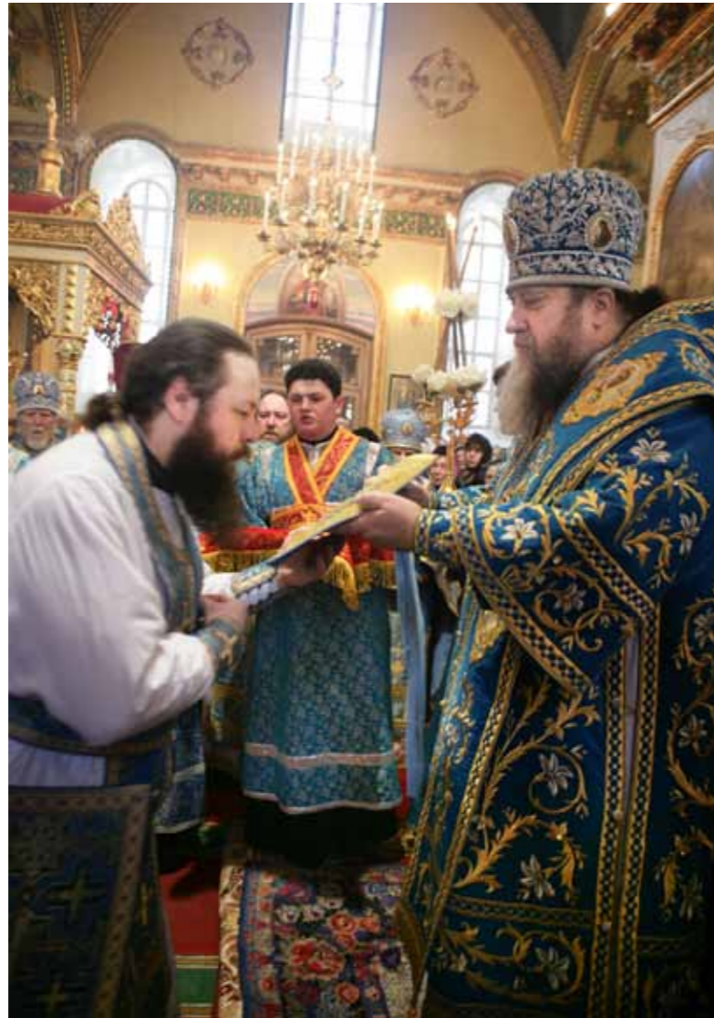
Награждение палицей. 7 апреля 2010 г.

– Второго апреля исполнилось пятнадцать лет, как Вы приняли монашеский постриг. На какие лишения Вам, как монаху, ежедневно приходится идти?