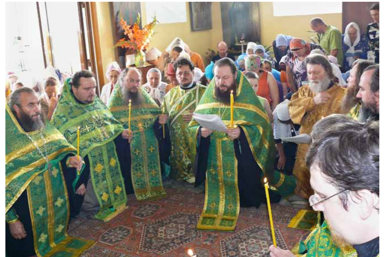
Молебен у мощей священноисповедника Иоанна Оленевского. 5 августа 2012 г.