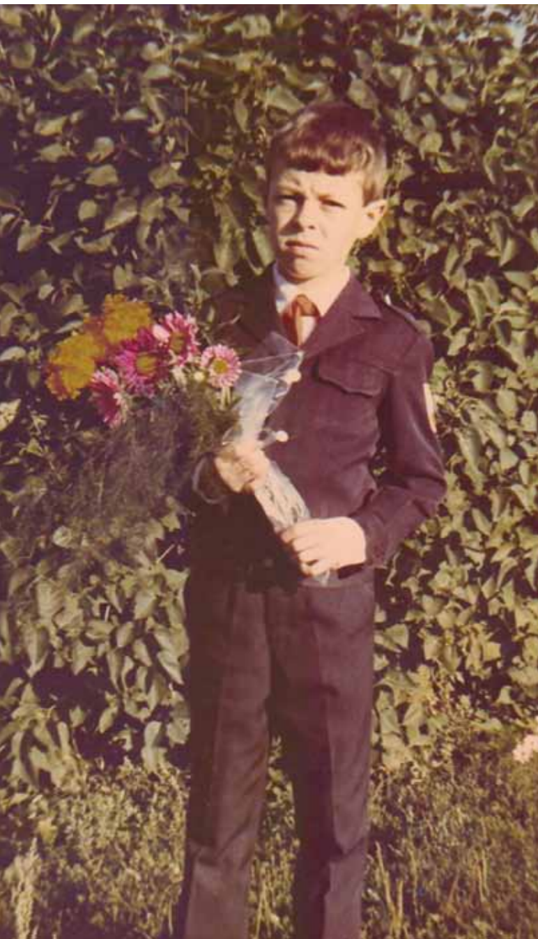
Пятый класс. 1 сентября 1987 г.

К тому же на приходе у нас был настоятелем иеромонах, который заботился о духовном становлении своих прихожан, не скупился на то, чтобы дарить хорошую литературу,