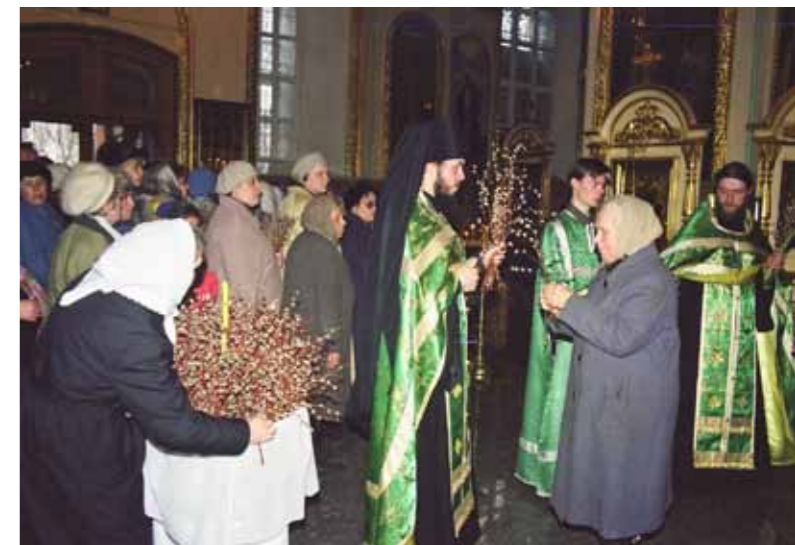
Вербное воскресенье. 4 апреля 1999 г.