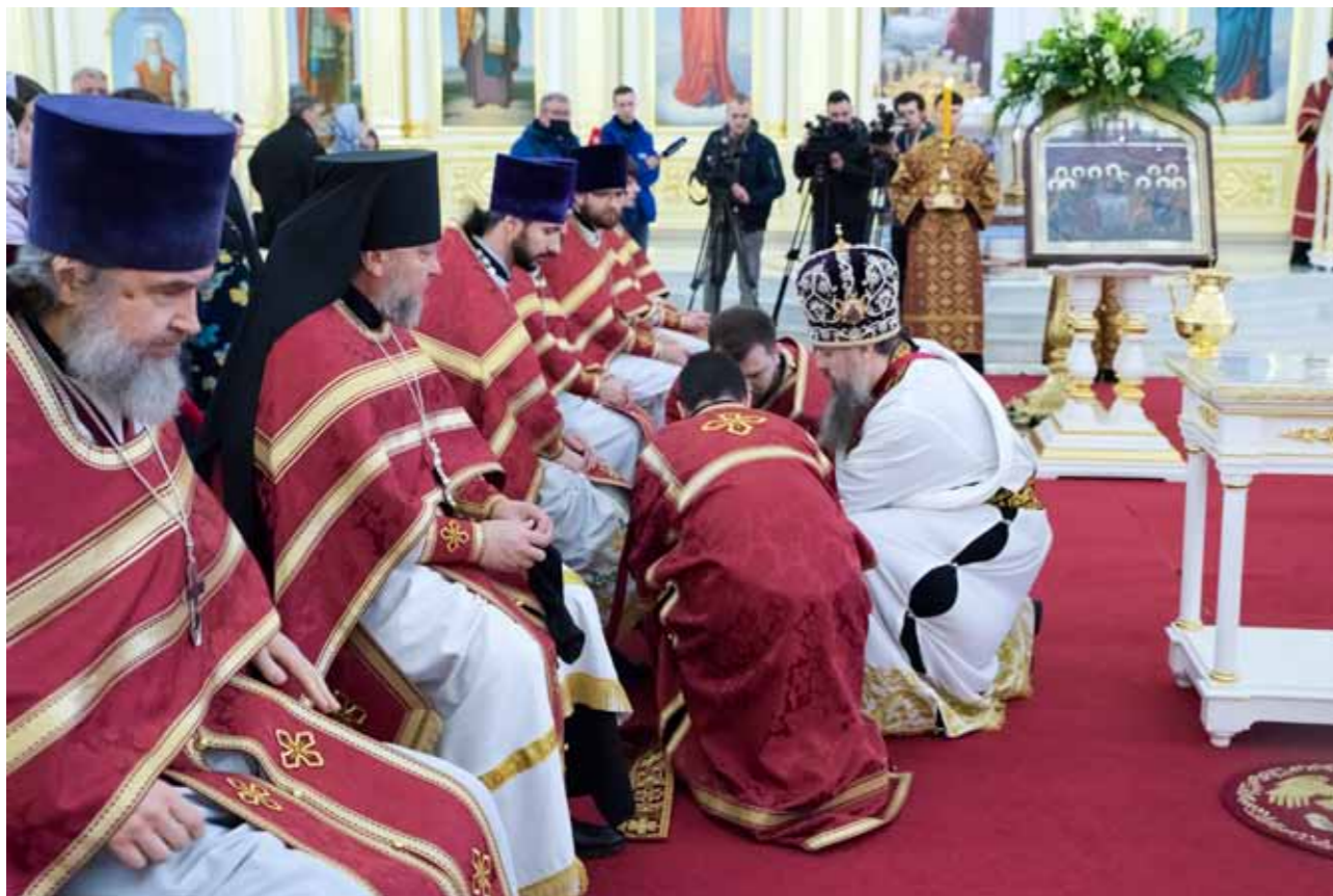
Чин умовения ног. Спасский кафедральный собор. 21 апреля 2022 г.

Мой личный совет: нужна какая-то определенная грань. Конечно, нельзя обидеть человека. Например, день рождения матери, или дочери, или мужа, тем более, если этот человек не совсем поддерживает твои христианские традиции – ты постишься, а он нет. Когда ты в день его рождения скажешь: я не буду участвовать в твоих торжествах, отдельно мне готовьте, – то, конечно, это будет неправильно.