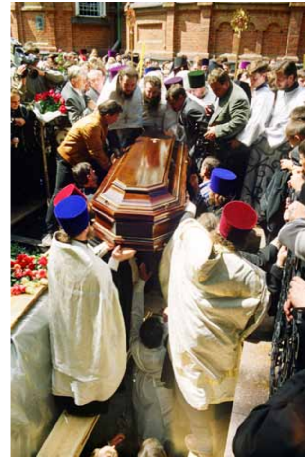
Погребение архиепископа Серафима. 5 июля 2000 г.

Из обращения к читателям спецвыпуска журнала «Пензенские епархиальные ведомости», посвященного памяти архиепископа Серафима, июль 2020 г.