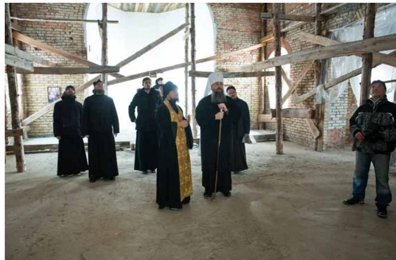
В строящемся Никольском храме Шемышейки. 27 декабря 2020 г.