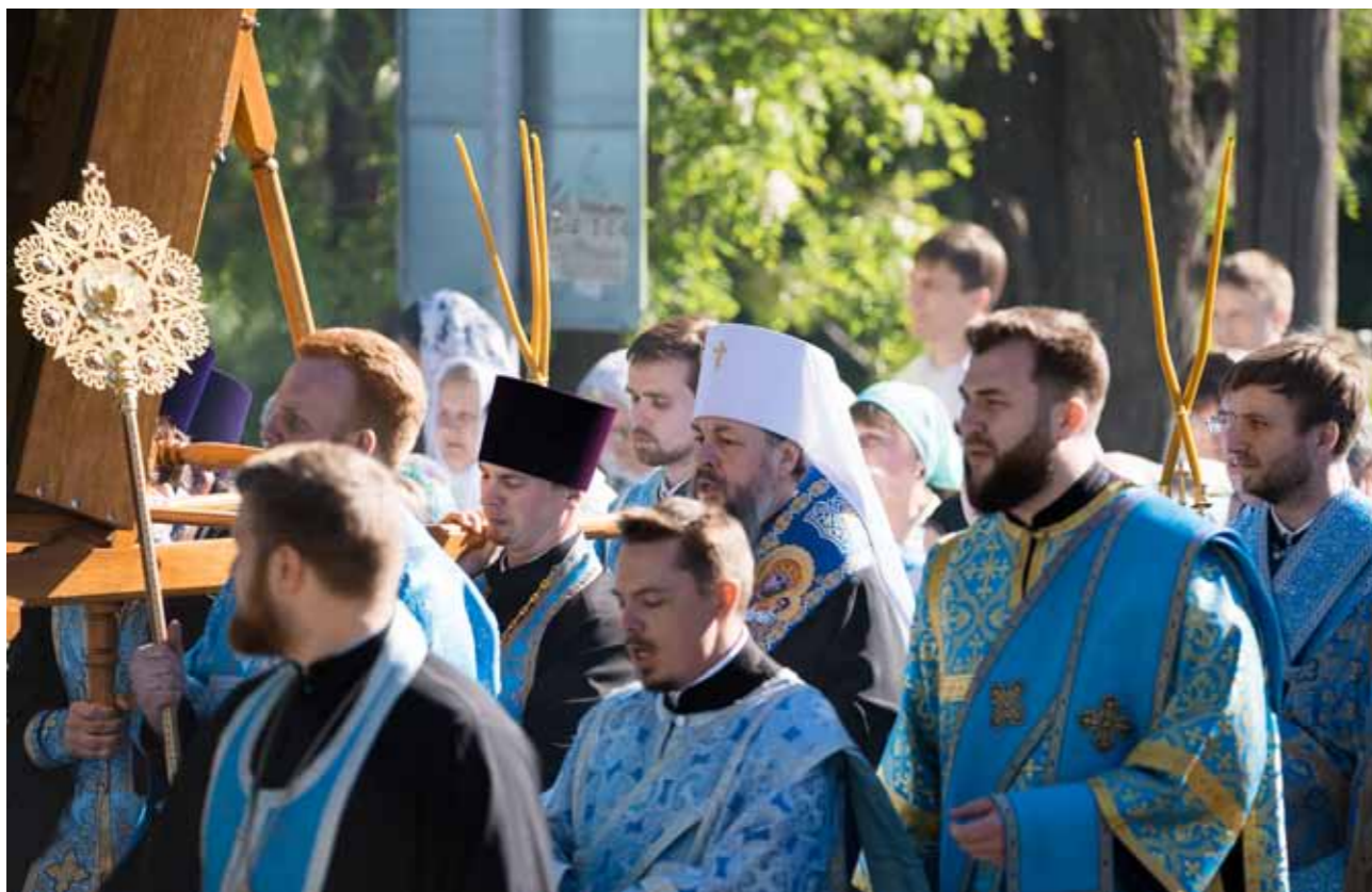
Перенесение Казанской-Пензенской иконы Божией Матери из Митрофановского храма в Спасский кафедральный собор. 12 июня 2022 г.

кончилась эпоха строительства, мы не имеем в виду, что мы больше ничего не будем строить. Но восстановление – уже не самая главная цель, которая была в 90-е годы. Наша сегодняшняя цель – окормление людей и помощь им – как социальная, так и моральная, и, безусловно, это – помощь, которая должна привносить веру в сердце человека.