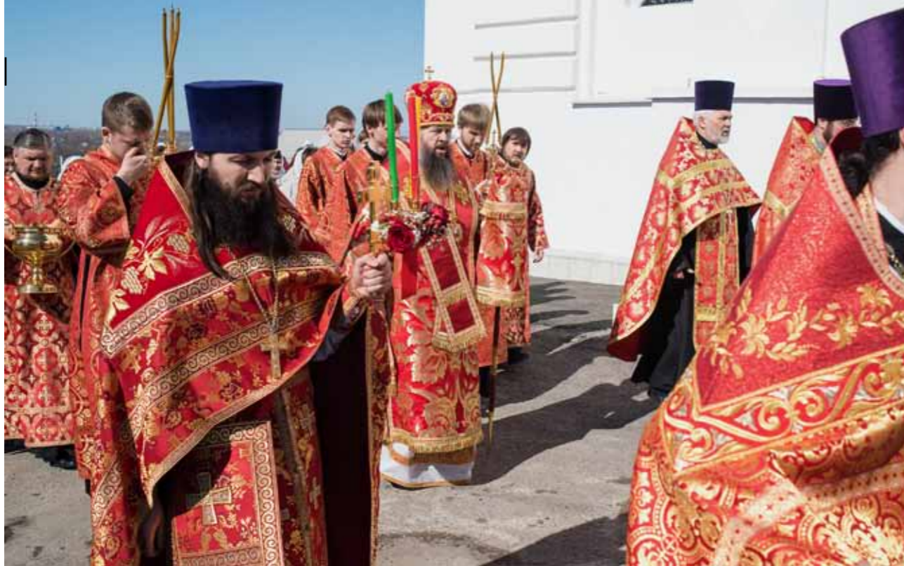
Светлый вторник. Крестный ход вокруг Димитриевского храма Каменки. 10 апреля 2018 г.