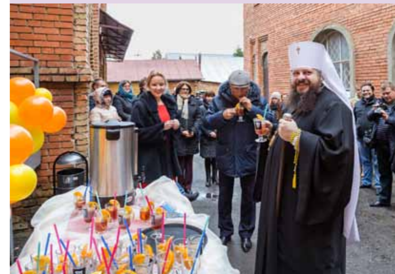
Открытие арт-кафе «Квартала Луи» в епархиальном здании на проезде Водопьянова. 1 ноября 2015 г.

– Первое, за что я благодарен Господу Богу и всем православным жителям Пензы и области, – это то, что они своими молитвами и пожертвованиями поддерживают строительство Спасского кафедрального собора. Сейчас мы уже вышли на уровень центрального барабана, и я надеюсь, что, с помощью Божией, за этот сезон мы закроем крышу и поставим купола. И это меня не может не радовать.