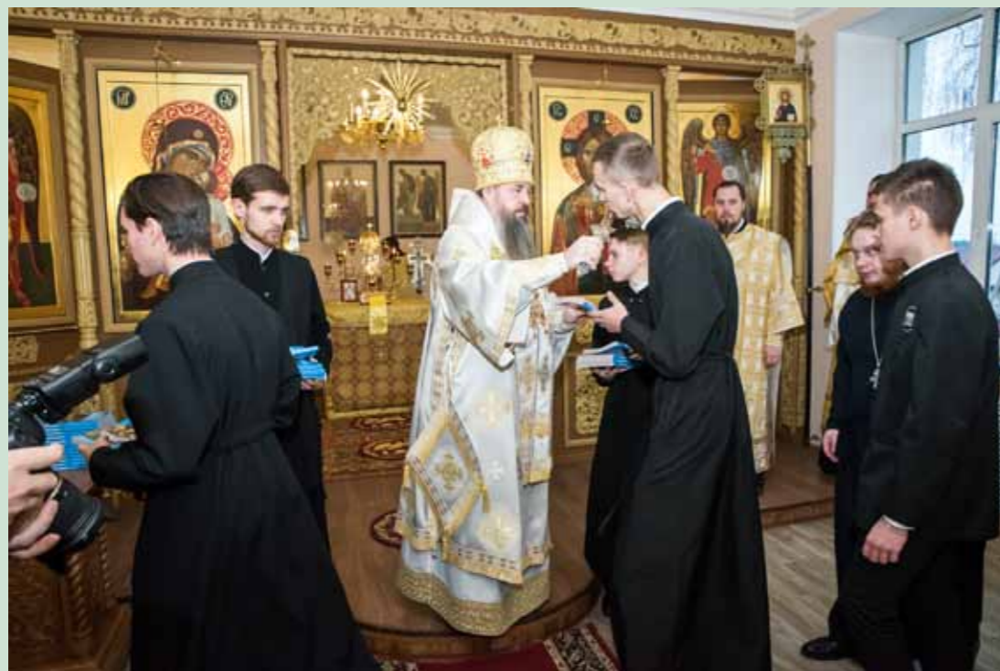
Престольный праздник семинарского храма. 9 декабря 2021 г.

мотных преподавателей и профессоров наших местных вузов. Я думаю, это должно дать хороший плод для того, чтобы пастырь был грамотным, а главное – добрым и благочестивым. Наверное, всё же грамотность сейчас для народа