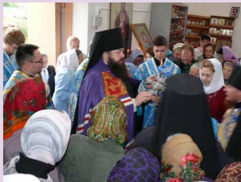
300-летие Владимирско-Богородицкой пустыни в с. Большой Вяяс Лунинского района. 13 сентября 2013 г.

триархом перед своим избранием, он указал на то, что несколько лет я был секретарем Пензенской епархии (практически заместителем епископа), так как на время болезни архиепископа Филарета, случившейся неожиданно, исполнял обязанности управляющего епархией. То есть некий опыт управления епархией у меня был.