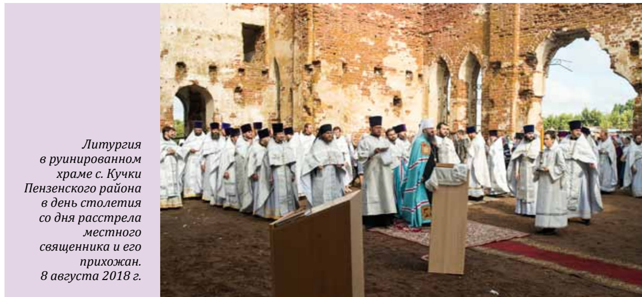
Литургия в руинированном храме с. Кучки Пензенского района в день столетия со дня расстрела местного священника и его прихожан. 8 августа 2018 г.

такой отрицательный герой. А сейчас мы прославляем новомучеников, пишем их портреты, делаем их иконами, и сотни людей молятся перед этими иконами. Вот оно – то семя, которое было посеяно ими, то свидетельство, которое возросло через сто лет!