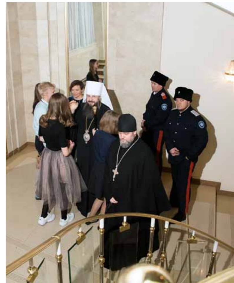
На Сретенском балу в драматическом театре. 15 февраля 2019 г.