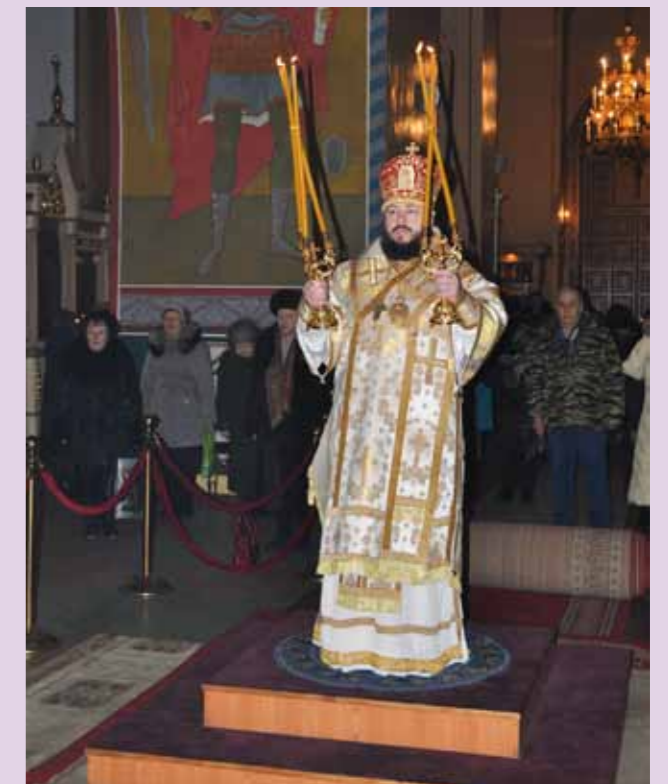
День памяти священномученика Серафима (Чичагова) – «малые именины». Вознесенский кафедральный собор Кузнецка. 11 декабря 2013 г.