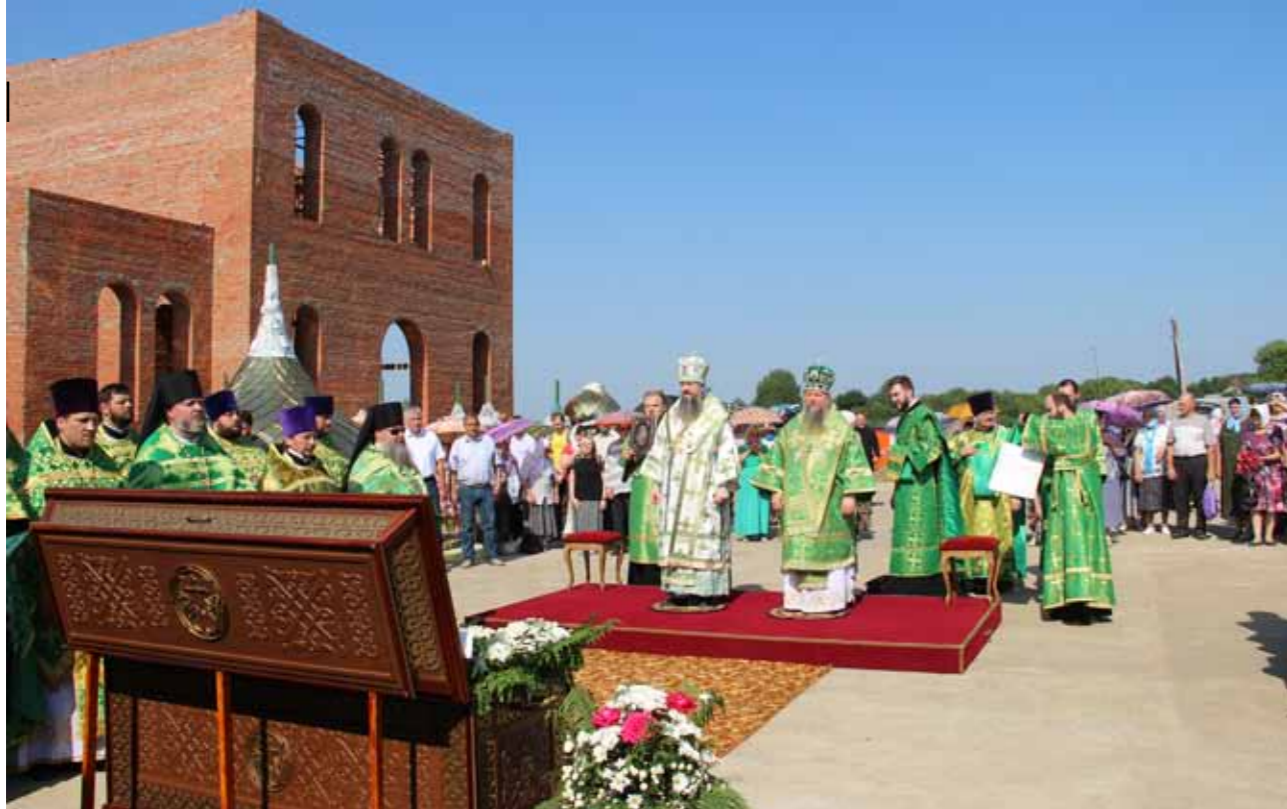
Литургия в день памяти блаженного Иоанна в Кочетовке. 25 июня 2021 г.

бую благодать и особое дерзновение. Поэтому любой святой человек – это светоч, за которым нам следует идти, тот светоч, который является для нас не просто образцом для подражания, но тем светом, который светит нам на пути Христовом.