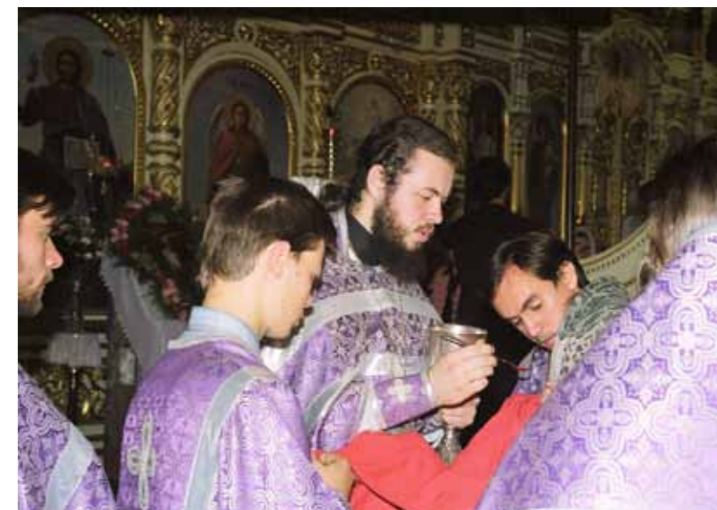
Крестовоздвижение. 27 сентября 1999 г.