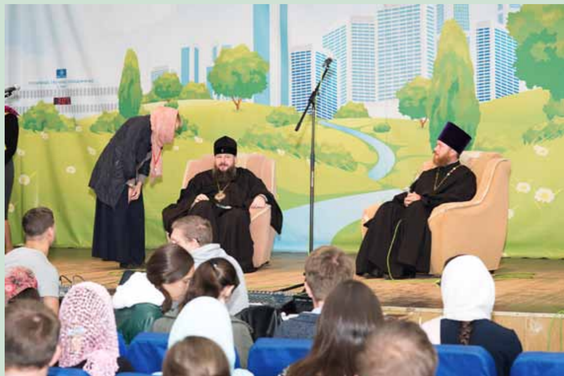
Молодежный слет «Православная Сура» под Пензой. 8 сентября 2017 г.

и регента, для которого цель спевки – добиться, чтобы четко выговорили слова и в ноты попадали. В идеале, на мой взгляд, руководитель хора – это в какой-то мере его духовный наставник, то есть тот, кто приводит к Богу. Таких мало. Если человек сам не заинтересуется, если для него это простой заработок, он будет