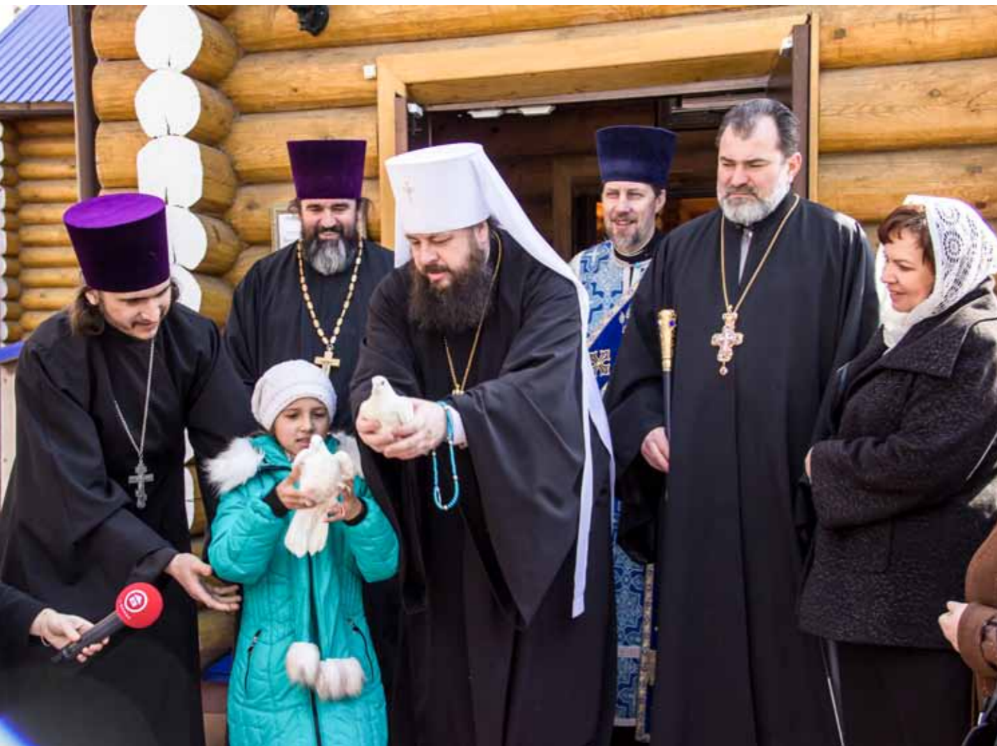
Благовещение Пресвятой Богородицы. 7 апреля 2014 г.