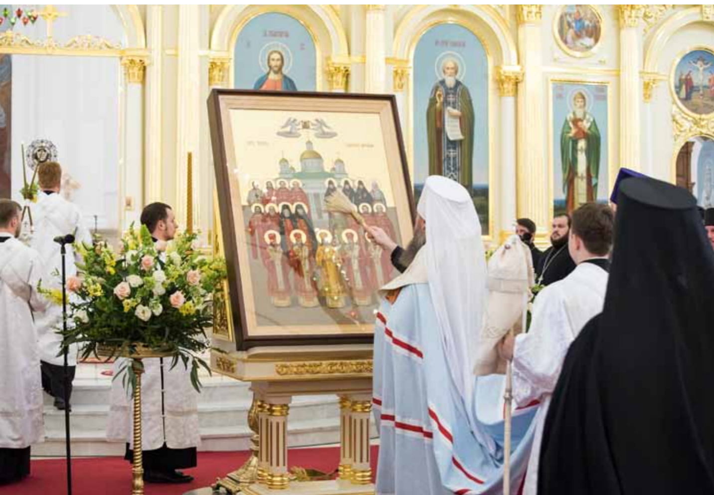
Освящение первой иконы Собора святых Пензенской митрополии. 11 июня 2021 г.

В сентябре 2020 года Святейший Патриарх Кирилл по ходатайству митрополита Серафима установил празднование Собора святых Пензенской митрополии 30 мая / 12 июня.