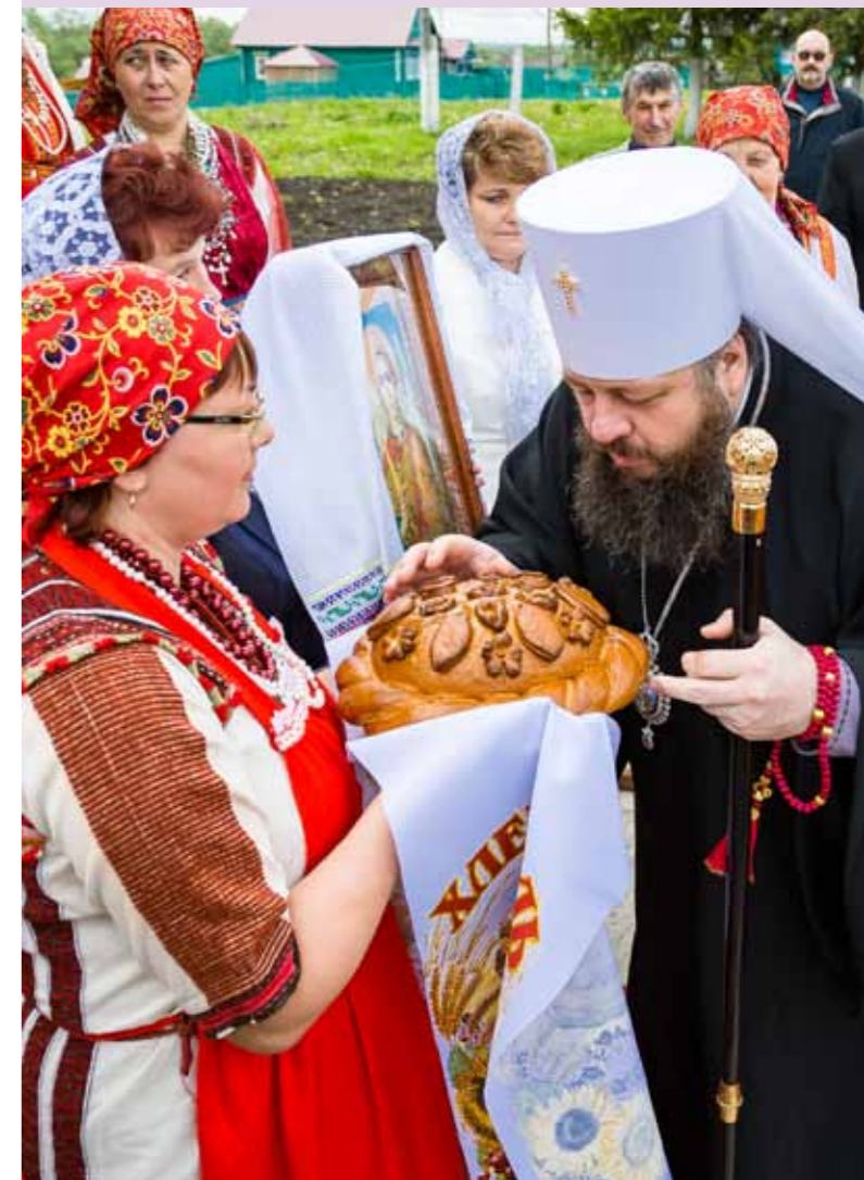
Перед великим освящением Никольского храма в с. Вышелей Городищенского района. 22 мая 2016 г.