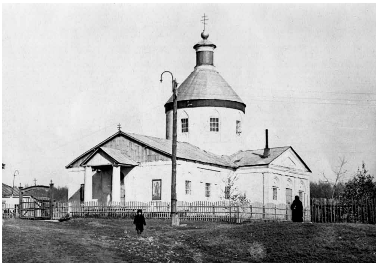
Храм прп. Сергия Радонежского с. Головинская Варезка. 80-е гг.