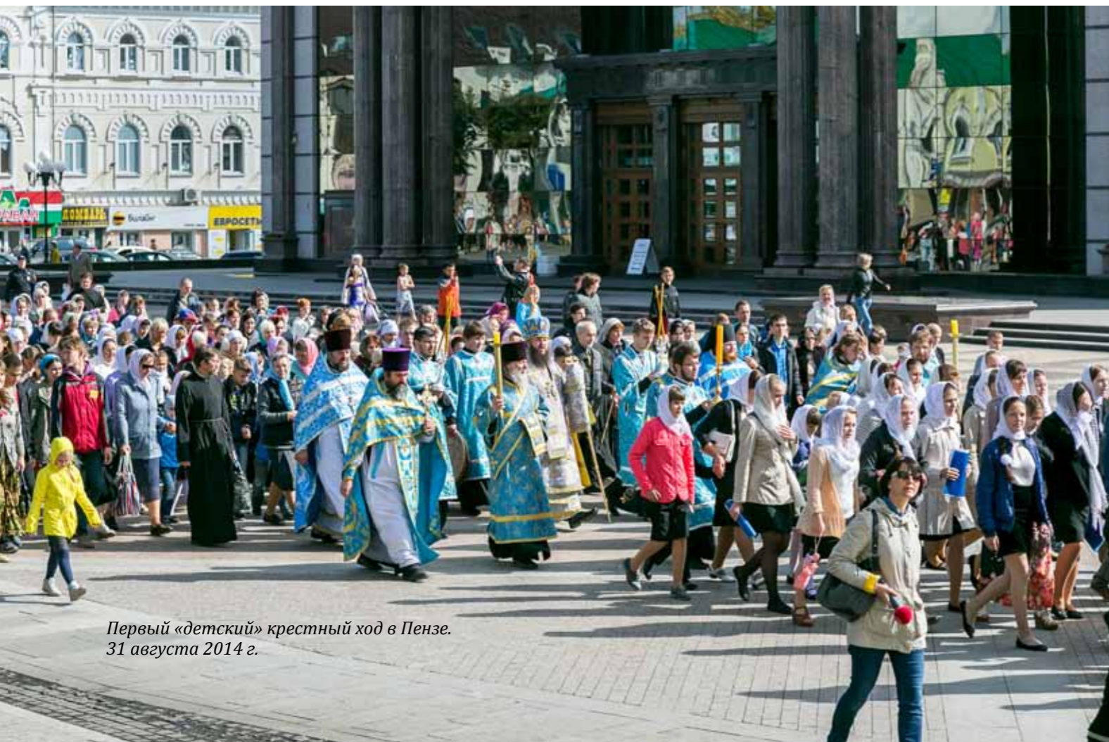
Первый «детский» крестный ход в Пензе. 31 августа 2014 г.

ло говорит. В нем есть такая святая простота, которая заставляет человека правильно жить.