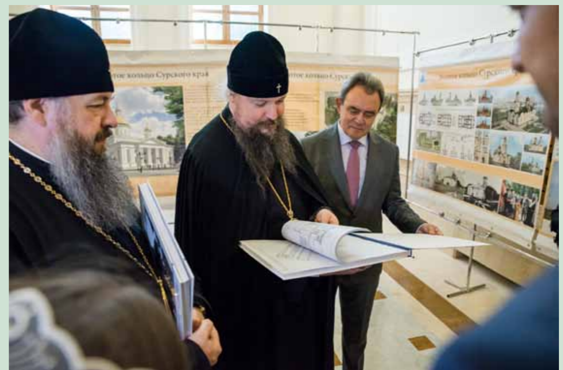
С митрополитом Воскресенским Дионисием, управляющим делами Московской Патриархии, и председателем регионального Законодательного собрания Валерием Лидиным. 7 сентября 2020 г.