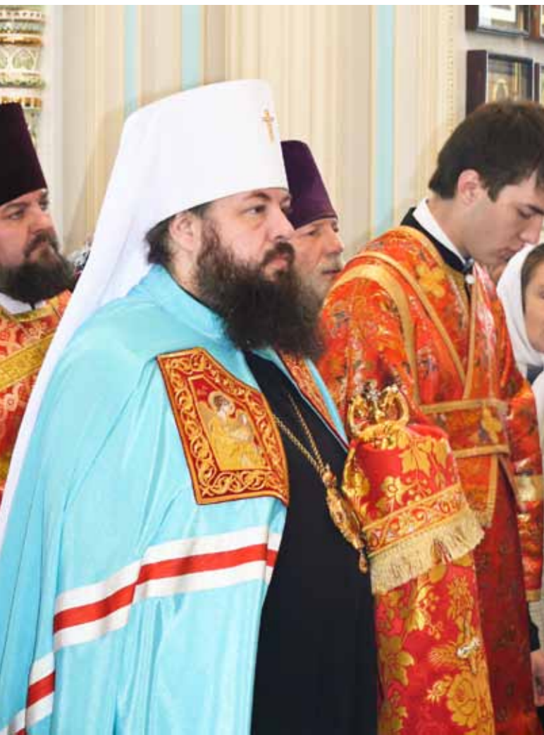
В храме с. Большая Валяевка Пензенского района. 14 апреля 2014 г.