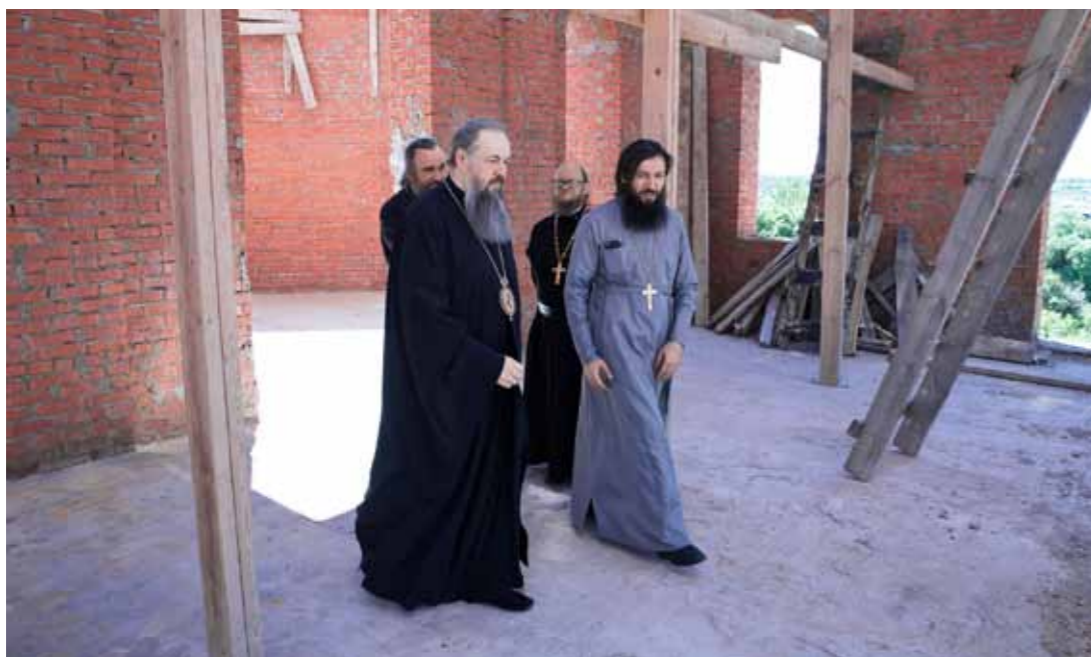
В строящемся Михайло-Архангельском храме Кочетовки. 25 июня 2022 г.

Из проповеди в день прославления блаженного Иоанна Кочетовского, октябрь 2018 г.