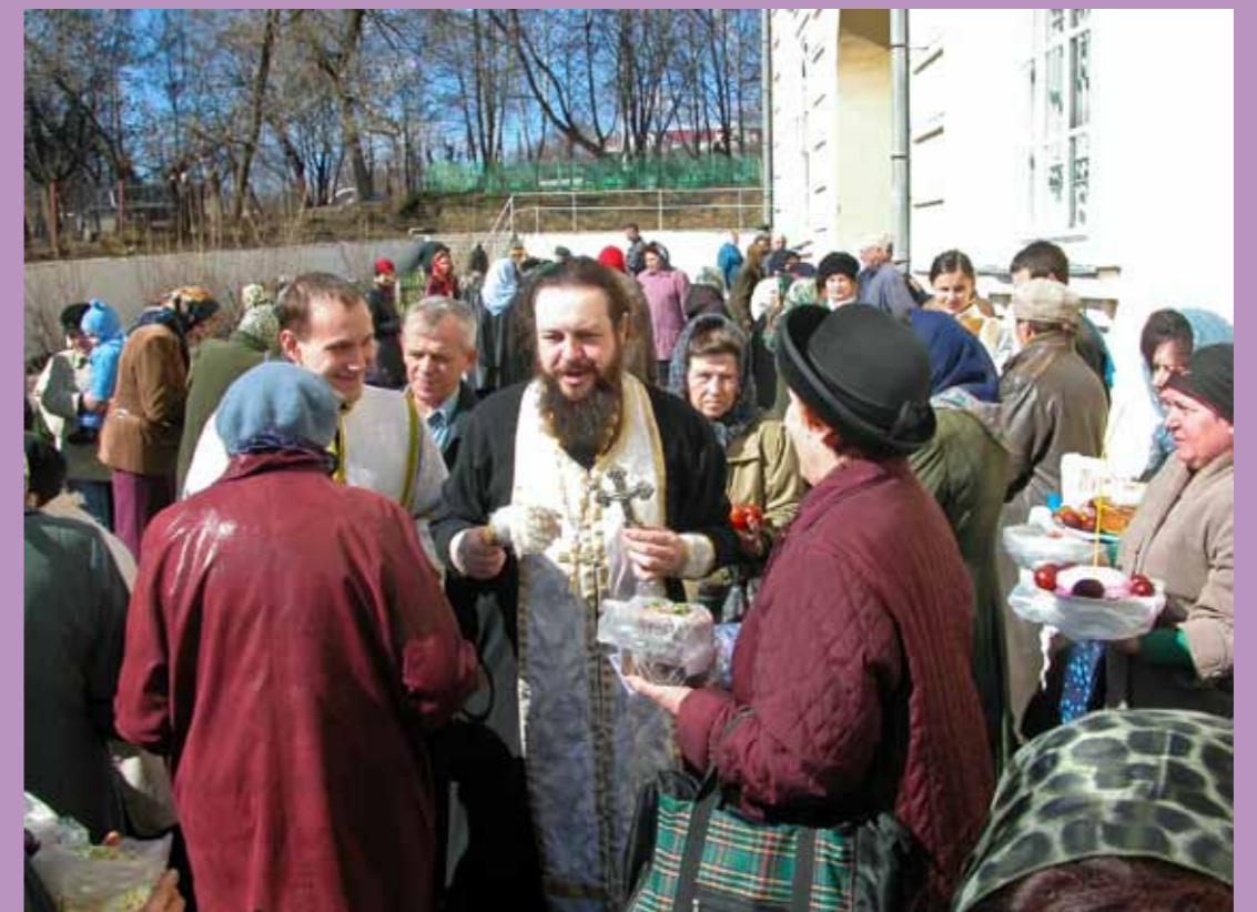
Освящение пасок в Покровском архиерейском соборе. Великая Суббота, 7 апреля 2007 г.