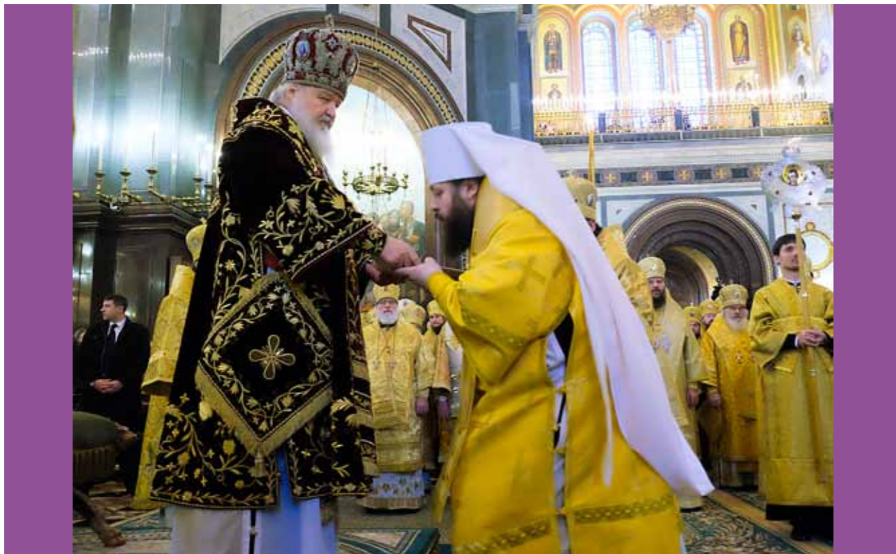
Возведение в сан митрополита. Храм Христа Спасителя. 1 февраля 2014 г.

25 декабря 2013 года Священный Синод Русской Православной Церкви принял решение о назначении на Пензенскую кафедру епископа Серафима. 1 февраля 2014 года за литургией в Храме Христа Спасителя Святейший Патриарх Кирилл возвел его в сан митрополита.