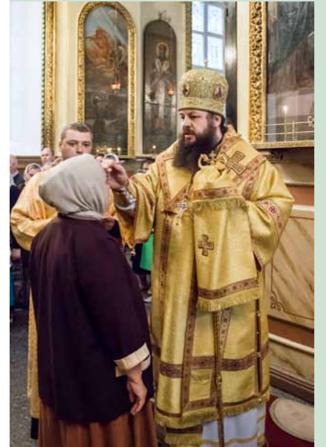
Елеопомазание. Успенский кафедральный собор. 18 июня 2014 г.

– Горожане, которые бывают на службах, обратили внимание, что увеличилось количество диаконов. Увы, у нас много лет диакон рассматривался как переходная ступень в священство, потому что по канонам диакон не обязательно должен участвовать в богослужении. По Вашему мнению,