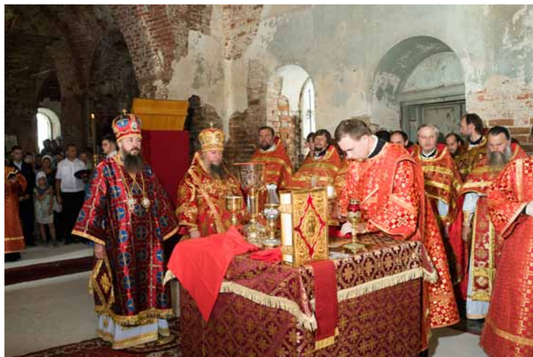
Крестный ход и литургия в Стяжкино в день столетия убиения Царственных страстотерпцев. 17 июля 2018 г.

знают, что был такой подвижник, что он погребен в Нижнеломовском Успенском монастыре, к нему на могилу идут люди, получают помощь свыше по его молитвам. Почему так произошло?