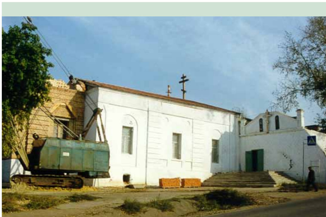
Димитриевский храм в Каменке. Начало возрождения. Середина 90-х гг.

– Отчасти, да. Я – ребенок советского времени, а поскольку мама была руководителем партийной организации, то в самом младенчестве я не был крещен. Меня крестили в трехлетнем возрасте, и какие-то отрывки в моей памяти сохранились.