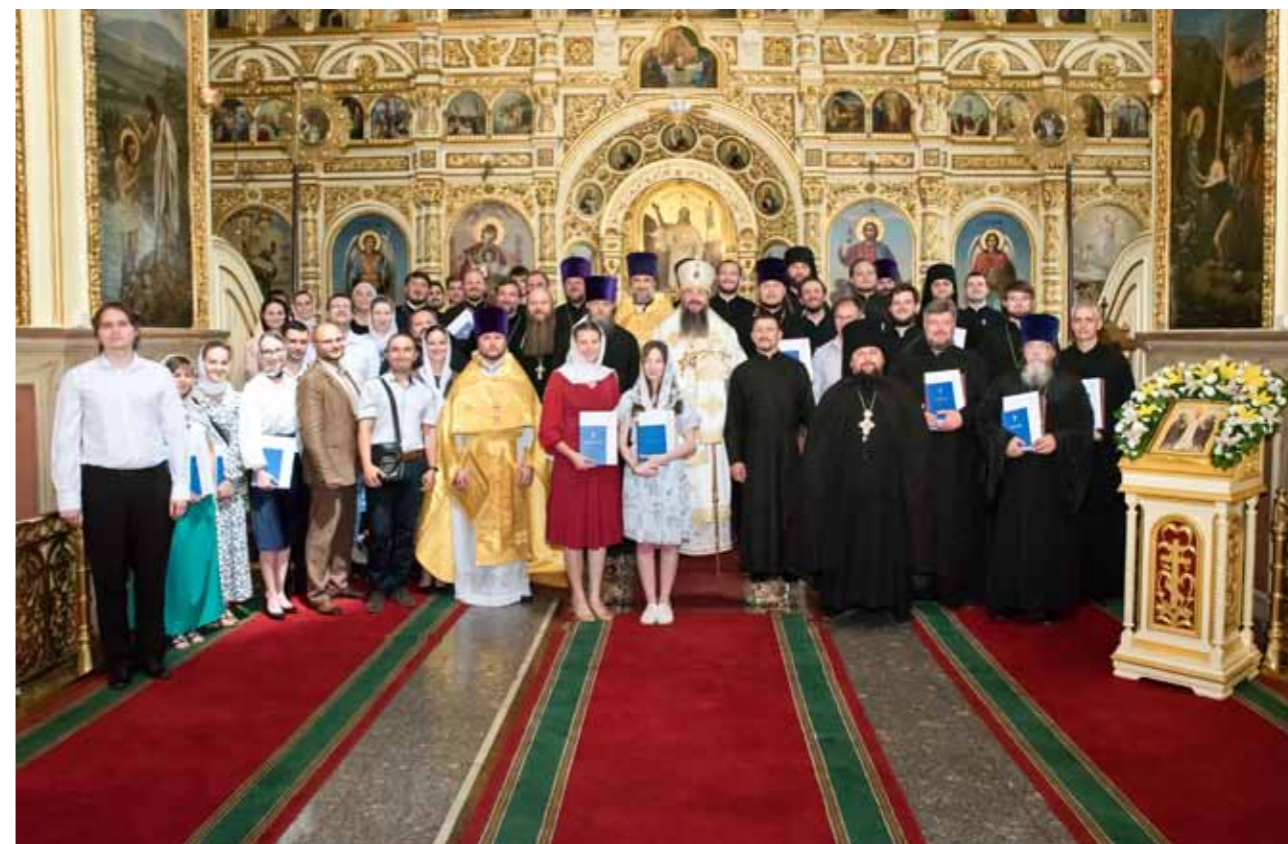
С выпускниками семинарии после вручения дипломов в Успенском кафедральном соборе. 11 июля 2020 г.

Я думаю, что о явных результатах пока говорить рано. А вот когда лет через десять наши выпускники будут занимать большинство наших приходов, – тогда мы всему этому сможем