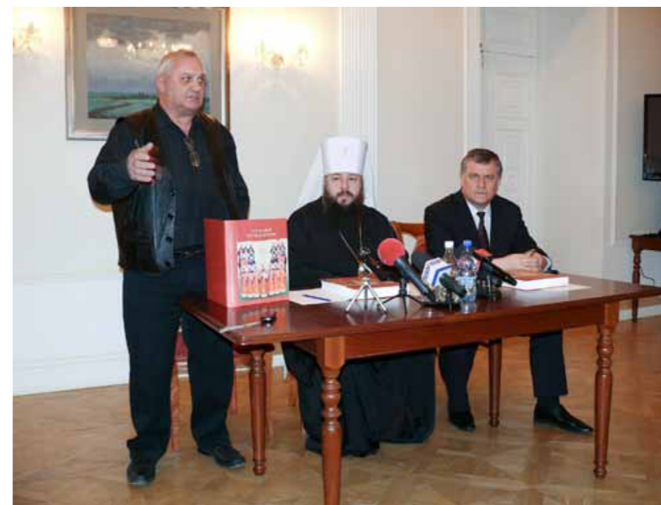
Презентация мартиролога «Праведный верою жив будет» в губернаторском доме. 5 декабря 2014 г.