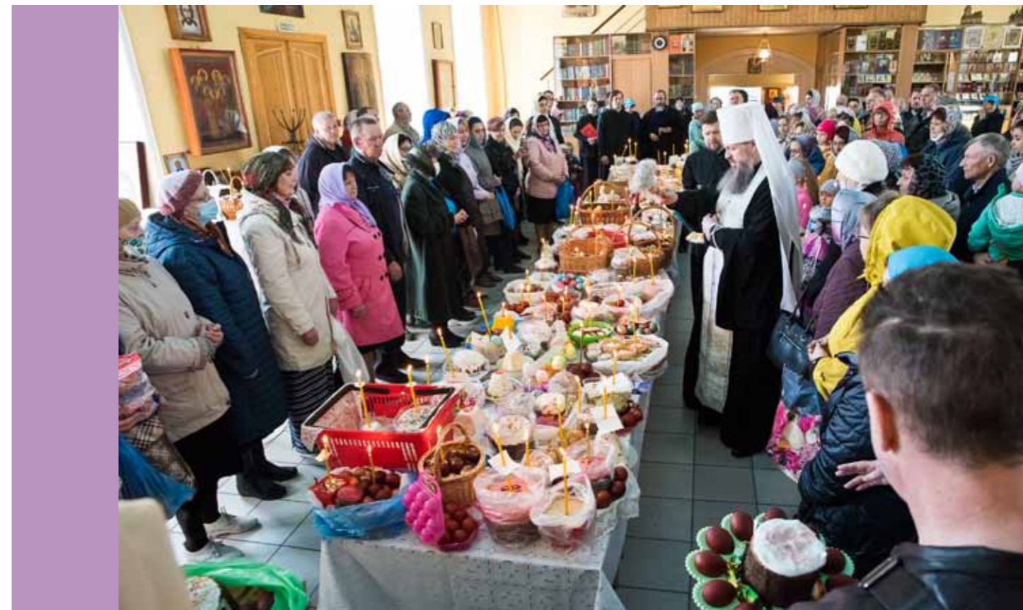
Освящение пасхальной снеди в Никольском храме Терновки. 23 апреля 2022 г.

Ведь Святая Церковь установила празднование Воскресения Христова как не просто воспоминание того, что на третий день после Своей смерти Христос воскрес и явился вначале женам-мироносицам, потом Своим апостолам, а потом многим и многим другим. На самом деле, конечно, Воскресение Христово должно постоянно жить в нашем сердце, тому есть многие примеры, очень яркие, как преподобный Серафим Саровский, который приветствовал всех приходящих возгласом «Христос воскрес!», потому что радость Воскресения