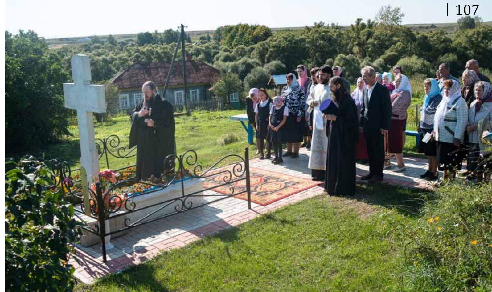
На могиле блаженного. 17 сентября 2017 г.