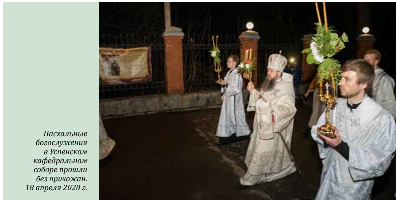
Пасхальные богослужения в Успенском кафедральном соборе прошли без прихожан. 18 апреля 2020 г.

мы к этой болезни относимся – боимся или нет – каждый из нас должен с любовью относиться к ближнему своему. Потому как даже если ты сам этой эпидемии не опасаясь, то существует вероятность заразить кого-то из любимых тебе людей. А это – грех, который состоит в отказе оказать любовь своему ближнему.