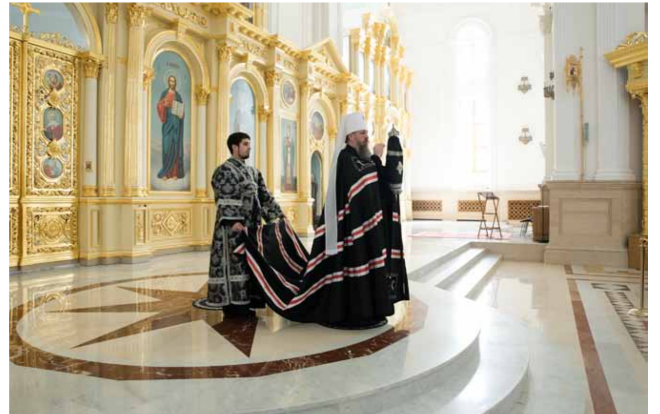
Великая Пятница. Спасский кафедральный собор. 22 апреля 2022 г.

С другой стороны, от чего бы хотелось предостеречь: у нас так часто бывает, что люди, единожды нарушив пост, говорят: ну, все, теперь нарушил, можно дальше и не соблюдать. Поэтому тут должна быть золотая середина. Да, ты нарушаешь ради любви к своему ближнему. Но я должен сказать о том, что вот эта диета – это не самоцель поста. Самоцель – это внутренне духовное изменение.