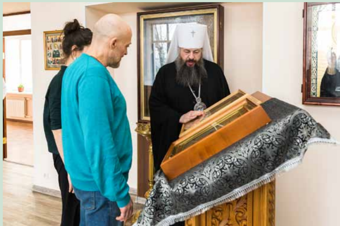
С потомками композитора Алексея Касторского в семинарском храме. 15 марта 2020 г.

стать священниками, обучаться на экстернате с последующим принятием священного сана. Я буду прилагать все усилия к тому, чтобы семинария развивалась и становилась центром духовной жизни нашего региона. Потому что очень важно, чтобы будущие священнослужители с самой семинарской скамьи чувствовали свою востребованность в Церкви, видели изнутри приходскую жизнь такой, как она есть. Мы стараемся, чтобы студенты посещали успешные приходы, знакомились с сельскими священниками, особенно с теми, у которых в семье много детей. Семинаристы не должны бояться, пусть увидят, что и прокормиться можно, и радость в детях обрести, и приход дружный построить.