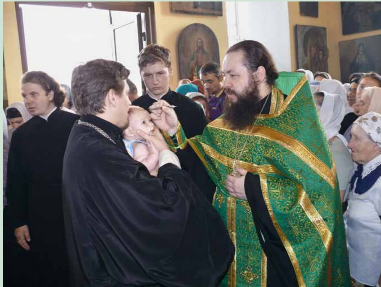
Елеопомазание на всенощном бдении. Соловцовка. 5 августа 2012 г.

✠ – Мне очень сложно сказать и вспомнить то время, когда я впервые услышал о нем, потому что имя старца отца Иоанна у любого воцерковленного человека было на устах, звучало в христианском сердце. Если мы брали поминание любого христианина того времени, то заупокойная страница всегда начиналась поминовением Святейшего Патриарха Тихона, митрополита Петра (Полянского), и дальше, как это ни странно, не поминался никто из почивших пензенских архиереев (хотя среди них были и расстрелянные, но для пензенцев они остались, к сожалению, забытыми), – а вот имя иерея Иоанна Оленевского фактически было записано в каждом помяннике каждой христианской семьи.