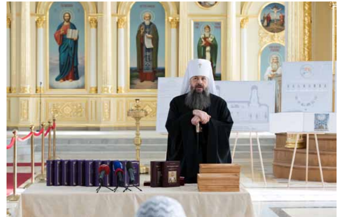
Презентация полного собрания творений свт. Иннокентия. 21 февраля 2021 г.

важно (Мф. 25, 31). Святитель Иннокентий для нас – ярчайший пример, как в очень скудных условиях, фактически на грани жизни и смерти можно делать очень много добрых дел. И я уверен в том, что это он делал именно для того, чтобы совершить эти добрые дела, а не для того, чтобы прославиться: сколько он рукоположил, сколько дел рассмотрел. Он явно видел, что в этом нуждаются люди, а он реально может это сделать. Поэтому для меня святитель Иннокентий – это тот символ, к которому я должен стремиться в своей жизни. Прежде всего, конечно, в святости жизни этого великого подвижника веры и благочестия.