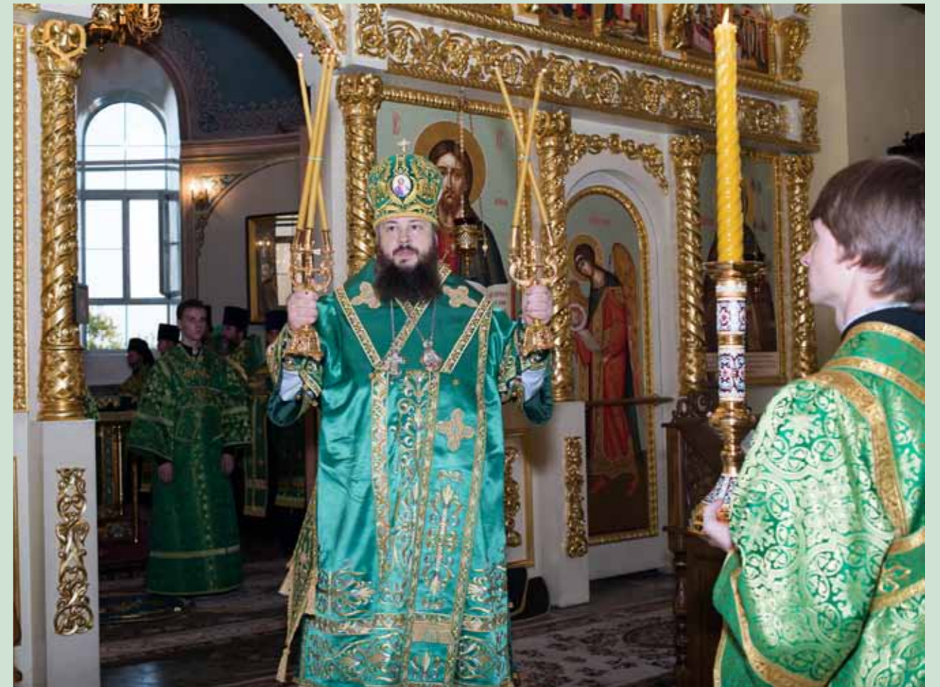
Всенощное бдение накануне дня памяти св. Иоанна. 5 августа 2016 г.