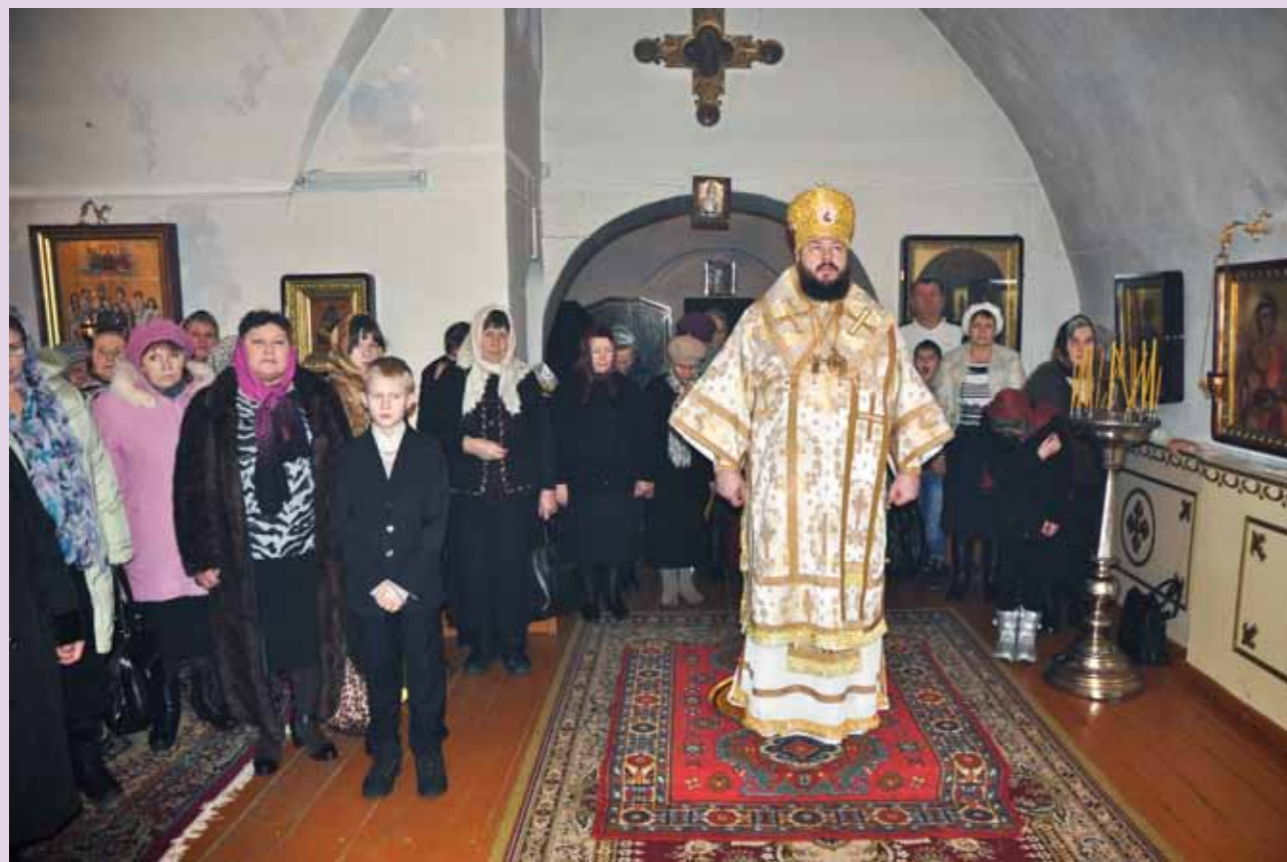
Последняя литургия в сане епископа Кузнецкого и Никольского. Преображенский храм с. Радищево Кузнецкого района. 25 декабря 2013 г.