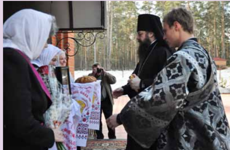
Встреча в Сосновоборске. 5 апреля 2013 г.