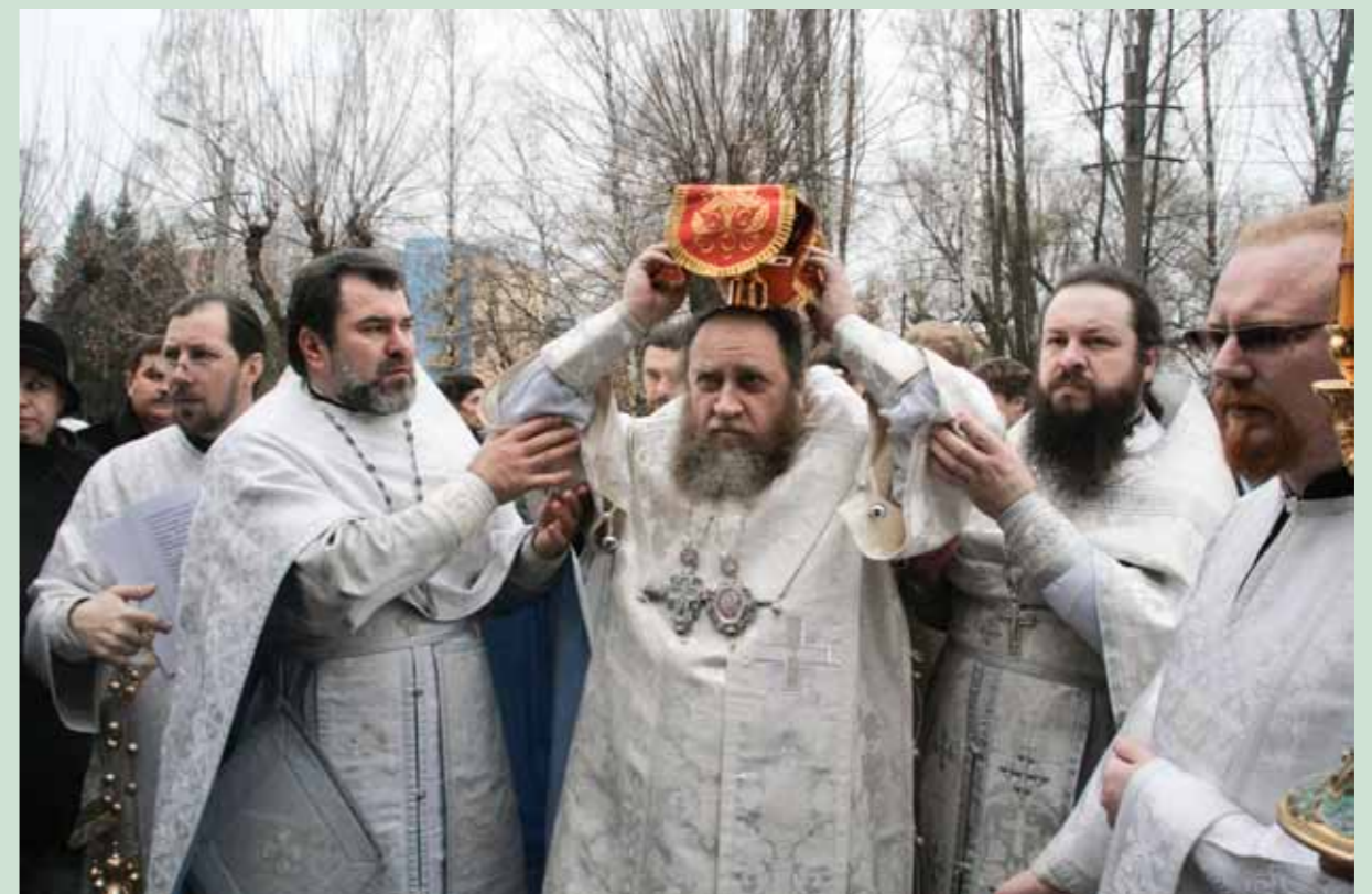
Великое освящение храма мученицы Татианы при Пензенском государственном университете архитектуры и строительства. 7 ноября 2009 г.