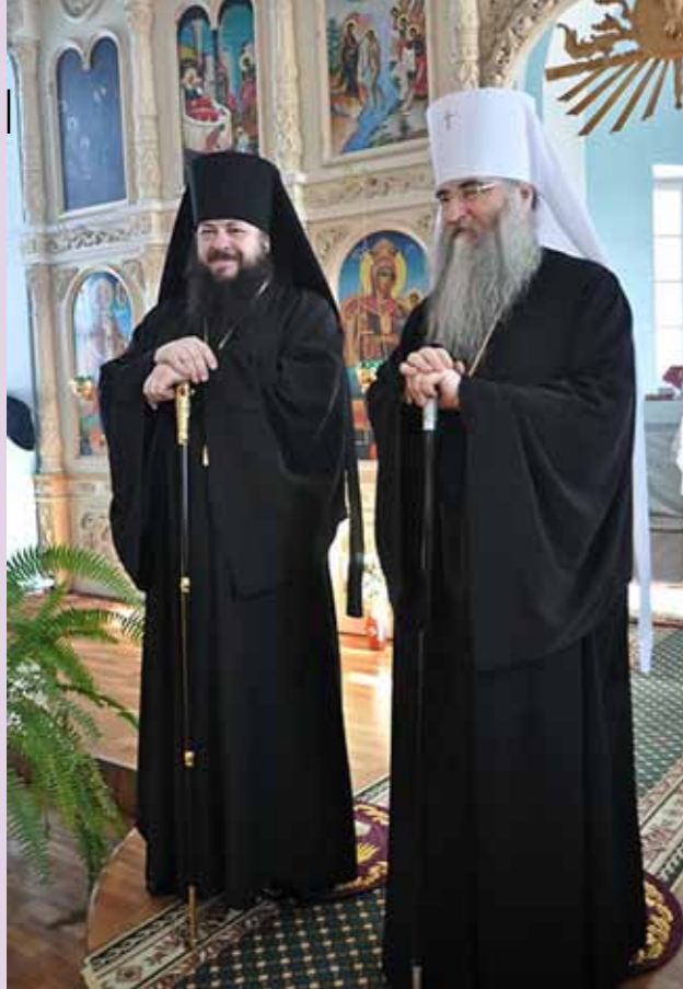
С митрополитом Лонгином после литургии в Космодамиановском храме с. Казаковка Кузнецкого района. 24 февраля 2013 г.