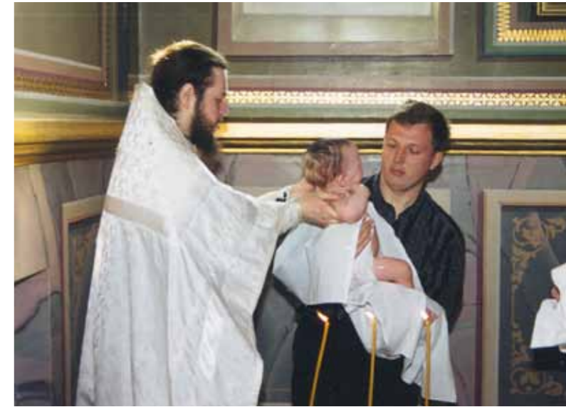
Таинство Крещения. Рубеж 90-2000-х гг.

У владыки было всё четко распределено, это важная и очень правильная черта характера. Мы не мечтали о каких-то должностях, не представляли своих кандидатур, чтобы нас куда-то назначили. Мы четко понимали, что видение владыки – это воля Божия, кото-