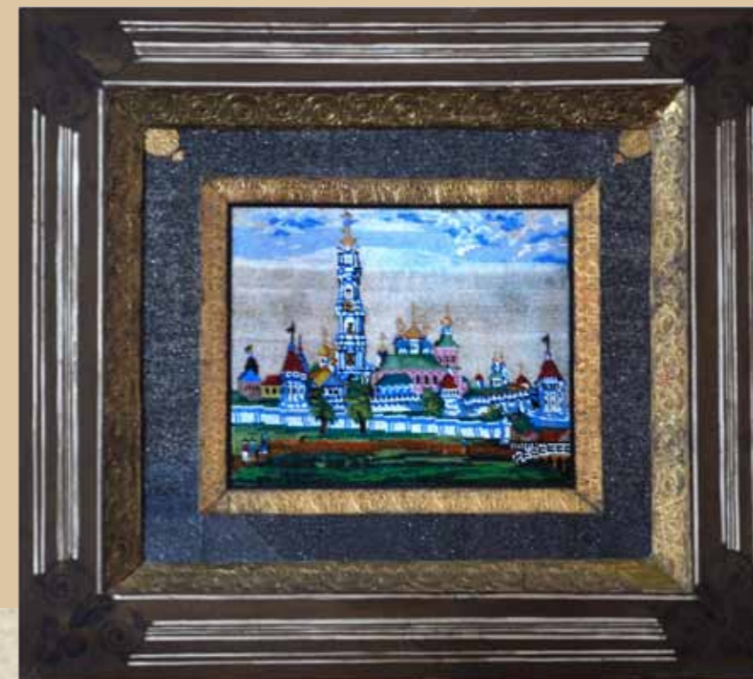
Троице-Сергиева лавра. 10–30-е гг. XIX в. Бисер, ткань, бумага, картон; вышивка