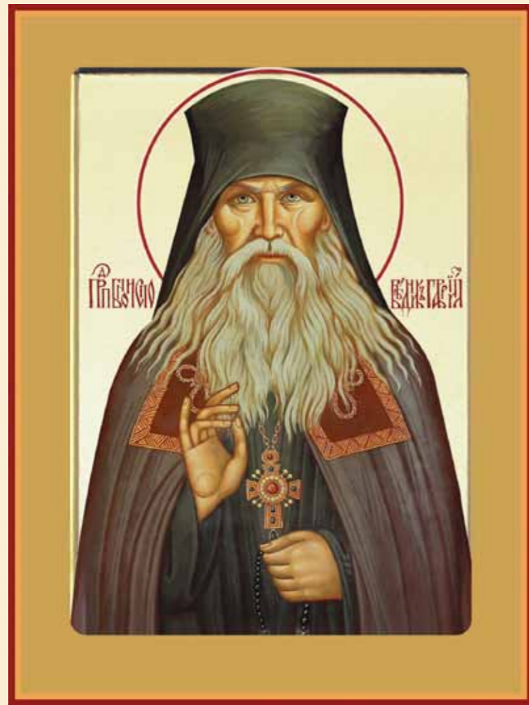
Преподобноисповедник Гавриил Мелекесский (Игошкин; 1888–1959)