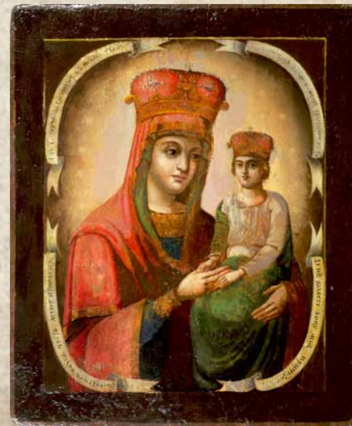
Икона «Богоматерь Споручница грешных». XIX век. Дерево, левкас, темпера

Как выяснилось, икона имеет чрезвычайно интересную историю бытования.