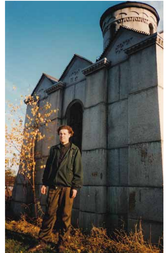
В Аргамаково Белинского района. 1996 г.

Я помню, что при чтении Евангелия у меня возникло много вопросов. Причем, как это ни странно, меня очень смущало, что у Марии Девы были еще дети, я не мог понять: они родились уже после Иисуса Христа? И это мой ум напрягало – с одной стороны, я понимал, что Христос родился от Девы, с другой стороны – как же она могла быть Девой, если у нее были еще дети? Для меня тогда было непонятно, что это были дети Иосифа Обручника. Но меня это будоражило, может быть, в такой детской вере, что в Евангелии что-то недоговорено.