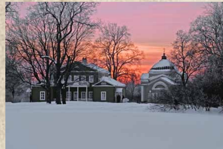
Барский дом и церковь Марии Египетской. Современное фото