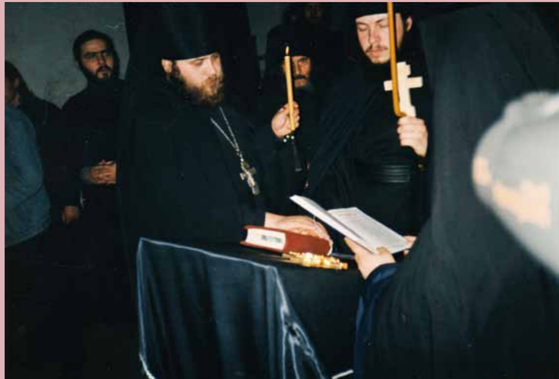
Монашеский постриг. Керенский Тихвинский монастырь. 2 апреля 1999 г.

– Мне очень сложно объективно ответить на этот вопрос, потому что, кроме своей родины, я больше нигде не служил. Я очень благодарен Богу за то, что я служу на своей родине. И это, прежде всего, связано с моими административными обязанностями. Мне здесь проще, потому что когда я стал архиереем, я знал всё духовенство, духовенство знало меня, – и сейчас какие-то вопросы, которые нужно решать, я не то чтобы не задумываясь делаю, но делаю это быстрее, благодаря тому, что я всё это знаю, погружен в эту тематику. Я часто общаюсь со своими знакомыми епископами, и некоторым, которые поменяли не одну кафедру, и всегда говорю о том, что я не понимаю, как в принципе это возможно, потому что уверен: чтобы изучить людей, менталитет народа, на это уходят порой годы, а может быть, даже десятилетия.