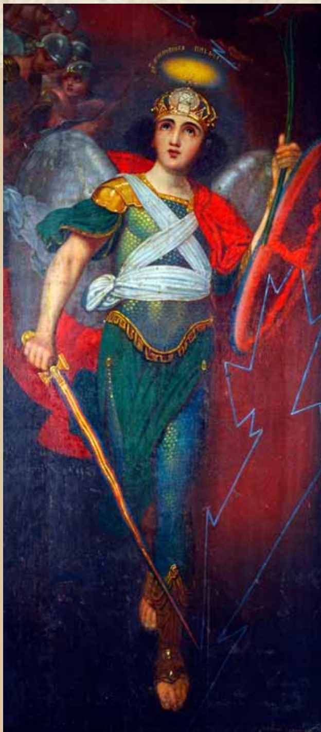
Икона «Архистратиг Михаил». Первая половина XIX века. Дерево, левкас, темпера