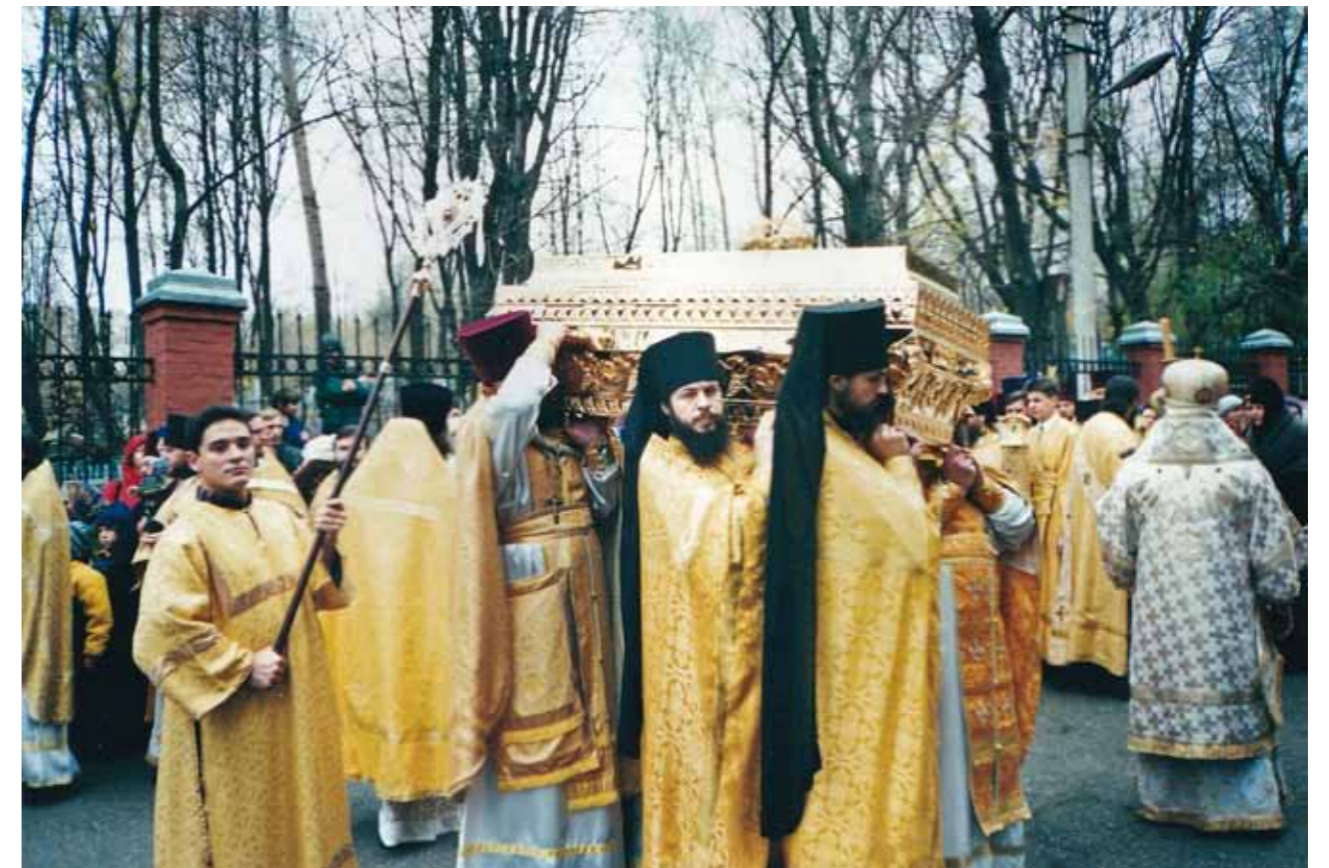
Прославление святителя Иннокентия. Крестный ход вокруг Успенского кафедрального собора. 23 октября 2000 г.

начиная от периодики (например, там есть все епархиальные ведомости всех епархий, которые были на то время, даже в губернских городах не всегда это сохранялось). Кроме того, там масса монографий, которые были написаны профессорами Казанской духовной академии, и я думаю, что для студентов это тоже будет крайне интересно – и в написании своих научных работ, и в целом в сфере их научных интересов. Ну, и безусловно, обмен опы-