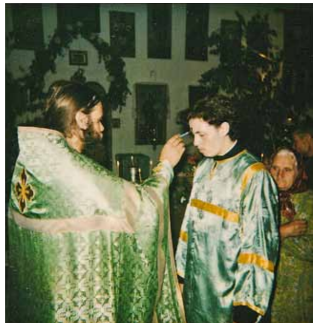
Димитриевский храм Каменки. Троица. Елеопомазание. 1994 г.

Безусловно, самым большим препятствием для моей мамы было принятие монашества, потому что я единственный ребенок в семье, и были чаяния о том, чтобы были внуки, была семья, и для нее это стало определенной скорбью, внутренней трагедией. Поэтому и для меня это тоже был не простой выбор, связанный прежде всего, с тем, чтобы объяснить своим близким и родным – как, зачем и почему. Я вспоминаю, что какие-то мои дальние родственники даже до конца не понимали, что, приняв сан священства, я больше не могу вступать в брак, и некоторые, зная мой юный возраст, еще надеялись, что после этого я создам свою семью и всё будет, как у всех. Поэтому в этом отношении не было какого-то яростного противления этому, но и понимания стопроцентного не было. Всё пришло со временем, с переоценкой каких-то своих личных ценностей родителями и новым взглядом уже на мою новую жизнь.