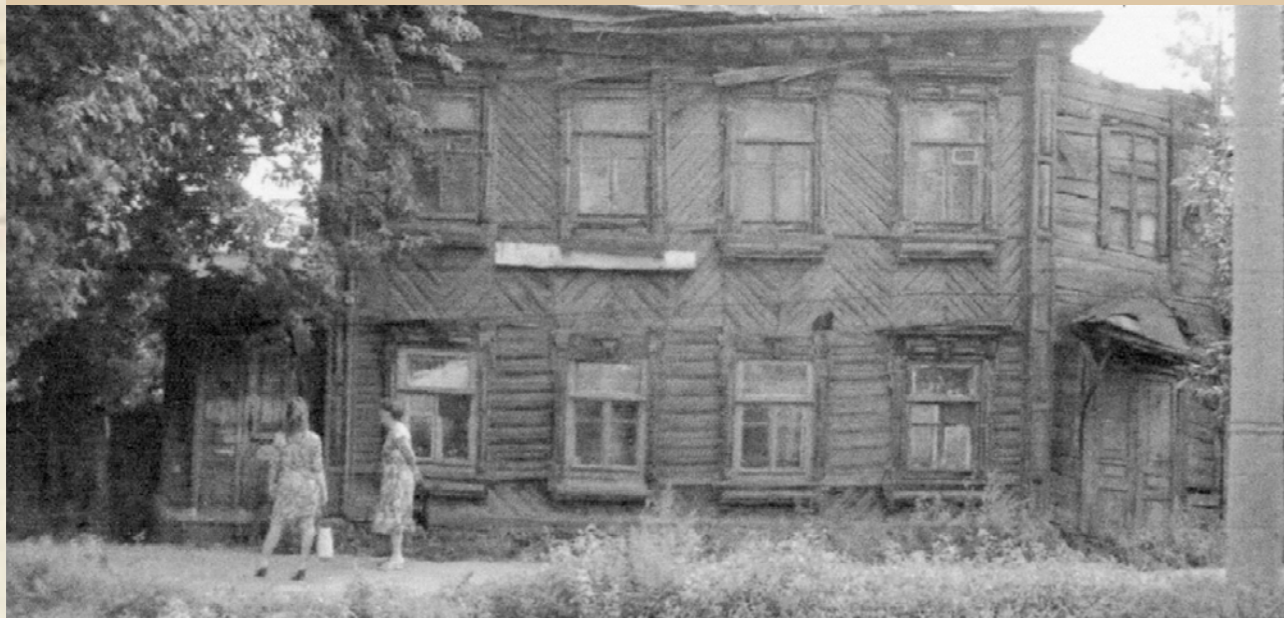
Деревянный флигель – родовое гнездо Поляковых на улице Либерсона, 22 в Пензе. Уничтожен пожаром в 2011 г.