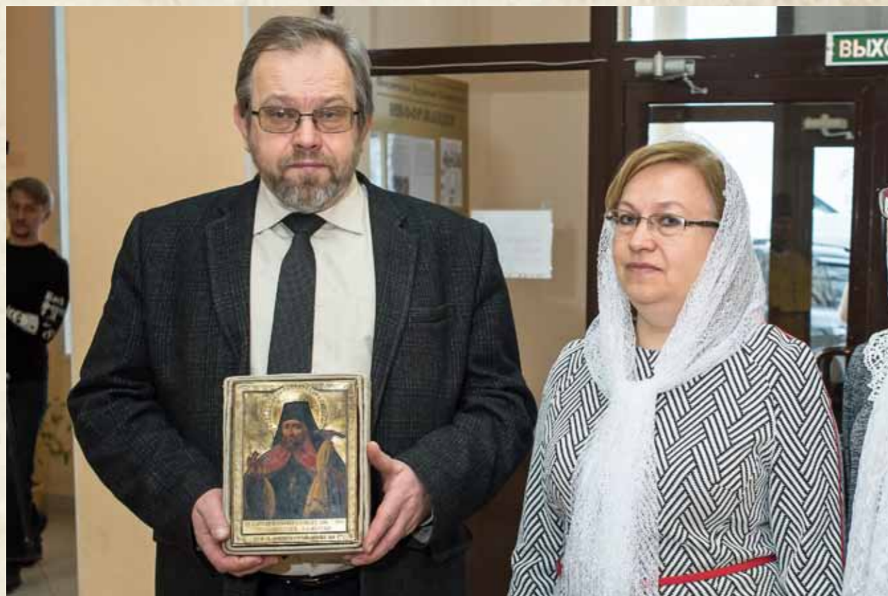
Возвращение иконы в Пензенскую духовную семинарию. 9 декабря 2016 г.

Как признаются и ректор, и сотрудники семинарии, все увидели в этом событии промысел Божий – ведь в эти стены вернулась не просто старинная икона из семинарского храма, а образ небесного покровителя духовной шко-