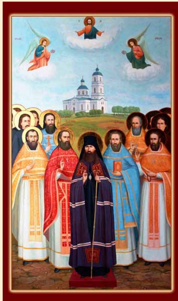
Священномученик Афанасий Милов (1877 – 1937)