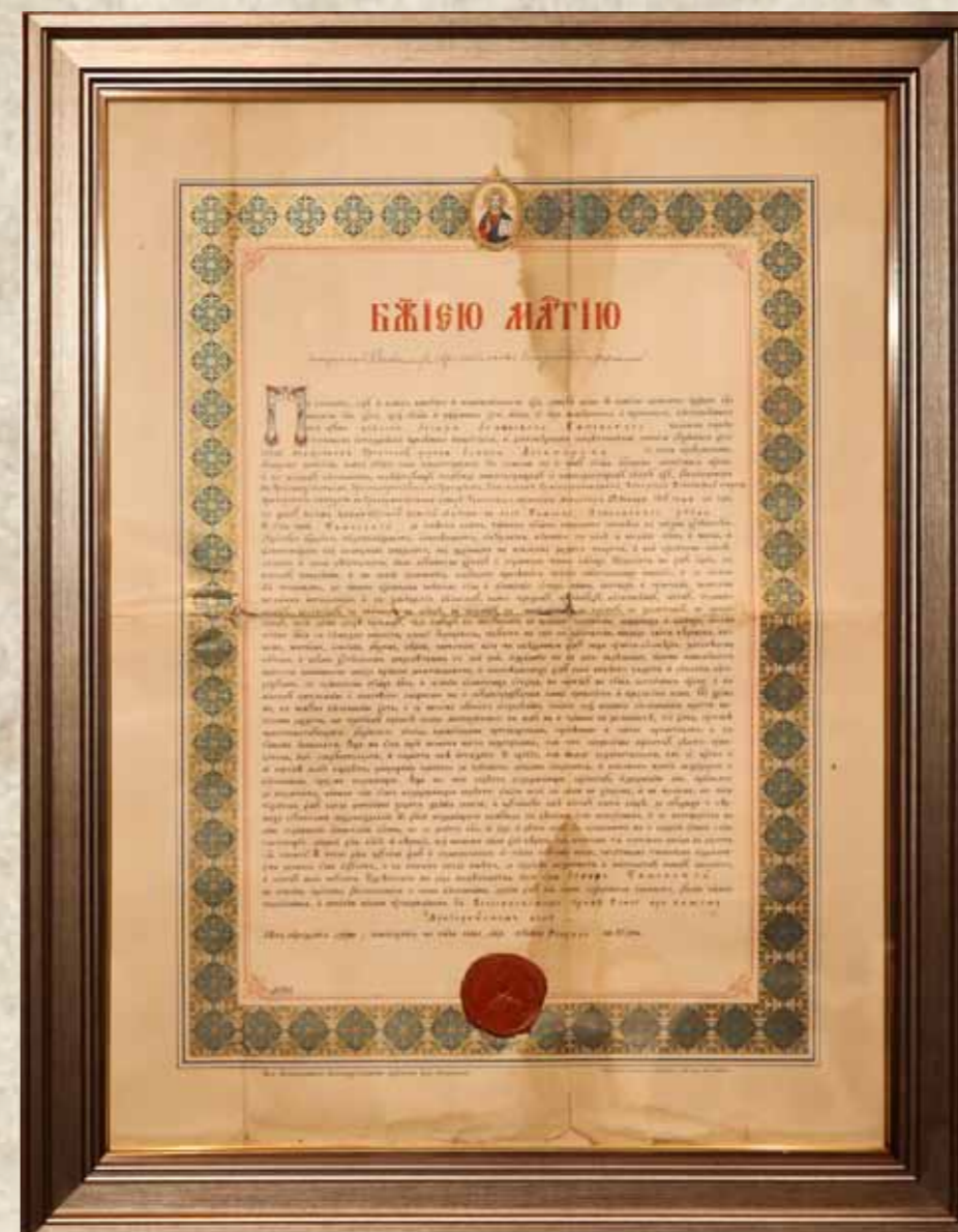
Ставленная грамота священника Иосифа Каменского. 1915 г.

«По приходе в дом он застал такую картину: на грязном полу избы несколькими мужчинами с трудом удерживалась женщина. Ее тело сотрясало судорогами, изо рта шла пена. Отец решительным тоном приказал отпустить