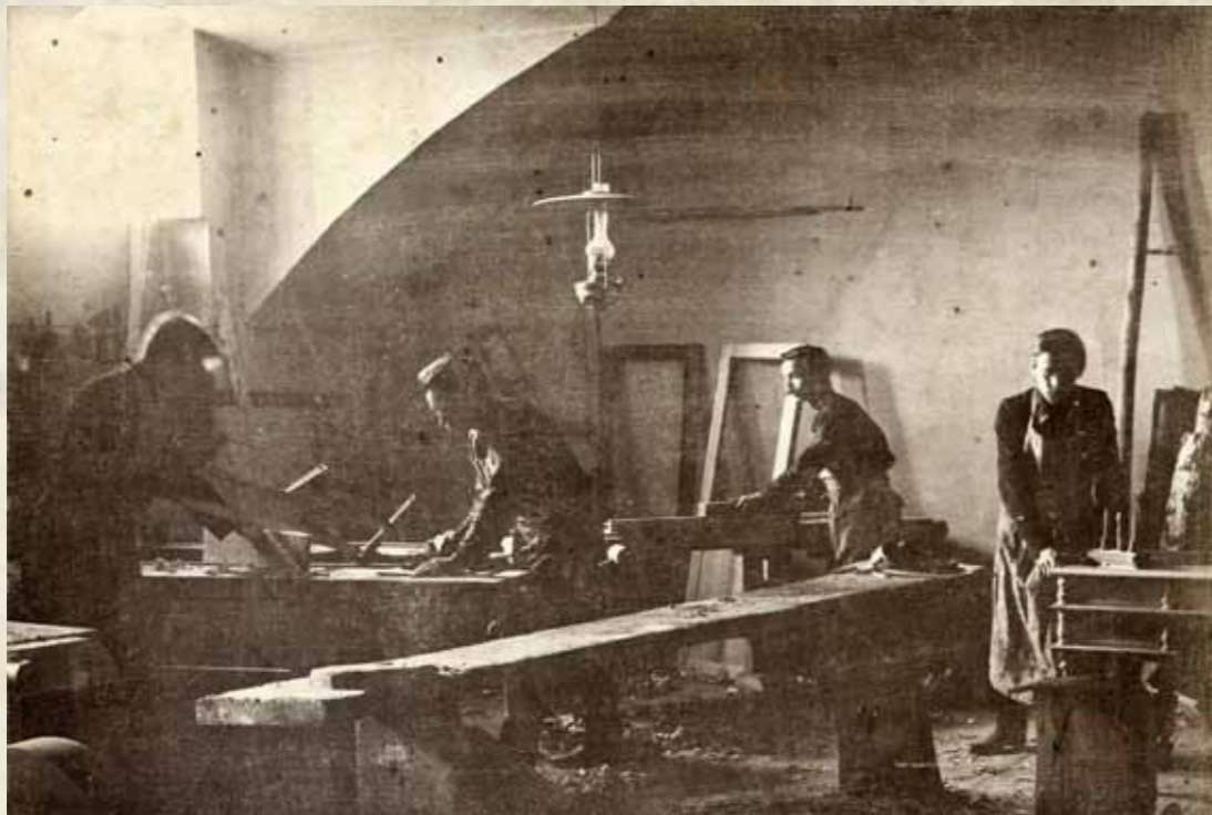
В столярной мастерской духовной семинарии

Проходят годы, события стираются в памяти, а с ними уходят и образы людей, с которыми жил, работал, дружил. Сохраняются лишь наиболее яркие моменты, которые сохранились в памяти. Наиболее четкими запечатлелись представления из детских лет, юношества. Каким же остался в памяти отец? Он был среднего роста, пропорционально сложен, производил впечатление физически крепкого человека, у него были сильные руки, особенно кисти. До пожилого возраста был художавым. Шатен с голубыми глазами. На лице несколько оспин – следы перенесенной натуральной оспы. В сельский период жизни носил небольшую бородку клином и усы, длинные по плечи волосы (под кружало, как тогда говорили). В городское время подстрижен под польку, без бороды, только небольшие подстриженные усы.