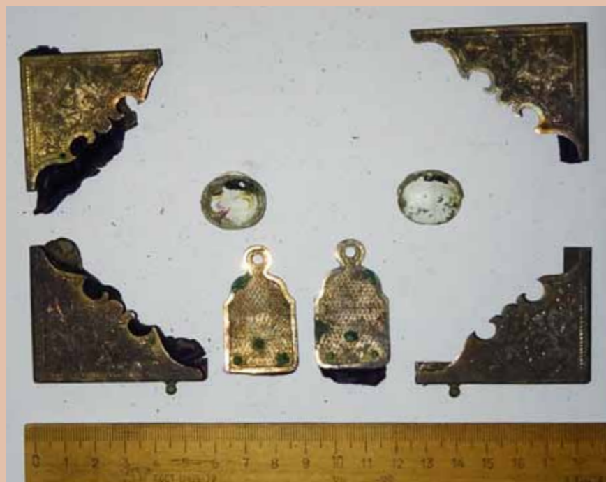
Четыре уголка, две застежки и два эмалированных медальона от Евангелия епископа Григория