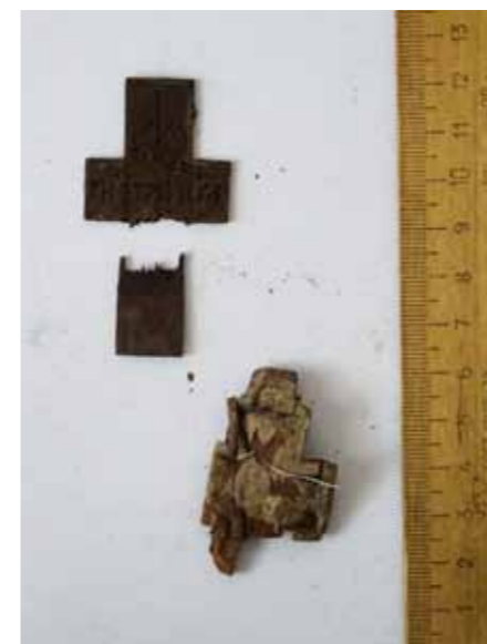
Деревянный крест епископа Антония