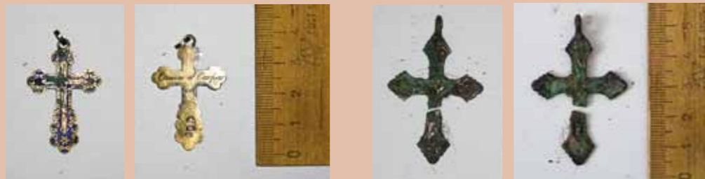
Нательные крестики епископа Григория