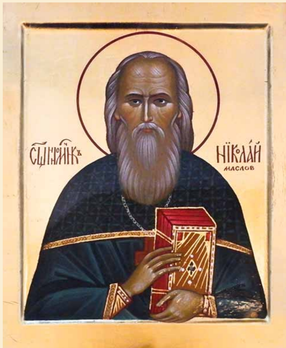
Священномученик Николай Маслов (1874/75–1939)