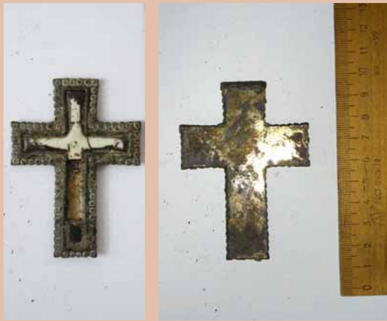
Серебряный наперсный крест епископа Григория