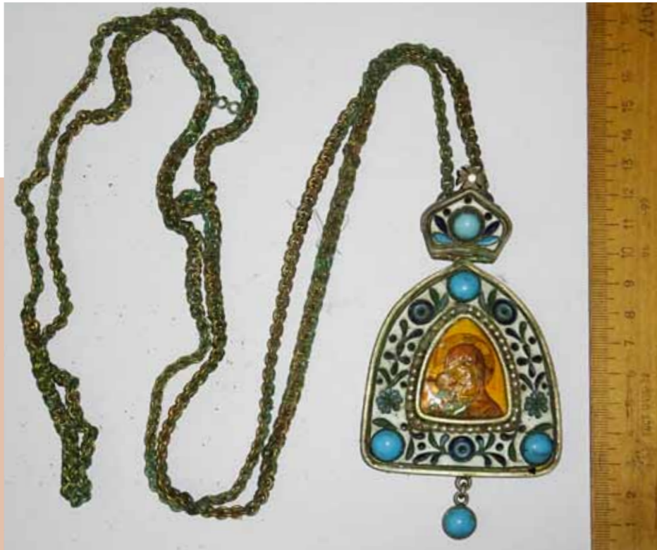
Панагия из гроба епископа Аверсия