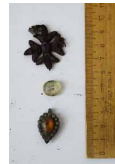
Фрагмент облачения и прозрачный искусственный камень из погребения епископа Амвросия

В гробе епископа Григория сохранился также серебряный наперсный крест, однако без