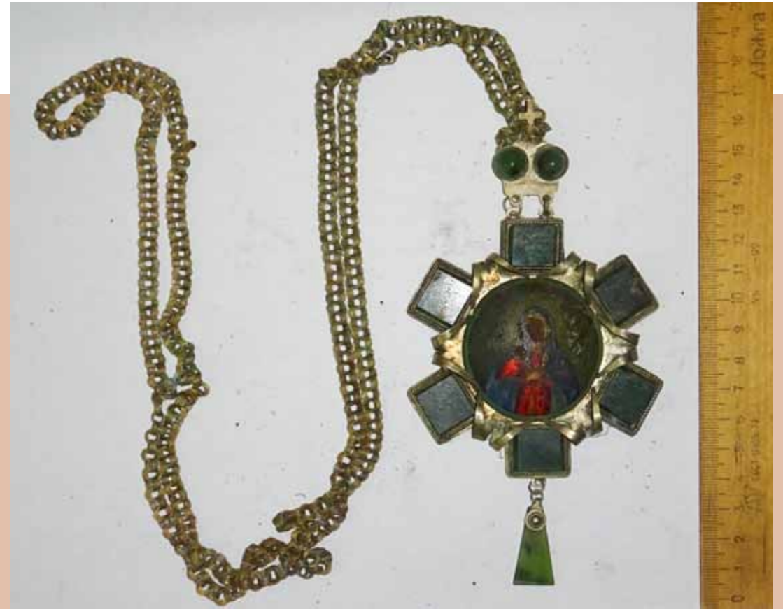
Панагия из гроба епископа Антония