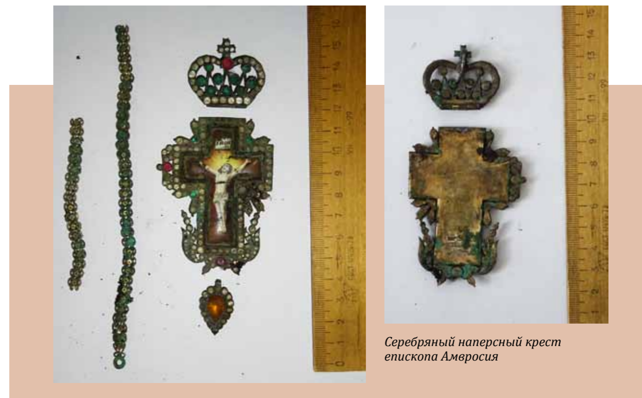
Серебряный наперсный крест епископа Амвросия

Сохранились четыре уголка, две застёжки и два эмалированных медальона от Евангелия. На медальонах, очевидно, были изображены евангелисты, однако от изображений почти ничего не осталось.