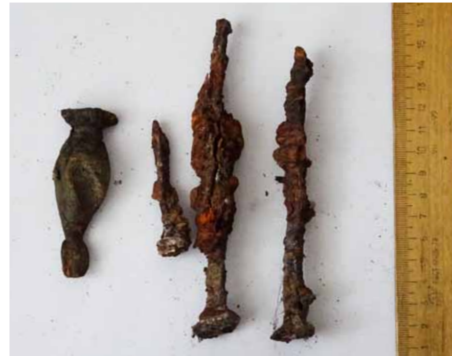
Предположительно, гвозди и резное украшение от гроба епископа Григория

Также в склепе преосвященного Григория сохранились две пуговицы (от архиерейских облачений), три гвоздя и резное деревянное украшение – скорее всего, от гроба.