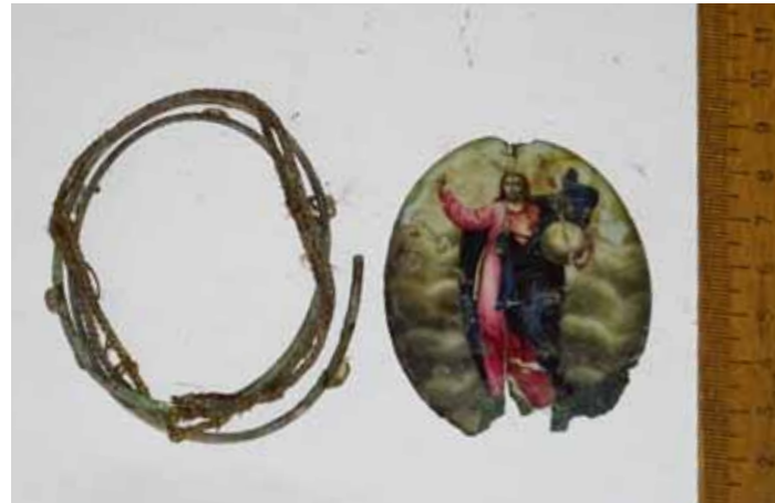
Фрагменты эмалированной панагии епископа Антония

Сохранились фрагменты и от эмалированной панагии, на которой изображен Спаситель в алом хитоне и синем гиматии; правая его рука сложена в благословляющем жесте, а в левой он держит земной шар.