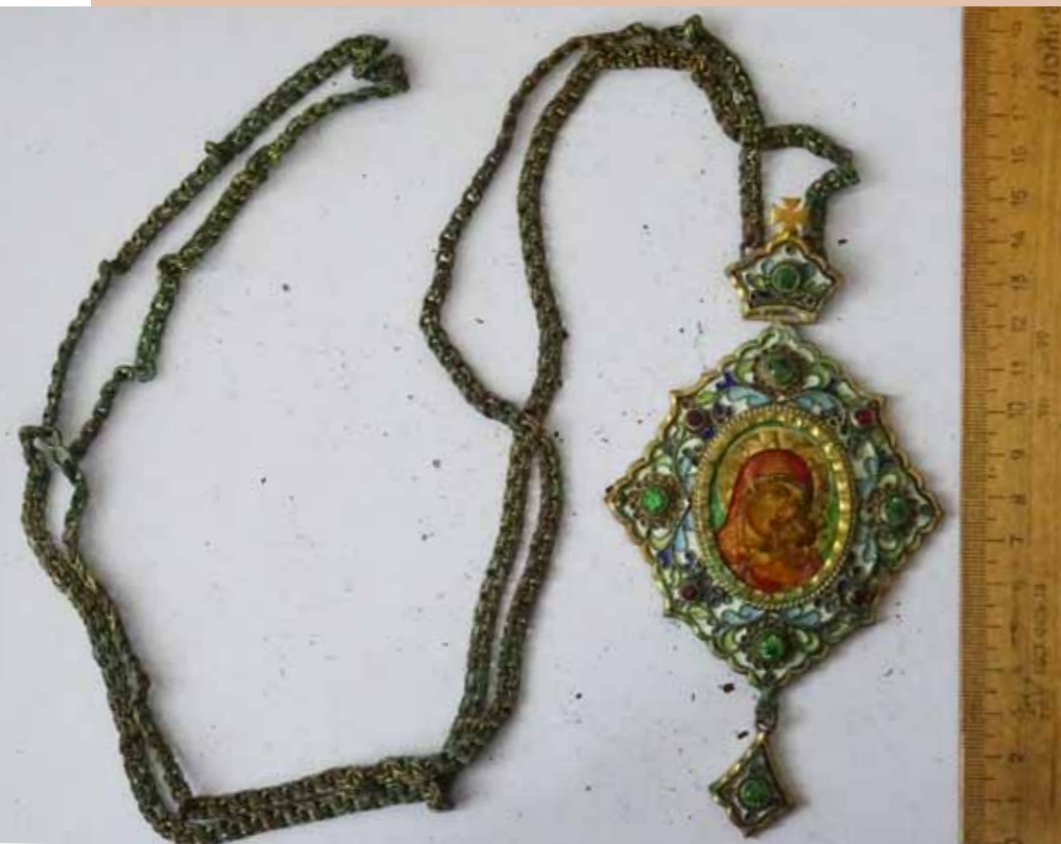
Панагия из гроба епископа Григория