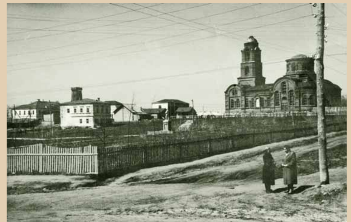
Богоявленский храм в советское время