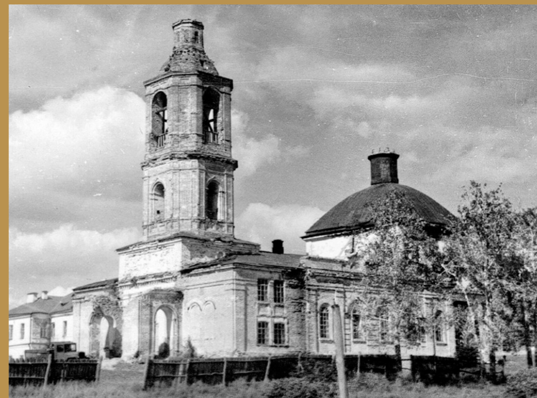
Успенский собор перед разрушением. Середина XX в.