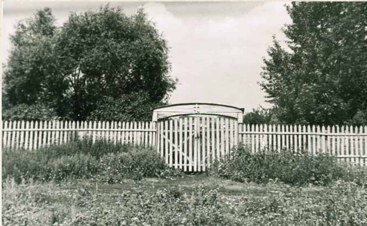
Вход на мокшанское кладбище. Середина XX в.

роста, но плотного телосложения. На нем был белый или серый балахончик (в летнее время), на голове шляпа в тон балахончику, в руках – посох, на руках четки выглядывали из рукава. Белая окладистая бородка обрамляла его лицо, добрые живые глаза излучали свет пречистой его души. Голос тихий, сдержанный. Я думаю, в каждом человеке он видел образ Божий и был со всеми приветлив.