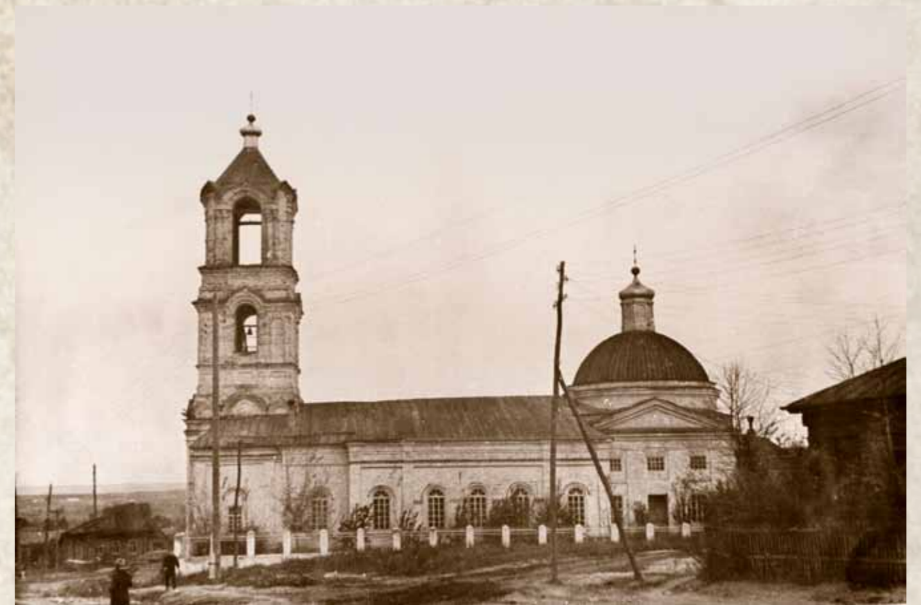
Архангельская церковь Мокшана. 1962 г.

Так вот, эти стукачи, если видели в окно, что кто-то молится, а кто-то читает Псалтирь или другие церковные книги, – доносили властям. На следующий день, ночью, приезжали в эти дома, на кого показывали, и изымали все религиозное церковное: книги, иконы, лампы, свечи и прочее. Причем конвоиры штыками прокалывали все углы и закоулки, ища церковную утварь. Все конфискованное они или сжигали, или разрубали топорами. За такое святотатство многие были наказаны Божьей карой: или неизлечимо болели, или внезапно умирали.