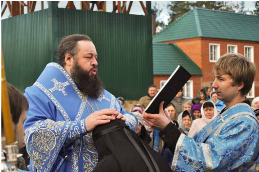
Возведение в сан игумении. 14 октября 2013 г.