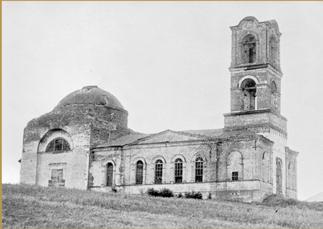
Рождественская церковь. Середина XX в.