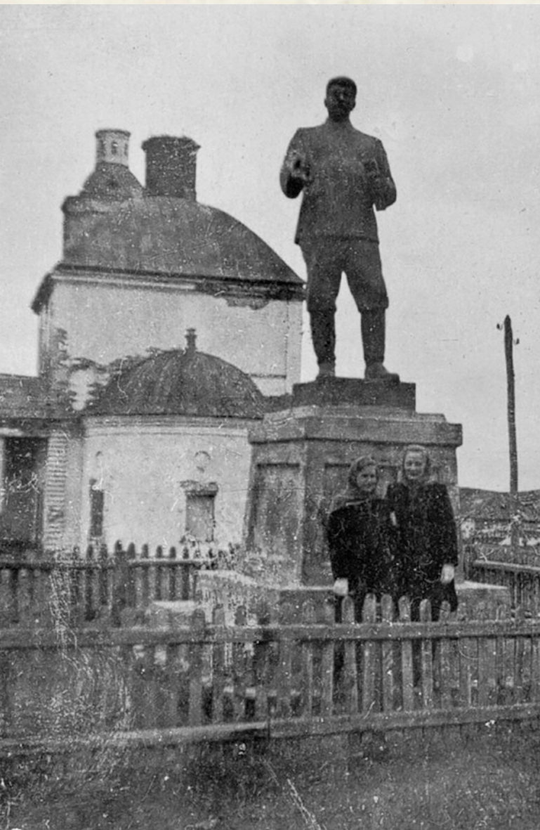
Памятник Сталину за алтарем Успенского собора Мокшана. Середина XX в.

ре после собора, ныне там находится пожарная часть.