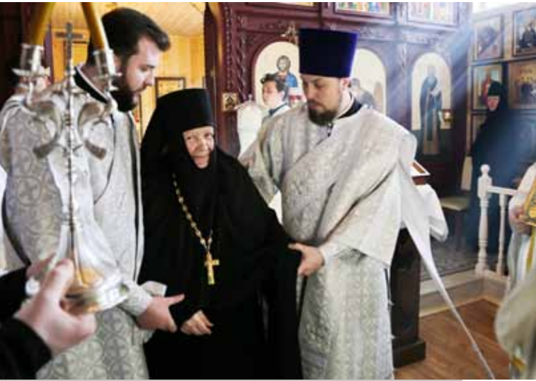
Вручение наперсного креста с украшениями. 16 апреля 2022 г.