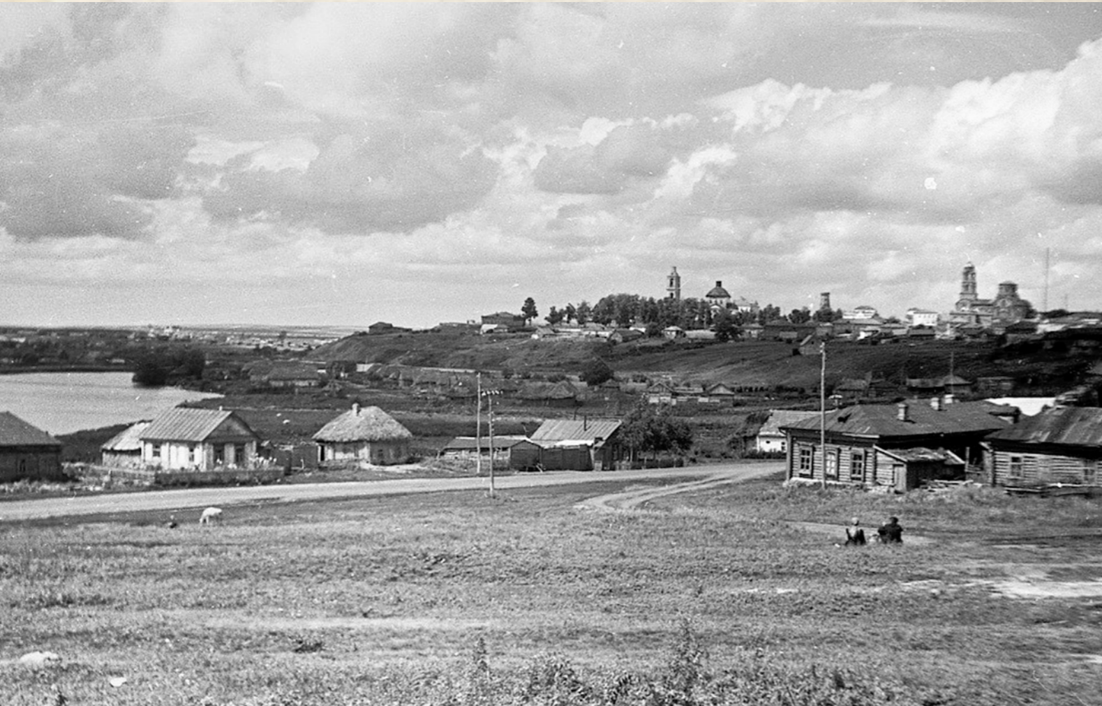
Мокшан в середине XX в.