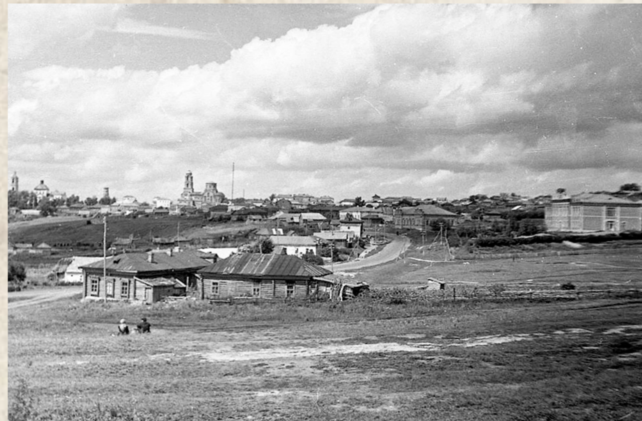
Вид на Мокшан с юго-востока. Слева Успенский собор, в центре Богоявленский храм

Особенный шум стоял в лошадином ряду, где продавали лошадей разных возрастов и мастей, а продавцами были преимущественно цыгане. На выходе сидели походные кузнецы, расположившись прямо на земле. Кузница их состояла из маленьких горнов с вделанными в них соплами, небольших мехов и небольшой наковальней у горна.