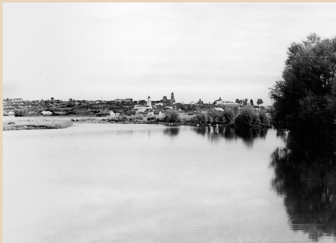
Мокшан в середине XX в. Вид с севера