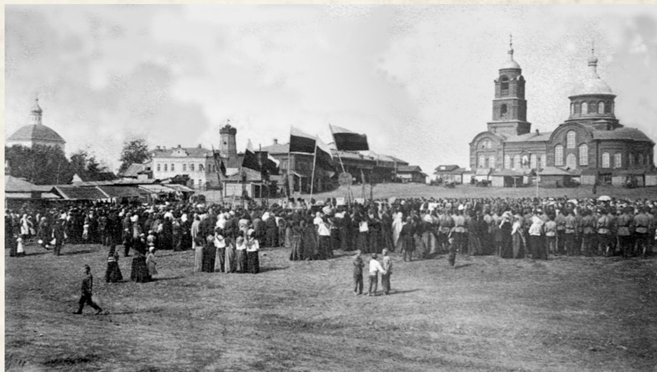
Центральная площадь Мокшана. Первые годы советской власти. Слева виден Успенский собор, справа Богоявленский храм

На ярмарки собиралось много народа, стояли лошадиные подводы с товарами, вокруг суетились покупатели. Продавали пряники, конфеты, игрушки в виде дудочек, глиняных свистулков, кукол, жестяной рожок. Всюду стоял шум и гам продавцов и покупателей, которые похлопывали друг друга по рукам, когда торговались в цене за штуку или аршин.