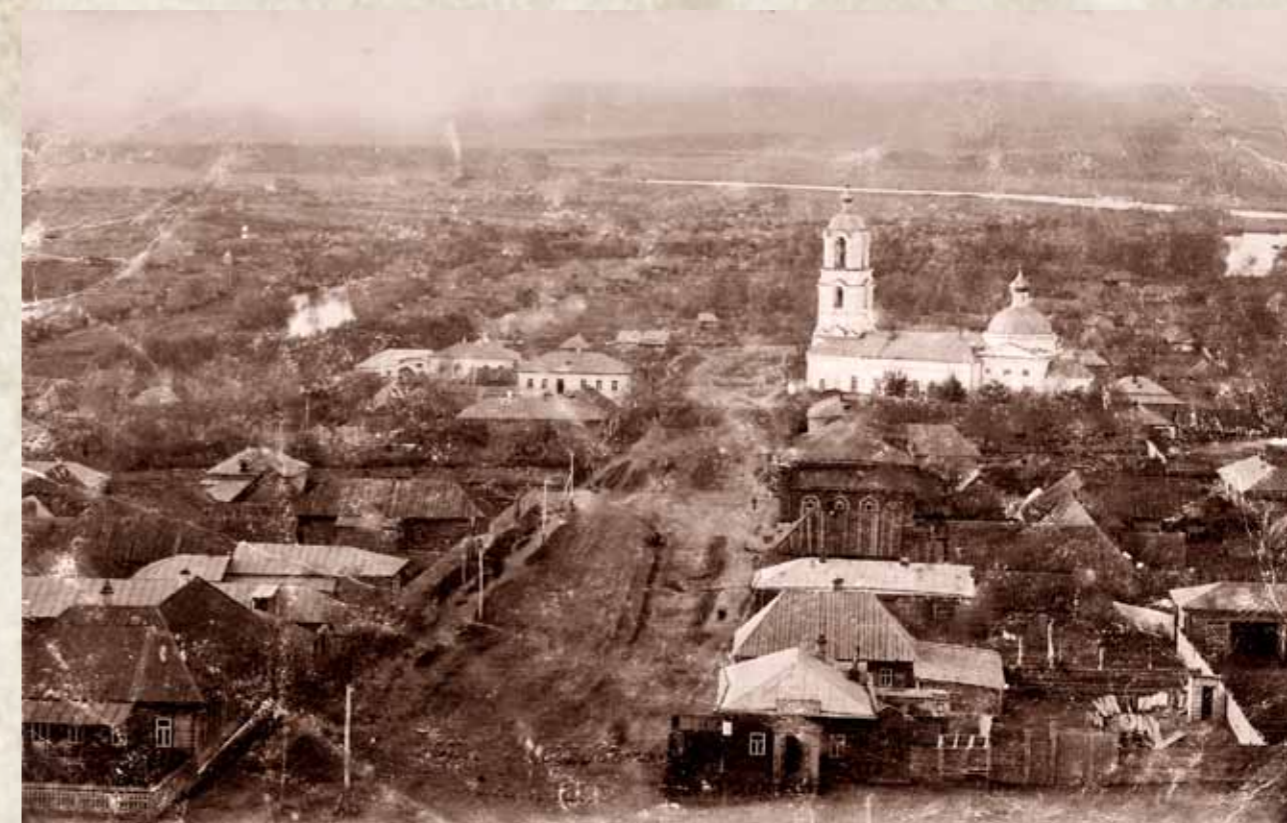
Архангельская церковь. Вид с колокольни Богоявленской церкви. Начало XX в.