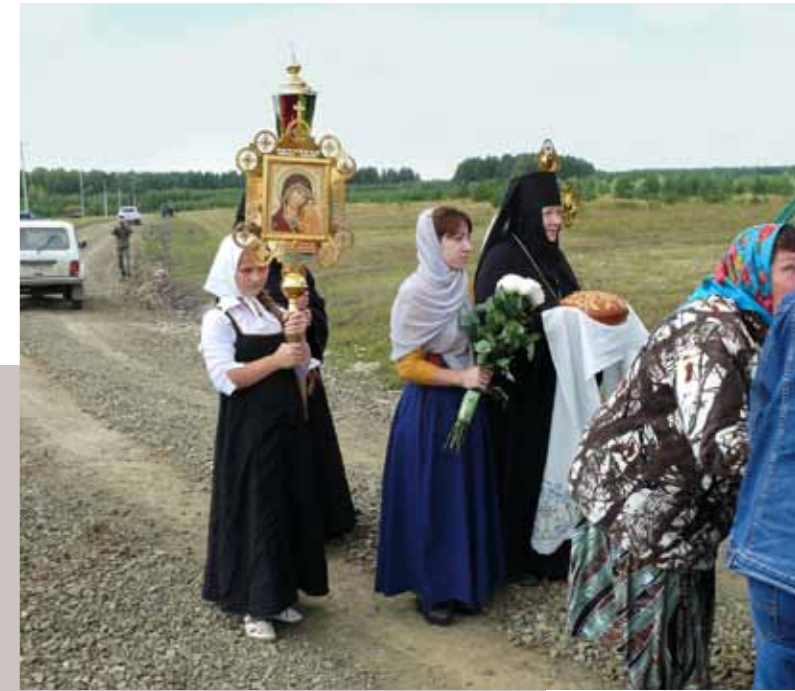
Встреча близ деревни Новая Селя крестного хода с иконами Покровского монастыря, долгие годы хранившимися в Ахматовке. 21 августа 2015 г.