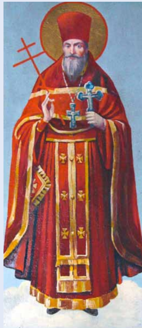
Священномученик Евфимий Горячев (1884–1937)