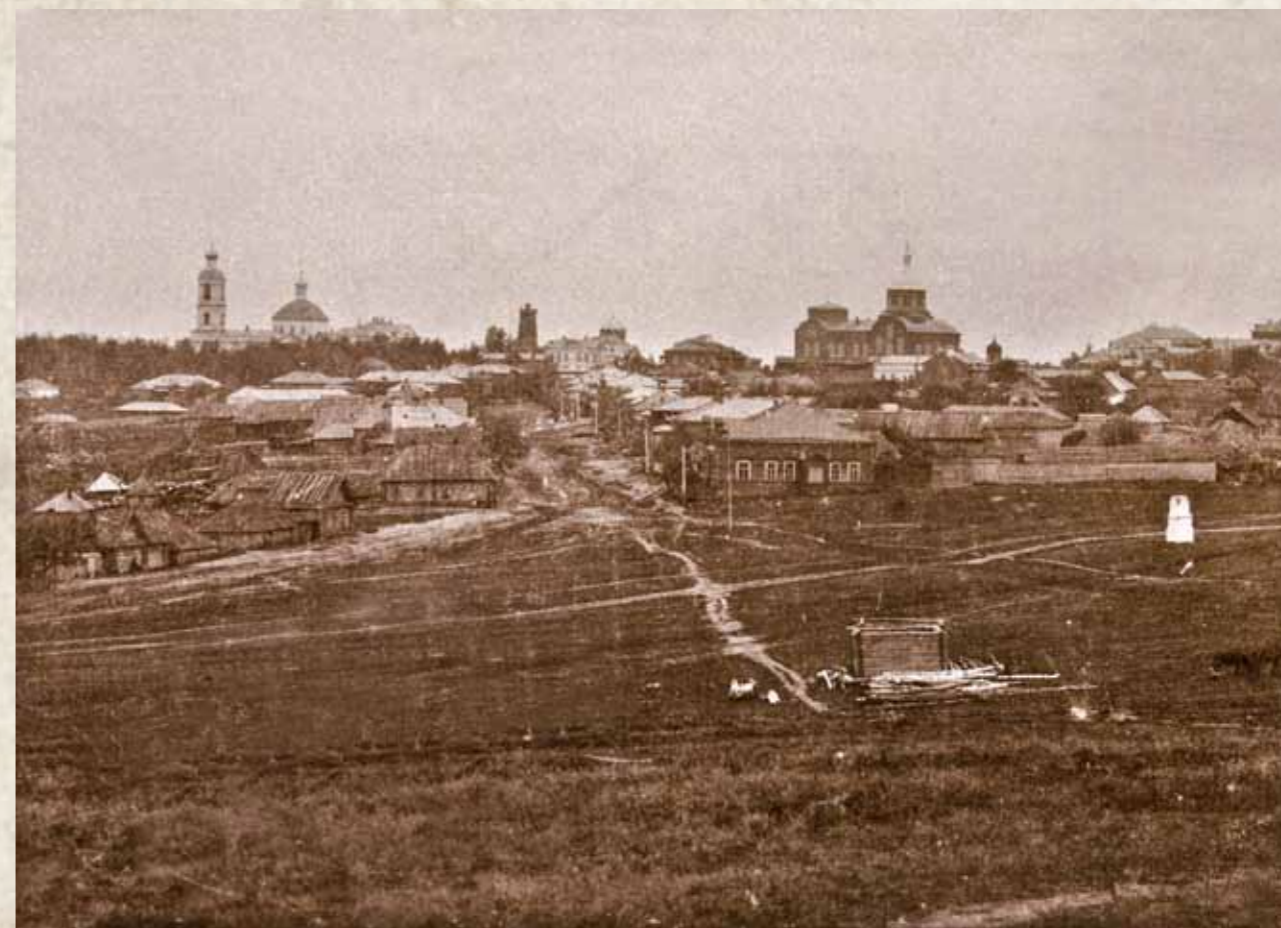
Мокшан в начале XX в. Слева Успенский собор, справа Богоявленская церковь

Когда пришла советская власть, у них со двора увели лошадь, корову и угнали овец.