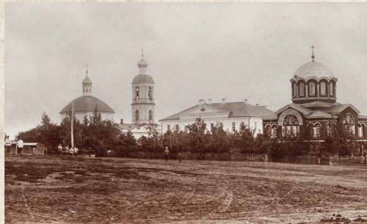
Успенский собор, здание присутственных мест, храм блгв. кн. Александра Невского. Начало XX в.

Собор был построен в конце Конной слободы (ныне улица Пензенская), а в начале Конной слободы стоял храм в честь Рождества Пресвятой Богородицы, он же назывался Троицким, так как главный придел в честь Троицы. Он тоже был взорван в 1973 году, вско-