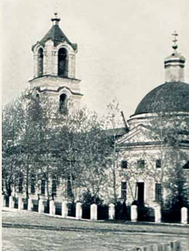
Архангельская церковь. Вид с юго-востока. Середина XX в.