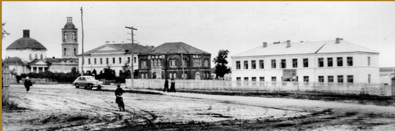
Успенский собор и Александро-Невский храм на стадии разрушения. Середина XX в.