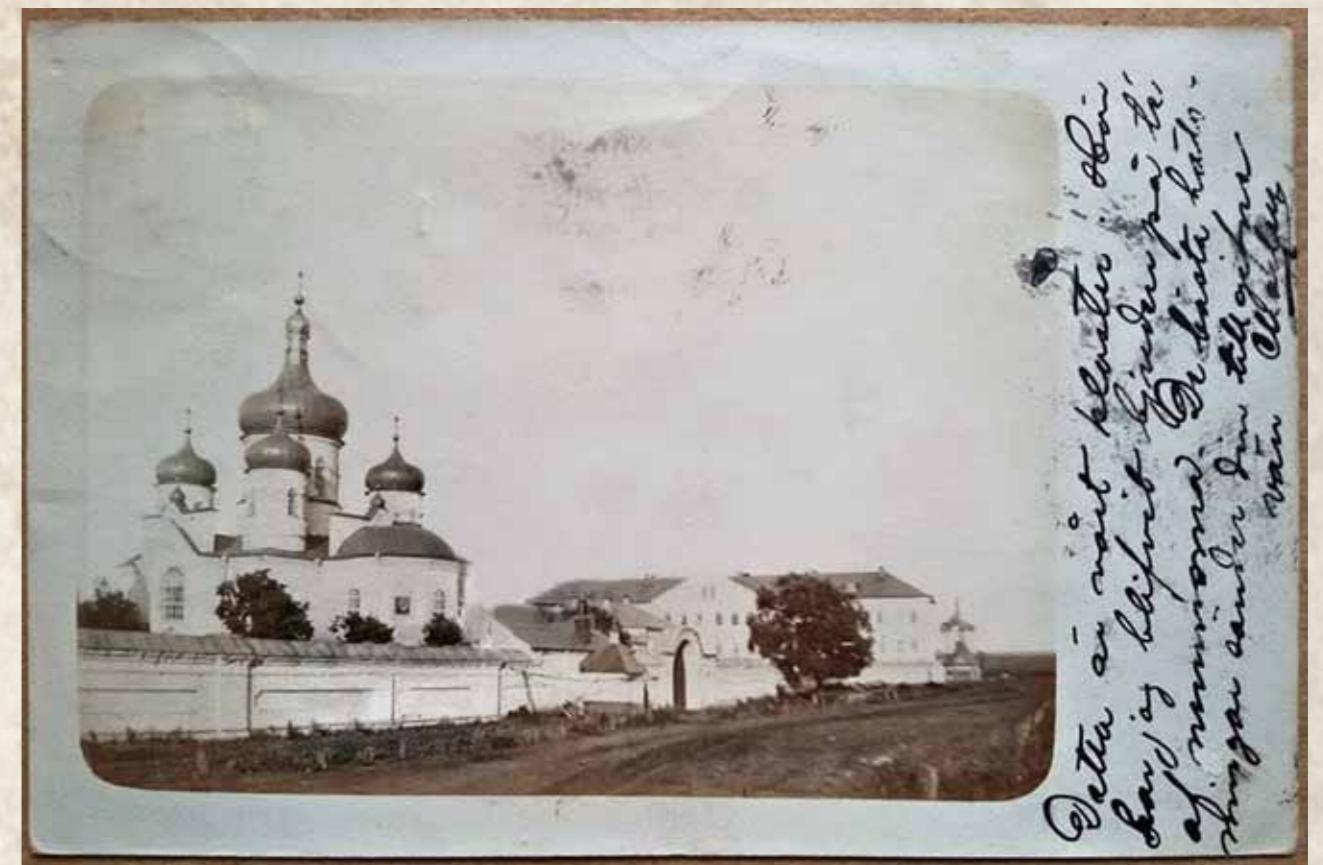
Единственное известное фото Мокшанского Казанского монастыря. Открытка начала XX в. В тексте на сокращенной латыни неизвестный автор (возможно, вчерашний выпускник семинарии) уведомляет, что прибыл и устроился нормально

Ребята перекрикивались с послушницами, которые им отвечали. Далее шла просьба: «Дайте нам яблочков или огурцов, а то и морковки?!» Девчата на мостки клали свои приношения и удалялись в кусты, а ребята переплывали речку и забирали подарки. Из-за кустов наблюдали монашки и смеялись... А старые монашки, которые в это время спали в караулке, просыпались от смеха и шли наводить порядок. В адрес ребят выкрикивали: «Уходите вы, бесы-соблазнитель, отсюда, уходите, не то Господь вас накажет!» Старухи-монашки уводили за собой молодых монашек с поля. Частенько монастырь посылал за полицией, чтобы разогнать молодых ребят.