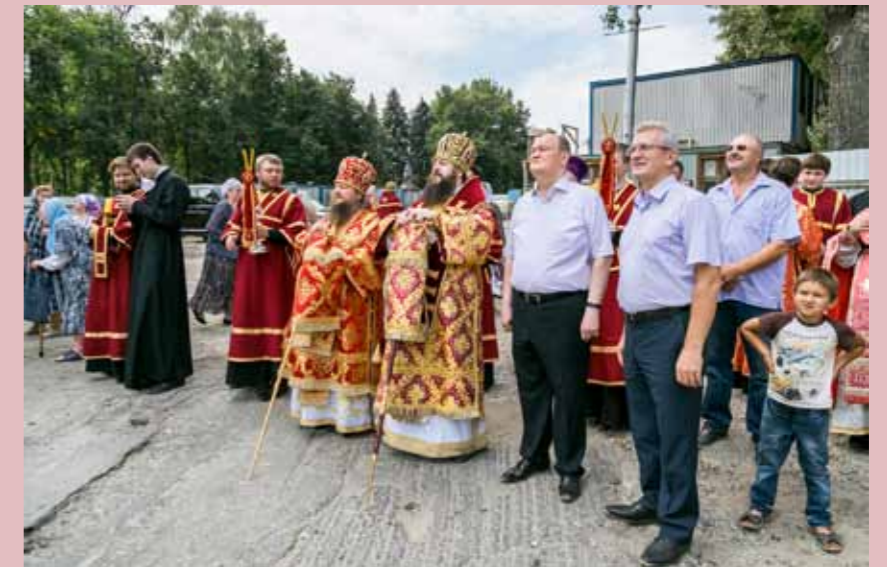
На Спасский собор установлены четыре малых купола. 14 августа 2014 г.

Итак, 2014 год был вообще очень богат на события: это возведение вас в сан митрополита 1 февраля, это первый детский крестный ход и детская литургия перед тогда еще дворцом культуры железнодорожников (сегодня это – снова Богоявленский храм). Это события в семинарии: государственная регистрация бакалавриата в январе, в мае – Георгиевский фестиваль, который стал традиционным, и конференция памяти новомучеников, тоже ставшая ежегодной. И, наконец, конечно же, 2014 год – это этапы восстановления Спасского кафедрального собора: сначала установка малых куполов, потом, в самом конце года, 28 декабря – и центрального купола.