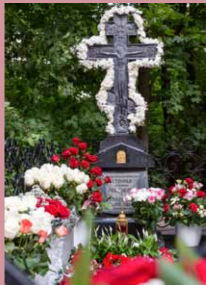
День памяти архиепископа Серафима. 2-3 июля 2015 г.

– Безусловно, здесь мой выбор остановится на владыке архиепископе Серафиме, поскольку это человек, который рукоположил меня в священник, и в течение трех с половиной лет я имел счастье служить под его руководством – как очень опытного пастыря, строгого, но любящего Церковь. Еще до архиереяства я всегда владыку вспоминал очень