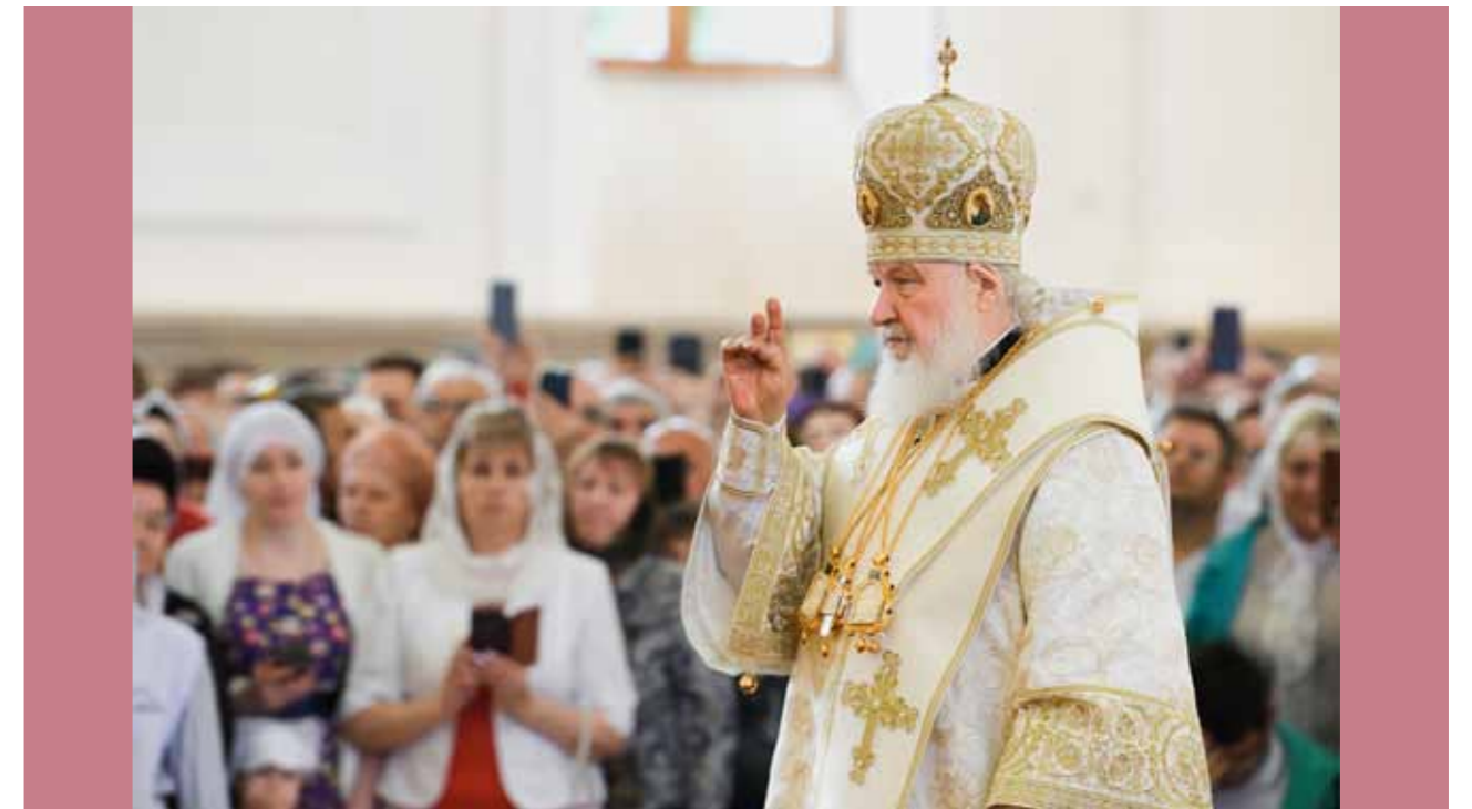
Святейший Патриарх Кирилл в Пензе. 19 июня 2022 г.

мя эта дата всегда отмечался в Пензенской губернии – наравне с днем кончины. И поэтому мы еще раз (поскольку святитель Иннокентий является главой нашего Собора святых) увековечили этот день, и я надеюсь, что он будет актуальным на многие-многие десятилетия и столетия для пензенцев, они будут открывать еще многих святых, – как вы в недавнее время это сделали, когда занялись изучением визита в пределы нынешней Пензенской области митрополита Киевского и всея