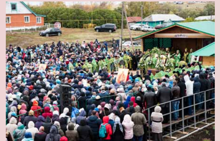
Прославление блаженного Иоанна Кочетовского. 6 октября 2018 г.