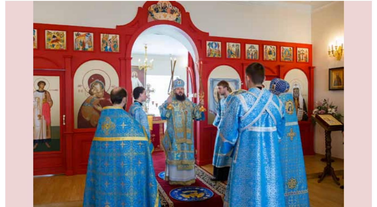
Освящение храма Нерукотворного образа Спасителя при архиерейском доме. 16 апреля 2016 г.

добрым словом и благодарен ему за то, что он в меня как в священнослужителя вложил. Я должен сказать, чтобы это было объективно понято, – я не был каким-то ближайшим его учеником или ближайшим помощником, я был сначала рядовым священником кафедрального собора, потом он меня назначил ключарем, и эти должности не предполагали какого-то его личного особого ко мне отношения.