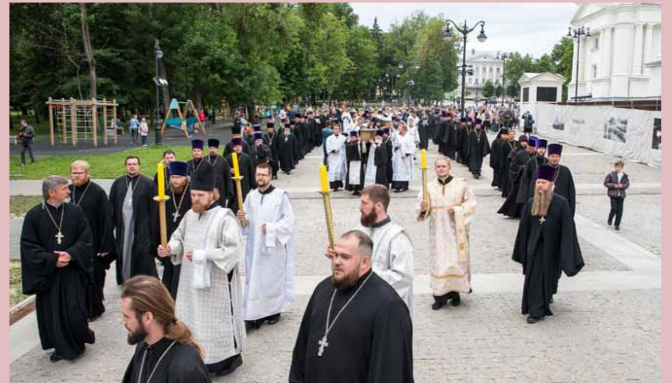
Перезахоронение останков четырех архипастырей. 11 июня 2023 г.