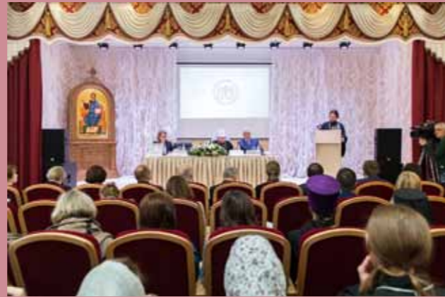
1 Международная научно-практическая конференция «Христианство и педагогика: история и современность» в Пензенской духовной семинарии. 19–20 октября 2017 г.

освящен мной чуть раньше, был построен архиепископом Варлаамом (Успенским) в качестве усыпальницы для архиереев (что не осуществилось, потому что самого владыку Варлаама перевели, а его преемники построили усыпальницу рядом с кафедральным собором, где последние дореволюционные архиереи, скончавшиеся на этой кафедре, и упокоились, и ее сейчас тоже, кстати говоря, мы восстановили). А храм на третьем этаже непосредственно связан с именем святителя Иннокентия Пензенского (хотя владыка Иннокентий жил на втором этаже, но храм был на третьем этаже). Мы знаем, что из-за своей болезненности большинство богослужений в Пензе были проведены им именно в этом храме. Кроме того, большинство священников, которых он рукоположил в городе Пензе, рукоположены именно здесь (а тогда была нестандартная ситуация, – владыка Афанасий был отправлен на покой, будучи довольно в добром здравии, и находился здесь, в Пензе, но рукополагать новых священников ему было запрещено, и временно управляющий епархией епископ Тамбовский должен был либо к себе их вызывать, либо приезжать в Пензу, что, естественно, епископ Тамбовский не делал, а святитель Иннокентий очень долго ехал в Пензу по своей болезненности, и накопилась большая очередь, поэтому чуть ли ни ежедневно владыка Иннокентий совершал богослужения ради того, чтобы рукоположить недостающих священников). Поэтому этот храм очень и очень