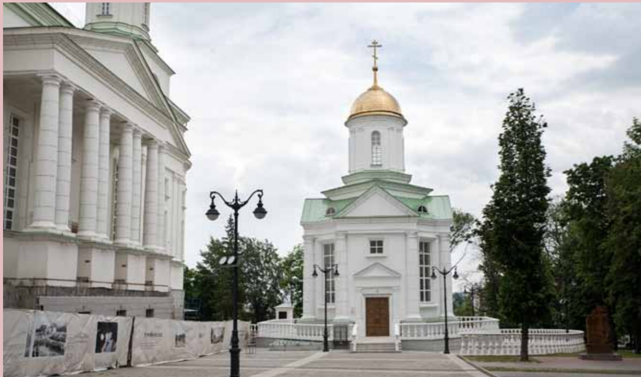
Евламповская церковь-усыпальница при Спасском кафедральном соборе. 2023 г.