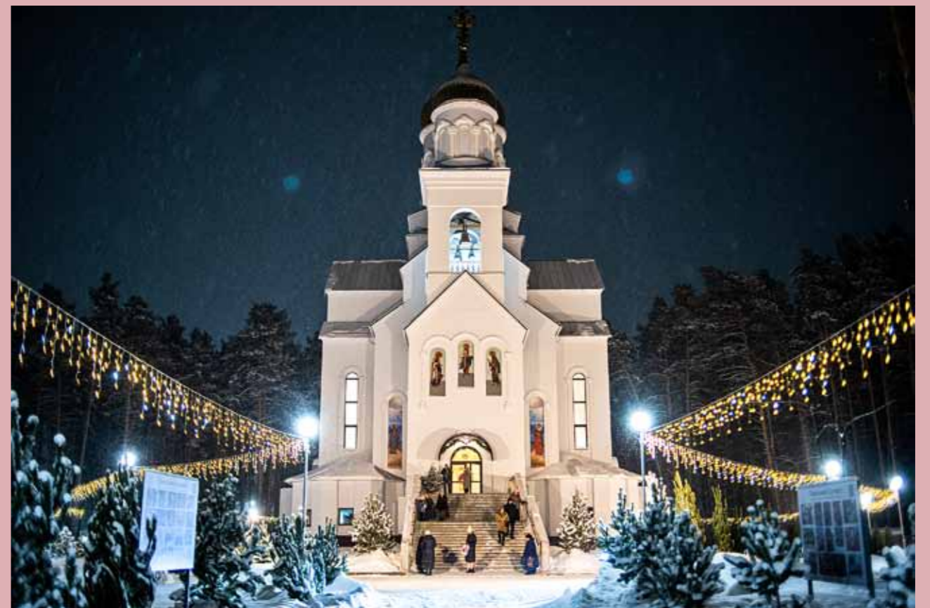
Храм Серафима Саровского в Заречном