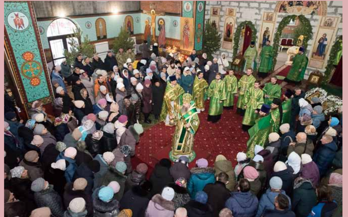
Первая литургия архиерейским чином в Серафимовском храме Заречного. 15 января 2023 г.

Дело в том, что во всей системе закрытых атомных городов Заречный оставался последним городом, в котором не было соборного храма. Город большой – 64 тысячи человек, и там, конечно, есть маленькие храмы, большой молитвенный дом, но именно соборного храма там не хватало. Я не могу это не расценить как чудо: в свое время я хотел обратиться за помощью в «Росатом», и они, поскольку их центр находится в Сарове, выразили желание, чтобы храм носил имя преподобного Серафима Саровского. Так вот, когда мы этот храм переименовали (нижний придел теперь в честь