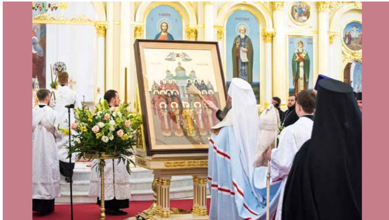
Освящение иконы Собора святых Пензенской митрополии. 12 июня 2021 г.