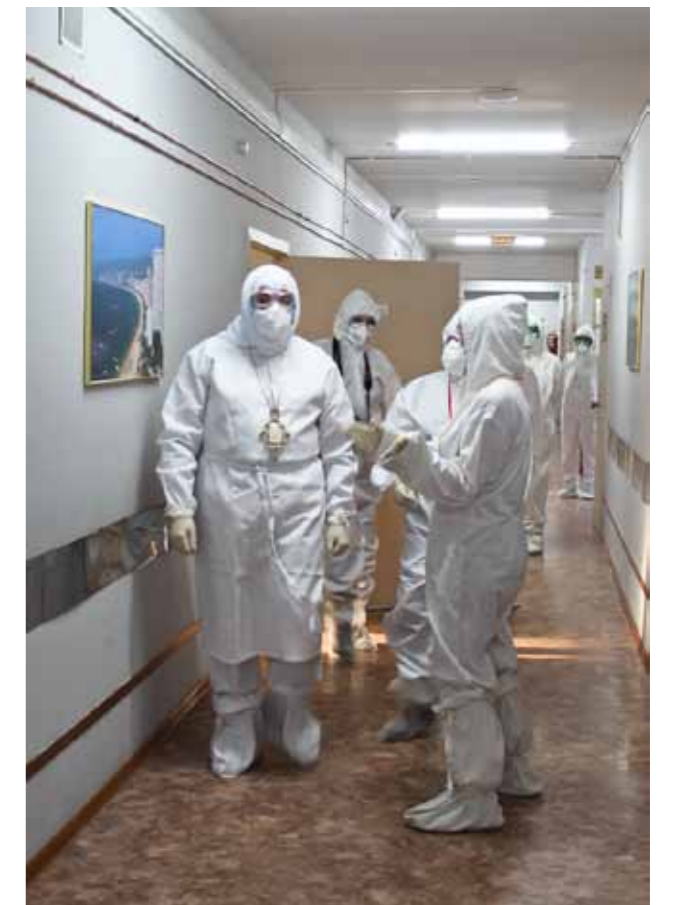
Митрополит Серафим посетил пациентов с коронавирусом в «красной зоне». 19 января 2021 г.

– В 2020 году, как говорится, благодаря и вопреки, всё равно проходила какая-то епархиальная жизнь: например, вы освятили храмы в Константиновке и в Камайке, было положено начало стройке нового со-