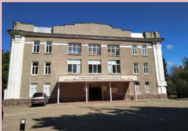
Богоявленский храм Пензы. 2019 г.

– Остановлюсь на Богоявленском храме. Постановление о его передаче было подписано еще в Советском Союзе, но, к сожалению, Цер-