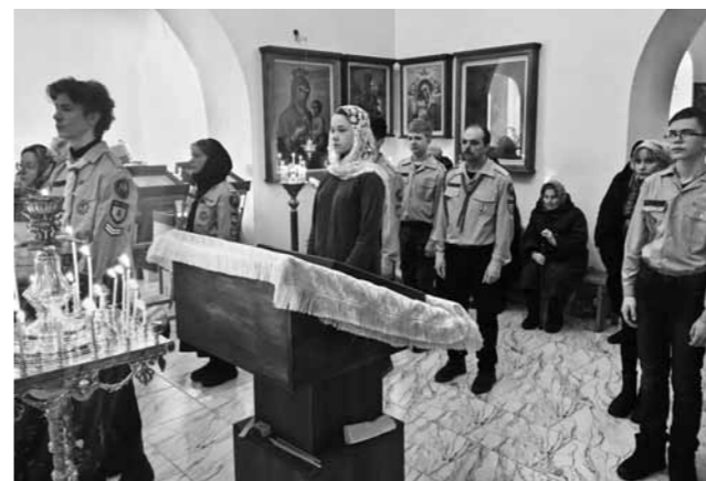
Разведчики на литургии в шемышейском храме свт. Николая Чудотворца

очередного сбора и ездил туда, старалась участвовать во всех мероприятиях. После 9 класса поступила в Пензенский социально-педагогический колледж и продолжаю работать в этой молодежной православной организации.