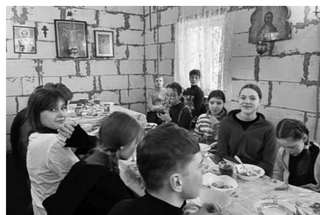
Обед в трапезной после долгого похода

– Несколько лет назад разведчиков-добровольцев в нашей области было куда больше, чем сейчас. Отряды работали не только в Пензе, но и в Каменке, Пачелме, Земетчине. Я как раз из Земетчина. Семья у нас православная, многодетная. Я – старшая из детей. Поэтому на меня у родителей особо не было времени. Записалась в отряд, стала участвовать в сборах, ходить в храм на службу. Но вскоре отряд распался. И осталась я разведчицей-одиночкой. Самостоятельно в интернете узнавала о месте и времени