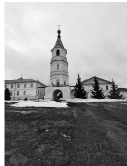
Тихвинский Керенский мужской монастырь в Вадинске

трополита Пензенского и Нижнеломовского Серафима совещанию в областной прокуратуре, где совместно с представителями Росреестра, Росимущества, областного Департамента госимущества, областного Управления культуры и самой прокуратуры как надзорного органа были решены проблемы трактовки Федерального закона. Была достигнута договоренность об оказании содействия прокуратуры в однозначной трактовке закона,