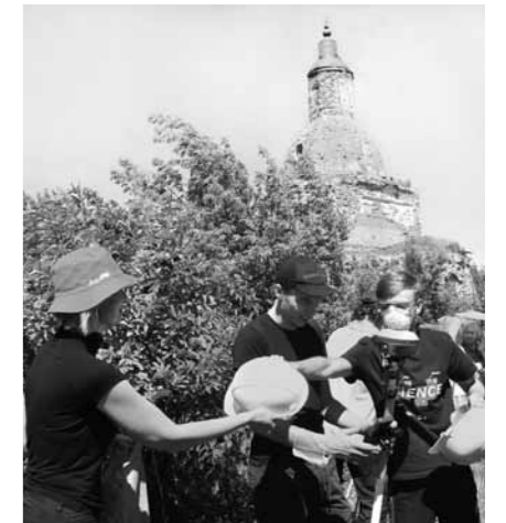
Первая экспедиция студентов – историков и архитекторов – к Успенскому храму в селе Калинино

– В своем Послании Федеральному Собранию Президент России Владимир Владимирович Путин сообщил о запуске долгосрочной программы сохранения объектов культурного наследия России, которая будет действовать 20 лет и предусматривает меры поддержки организаций, которые гото-