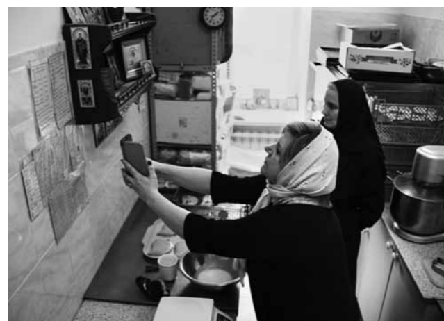
Рецепт сфотографирован – теперь точно не потеряется

В аквафабу добавить соль, взбить миксером на самой большой скорости 5 минут, добавить небольшими частями сахар, продолжая взбивать до образования жестких пиков, добавить лимонную кислоту и ванилин, взбивать еще 2 минуты. Вложить массу в кондитерский мешок или шприц, отсадить на застеленный пергаментом противень безе. Сушить в предварительно разогретой до 100–110 градусов духовке около полутора часов. Затем духовку отключить, и не открывая, оставить безе до полного остывания.