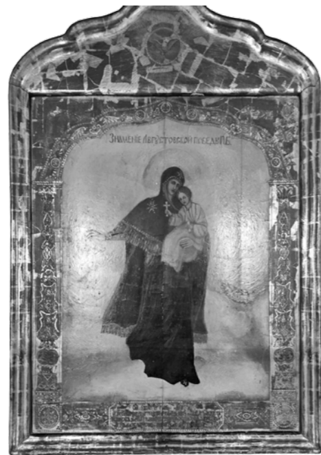
«Сия икона Покров Пресвятой Богородицы сооружена в 1904 году октября 1 дня...»

История написания иконы связана с Русско-японской войной, начавшейся 27 января 1904 года. В конце мая 1904 г. Высочайшим указом была объявлена вторая частичная мобилизация. 284-й Чембарский пехотный полк был укомплектован запасными из Пензенского, Чембарского, Саранского, Краснослободского, Нижнеломовского и Наровчатского уездов. Мобилизованный полк имел в своем составе 42 офицера, 2654 строевых и 300 нестроевых нижних чинов. Командиром полка был назначен бывший начальник штаба резервной бригады Генерального штаба пол-