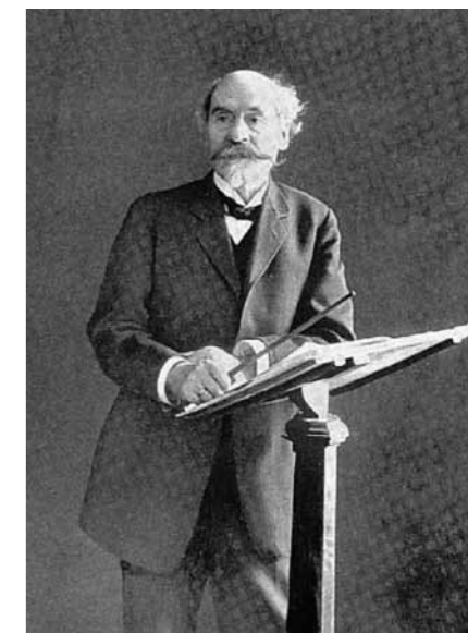
Композитор Александр Архангельский

Всех желающих ждут в Духовно-просветительском центре «Спас» при Спасском кафедральном соборе г. Пензы (пл. Советская, 3), начало в 15:00. Вход свободный.