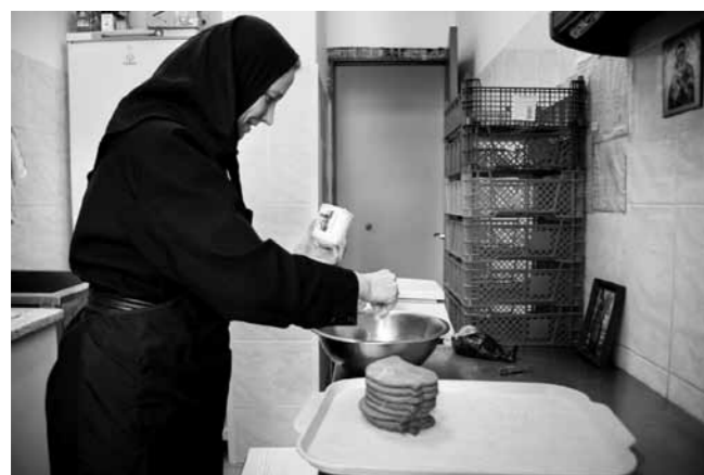
Пряники теперь нужно покрыть глазурью

– По рецепту положено глазировать. Просто у меня в запасе были розовый и желтый пищевые кра-