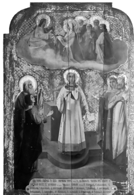
«О Всепетая Мати, сохрани и защити страдальцев наших мужей воинов на поле брани подвигающихся за родину...»

понеся большие потери. Принимал участие в сражении под Мукденом.