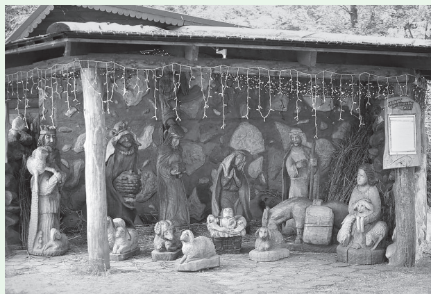
Тот самый вертеп, который можно увидеть не только в Рождество. Он находится в агротуристическом комплексе «Коробчицы» в 5 км от города Гродно (Беларуссия)

– Бабушка, ведь я же их знаю, это все мои друзья!