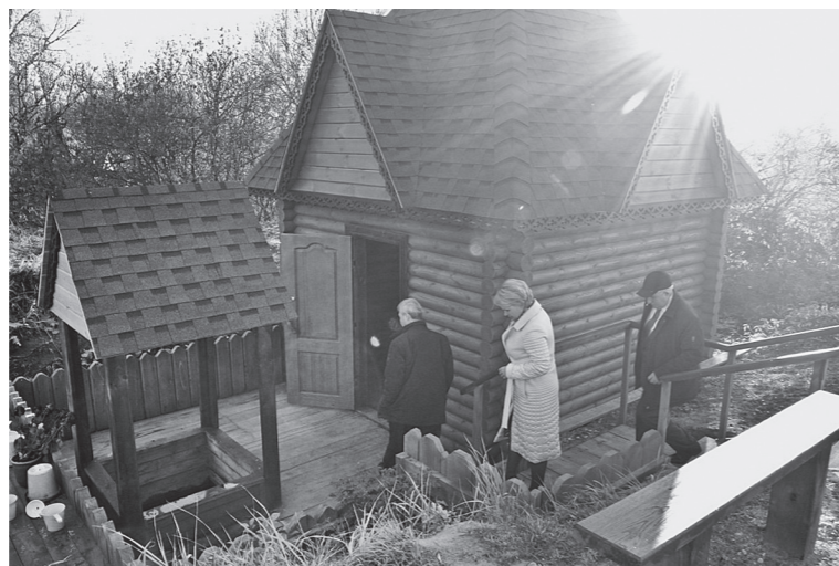
Представители районной администрации и сельсовета в восстановленной после пожара 2019 года купальни

СРЕДИ БЕСКРАЙНИХ ПОЛЕЙ, КОТОРЫЕ ЛЕТОМ НАПОЛНЯЮТСЯ АРОМАТАМИ ТРАВ И ЦВЕТОВ, ГУСТЫХ ХВОЙНЫХ ЛЕСОВ, НЕДАЛЕКО ОТ ДЕРЕВНИ МАЛАЯ КАВЕНДРА НАРОВЧАТСКОГО РАЙОНА НАХОДИТСЯ УДИВИТЕЛЬНАЯ СВЯТЫНЯ – ИСТОЧНИК СВЯТИТЕЛЯ НИКОЛАЯ ЧУДОТВОРЦА