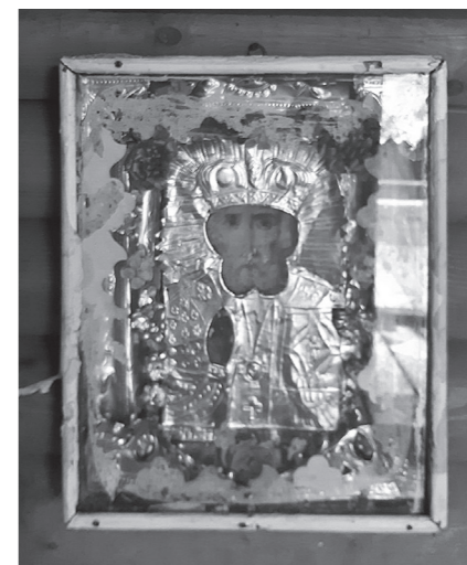
Старинная икона святителя Николая Чудотворца

Недалеко от основного источника есть еще один, с маленькой, почти разрушенной купелью.