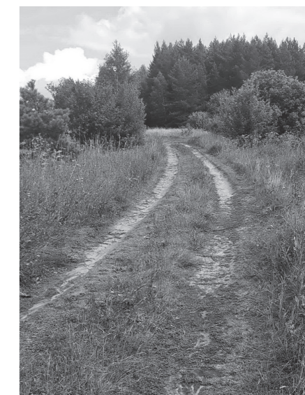
По дороге к святому источнику

Сурский край богат своими живоносными источниками. Одни появились сверхъестественным путем на месте чудесного явления икон Пресвятой Богородицы и угодников Божиих. Другие вытекали из-под алтаря и почитались как святыня храма. А третьи (и таких большинство), казавшиеся обычными родниками до поры до времени, вдруг начинали привлекать богомольцев. Возможно, кто-то, случайно окунувшись, исцелился от немощи, а кому-то было откровение свыше – зачастую ведь историю святого источника не-