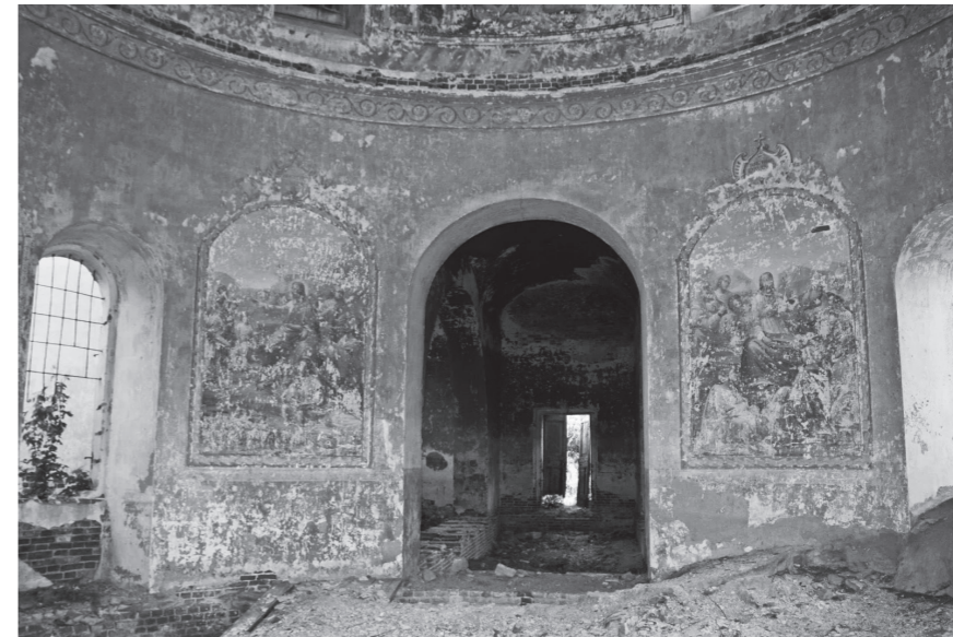
Стены старого храма еще хранят следы росписи дореволюционных художников

– Если даже не касаться духовной составляющей этого вопроса, то мы должны понимать, что храмы – это неотъемлемая часть нашей культуры, то, чем так дорожи-