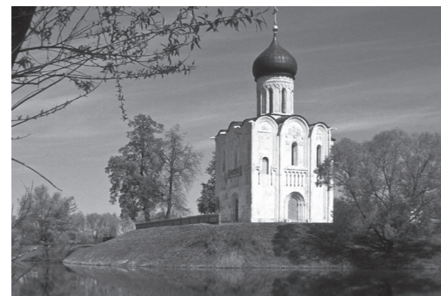
Некоторые сравнивают Никольскую церковь, стоящую в чистом поле, с храмом Покрова на Нерли во Владимирской области. Хочется верить, что новокутлянский храм вскоре станет таким же прекрасным

Надежда Чернышова