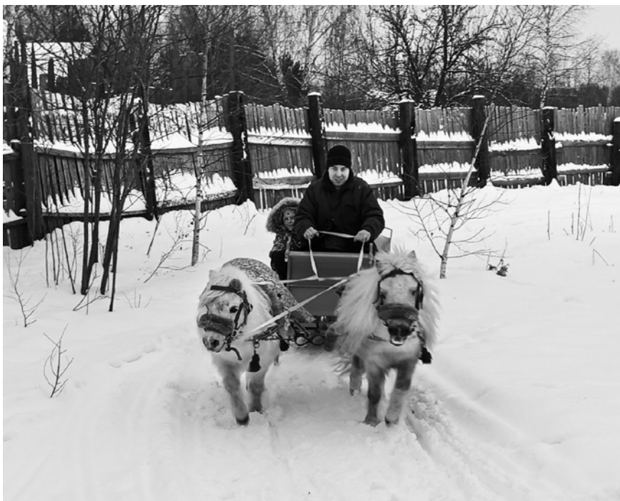
Гонки на пони

этим сама, лишь в свое отсутствие разрешая мужчинам обихаживать питомцев.