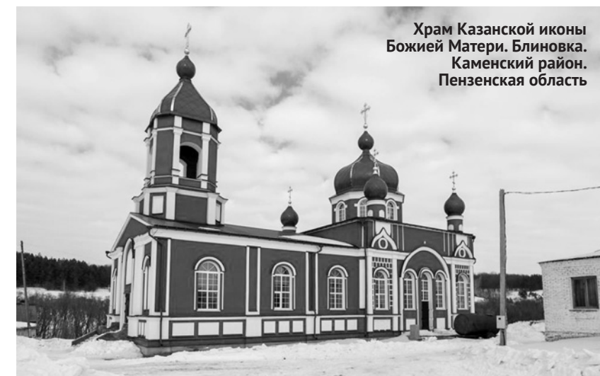
Храм Казанской иконы Божией Матери. Блиновка. Каменский район. Пензенская область

Поздравляем глубокоуважаемых юбиляров, желаем здоровья, долголетия и помощи Божией в дальнейшем служении Церкви Христовой!