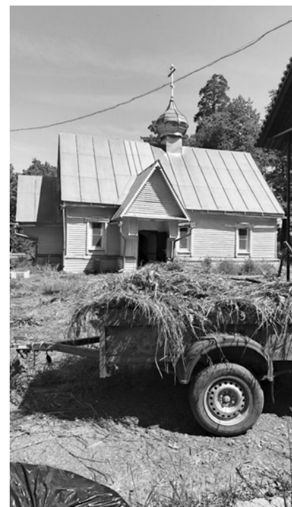
Готовь сено летом

Любовь к животным подвигла матушку поступить в Пензенский аграрный университет. Пре-